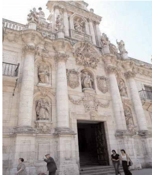
Fachada de la Facultad de Derecho, de la Universidad de Valladolid.

Esta subvención coincide con la resolución del Procurador del Común que insta a la Junta de Castilla y León a pagar un complemento a 3.000 docentes. Concretamente invita a la Consejería de Educación a que establezca los criterios necesarios para que estos profesores universitarios, que participaron en programas de Doctorado y en la dirección de tesis, perciban el complemento correspondiente. Esta cuantía debería haberse pagado a más de 3.000 docentes en el año 2004.