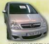
MERIVA 17 CDTI 100CV AÑO 2005 12.000 €