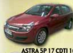
ASTRA 5P 17 CDTI 16V 100CV AÑO 2006 14600 €