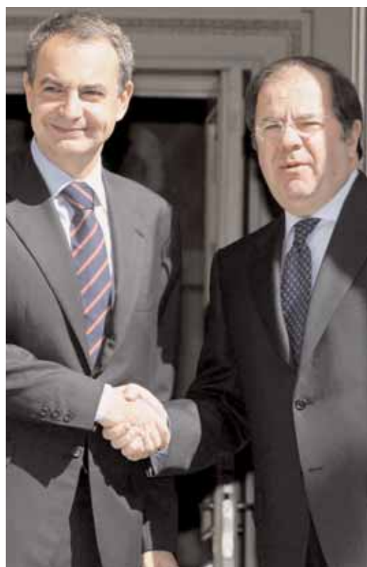
Rodríguez Zapatero y Juan Vicente Herrera posan antes de su reunión.

→ Fundación Atapuerca: Subvención de 60.101 euros a la Fundación Atapuerca, para actuaciones en materia de difusión y campañas divulgativas.