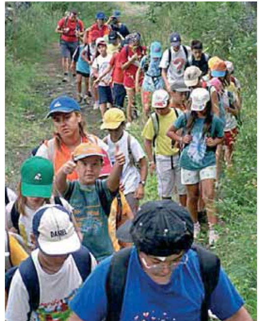
La marcha irá de Fuensaldaña a Villanubla y regresará al punto inicial.

Además, un día antes de esta marcha, el próximo sábado día 31 de mayo, se celebrarán unas conferencias en Fuensaldaña sobre primeros auxilios y la donación de órganos con el fin de sensibilizar sobre la necesidad de nuevos donantes para salvar vidas.