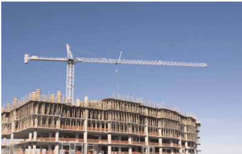
Aunque la mayoría de las viviendas adquiridas son de segunda mano, las de primera ocupación son las que más crecieron.

Frente al descenso global de ventas destaca el hecho de que