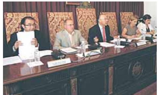
El pleno estará presidido por el ejecutivo de la institución provincial.