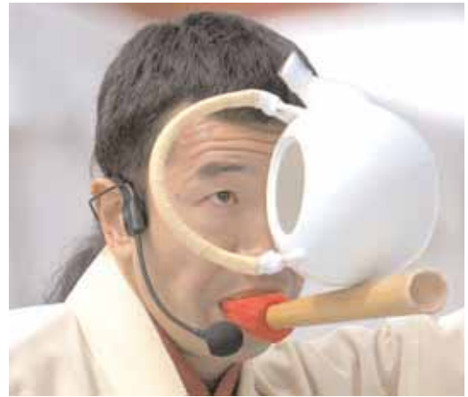
Actuaciones de lo más variado, llegadas de todos los puntos del planeta, se congregarán en diversos puntos de la ciudad a lo largo del fin de semana.