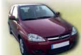
OPEL CORSA 13 CDTI 75CV AÑO 2.006. 8.500 €

CHEVROLET NUBIRA 1.68 CDX AÑO 2004 8000 €