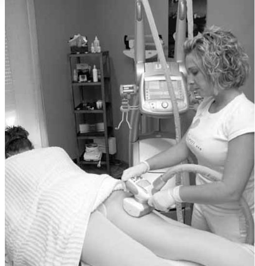
El Lipomassage es eficaz para los problemas de grasas localizadas.

Por último cambia de cara con efectos visibles de inmediato: Para apuradas, para temerosas del quirófano, para amantes de las soluciones menos drásticas.... Retoques como el botox, rellenos de ácido hialurónico, recuperación de volúmenes, tensar nuestra piel del rostro o lucir una piel espléndida son lo tuyo.