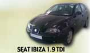
SEAT IBIZA 1.9 TDI AÑO 2004 8000 €