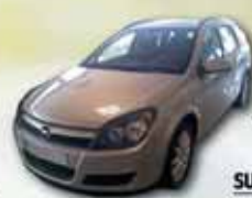
ASTRA CARAVAN 19 CDTI 120CV Año 2006. SUPER PRECIO: 12.400 €