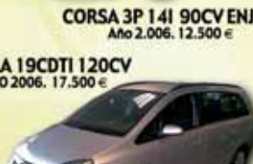
ZAFIRA 19 CDTI 120CV AÑO 2006. 17.500 €