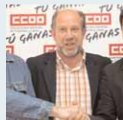
Firma entre todas las partes.

La Asociación Unificada de Guardias Civiles y el Sindicato Unificado de Policía firmaron un protocolo, amparado por CC.OO, con el que se pretenden colaborar mutuamente en la mejora de su situación, que en la provincia pasaría por un aumento de los efectivos de ambos cuerpos.