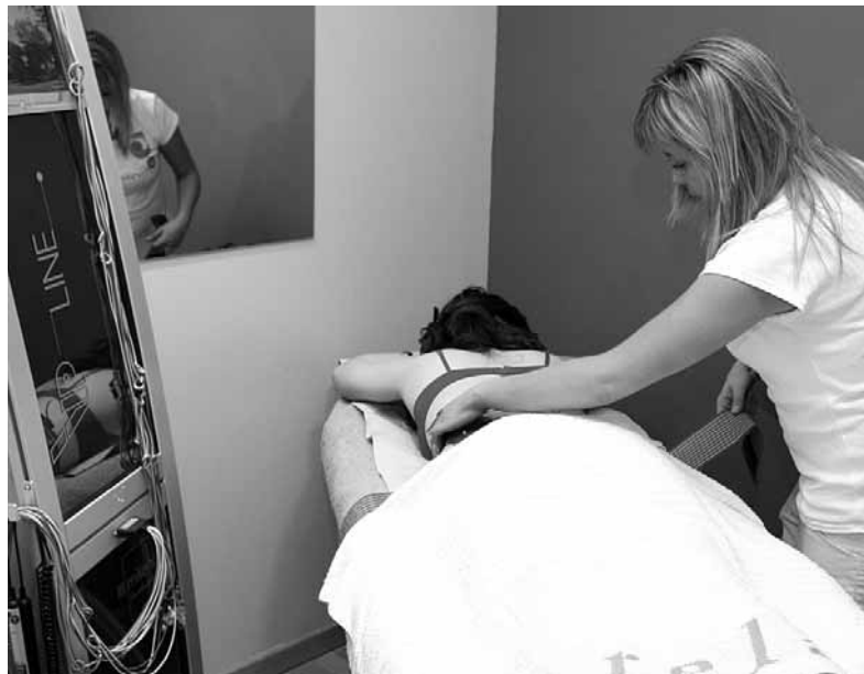
Con Vip Line es posible perder varias tallas en muy pocas sesiones.