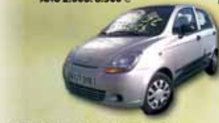
CHEVROLET MATIZ 1.0 65CV AÑO 2006 6000 €