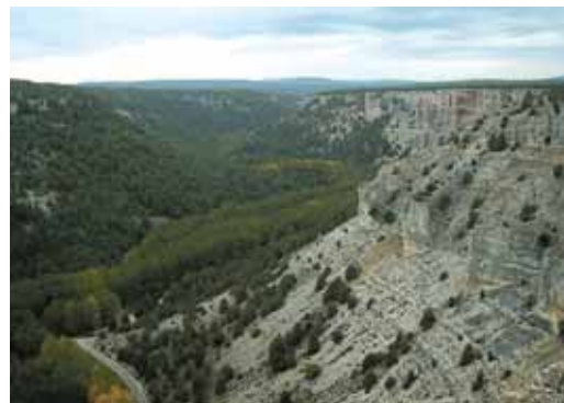
En el Cañón del Río Lobos será rehabilitada la Casa del Parque.

para inversiones en materia de infraestructura rural en diversos lugares de las provincias de Ávila, Burgos, Salamanca y Zamora con el objetivo de dotar de las infraestructuras necesarias a las explotaciones agrarias de la región, y contribuir a mejorar la comunicación entre los núcleos rurales afectados por las obras.