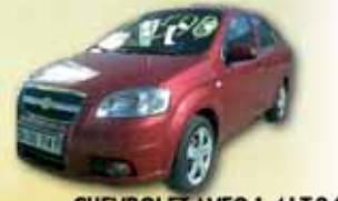
CHEVROLET AVEO 1.4 LT 94 CV AÑO 2007 10400 €