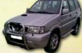
NISSAN TERRANO 3.0 TD 150CV 7 PLAZAS AÑO 2003 14000 €