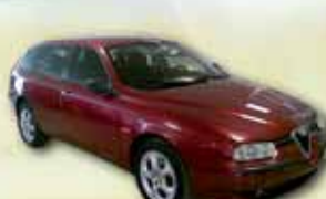
ALFA ROMEO 156 ATO 155 CV 96.000 KM. AÑO 2001. 6.500 €