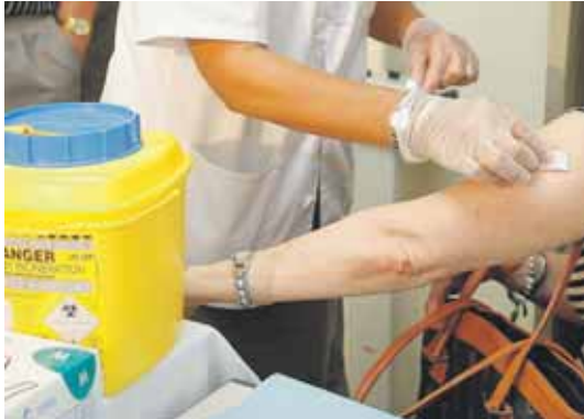
El 15 de octubre dará comienzo la campaña de vacunación.

La gripe se caracteriza por la fiebre alta, dolores musculares, dolor de cabeza y de garganta, nariz tapada y tos. Lo normal es que estos síntomas duren una semana, aunque la tos y el cansancio pueden acompañarnos durante quince días. Mientras dure la fiebre, lo mejor es quedarse en cama bien