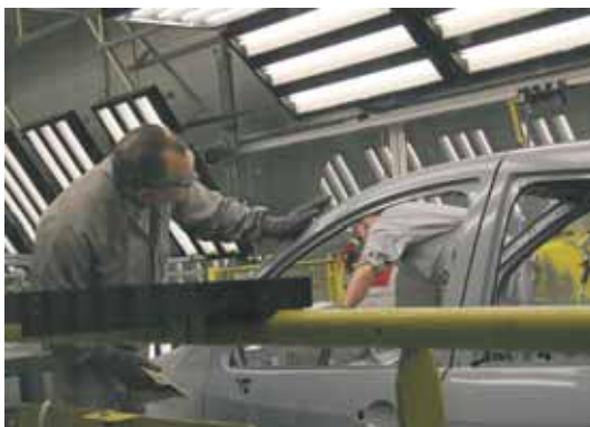
Un trabajador de la factoría de carrocería-montaje.

Los primeros en reaccionar han sido los sindicatos. Tanto UGT como CC.OO han afirmado que esta situación "es una tomadura de pelo". Ya que desde la compañía del rombo se había asegurado que Valladolid tendría preferencia en la fabricación de nuevos modelos. Ambos exigen una reunión "urgente" con Carlos Ghosn, quien precisó que hasta finales de 2009 no se tomará una decisión sobre la factoría de carrocería-montaje. CC.OO advirtió de que la planta se cerraría sin la adjudicación de un nuevo modelo, ya que actualmente se encuentra por debajo del