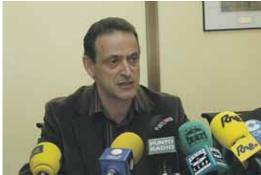
Cecilio Vadillo ofreció los datos en una rueda de prensa.

Cecilio Vadillo, subdelegado del Gobierno, quiso salir al paso y responder a estas acusaciones. «Ya ha comenzado un proceso administrativo para su construcción y no se puede detener». En este sentido, insistió en que ya se ha licitado la redacción del proyecto en el tramo entre Quintanilla de Onésimo y Tudela de Duero. De momento, la