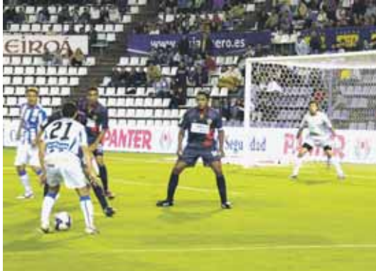
El Valladolid buscará sumar su tercera victoria en Zorrilla.

Aunque está claro que el Valencia no se lo pondrá nada fácil. El equipo levantino, después de su nefasta pasada campaña, ha renacido de sus cenizas y de la mano de Unai Emery (ex del Almería) ha logrado recuperar el estado de forma de otros años. Hasta el momento, ha ganado cuatro partidos y sólo ha cedido un empate ante el Almería.