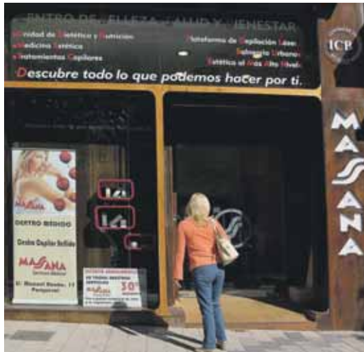
Entrada a la nueva clínica Massana ubicada en el barrio de Parquesol.

También se aplica el verdadero jabón negro de Argan en un masaje sobre la piel antes de entrar en el hamman de cielo estrellado donde el cliente será recibido