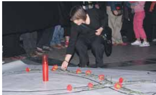
Una mujer deposita un ramo de flores en el lugar del homenaje.