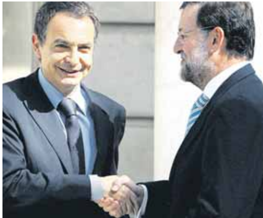
José Luis Rodríguez Zapatero y Mariano Rajoy en Moncloa.

La invitación de Zapatero, presidente del Gobierno, a Rajoy, líder del PP, con reconveniones y reproches mutuos desembocó en la disposición de ambos para que los respectivos equipos económicos de sus grupos fijen la cita inmediatamente, reunión en la que intercambiarán opiniones y diagnósticos sobre la enorme crisis que afecta al sistema financiero mundial, y sobre propuestas de unos y otros, al menos para amortiguar las incalculables consecuencias de aquélla. Al fin llegaron al convencimiento de que, si el excesivo optimismo no puede coordinar los análisis, el catastrofismo opositor es uno de los grandes disparates para presidir las gestiones gubernamentales en instantes tan atribulados. Aunque todavía no han consensuado la agenda de las reuniones acordadas, los rifirrafes