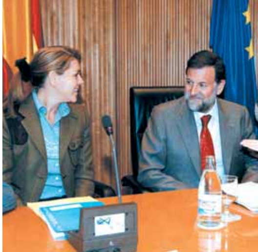
Mariano Rajoy junto a María Dolores de Cospedal.