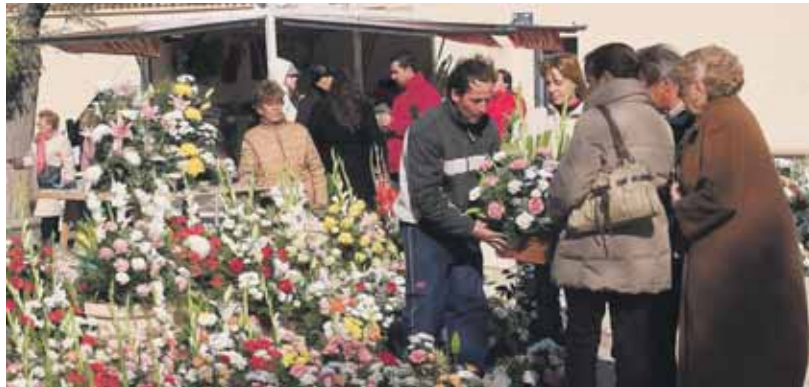
Varias personas se acercan a un puesto de flores para comprar un centro.

El primer desembolso puede rondar los 100 euros. Un gasto mínimo si lo comparamos con la compra del ataúd. El precio final dependerá de la calidad de los materiales empleados, el acabado o la apariencia externa. El féretro tiene en Valladolid un precio medio de 717 euros, en este caso