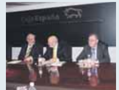
Reunión de las Cajas de Cyl.

Sin plazos para el estudio pero "con diligencia"