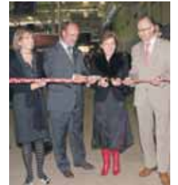
Momento de la inauguración.