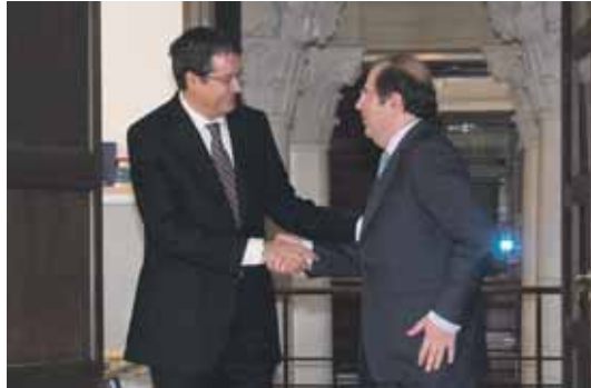
Herrera y López están llevando a cabo el proceso con total discreción.

A mediodía le tocaba el turno a los presidentes de las Cajas y sus equipos directivos. En esta reunión se les ha sugerido que designen a tres expertos de cada entidad para