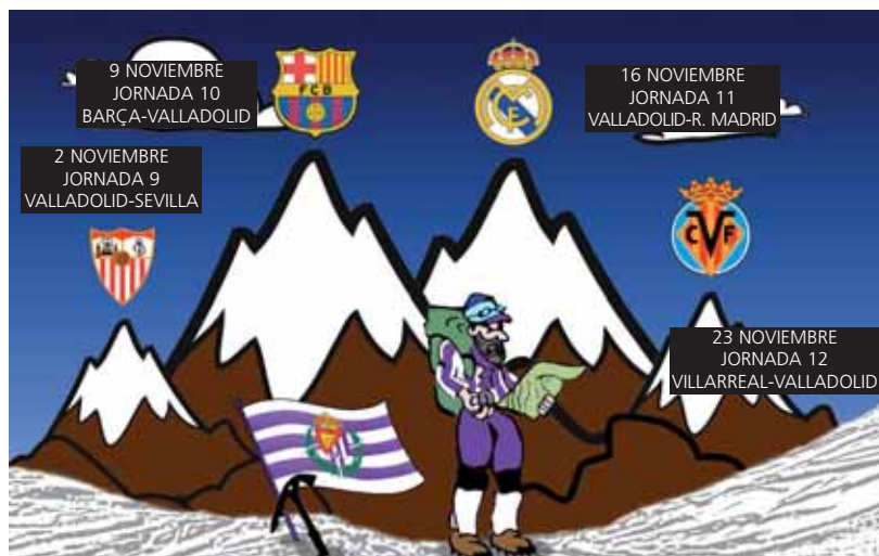
El Real Valladolid se enfrenta a cuatro duros encuentros durante el mes de noviembre.