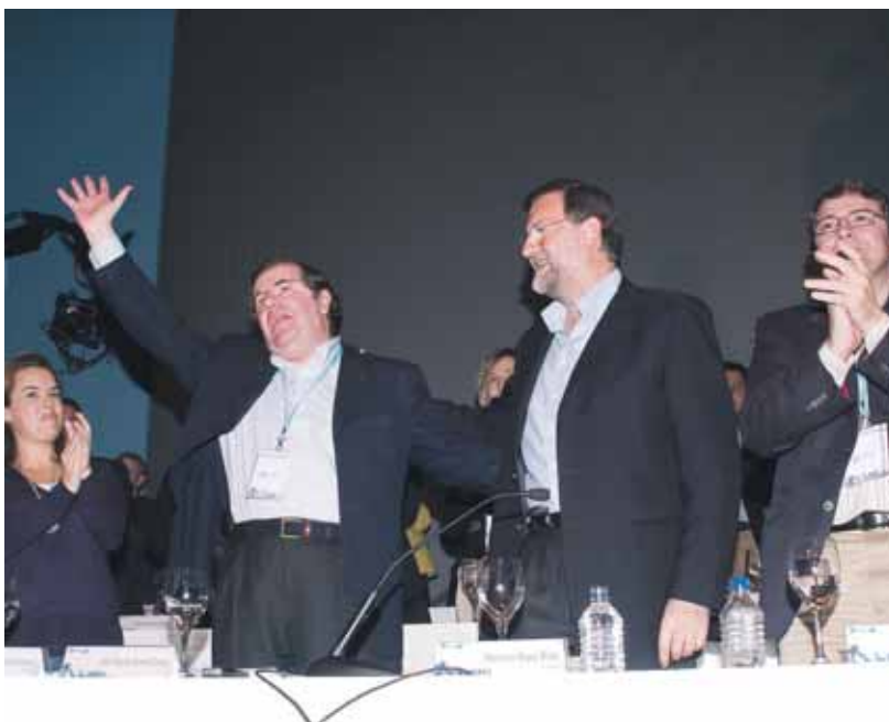
Juan Vicente Herrera Campo saluda a los asistentes tras ser proclamado presidente del PP de Castilla y León.

En un Congreso en el que parecía que estaba todo decidido, la sorpresa llegó cuando Herrera desgranó los nombres de quienes se va a rodear en su periplo de otros cuatro años. Ha reforzado la estructura organizativa del partido con