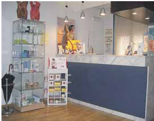
Leform realizará una jornada de puertas abiertas el 4 y 5 de noviembre.

El precio de todo esto es simbólico ya que sólo son 10 euros por asesoramiento y prueba o masaje. Todo bajo petición de hora en el teléfono: 983 33 02 80