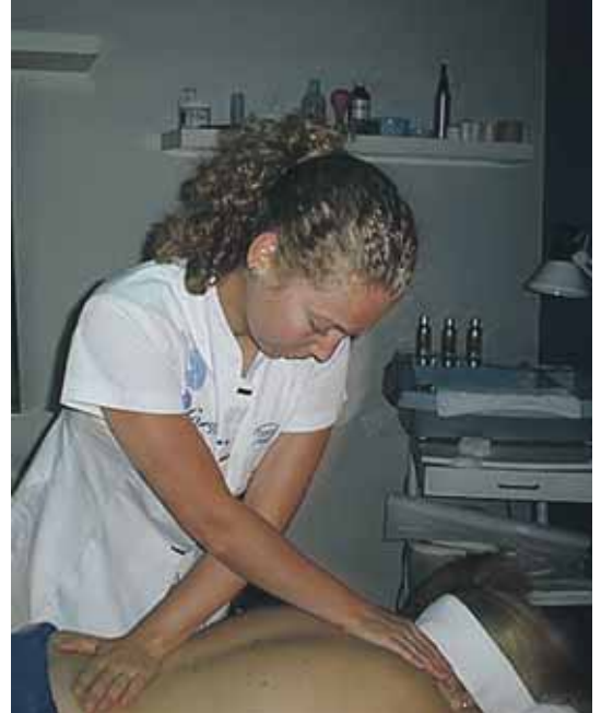
Una masajista durante una sesión en la Clínica Leform.