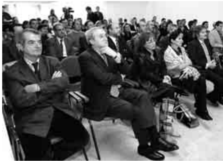
Presentación del proyecto 'I3 com' en la sala FEC el jueves 30.