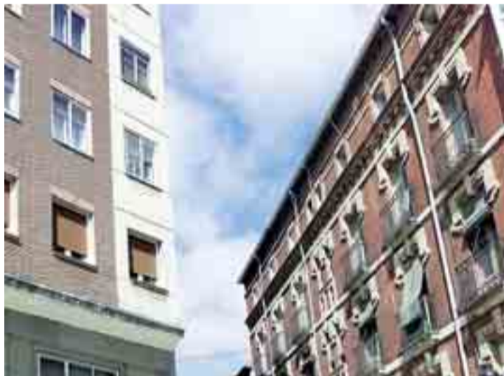
El Impuesto de Bienes Muebles (IBI) será congelado en 2009.

El Ayuntamiento abordará la crisis económica y la disminución de recursos vía impuestos a través de un mayor endeudamiento, que ha sido cuantificado en 3,5 millones de euros para los próximos tres años, lo que incrementará la deuda municipal de los 125 millones actuales a 128 millones. Ade-