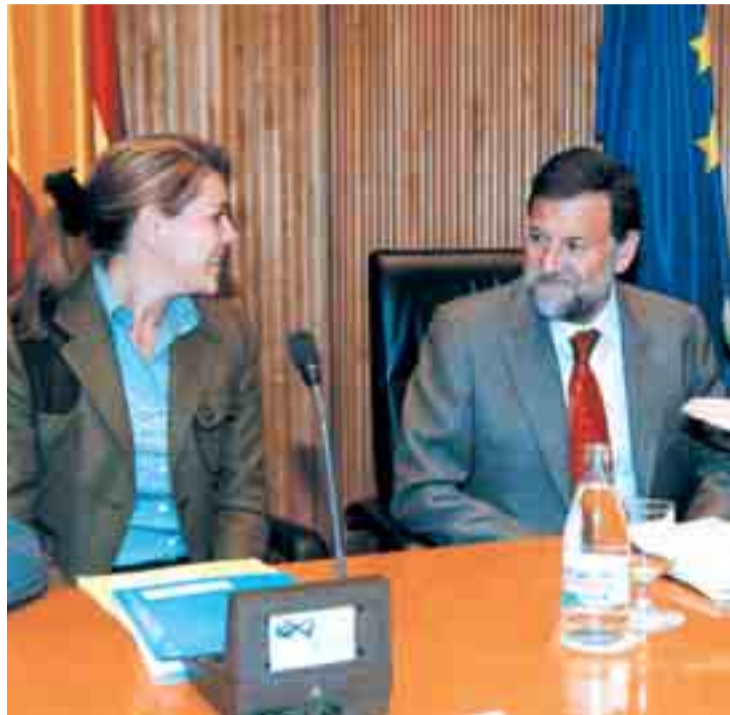
Mariano Rajoy junto a María Dolores de Cospedal.