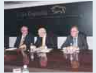
Reunión de las Cajas de Cyl.

Sin plazos para el estudio pero "con diligencia"