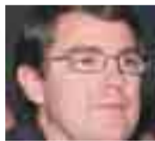
Alfonso Fdez. Mañueco