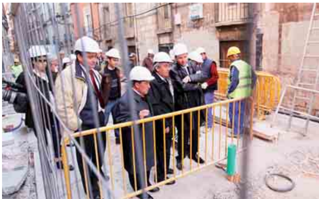
El alcalde visitó el día 27 las obras de urbanización de la céntrica calle por la que discurre el Camino de Santiago.