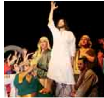
Imagen de uno de los momentos de 'El Reino es de Ellos'.

roquial de San Juan Evangelista, "su característica fundamental es que es un musical de la familia, hecho por familias y para familias".