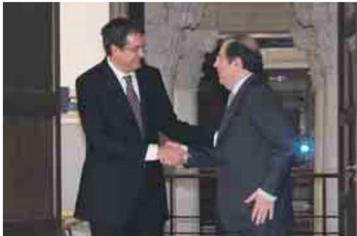
Herrera y López están llevando a cabo el proceso con total discreción.

A mediodía le tocaba el turno a los presidentes de las Cajas y sus equipos directivos. En esta reunión se les ha sugerido que designen a tres expertos de cada entidad para