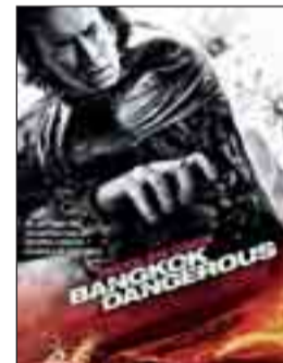
✓ BANGKOK DANGEROUS. Dir. Oxide Pang y Danny Pang. Int. Nicolas Cage, Charlie Young, Shahkrit Yamnarm. Acción.