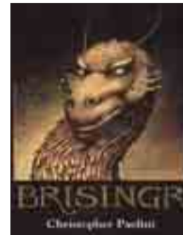
BRISINGR Christopher Paolini. Novela.