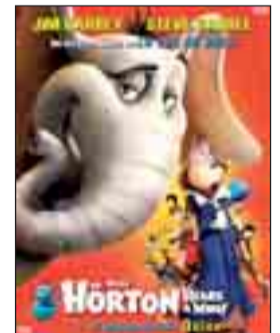
✓ HORTON. Dir. Jimmy Hayward y Steve Martino. Int. Jim Carrey, Steve Carell, Carol Burnett. Comedia.