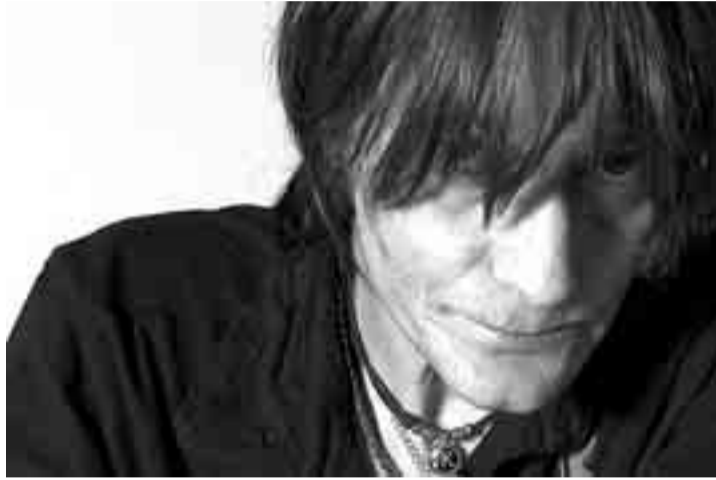
Antonio Vega actuará el 7 de noviembre con 'A solas con Antonio'.

El criterio que se ha llevado a cabo para elegir y seleccionar los es-