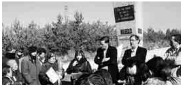
Miembros del PSOE, familiares y amigos, en el homenaje de 2007.

También en La Pedraja se celebrará un acto de similares características en recuerdo a las víctimas de la represión. Los homenajes concluirán con un acto conjunto en el cementerio municipal de