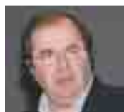
Juan Vicente Herrera Campo