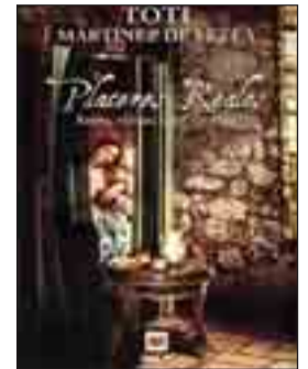
PLACERES REALES. Reyes, reinas, sexo y cocina. Toti Martínez de Leza.