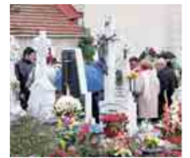
Los burgaleses recuerdan este fin de semana a sus seres queridos.