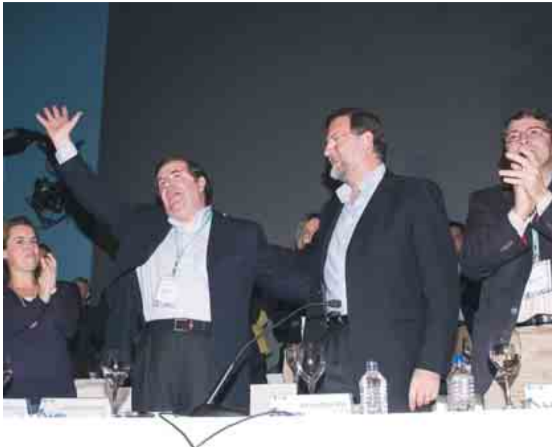
Juan Vicente Herrera Campo saluda a los asistentes tras ser proclamado presidente del PP de Castilla y León.

En un Congreso en el que parecía que estaba todo decidido, la sorpresa llegó cuando Herrera designó los nombres de quienes se va a rodear en su periplo de otros cuatro años. Ha reforzado la estructura organizativa del partido con