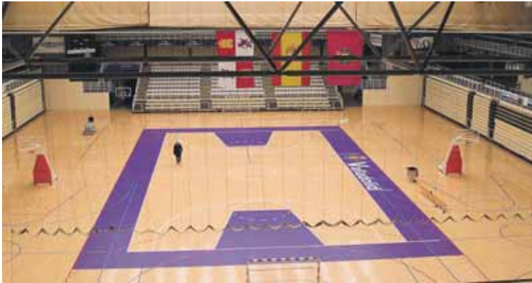
Vista panorámica del polideportivo Pisuerga.

POLIDEPORTIVO EL BALONCESTO INVITA A LOS AFICIONADOS DEL BALONMANO