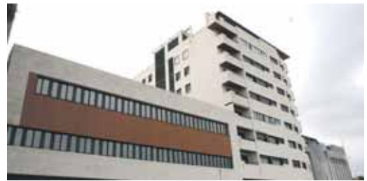
El edificio de Juan de Austria donde se encuentran las ocho oficinas.

El TSJCYL anuló la licencia en octubre de 2002 y ordenó el derribo de ocho viviendas de la Parcela II y de la rampa de garaje, tras lo que el pleno del consistorio aprobó una Modificación del Estudio de Detalle en terrenos del PERI Juan de Austria el 14 de septiembre de 2004. Los vecinos volvieron a denunciarlo y la anulación de las sentencias y del acuerdo de Pleno que aprobó el Estudio de Detalle dejan claro que