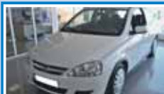
CORSA 13 CDI Año: 2006 Precio: 9.000 € ( 1.497.474 ptas) TLF: 983 34 12 22 - VEPISA