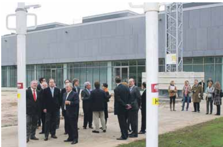
Juan Vicente Herrera, ante el recién inaugurado Centro de la Construcción, ubicado en Burgos.