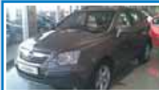
OPEL ANTAR 19CDTI 150CV AUT Año: 2007 Precio: 32.100 € ( 5.340.991 ptas) TLF: 983 34 12 22 - VEPISA