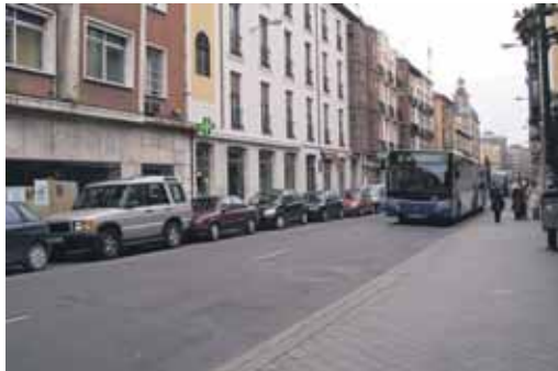
El lunes 10 comenzarán las obras en esta céntrica calle.

Las obras, que comenzarán el lunes 10 de noviembre conllevarán la renovación completa de la pavimentación de las aceras (con baldosas de terrazo), del firme de la calzada y de las redes de saneamiento, agua potable y alumbrado público (con la instalación de