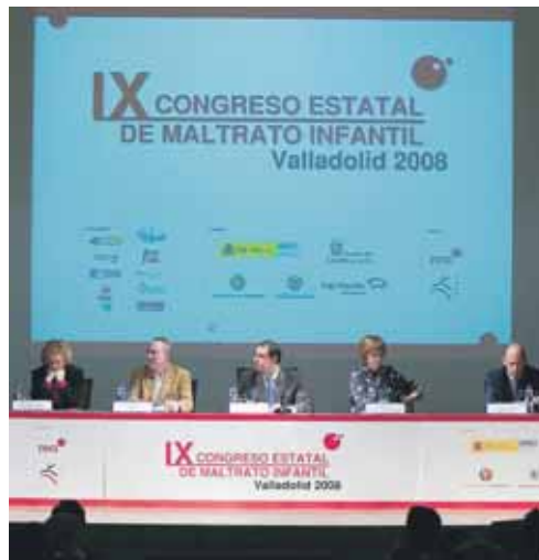
Momento de la jornada inaugural en el Palacio Conde Ansuérez.