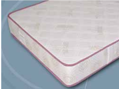
Los colchones viscoelásticos aseguran un mayor descanso.

Las diferencias de estos colchones respecto del resto, es que tienen una mayor superficie de contacto del cuerpo con el colchón, no ofrece ninguna presión por parte del colchón visco, tiene menos proliferación de ácaros