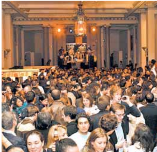
Fiesta en el Círculo de Bellas Artes para celebrar el triunfo de Obama

Cambio y esperanza son las dos palabras que definen la reacción de la clase política española tras la clara victoria de Barack Obama en las elecciones presidenciales de Estados Unidos. Tras años de desencuentros entre el presidente del Gobierno español, José Luis Rodríguez Zapatero, y George Bush, ya presidente en funciones de EEUU, la esperanza del Gobierno español es que el cambio de Obama traiga un giro total en las relaciones entre ambas administraciones, vitales para potenciar el papel de España en los foros internacionales. De ahí que Zapatero se haya apresurado a ofrecerse como un "amigo y fiel aliado" y a señalar que su victoria "abre una nueva era" en las relaciones internacionales y que España "está y estará ahí", en una clara alusión a la esperanza de