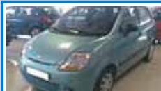
CHEVROLET MATIZ 1.0 65CV 2.0 Año: 2007 Precio: 7.500 € ( 1.247.895 ptas) TLF: 983 34 12 22 - VEPISA