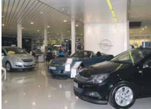
Los concesionarios están sufriendo un acusado descenso de las ventas.

Este comportamiento negativo en la provincia se debe especialmente a la venta de todoterrenos, que registran durante este año una caída del 31% (de 792 ventas se ha pasado a 544). A la hora de elegir el tipo de combustible no hay apenas diferencias. Los vallisoletanos no hacen distinción entre diesel y gasolina. En el periodo de tiempo que transcurre entre enero y octubre, la venta de 'gasolinas' ha descendido un 24%, mientras que la de diesel lo ha hecho en un 22%. Las ventas de vehículos industriales también descienden y lo hacen en un porcentaje superior: 55% en la provincia.