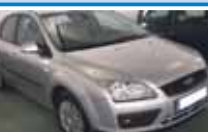
NEW FORD FOCUS TREND TDCI 90 CV PROCEDENTE DE DIRECCIÓN Precio: 13.700 € ( 2.279.488 ptas ) TLF: 983 33 22 22 - AUTONIETO FORD