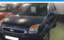
FUSION URBAN 4 TDCI 90 CV Año: 2008 - KMS: 1.942 Precio: 14.300 € ( 2.379.320 ptas) TLF: 983 33 22 22 - AUTONIETO FORD

VILLA DEL PRADO Piso de 3 dormitorios garage y trastero Cocina amueblada 550 /mes comunidad incluida Ceigrup. Tel. 983218980