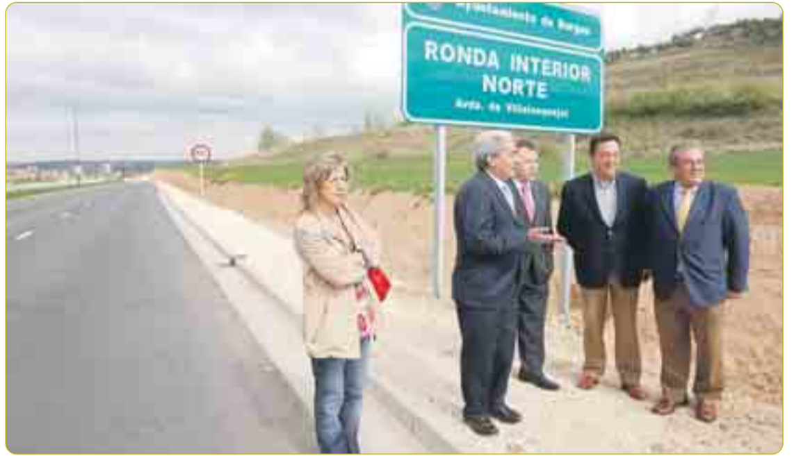
INAUGURACIÓN RONDA INTERIOR NORTE El 28 de abril quedaron abiertos al tráfico los últimos 2,2 kilómetros de la Ronda Interior Norte, que conecta los dos polígonos industriales de la ciudad. La avenida Valentín Niño supone dar continuidad, durante 11 kilómetros, a la avenida Príncipes de Asturias, en Villimar, S-3 y G-3, y a la circunvalación del cementerio a través de la barriada Yagüe, hasta alcanzar Villalonquéjar. El coste de la construcción del nuevo tramo ascendió a 3,3 millones de euros.