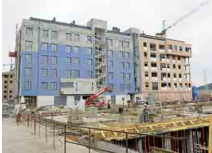
El nuevo Plan Estatal de Vivienda cuenta con 10.188 millones de euros.

Según datos de la Encuesta EDAD 2008, el 8,5 por ciento de la población española tiene algún tipo de discapacidad, lo