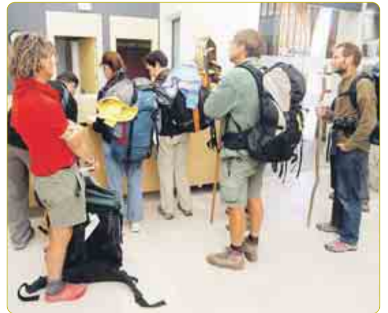
PRIMEROS PEREGRINOS EN EL NUEVO ALBERGUE DE FERNÁN GONZÁLEZ. En los primeros días de agosto, el nuevo albergue de peregrinos de Burgos, en la calle Fernán González, recibió a los nuevos huéspedes. La nueva instalación ha jubilado el antiguo albergue del Parral, que llevaba funcionando desde 1993. Las nuevas instalaciones han supuesto una inversión de 3,6 millones y cuenta con un centenar de plazas, una vivienda para el hospitalero y un lugar de reunión y encuentro.