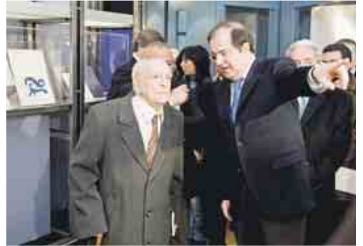
Crémer con Herrera en la exposición del poeta en el Palacio de la Isla. do sobre "su compromiso con Burgos" y su experiencia vital.

Victoriano Crémer estuvo acompañado por el presidente de la Junta, Juan Vicente Herrera, durante el acto de inauguración, que tuvo lugar el viernes 26. Un locuaz Crémer presentó a los invitados los poemas y garabatos expuestos en La Isla, al tiempo que caminaba entre sus creaciones disertan-