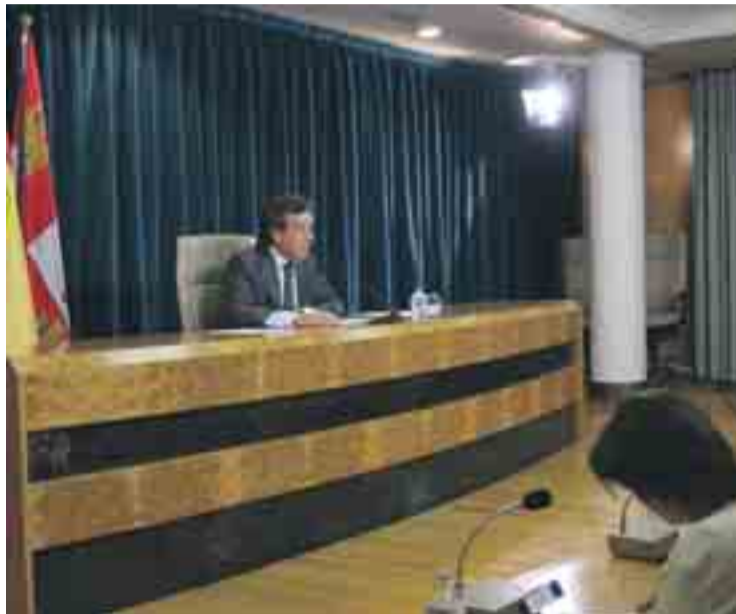
De Santiago-Juárez, en una rueda de prensa tras el Consejo de Gobierno.

La memoria económica que acompaña a la Ley Orgánica 2/2006, de Educación, de 3 de mayo, prevé que a lo largo de su período de implantación las comunidades autónomas dispondrán de asignaciones específicas para el apoyo a las actua-