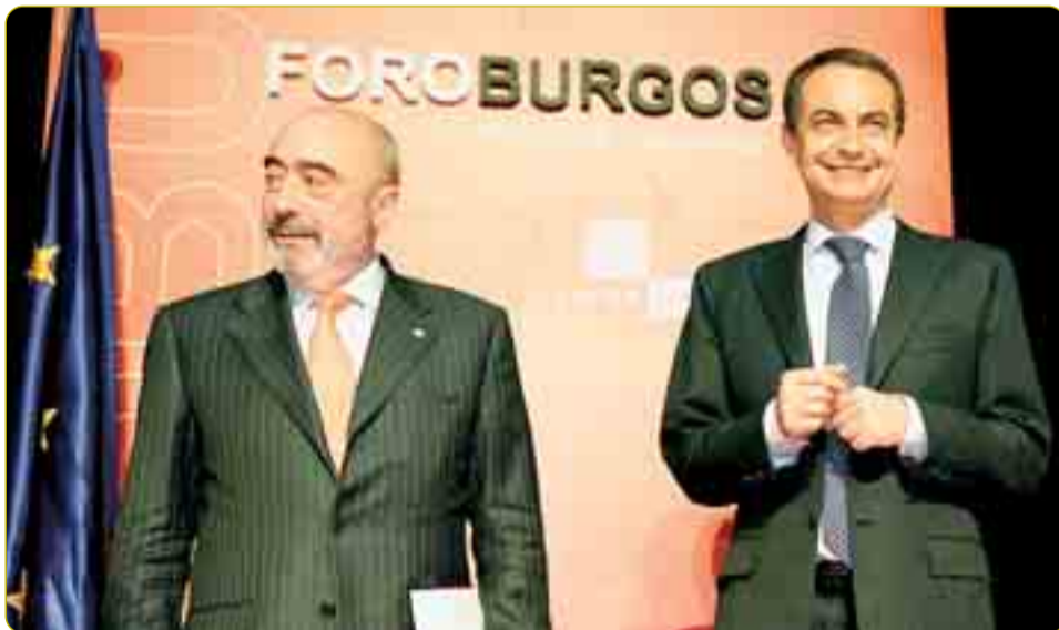
ZAPATERO EN FORO BURGOS. El presidente del Gobierno, José Luis Rodríguez Zapatero, estuvo en ForoBurgos Economía y Empresa de Caja de Burgos, donde trasladó a la clase empresarial "un mensaje de confianza sobre el presente y el futuro de la economía española". El Foro de Economía también contó con la presencia del ex presidente del Fondo Monetario, Rodrigo Rato.