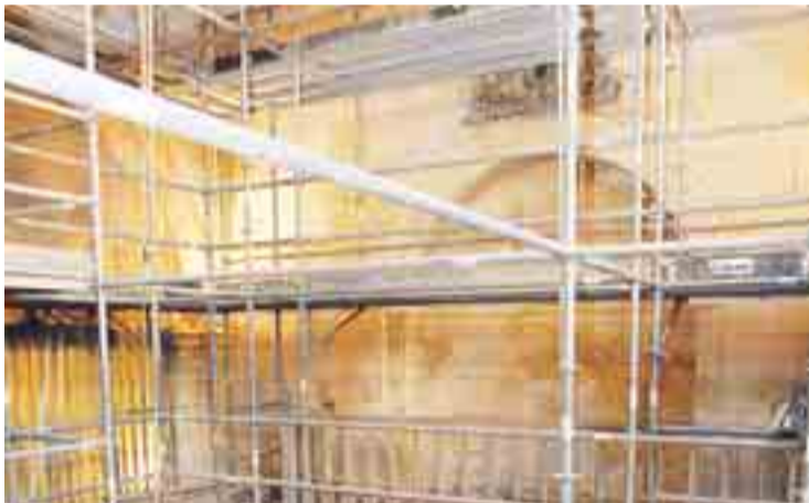
La rehabilitación estará terminada a finales del próximo año.