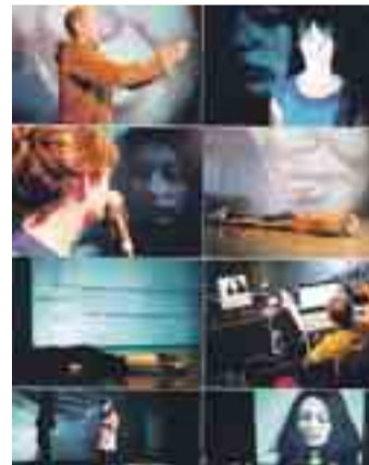
'Escena Abierta' ofrecerá en su X edición 14 representaciones.

El programa incluye siete compañías y catorce representaciones; dará comienzo el viernes 9 de enero y concluirá el domingo 18 del mismo mes. Las obras se representarán en cinco escenarios diferentes. Junto al teatro y la danza, se incluirá la presentación de un proyecto creativo itinerante llamado 'Menage Á', y después de Burgos, viajará a otros siete festivales españoles. De esta forma, 'Escena Abierta' se convierte en uno de los festi-