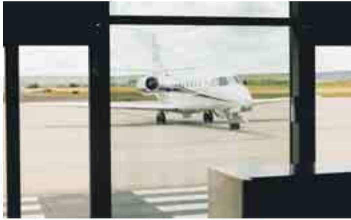
Air Nostrum opera desde Burgos a Barcelona, París y en verano Mallorca.

Las jornadas tratarán todos los posibles ámbitos de actuación y usos de un aeropuerto: transporte comercial de viajeros, desplazamientos sanitarios, extinción aérea de incendios, aviación deportiva, turismo, transporte de