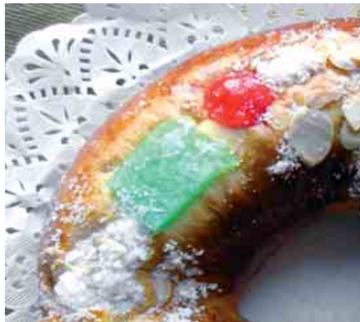
El roscón de Reyes depara a los comensales varias sorpresas.

Ya en el siglo III, en el interior del dulce se introducía una haba seca y el afortunado al que le tocaba era nombrado 'rey de reyes' durante un tiempo.