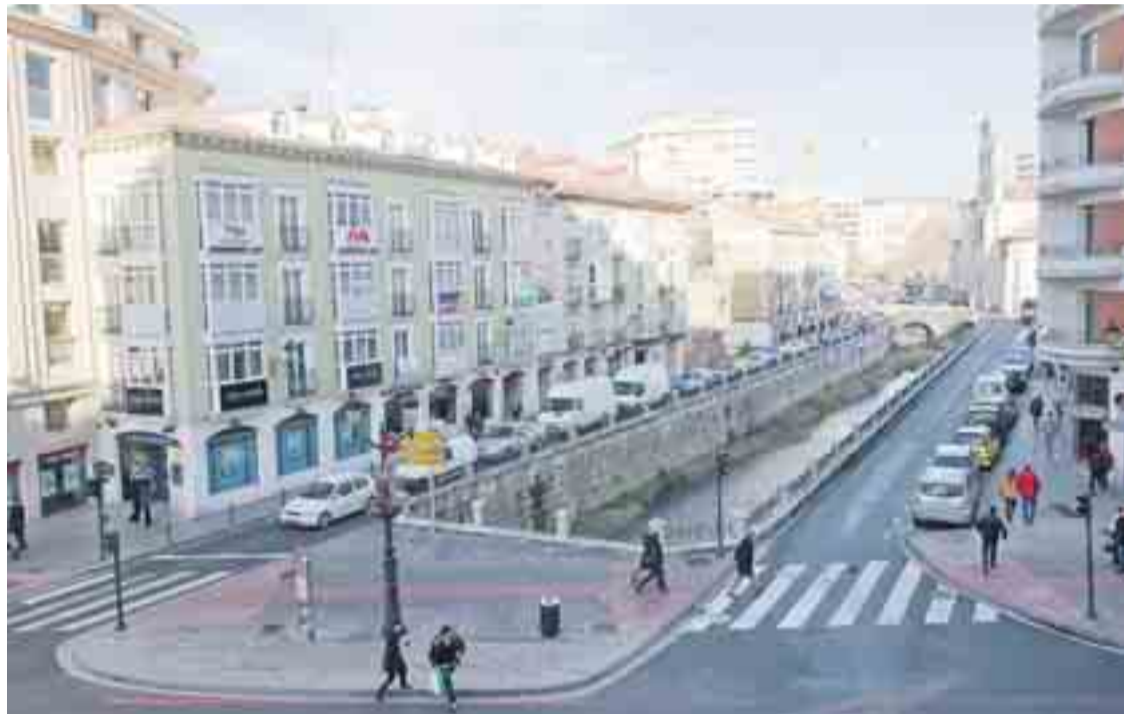
Hasta el fin de las obras de acondicionamiento de los dos carriles, no se cortará el tráfico en la margen derecha.