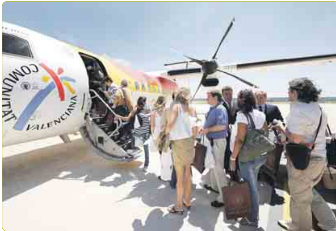
EL AEROPUERTO RECIBE LOS PRIMEROS VUELOS. El nuevo aeropuerto de Burgos-Villafraía empezó a ser operativo el día 3 de julio, pero no fue hasta el 10 cuando recibió su primer vuelo comercial procedente de Mallorca y operado por la compañía Air Nostrum. Desde Villafraía se puede volar a Barcelona y París durante todo el año y a Baleares, en periodo estival. El Ayuntamiento también ha iniciado una campaña de promoción del aeropuerto.