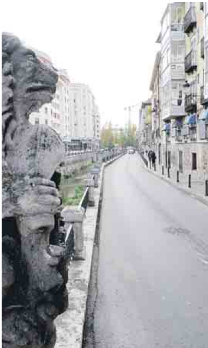
El tráfico no se cortará hasta que la margen izquierda esté acondicionada.

La Puebla y Condestable Otra de las vías enmarcada en el II Plan de Peatonalización es la calle La Puebla, donde "se igualarán pavimentos, dotándole de ma-