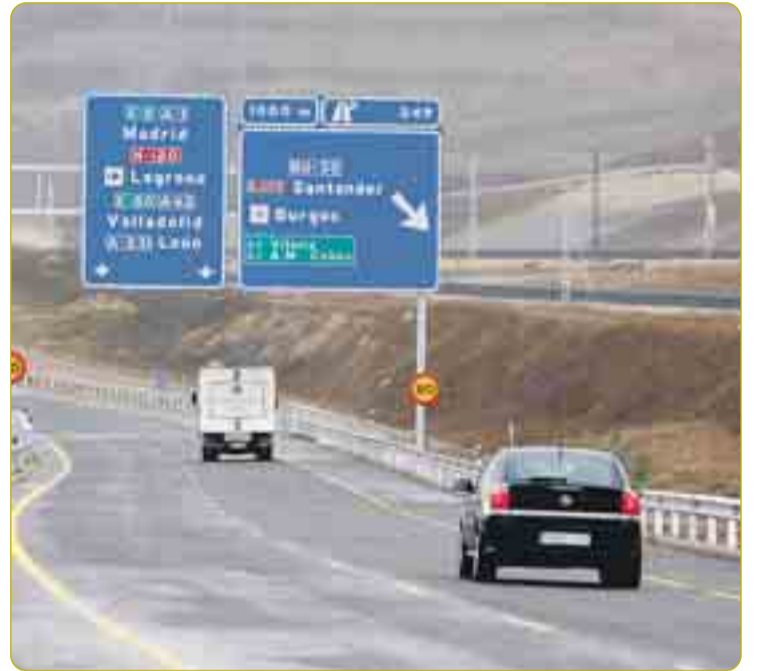
LA RONDA NORTE RECIBE LOS PRIMEROS COCHES. El jueves 28 de febrero, el Ministerio de Fomento abrió al tráfico el primer tramo de la ronda Norte de Burgos, el comprendido entre Rubena y Villafria. Después de casi tres años de retraso y de diversas dificultades en el proyecto, entraban en servicio los primeros 7,8 kilómetros de la circunvalación septentrional. La inversión ascendió a 36,6 millones.