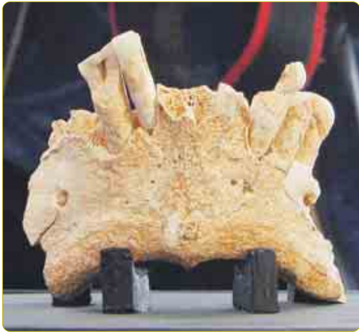
EL PRIMER EUROPEO DE LA HISTORIA VIVIÓ EN ATAPUERCA. Los codirectores de las excavaciones presentaron el 27 de marzo uno de los hallazgos más importantes encontrados en Atapuerca: una mandíbula de 1,2 millones de años, lo que supone la existencia en Burgos del primer europeo.