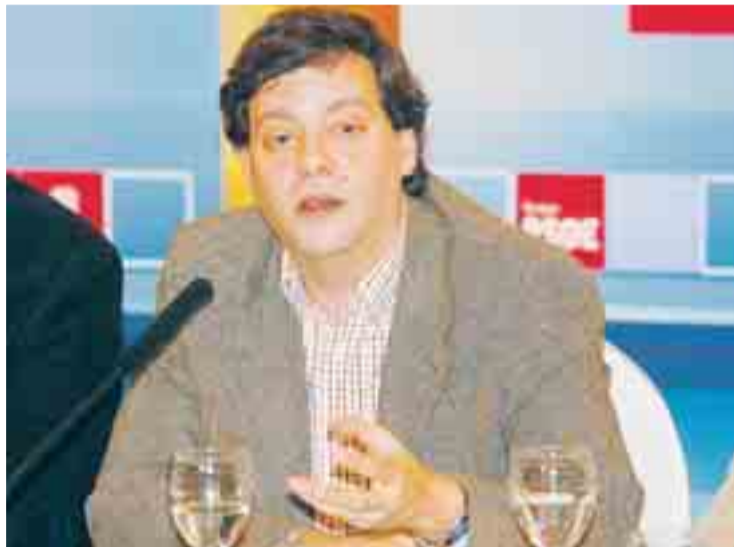
Presentación del balance anual del PSOE, en el hotel Puerta de Burgos.

para 2009, los responsables socialistas en la provincia destacaron la ejecución de la alta velocidad en el tramo Valladolid-Burgos, la construcción de las autovías Burgos-Logroño