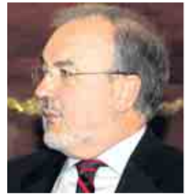
Pedro Solbes, vicepresidente económico del Gobierno.

Con esta pretensión de aumentar la autonomía financiera de las regiones, el Gobierno prevé un incremento en la cesión de impuestos. Así, la cesión de IRPF e IVA alcanzaría el 50%, mientras que en el caso de los impuestos especiales se situaría en el 58%.