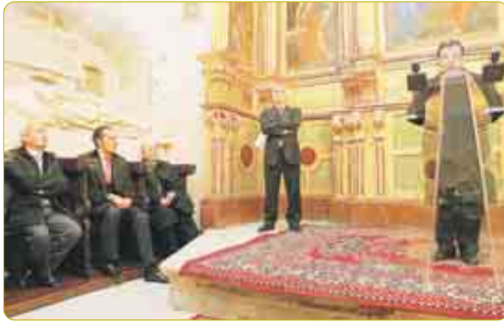
EL DUQUE DE LUGO, EN LA CATEDRAL. El Duque de Lugo y presidente de la Fundación Axa, Jaime de Marichalar, se acercó el día 24 de enero a Burgos con motivo de la inauguración de los trabajos de reforma de la Capilla de la Visitación de la Catedral. Además de la limpieza general de la piedra, se arreglaron y consolidaron pavimentos, vidrieras, sillares, rejas y policromía.