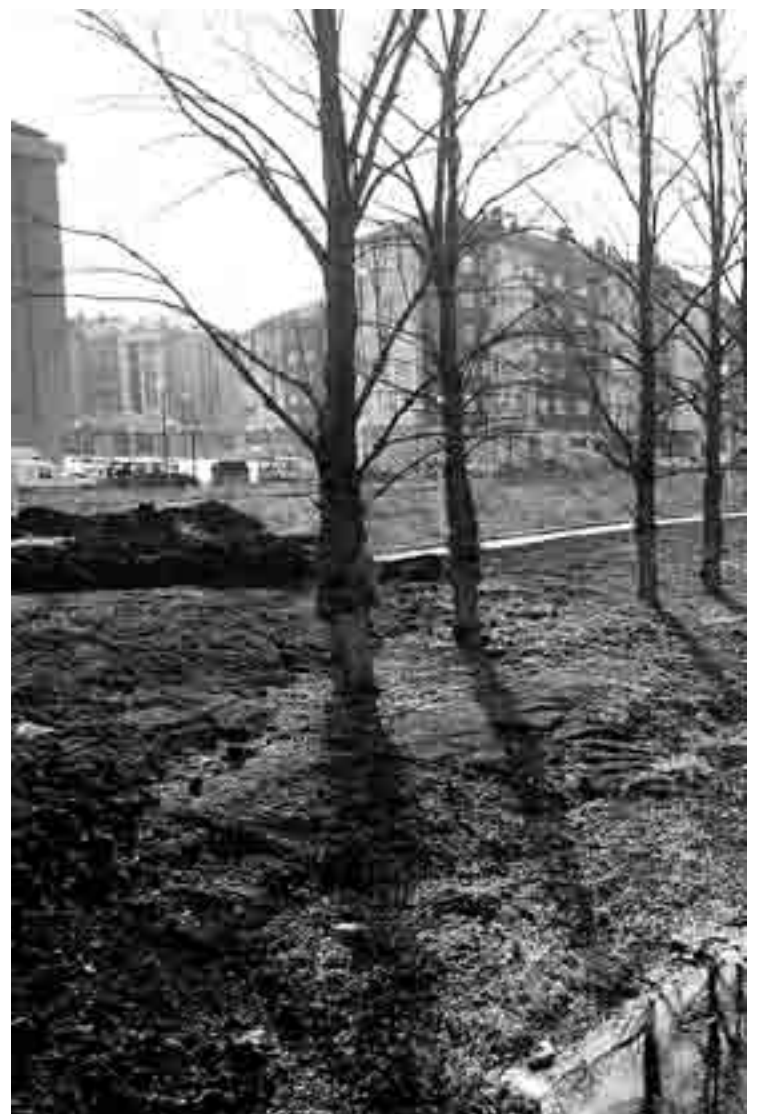
Las zonas verdes constituyen uno de los atractivos de la zona.

Entre las principales demandas del barrio, destacó el presidente del Consejo de Barrio de