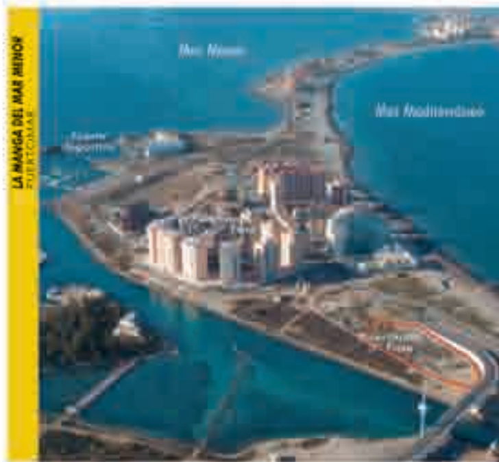
LA MANCA DEL MAR MENOR PUERTO MAJ