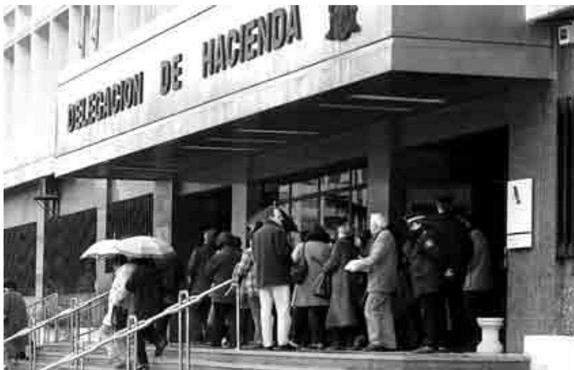
La nómina media anual en Burgos se sitúa 1.336 euros por encima del salario nacional medio, según Hacienda.