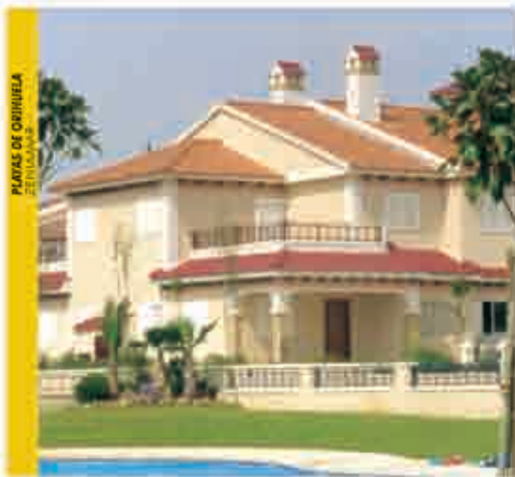
PLAYAS DE ORIHUELA BENIDOLIM

Siente el confort y la tranquilidad que se respira en cada uno de los residenciales que TM Torreblanca le ofrece a lo largo del Mediterráneo . Ubicaciones privilegiadas donde podrá disfrutar de entornos plagados de posibilidades de ocio y esparcimiento. Urbanizaciones diseñadas con todo lujo de detalles puestas a su servicio: zonas ajardinadas, piscinas, jacuzzis, pistas deportivas, gimnasios... Diversos modelos de viviendas que se amoldan a su gusto, completamente equipadas y amuebladas, con amplias estancias y hermosas vistas. Experiencias únicas e inolvidables que sólo en un residencial de TM Torreblanca pueden vivirse.