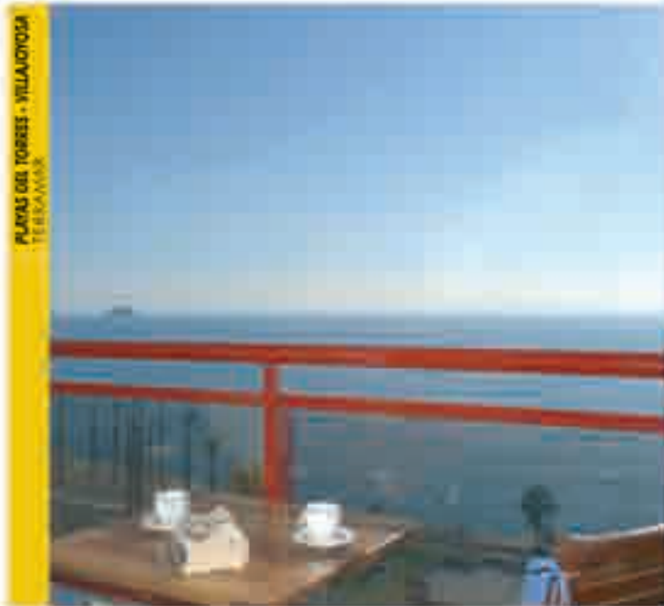
PLAYAS DEL TORRES - VILLAJoyosa TERRASSA