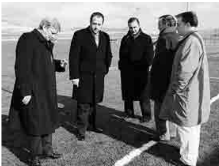
El director general de Deportes visitó los campos de Pallafría.

La visita a Burgos comenzó a las diez de la mañana en la Federación de Patinaje de Castilla