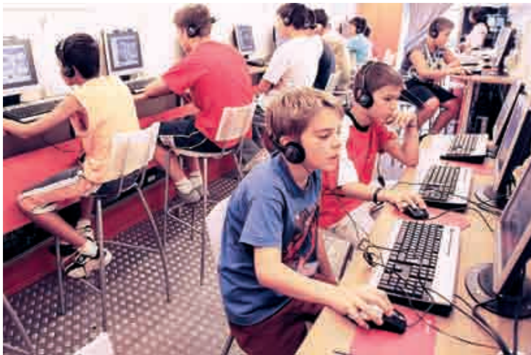
Los escolares aprenderán y jugarán a través de las herramientas informáticas.

5.- Adjudicación del concurso para la ejecución de las obras de peatonalización de las calles San Juan, Avellanos, Cardenal Segura, Diego Porcelos y Plaza Alonso Martínez.