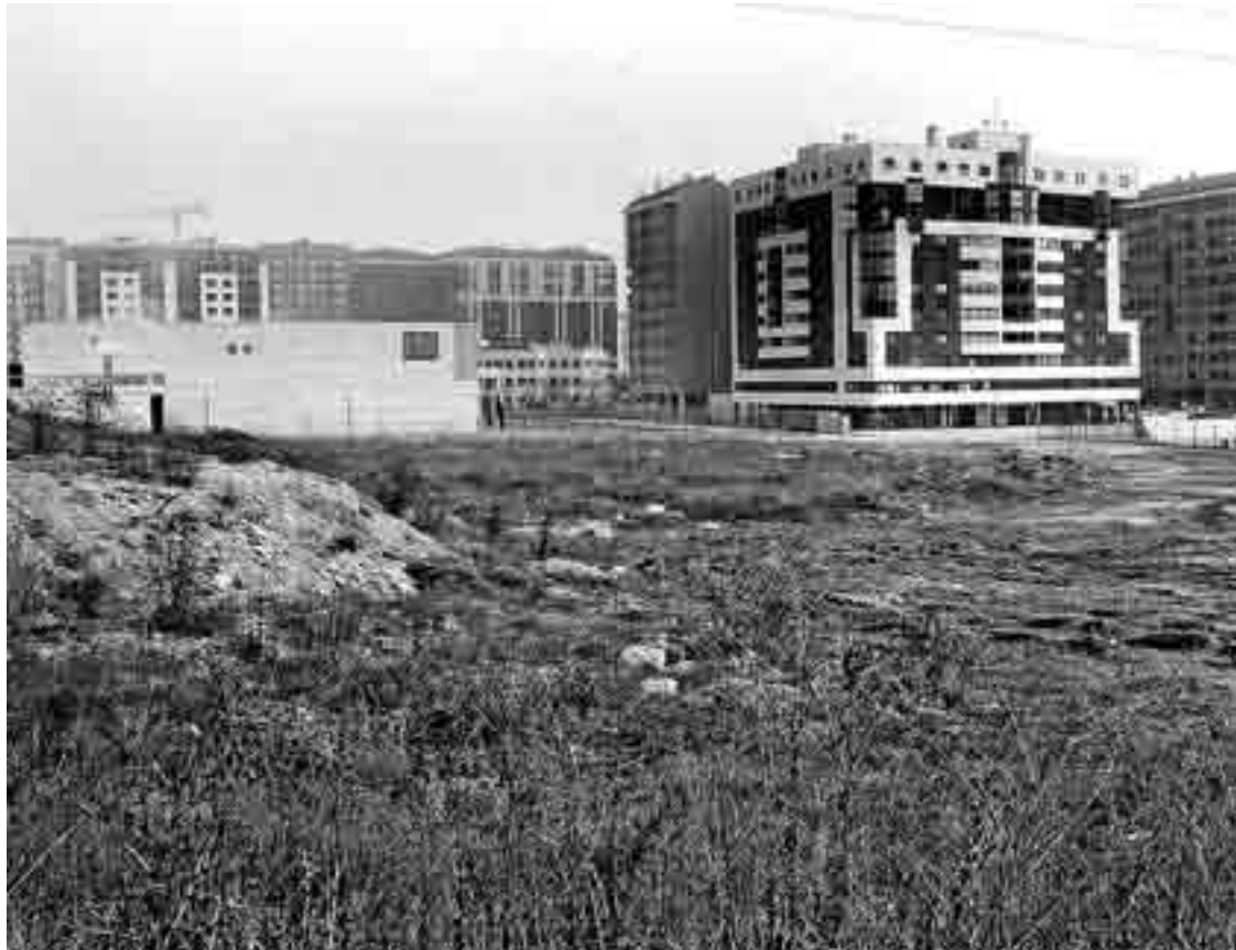
El nuevo complejo deportivo estará ubicado entre las calles Victoria Balfe e Islas Baleares.

Una vez conocida la postura de la asociación de vecinos, el Ayuntamiento adoptará una postura con una segunda reunión a la que invitará a los gimnasios, e incluso ha dado a conocer esta situación a las asociaciones de padres y madres de los centros escolares de la zona del barrio de Vista Alegre. Por último hasta la Asociación de la Prensa Deportiva de Burgos podría estar invitada a la participación en una mesa de trabajo que consensúe