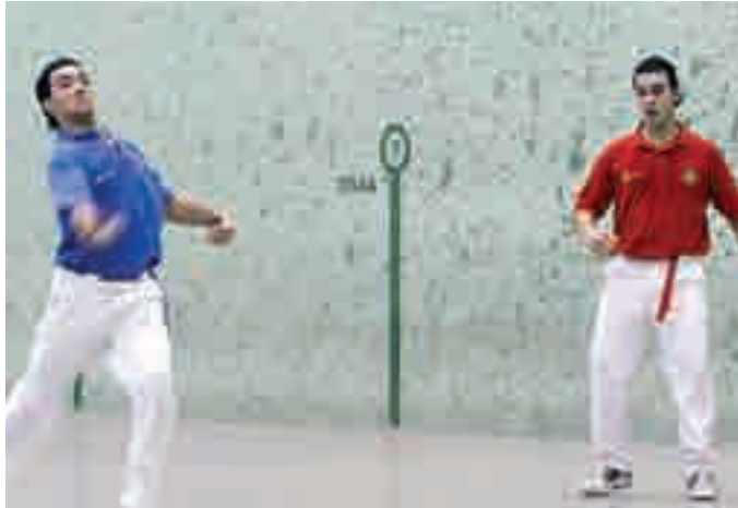
Los chicos del San Cristóbal Promesas, durante un entrenamiento.

En el individual se enfrentarán Arrastoa por el club San