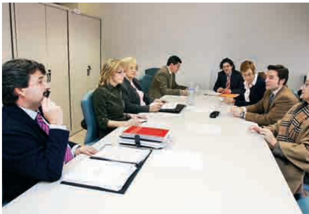
Reunión de constitución del Observatorio Europeo de Consumo Municipal, el miércoles 1 de febrero.

Aunque la mayor parte de las prestaciones por maternidad son solicitadas por las madres, cada vez son más los padres que hacen uso de ellas. Durante el año 2005, solicitaron esta prestación un total de 59 hombres en Burgos, 274 en Castilla y León, y 5.269 en España. La cuantía es equivalente al cien por cien del salario.