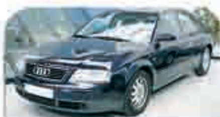
AUDI A6 1.8 T Año 1998. 4 Airbags, ABS, Climatizador, Manos Libres, Radio CD. 12.000 €