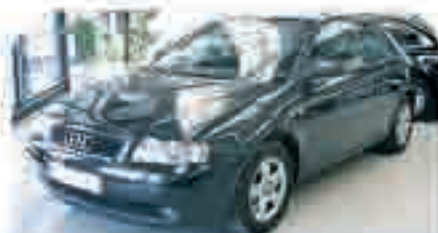
AUDI A3 1.9 TDI (130 CV) Año 2002, 4 Airbags, ABS, TCS, Elevalunas, Llantas de aleación. 18.000 €