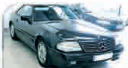
MERCEDES SL 500 2 Airbags, ABS, ESP, Climatizador, Cuero, Cambio Automático, Año 1995. 20.000 €