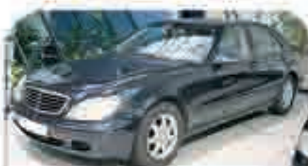
MERCEDES CLASE S 430 Navegador, televisión, Xenón, Techo Solar, Suspensión Neumática, alarma, Cuero, Año 2001. 32.000 €