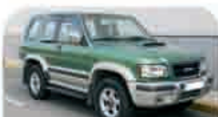
OPEL MONTERREY 3.0 DTI 2 Airbags, ABS, CC, Espejos calefac. y abatibles, Estriberas, Enganche, P. metaliz. Varias unid., Años 98-99. Desde 12.000 €