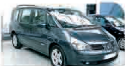
RENAULT GRAND SPACE 2.2 DCI Año 2005, Xenon, Navegador, ABS, TCS, 8 Airbags, Cargador CD's, Sensor de lluvia 32.000 €