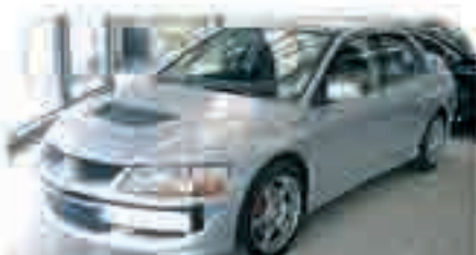
MITSUBISHI EVOLUTION Año 2004, Llantas, Asientos deportivos Recaro Exclusivo. 34.000 €