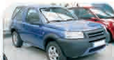
LAND ROVER FREELANDER TD5 2 Airbags, ABS, TCS, Techo desmontable, Llantas de Aleación, Año 2002 17.000 €