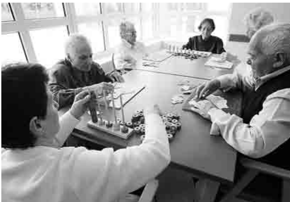
La intervención va dirigida a mejorar el local de estancias diurnas que disfrutarán los enfermos asociados.