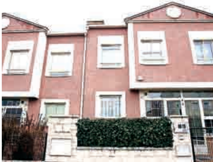
Arcos de la Llana es una de las localidades con más actividad constructiva.

Fuente: Colegio de Arquitectos de Burgos