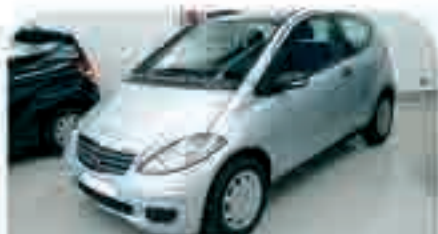
MERCEDES- BENZ CLASE A 180 CDI Varias unidades. Km. 0, 4 Airbags, ABS, ESP, Elevalunas, Climatizador. Desde 20.000 €