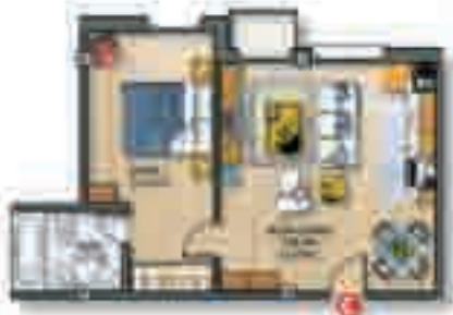
Apartamento • Sup. útil 40,00 m 2