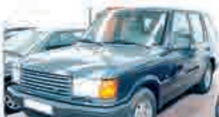
RANGER ROVER 2.5 TD Año 1996, Cuero, 2 Airbags, Suspensión Neumática, Control de Velocidad, ABS. 15.500 €