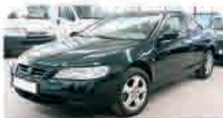
HONDA ACCORD 3.0 V6 Cuero, Techo Solar, Cambio Automático, Teléfono, 4 Airbags, TCS. 12.000 €