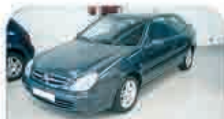
CITROËN XARA VTS 2.0 Año 2001, 4 Airbags, Climatizador, ABS, Navegador, Bluetooth, RadioCD, Llantas, Ordenador de abordo. 11.000 €