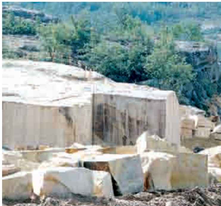
Canteras de extracción de la piedra natural de arenisca en la zona de pinares de la provincia y proceso de investigación.

mercado de la industria de la piedra arenisca, aunque los clientes que demandan este tipo de material se encuentran repartidos también por el resto de la geografía nacional e incluso internacional. En la actualidad Areniscas de los Pinares posee comercialización propia en Alemania, Francia, Reino Unido, Estados Unidos, Chile, México y próximamente en Corea del Sur y Japón. Dorada Urbión, Arenisca Regumiel, Dorada de los Pinares, Arenisca Reina; Gris Pinares, Arenisca Corvio y Roja Neila, son algunas de las marcas registradas de esta empresa.