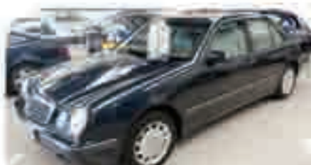
MERCEDES CLASE E Gasolina y Diesel VARIAS UNIDADES Desde 10.000 €