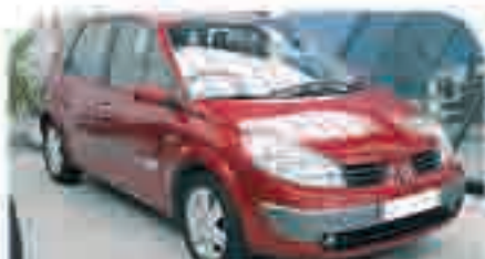
RENAULT MEGANE SCENIC 1.6 16 v. 6 Airbags, ABS, ESP, Climatizador, Elevalunas, Llantas de Aleación, año 2003 13.000 €