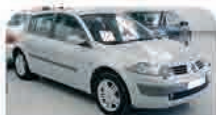
RENAULT MEGANE 1.9 DCI Privilège Año 2003, 6 Airb., ABS, ESP, Climatizador, Llantas, Bluetooth, Xenon. 15.000 €