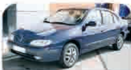
RENAULT MEGANE 1.9 DTI CLASSIC 2 Airbs., ABS, Radio CD, AA, Elevalunas, Mando a distancia. 7.000 €