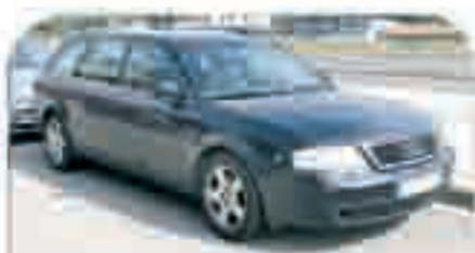
AUDI A6 AVANT AÑO 2000. Xenón, Navegador, Techo Solar, Cuero, Llantas de aleación, Teléfono. 17.000 €