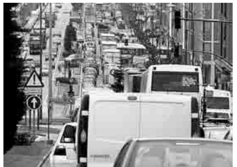
Los vehículos con mercancías peligrosas no circularán por la avda. Cantabria.

Lo mismo se hará con los transportes de mercancías peligrosas que desde la circunvalación transiten hacia Cantabria, que serán desviados por Villalonquejar, la carretera del cementerio y la glorieta de Islas Baleares. Desde la Subdelegación del gobierno se ha indicado que "a la mayor brevedad posible se instalará la señalización de tráfico