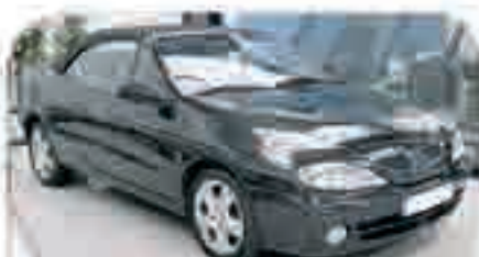
RENAULT MEGANE 2.0 CABRIO Año 2001. 4 Airbags, ABS, AA, Elevalunas, Cargador de CD's, Asientos deportivos, Llantas de aleación. 13.500 €