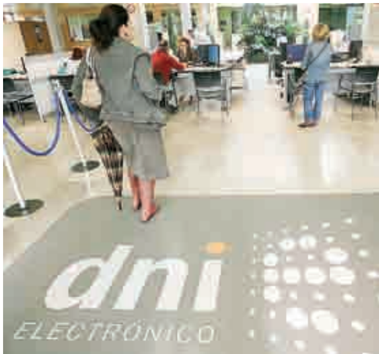
En total se han realizado en torno a los 15.000 DNIe.