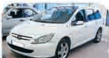
PEUGEOT 307 SW HDI Año 2003, 6 Airbags, Techo panorámico, ABS, Cargador CD's, Elevalunas, Cierre centralizado. 12.500 €