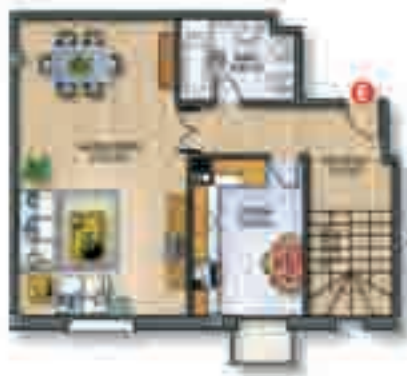
Planta 1ª • Sup. útil 52,00 m 2