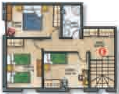
Planta BAJA • Sup. útil 45,00 m 2