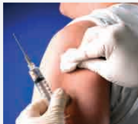
En Burgos se distribuirán más de 80.000 vacunas.

El personal sanitario y otros profesionales incluidos en la 'población diana' (trabajadores sociales, policía,