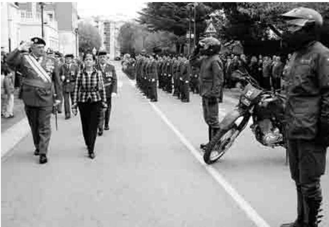
Celebraciones del día del Pilar, patrona de la Guardia Civil, en la calle Infantería.