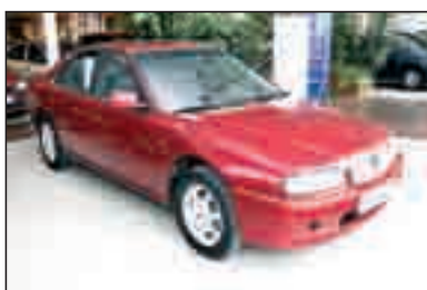
ROVER 620 SDi DA/CC/EE/AA/PM/LL 7.990 €