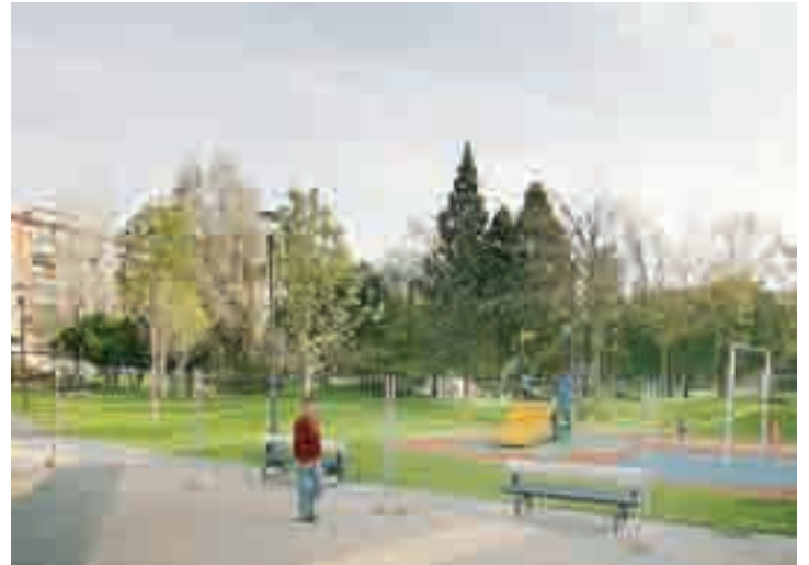
Aspecto actual de la ampliación del parque Félix Rodríguez.

Las tres mejoras incorporadas suponen un cambio del alumbrado,