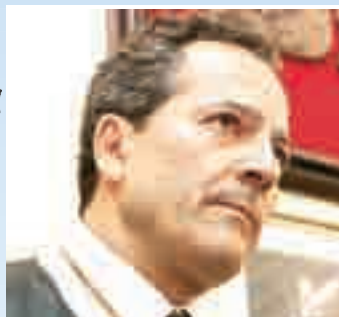
Manuel Martín-Granizo Fiscal-jefe del Tribunal Superior de Justicia de Castilla y León

Manuel Martín-Granizo llega a su puesto en la Fiscalía del Tribunal Superior de Justicia de Castilla y León dispuesto a imponer un estilo propio y una nueva forma de trabajo. No desaprovechó su toma de posesión para dejar claro que tenía entre sus prioridades requerir penas más duras para aquellos conductores que cometan infracciones al volante y dar tratamiento de delito a conductas que hasta ahora tenían la consideración de faltas. En su presentación, anunció que espera dotar al cargo de un mayor dinamismo, buscando siempre la proximidad a los jueces de instrucción.