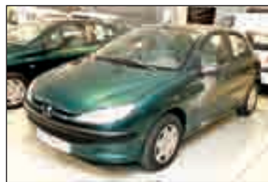
PEUGEOT 206 2.0 HDI XRD DA/CC/EE/PM/CD 8.300 €*/157,19 €/mes**