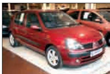
RENAUL CLIO 1.5 dCi Expression DA/CC/EE/LL. Antinieblas 7.900 €*/149,62 €/mes**