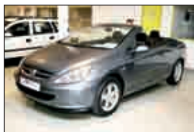
PEUGEOT 307 CC 2.0 DA/CC/EE/CLIM./LL. 20.800 €*/393,92 €/mes**