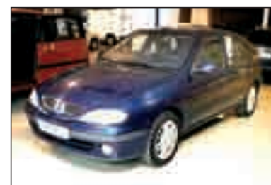
RENAULT MEGANE 1.9 DCI Expression. DA/CC/EE/LL/PM/CD/AA. 9.700 €*/183,71 €/mes**