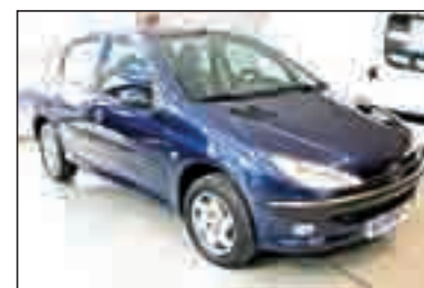
PEUGEOT 206 2.0 HDI XT DA/CC/EE/CD 7.800 €*/147,72 €/mes**