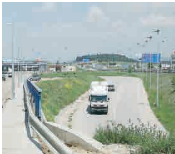
Aspecto del actual polígono industrial de carácter privado.

El nuevo complejo hotelero se situará próximo al centro comercial y al establecimiento de restauración de comida rápida McDonalds.