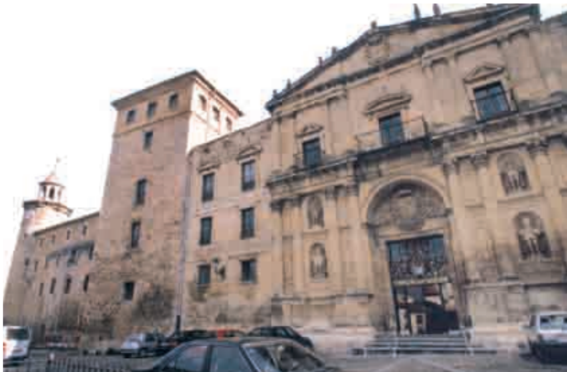
Además del edificio burgense, el complejo de San Salvador de Oña en Burgos (imagen) es otro de los candidatos.

Además del inmueble burgense, la Junta también considera adecuados para extender en una primera fase del Plan de Valorización e incluir dentro de esta nueva red de alojamientos de calidad al complejo monacal de San Salvador en Oña (Burgos), actual centro hospitalario pertenecien-