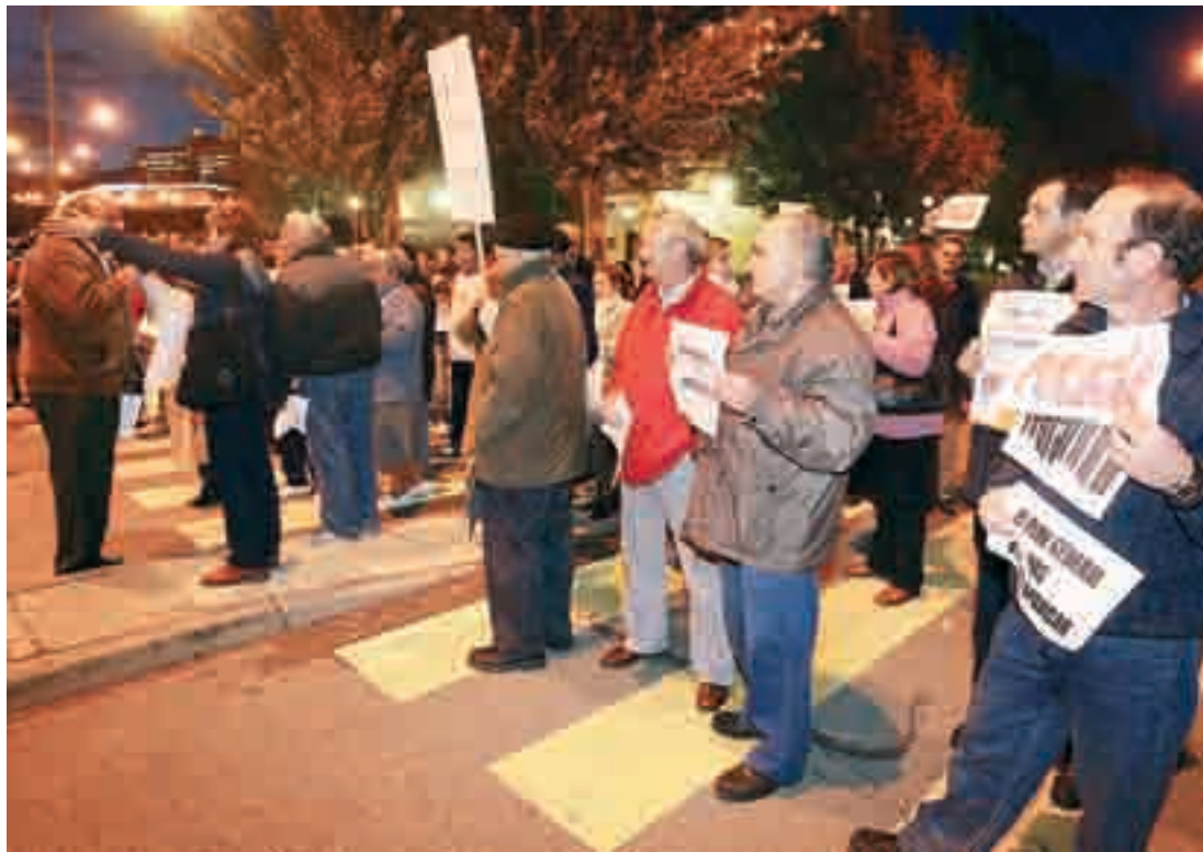
Los vecinos protagonizaron dos cortes de tráfico y reclamaron al Ayuntamiento más medidas de seguridad.