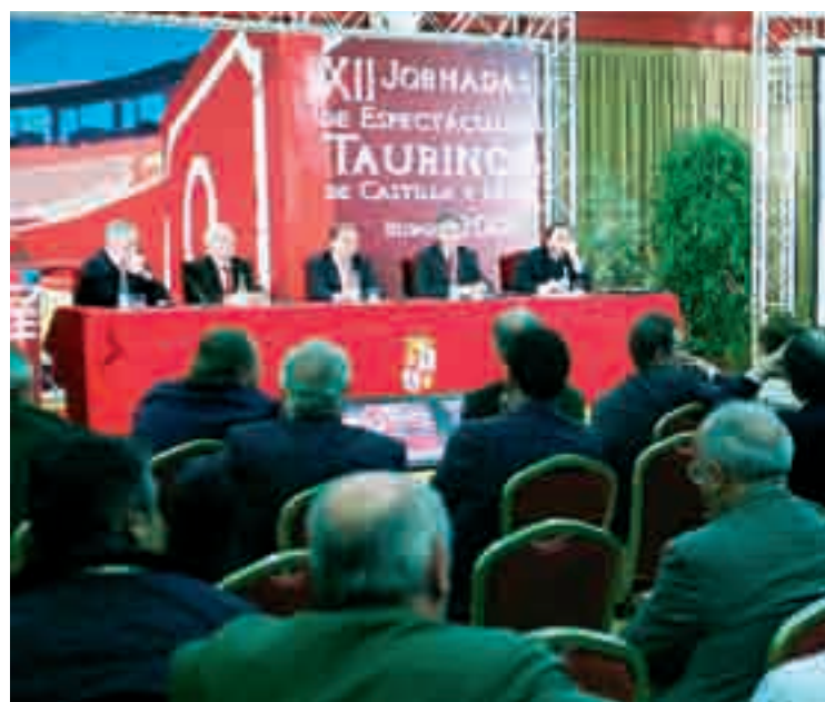
Mesa redonda sobre el borrador del nuevo reglamento taurino, durante la jornada de trabajo celebrada el 19 de octubre en el hotel Abba.

tros, diez en el fuste y tres en la punta; en banderillas, se entra a banderillar en tres ocasiones, salvo otra indicación del presidente; en la lidia queda prohibida la rueda de los peones para acelerar la muerte de la res; y en los premios, se prohíben las manifestaciones para la concesión de trofeos por parte del matador, y en caso de indulto del animal no se simulará la muerte de la res.