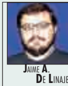
JAIME A. DE LINAJE

También hay aspectos positivos que conviene mencionar: la maravillosa fotografía de Vilmos Zsigmond retrata fantásticamente los espléndidos decorados diseñados por Dante Ferretti, y en el fondo de la historia hay elementos con un enorme potencial que despuntan en escenas aisladas de la película. Desgraciadamente, todo ello queda desaprovechado en un film insatisfactorio.