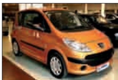
PEUGEOT 1007 1.4 Urban DA/CC/EE/CD. Año 2005 11.000 €*/208,33 €/mes**