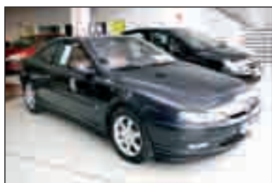
PEUGEOT 406 COUPÉ 2.2 HDI Pack Full Equip. 21.200 €*