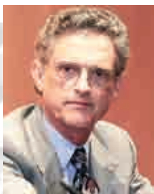
Luis Rojas Marcos.

HABLEN MÁS. Hagan ejercicio físico. Tengan sentido del humor. Realicen labores de voluntariado. Crean en la tecnología. Y cultiven la espiritualidad. ¿Qué para qué? Pues para ser un poquito más felices. Con ese propósito se acercó el día 17 hasta Burgos el prestigioso psiquiatra Luis Rojas Marcos , que durante más de 90 minutos ofreció al público que abarrotaba el salón de actos de la Casa del Cordón algunas claves para aumentar nuestra satisfacción con la vida.