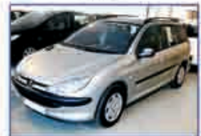
PEUGEOT 206 SW 1.4 HDI 70 X-Line. Año 2003. DA/CC/EE/AA/PM. 18.900 €