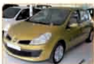
Renault Clio 1.5 dCi 85cv Comfort Expression 07/06 12.700€