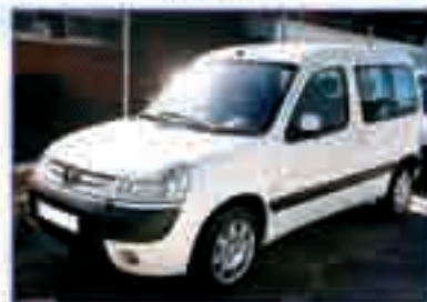
PEUGEOT PARTNER Combi Plus 2.0 HDI. Año 2005. DA/CC/EE/AA. 10.500 €