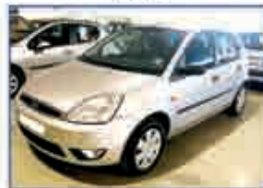
FORD FIESTA 1.4 TDCI Trend Año 2004. DA/CC/EE/AA/PM 10.500 €