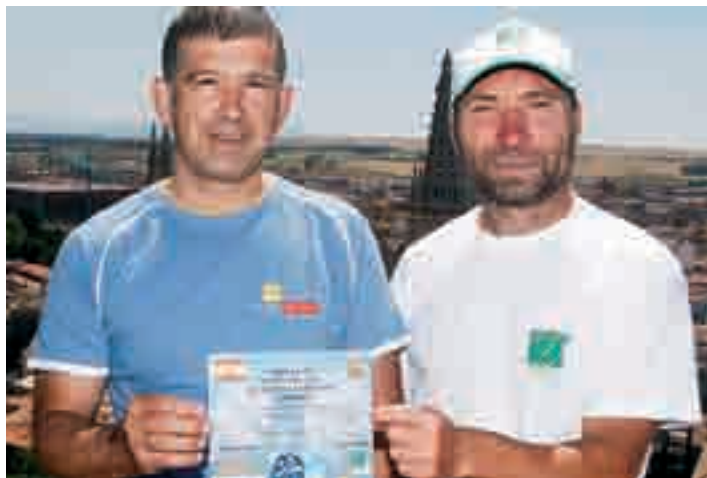
Los montañeros burgaleses partirán el próximo 3 de agosto.

-F: La idea principal era subir a un ocho mil este año pero era muy precipitado, en estas fechas era prácticamente inviable y también había problemas de permisos y papeles. Así que decidimos subir una cota un poco inferior y que a su vez sirva de preparación para el próximo año cuando subiríamos el ocho mil.