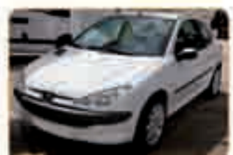
Peugeot 206 1.4 01/04 8.000€