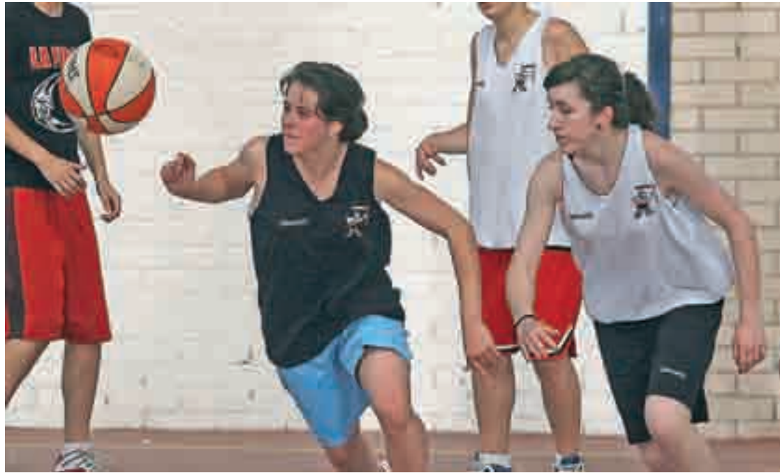
Uno de los objetivos de la escuela es fomentar la cultura deportiva a través de competición y entrenamiento.