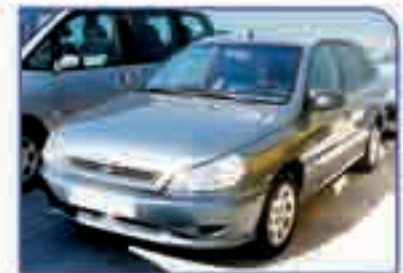
KIA RIO 1.3 SOHC RS DA/CC/EE 5.000 €