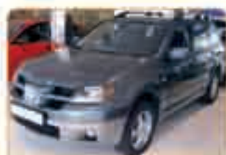
Mitsubishi Outlander 2.4 Automática 10/03 16.800€