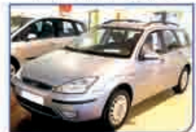
FORD FOCUS 1.6 Trend Año 2003. DA/CC/EE/AA 7.600 €

BU-MOTOR - Ctra. Madrid Irún, Km. 244 - 947 48 22 50 - Burgos