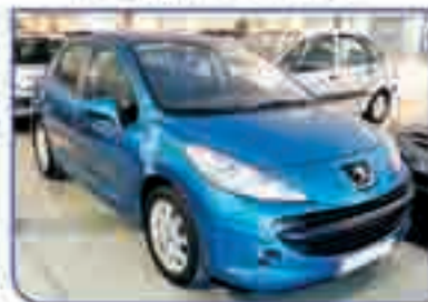
PEUGEOT 207 1.6 HDI XT Pack 110 cv. Año 2006. DA/CC/EE/ORD. Limitador. Regulador. Llantas. 16.300 €