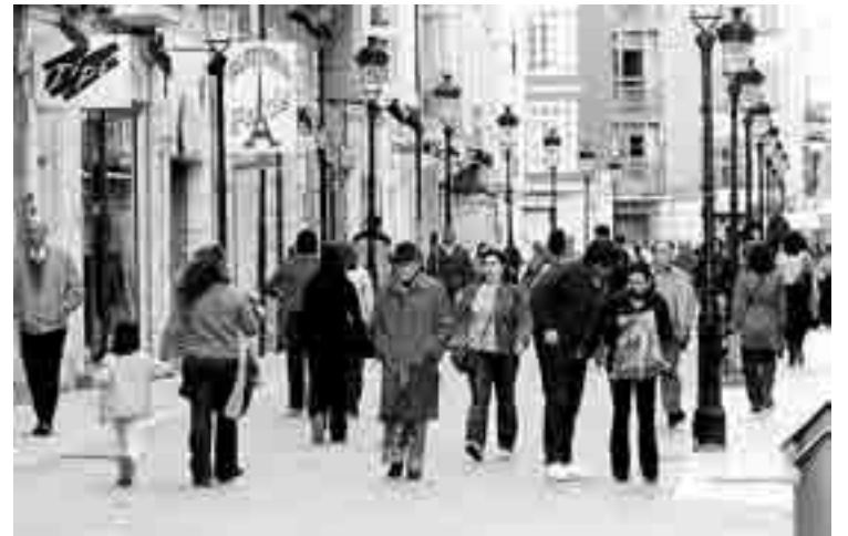
La mayoría de los sótanos se destina a almacén o a comercio.

En primer lugar, el Ayuntamiento permitirá altura libre en los sótanos de todos los locales y establecimientos del Centro Histórico, ya sean destinados al comercio o como almacén. "La medida no hace referencia a los bajos, que están a ras de suelo, sino a los sótanos, que se encuentran bajo rasante, y que en algunos casos son establecimientos comerciales o se utilizan como