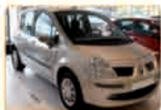
Renault Modus 1.5 dCi 85cv Comfort Dynamique 07/07 12.700€