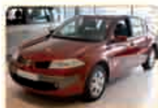
Renault Mégane Sedan 1.9 dCi 130cv Comfort Expression 01/07 18.200€