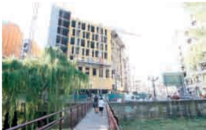
Las obras de refuerzo no afectarán en ningún caso al cauce del río.

"La idea que manejamos es poder proceder a la aprobación en torno a la primera quincena del mes de agosto para que en la segunda puedan comenzar ya