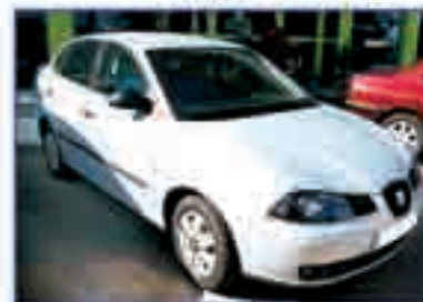
SEAT CORDOBA 1.4 16V Stella DA/CC/EE/AA/PM/CD 7.200 €