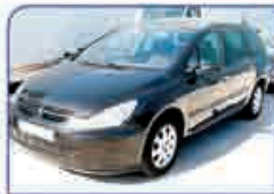
PEUGEOT 307 SW 2.0 HDI DA/CC/CD/EE/CLIM. 11.900 €