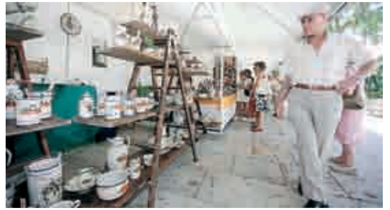
Inauguración oficial de la XXVII Feria de Cerámica en El Espolón.

ce que los talleres “siempre sorprenden porque aunque repitan, deciden en muchos casos cambiar su línea de trabajo respecto al año anterior”. Los visitantes encontrarán productos para todo tipo de bolsillos. “Desde cinco euros hasta 500”, sostiene el portavoz de Alfabur.