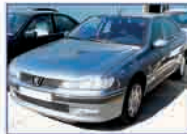
PEUGEOT 406 1.8 SR Van Velde Año 2002. DA/CC/EE/CD/CLIM. 9.000 €