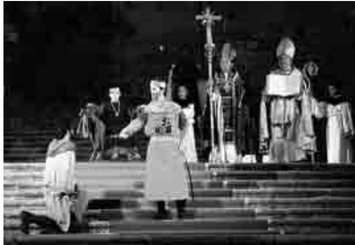
El Cronicón de Oña, todo un espectáculo de luz, sonido y esfuerzo colectivo de un pueblo.

Concebido como un esfuerzo colectivo en el que se implica una gran parte de la población de la villa -más de 200 personas-, este espectáculo de luz y sonido muestra al espectador algunos episodios que acontecieron en la Castilla del Conde Sancho García y otros relacionados con los personajes que están enterrados en el panteón real y condal y con la historia de Oña, como la funda-