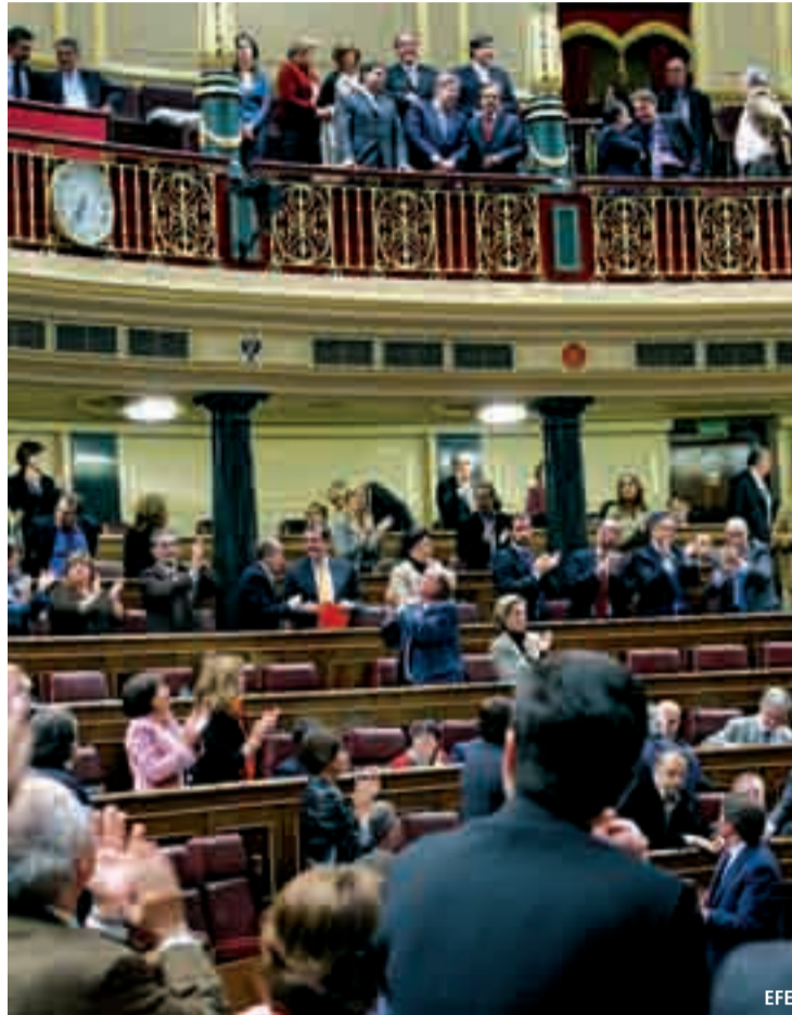
El Congreso aplaude la aprobación de la reforma del Estatuto.

El nuevo texto se basa en cinco ejes fundamentales como son la carta de derechos de los ciudadanos, la asunción de las competencias de la Cuenca del Duero, la separación de poderes, la presencia exterior de la Comunidad y la organización territorial. El texto llegará ahora a la Comisión de Comunidades para ser aprobado por el Senado el 21 de noviembre y entrar en vigor antes de 2008.