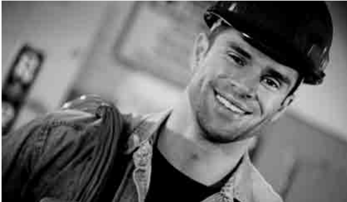
El Plan de Excelencia Empresarial de Castilla y León promueve el desarrollo laboral desde el año 2000.