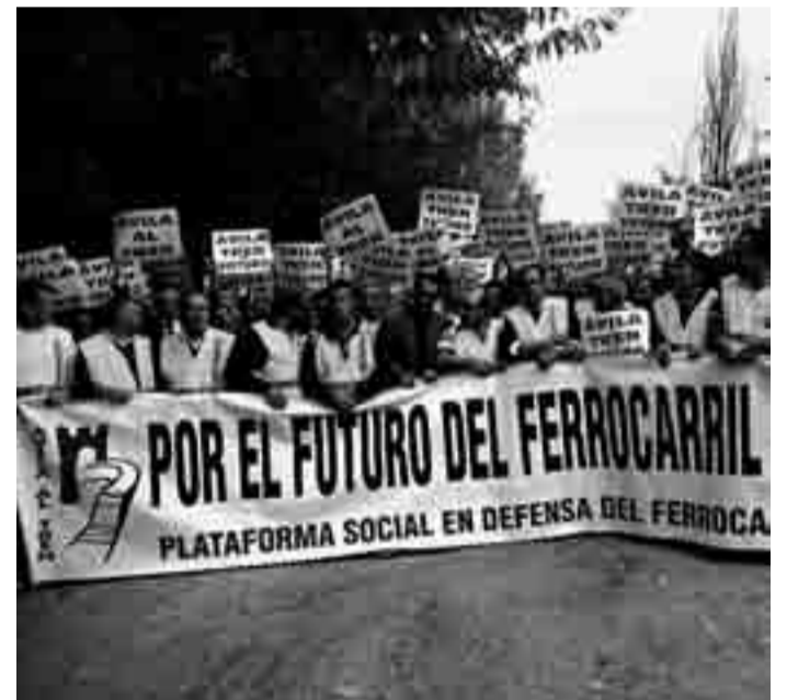
Marcha a pie realizada por los miembros de la plataforma.

A lo largo de estos días han estado apoyados entre otros, por el presidente de las Cortes Regionales, José Manuel Fernández Santiago o el Secretario General de IU, Gaspar Llamazares.