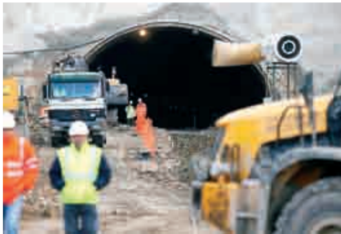
Estado de las obras en el túnel del tramo Villafría-Villatoro.