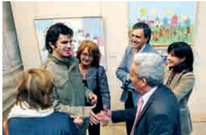
La inauguración de la muestra reunió a numerosas autoridades.

El claustro del Monasterio de San Juan acoge desde el martes 30 esta muestra en la que se hace hincapié en la importancia de la imagen para obtener una mejor comprensión del mundo. Así lo pusieron de manifiesto sus organizadores,