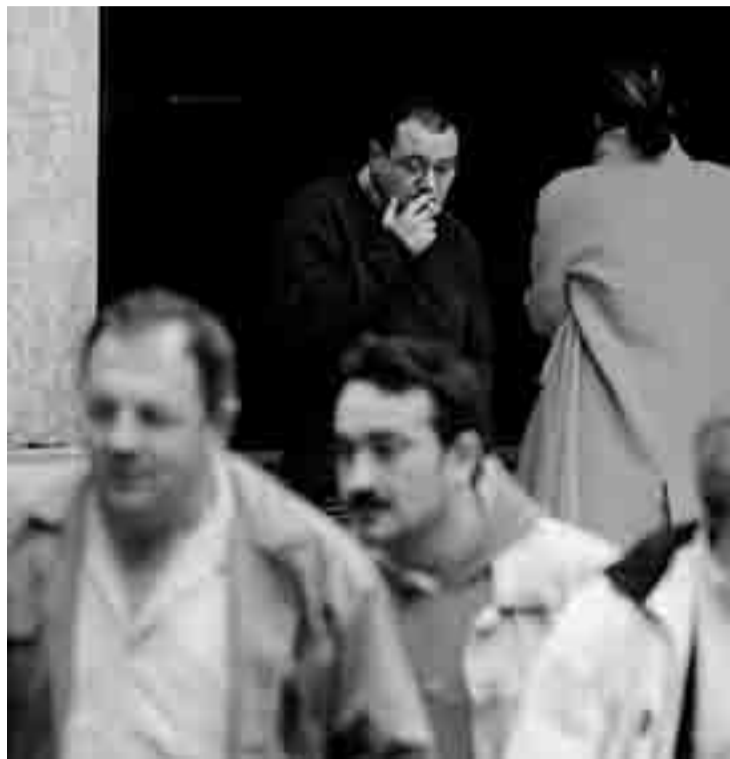
El Decreto aprobado en 2003 está recurrido por el Ministerio de Sanidad.