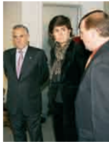
María San Gil, líder del PP vasco.

San Gil, invitada por el Foro Burgalés de Apoyo a las Víctimas del Terrorismo, se desplazó a la capital burgalesa el miércoles 14 para participar en el ciclo de conferencias "Terrorismo, Nacionalismo y Constitución en la España actual" en el centro cívico de San Agustín. Fue presentada por la periodista Ánge-