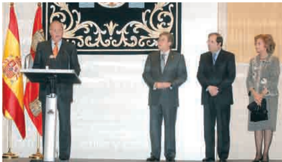
Juan Carlos I inaugura la nueva sede del legislativo autonómico ante la mirada de Fernández, Herrera y la Reina.

NÚMERO 428 - AÑO 10 - DEL 16 AL 22 DE NOVIEMBRE DE 2007 - DISTRIBUCIÓN GRATUITA 50.000 EJEMPLARES - CONTROLADO CLASIFICADOS: 807 317 019