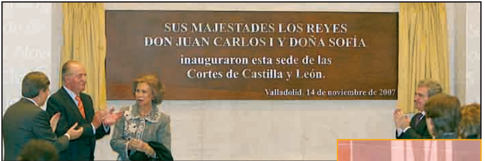
Sus Majestades descubrieron una placa conmemorativa de la inauguración de las Cortes en el salón de recepciones del hemiciclo.