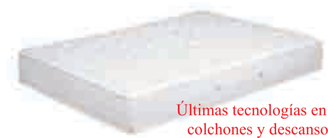
Últimas tecnologías en colchones y descanso