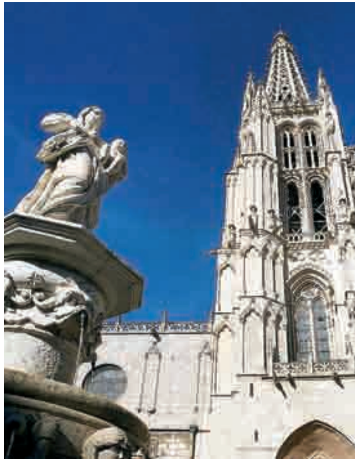
El simposio sobre catedrales se celebrará hasta el viernes en Cajacírculo.

Algunos de los especialistas en gestión y conservación del patrimonio de Europa coinciden en buscar algún tipo de regulación o de reglamentación de acceso a los templos más visitados, tanto desde una óptica religiosa de culto, como para proteger el patrimonio cultural y artístico del país. El catedrático de la Universidad de Chieti-Pescara, en Italia, Claudio Varagnoli, apuntó que la Capilla Sixtina del Vaticano tuvo que ser rehabilitada debido a la gran afluencia de público que registraba. “La Capilla tuvo que restaurarse debido al vapor que generaba la gran canti-