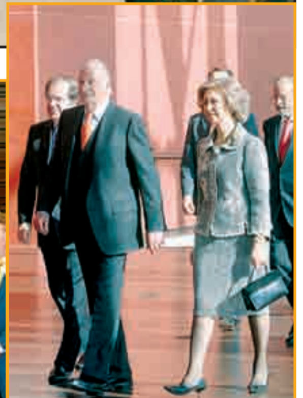
Cientos de personas siguieron pacientes los actos desde fuera; mientras, dentro de las Cortes y del Centro Miguel Delibes, los Reyes realizaron un recorrido por todas las dependencias.