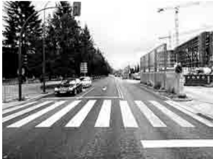
El Ayuntamiento busca soluciones para el acceso a Caballería.