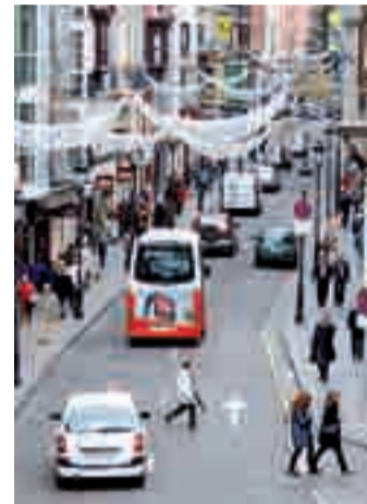
La calle Santander, semipeatonal.