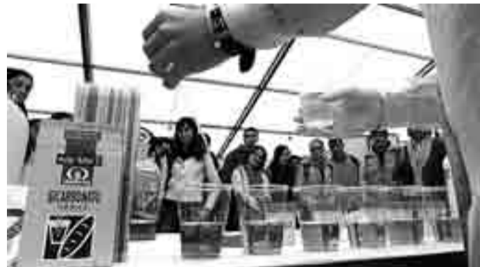
La UBU organiza por séptimo año la semana científica.