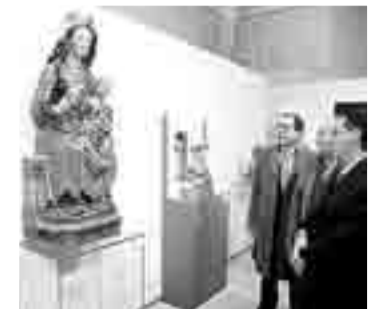
La imagen de la Virgen con el Niño es una de las piezas restauradas.