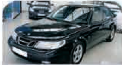
SAAB 95 TDI Año 2002, Cuero, Climatizador, ESP, Cargador de CD's, Elevalunas, Llantas. 19.500 €