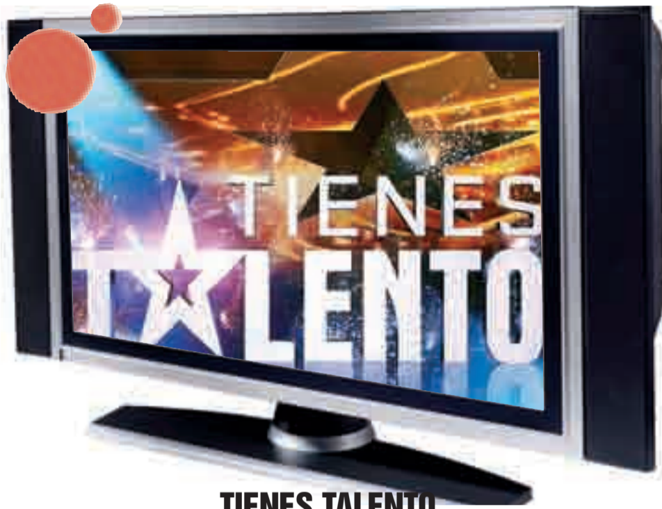
TIENES TALENTO Lunes, 28 Hora: 22.00

Cuatro estrena el lunes 28 de enero en 'prime time' el programa de entretenimiento 'Tienes talento', la versión española de Got Talent, la última creación de Simon Cowell (Factor X) convertido en todo un fenómeno de la televisión actual internacional. El éxito del formato ha dado la vuelta al mundo consiguiendo audiencias millonarias. Seis países ya han emitido la primera edición y cinco, una segunda. Estados Unidos va por la tercera, y cinco más, entre ellos, España a través de Cuatro, están a punto de estrenar su primera edición.