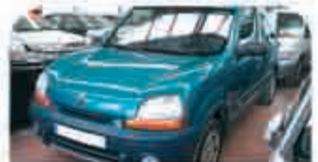
RENAULT KANGOO 4x4 1.9 DCI Año 2002. 4 Airbags. ABS. Aire Acondicionado. Elevalunas. Forrada interior. 11.500 €