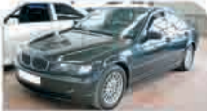
BMW 320 D Año 2002. Techo Solar. Navegador. 6 Airbags. ABS. TCS. Elevalunas. Cierre centralizado. 16.500 €