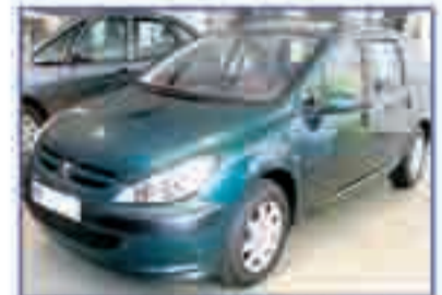
PEUGEOT 307 BREAK 2.0 HDI XR Año 2004. DA/CC/EE/PM/CD/AA 243 €/mes