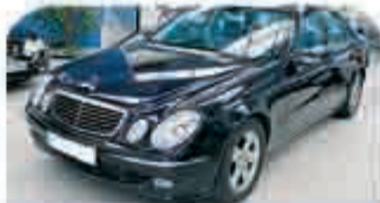
MERCEDES CLASE E Varias unidades diesel. Acabados Avangarde. Años 2002/04 Desde 28.900 €