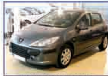
PEUGEOT 307 1.6 X-Line Año 2006. Varias unidades. DA/CC/EE/PM/CLIM. 213 €/mes