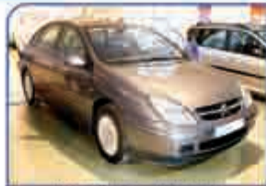
CITROËN C5 2.0 HDI SX Año 2002. DA/CC/EE/PM/AA 214 €/mes