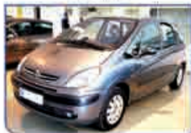
CITROËN X PICASSO 1.6 HDI Satisfaction. Año 2005. DA/CC/EE/PM CLIM/CD. 278 €/mes