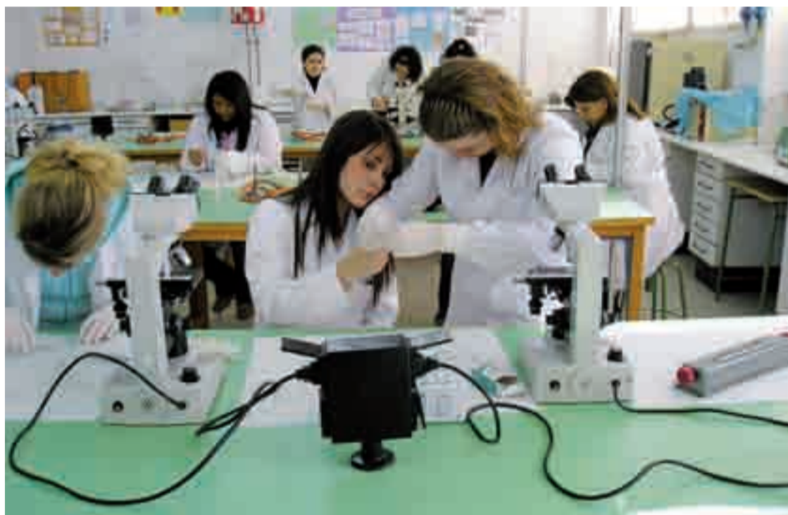
Cerca de 400 profesionales médicos superan con éxito las pruebas del MIR en Castilla y León.

Cada año el 40 por ciento de los estudiantes que acaban el MIR optan por trabajar fuera