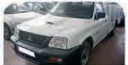
MITSUBISHI L 200 PICK UP Caja abierta y grúa hidráulica. 12.000 €