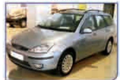
FORD FOCUS WAGON 1.8 TDCI Ghia Año 2004. DA/CC/EE/PM/CLIM/CD 339 €/mes

OFERTAS DE FINANCIACIÓN EFECTUADAS A 60 MESES. 10% DE ENTRADA CON GASTOS INCLUIDOS