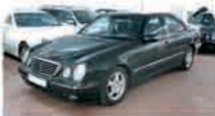
MERCEDES CLASE E Varias unidades. Gasolina y diesel. Desde 10.000 €