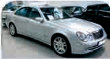
MERCEDES E 320 CDI Avantgarde Año 2004. ABS. ESP. Xenon. Cuero. Navegador. Teléfono. Cargador de CD's 38.000 €