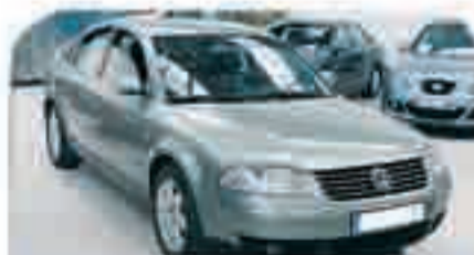
VOLKSWAGEN PASSAT 1.9 TDI 110 y 130 cv. Varias unidades. Años 2000/03 Desde 9.500 €