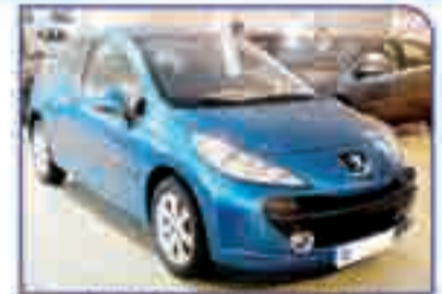
PEUGEOT 207 1.6 HDI XS 90 cv. Año 2006. DA/CC/EE/PM/LL/CD/CLIM. 300 €/mes