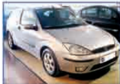
FORD FOCUS 1.8 TDCI Trend 115 cv. Año 2002. DA/CC/EE/AA/PM/CD 165 €/mes