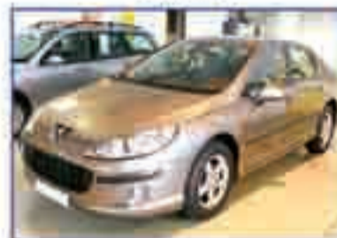
PEUGEOT 407 2.0 HDI ST Comfort Año 2006. DA/CC/EE/PM/CLIM/BIZ/CD 386 €/mes