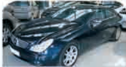
MERCEDES CLS 350 Año 2005. Cuero. Techo solar. ABS. ESP. Navegador. Asientos calefactados. Cargador de CD's. Teléfono. 50.000 €