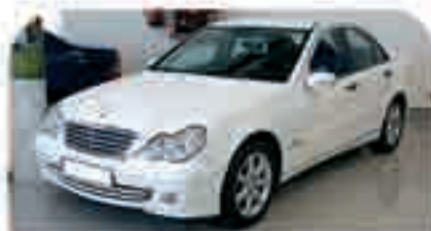
MERCEDES C200 CDI Año 2005. Xenón. ABS. Esp. calefactados. ESP. Clima. Llantas. 22.000 €