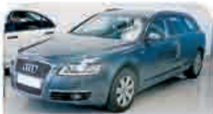
AUDI A6 AVANTUM Año 2005. 8 Airbags. ABS. TCS. Control de Velocidad. Climatizador. Barras en el techo. 30.000 €