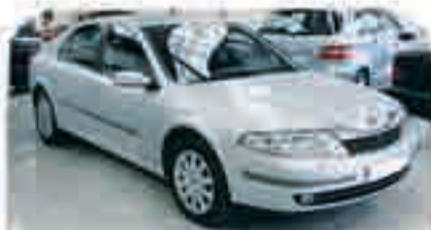
RENAULT LAGUNA 2.9 DCI 150 cv. Año 2005. 6 Airbags, ESP., Clim., Xenón, Cargador CD's, Sensor de lluvia y luz. 2 años de garantía 18.000 €