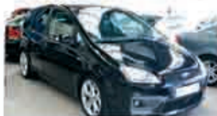
FORD FOCUS CMAX 2.0 GUIA Año 2006. Sensor lluvia y luz. Llantas. Pintura metalizada. Clima. 15.500 €