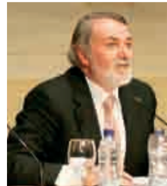
Jaime Mayor Oreja, durante la conferencia del jueves 24.

El europarlamentario y vicepresidente del Grupo Popular Europeo, Jaime Mayor Oreja, estuvo el día 24 en Burgos con motivo de la celebración de la última conferencia del ciclo "Terrorismo, nacionalismo y Constitución en la España actual",