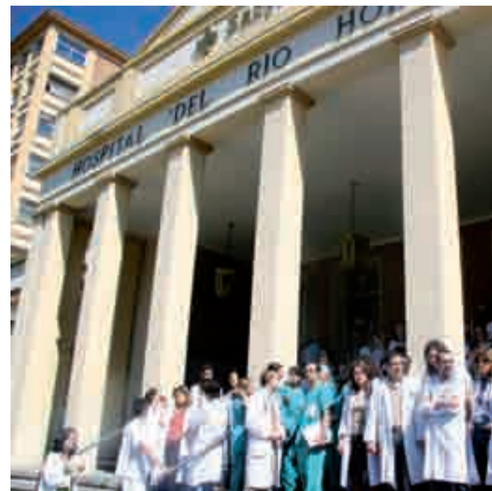
Médicos residentes sanitarios a la puerta del Hospital del Río Hortega.