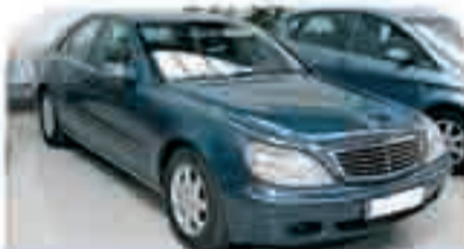
MERCEDES CLASE S 320 CDI Año 2002. Climatizador dual. ABS. ESP. Navegador. Sensor de lluvia y de luz. Xenon. 34.000 €