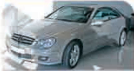
MERCEDES CLK 320 CDI Avantgarde Año 2006. Cuero. Navegador. Bixenón. 7G Tronic. Suspensión deportiva. ABS. ESP. Asientos calefactados. 43.000 €