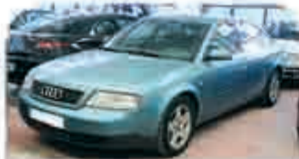
AUDI A6 2.5 TDI Varias unidades. Desde 14.000 €