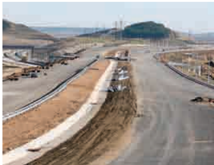
Imagen actual del estado de la ronda norte.

Precisamente, son los trabajos en el segundo túnel de la ronda norte, paralelo al que en estos momentos se está ejecutando, sobre los que primero se actúe. Según explicó el director de obra de la Demarcación de Carreteras del Ministerio, Ignacio Ormazabal, "el método de ejecución será el mismo que el utilizado en el primer túnel". Además, el nuevo túnel dispondrá de todos los niveles de seguridad: galerías de comunica-