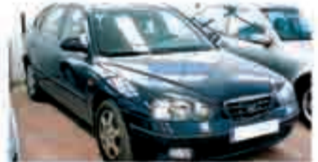
HYUNDAI ELANTRA 1.6 INY. Año 2001. ABS. Aire Acondicionado. Elevalunas Eléctrico. Cierre Centralizado. RadioCD. 5.500 €