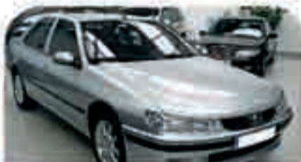
PEUGEOT 406 HDI Año 2003. 6 Airbags. ABS. ESP. RadioCDMP3. Bluetooth