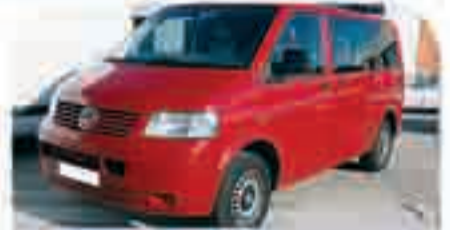
VOLKSWAGEN TRANSPORTER COMBI Automática. 140 cv. Año 2005. Airbags. ABS. ESP. Clima. RadioCD. Cristales tintados. 21.500 €