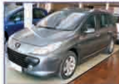
PEUGEOT 307 SW 2.0 HDI 136 Pack Año 2006. DA/CC/EE/PM/CD/LL 352 €/mes