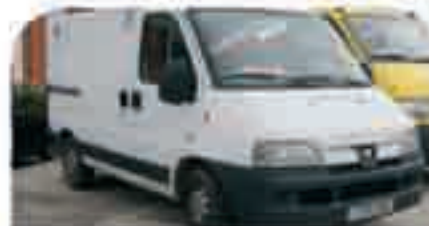
PEUGEOT BOXER Isotermo. Año 2002. Airbag, CC, EE, AA. 12.500 € iva incluido