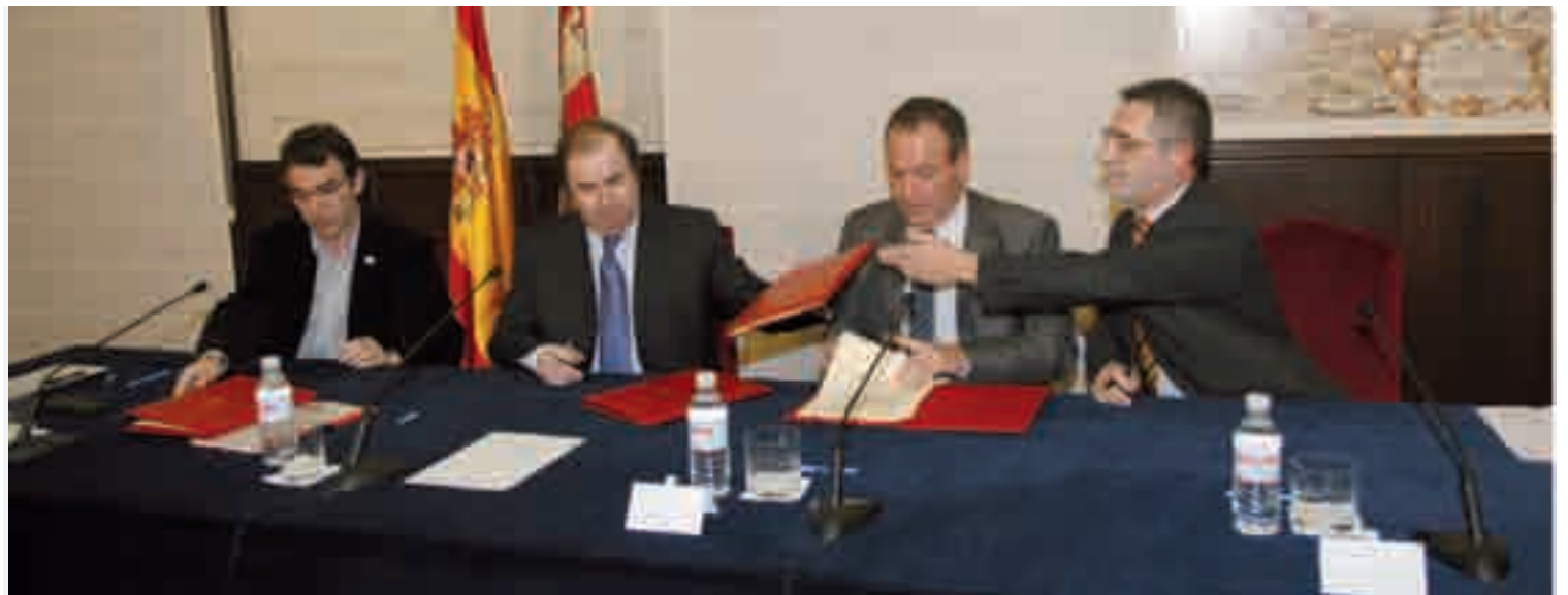
Momento de la firma del acuerdo para crear el Consejo del Diálogo Social en la que participan CCOO, UGT, Cecale y la Junta de Castilla y León.