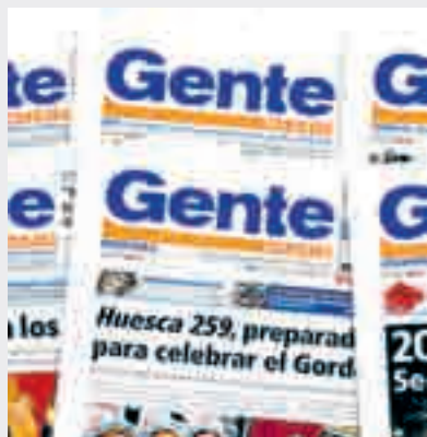
Portadas de Gente en Madrid.