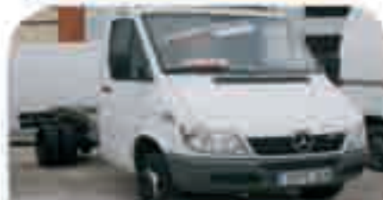
MERCEDES SPRINTER Chasis 416 CDI Año 2005, DA, CC, ABS. 22.000 € iva incluido