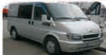
FORD TRANSIT MIXTA Año 2004. DA, EE, CC, Doble airbag. 15.000 € iva incluido