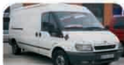
FORD TANSIT 2.5 TDCI Año 2005. Furgón DA, CC, EE. 15.500 € iva incluido