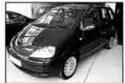
FORD GALAXY 1.9 TDi Tend 115 Año 2001. Libro de mantenimiento 281 € /mes (Financiación a 3 años)