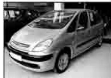
CITROËN XSARA PICASSO 1.6 HDI SX Año 2004. DA/CC/CLIM 215 € /mes