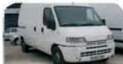
PEUGEOT BOXER TD Año 1996. Furgón. 6.000 € iva incluido