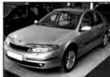
RENAULT LAGUNA 2.2 DCI Initiale. Año 2002. Asientos Cuero. CLIM. 268 € /mes