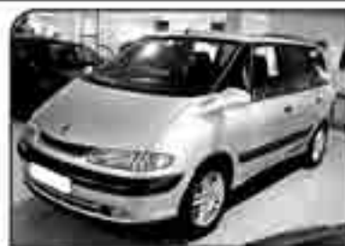
RENAULT SPACE 2.2 dCi Expression Año 2000. Como nuevo. 346 € /mes (Financiación a 3 años)