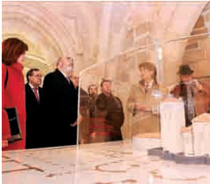
La visita de la Catedral finaliza en el claustro con el espacio interpretativo.

Las nuevas estancias que ahora se abren al público muestran el claustro bajo completamente re-