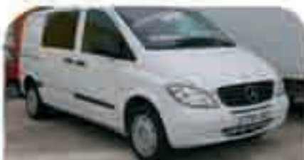
MERCEDES VITO MIXTA Año 2005. DA, EE, CC, ABS, ESP. 18.500 € iva incluido