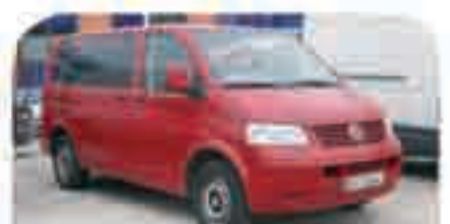
VOLSWAGEN TRANSPORTER MIXTA 140 c.v. Año 2005 AA, Cambio automático, Cristales tintados. Radio CD. 21.000 € iva incluido