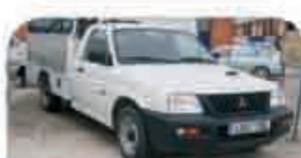
MITSUBISHI L200 Chasis con grúa. Año 2002. Impecable. 11.000 € iva incluido