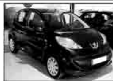
PEUGEOT 107 1.0i Urban Año 2005. DA/CC/EE/AA. 15.000 km. 175 € /mes