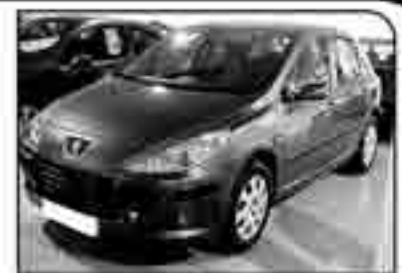
PEUGEOT 307 SW 1.6 HDI 110 Año 2006. DA/CC/EE/PM/AA/CD. 30.000 kms. 305 € /mes