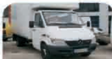
MERCEDES SPRINTER 416 CDI Año 2003 automático, AA, EE, ABS, ESP. Con caja cerrada. 21.500 € iva incluido