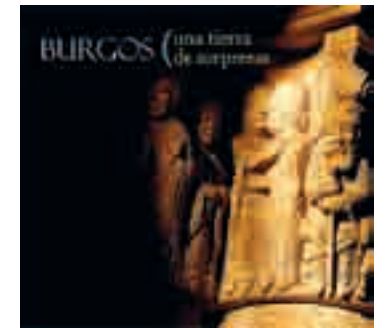
Portada del libro, editado por los Grupos de Desarrollo.