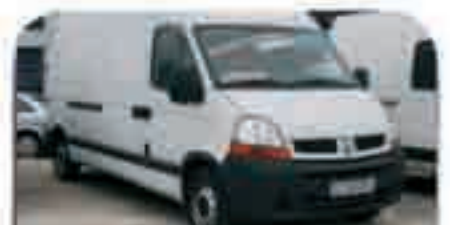
RENAULT MASTER Isotermo (sobreelevada). Año 2005. Airbag, ABS, CC, E.E, AA. 20.000 € iva incluido