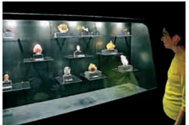
La muestra tiene gran valor educativo y se dirige al público infantil.