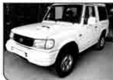
GALLOPER EXCEED CORTO 2.5 Tdi Confort. Año 2001. Perfecto estado 290 € /mes (Financiación a 3 años)