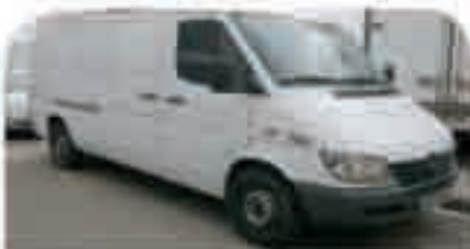
MERCEDES SPRINTER 316 CDI LARGA Año 2005 AA, ABS, ESP, Calefacción Autónoma. 23.000 € iva incluido