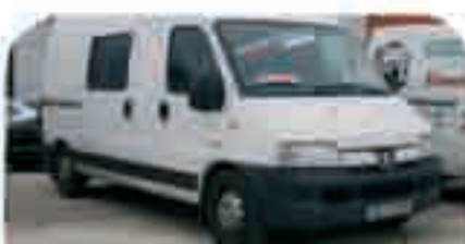
PEUGEOT BOXER HDI MIXTA Año 2003. DA, CC, ABS, AA, EE. 13.000 € iva incluido