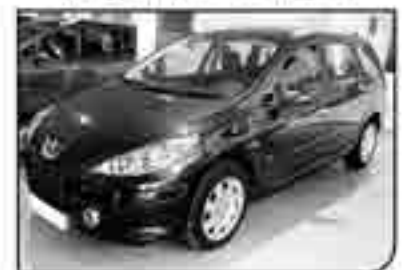
PEUGEOT 307 1.6 X-LINE 110 cv/Año 2006. Pocos kms. DA/CC/CLIM BIZ/EE. 2 años de garantía 215 € /mes

OFERTAS DE FINANCIACIÓN EFECTUADAS A 60 MESES. 10% DE ENTRADA CON GASTOS INCLUIDOS