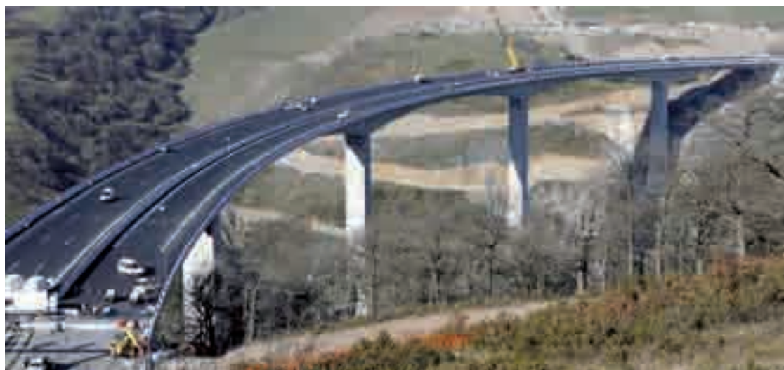
Imagen del nuevo tramo de la A-67 que une Molledo y Pesquera, inaugurado hace unos días.

Mientras que los otros seis aún ejecución avanzan con eviden-