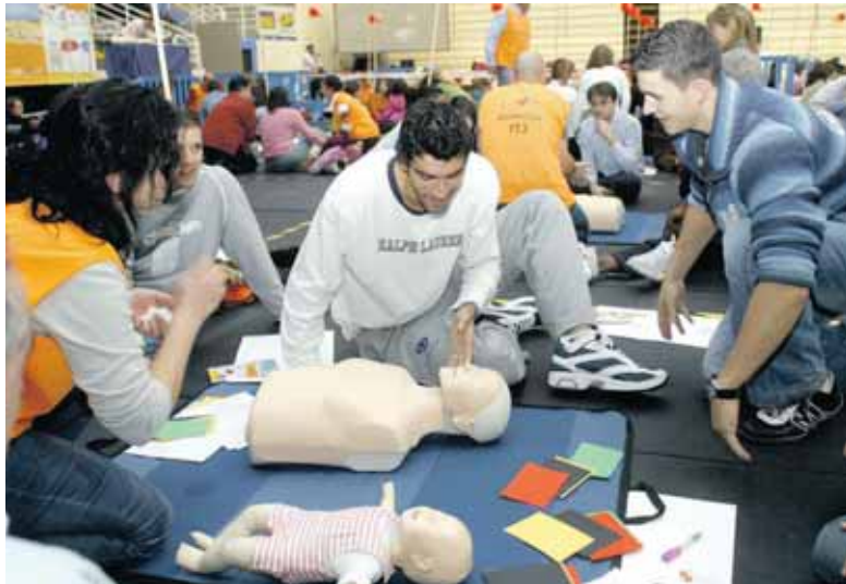
Un voluntario explica cómo realizar masajes cardíaco de reanimación.

A diferencia de lo que se pueda creer, las enfermedades cerebro y cardiovasculares afectan más a las mujeres que a los hombres. En 2006, el 43% de los fallecidos fueron hombres, mientras que el 57% fueron mujeres. La dificultad del diagnóstico de las ECV en las mujeres se basa en que pueden presentar "síntomas atípicos y diferentes a los del varón" por ejemplo náuseas, dolor de espalda o fatiga. A esto hay que añadir que el riesgo aumenta con la llegada de la menopausia. Por eso, es el