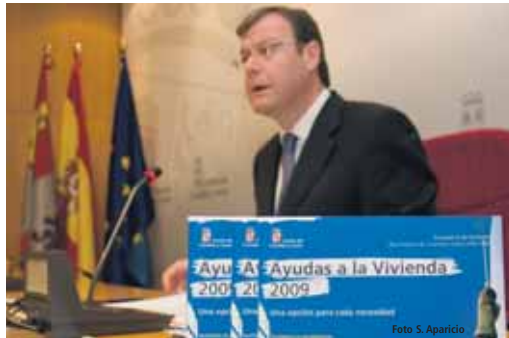
El consejero de Fomento, Antonio Silván, durante la presentación.

Silván anunció que este año se destinarán 56'6 millones de euros en ayudas a la vivienda y que la subvención a compradores de vi-