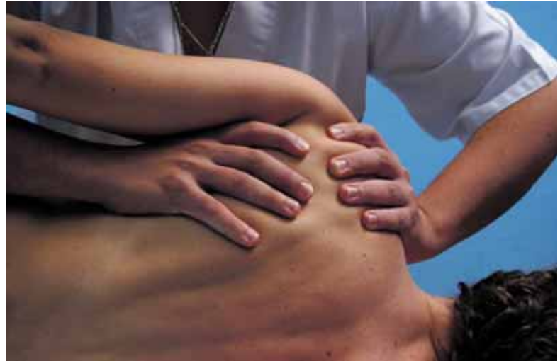
Un paciente durante una sesión de ejercicios.

No hay ningún síntoma típico de la esclerosis que ayude en el diagnóstico inicial. Incluso es habitual que el primer episodio pase desapercibido por la vaguedad de las molestias sin que el sujeto