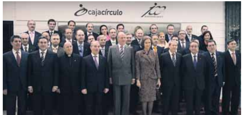
Foto de familia de los Reyes con representantes de los órganos de Gobierno de Cajacírculo.

Recordó Mijangos que esta caja es una institución privada y de carácter social cuyos principales objetivos son "el fomento del ahorro, la formación y el reparto de rique-