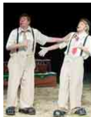
Uno de los números favoritos de los niños es el de los payasos.

El Circo Holiday nació hace 21 años en el País Vasco bajo el nombre de Circo Tokio con un marca-