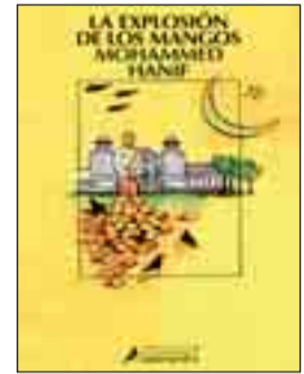
LA EXPLOSIÓN DE LOS MANGOS Mohammed Hanif. Novela.