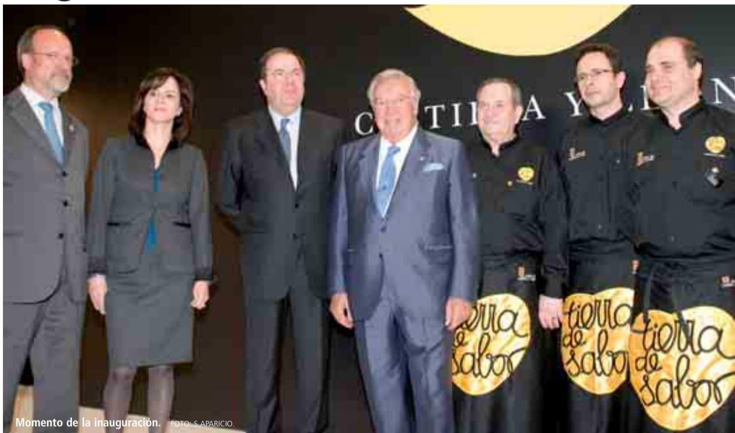
Momento de la inauguración.

■ Según el delegado del Gobierno, Miguel Alejo, "el Gobierno coopera y colabora con la Consejería de Agricultura de forma decidida". "Las buenas relaciones políticas y técnicas son importantes, pero en un momento de crisis son más importantes" añadió, recordando "los 300 millones para desarrollar políticas conjuntas".