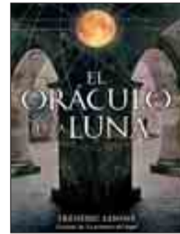
ORÁCULO DE LA LUNA. Frédérik Lenoir. Novela.

Luz y Vida Arco del Pilar, 8 (Lain Calvo)