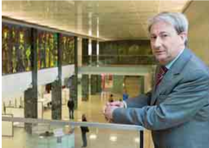
El director general de Cajacírculo trabaja en la entidad desde hace 4 décadas.

Yo dije que en todo caso, ya que ellos insistían tanto, podíamos estudiar una absorción y esto no fue un farol ni una fanfarronada, sino que simplemente yo lo dije dado nuestro origen fundacional y esa protección que tenemos de una cláusula adicional en la Ley de Cajas de Ahorros fruto del Concordato firmado con la Santa Sede, por la cual Cajacírculo no puede perder la