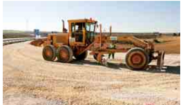
Este acceso evitará el paso de camiones por la zona sur de la ciudad.