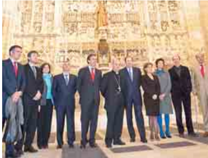
Visita de Herrera y de representantes del Santander a San Nicolás.

Algunas de las actuaciones de restauración más destacadas han sido la intervención en las fachadas de la iglesia, realizando una limpieza superficial y una limpieza en profundidad; así como las