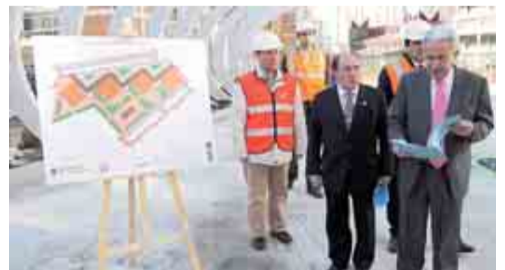
La marquesina protegerá del viento y creará zonas de sombra.