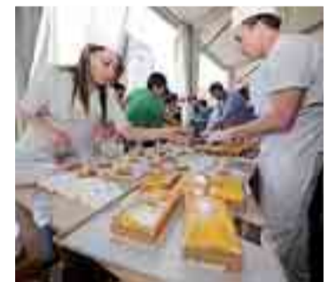
Los reposteros elaboraron durante cinco horas el dulce.