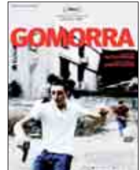
GOMORRA. Dir. Matteo Garrone. Int. Toni Servillo, Gianfelice Imparato, Maria Nazionale. Drama.