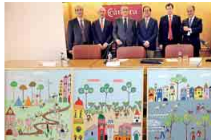
Foto de Familia de las Empresas Socialmente Responsables 2008.