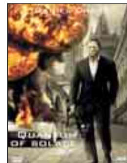
QUANTUM OF SOLACE. Dir. Marc Forster. Int. Daniel Craig, Jeffrey Wright, Mathieu Amalric. acción, thriller.