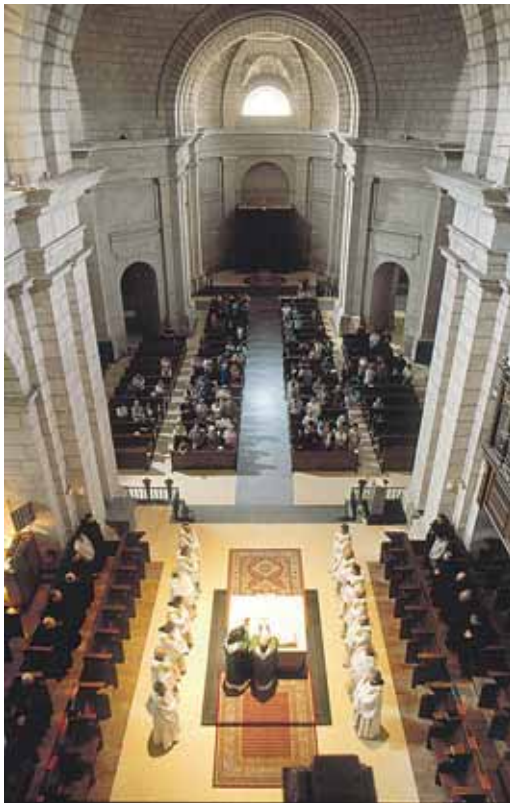
Celebración eucarística en la Basílica de la Abadía.