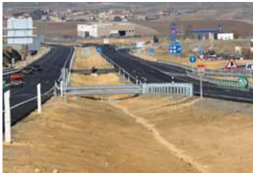
Vista de uno de los tramos que se remodelará.

Se procederá al desmontaje de 28.620 m de diversos tipos de barrera con el posterior montaje con cambio de poste a C. Además, se eliminarán algunos terminales y posteriormente se instalarán tramos con abatimiento de 4, 8 y 12 m. y cambio a poste tubular. Igualmente, se acondicionarán 22.759 m de