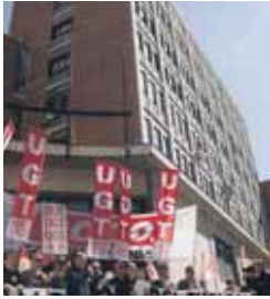
Un instante de la manifestación.

■ Unos 500 delegados de los sindicatos CCOO y UGT se manifestaron durante esta semana en Valladolid, desde la sede de la Confederación de Organizaciones Empresariales de Castilla y León (Cecale) hasta la de la Confederación Vallisoletana (CVE), en Plaza Madrid, para pedir que las empresas no abusen de los Expedientes de Empleo de Regulación y hagan todos los esfuerzos por mantener el trabajo en la ciudad.