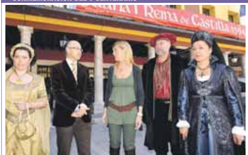
El presidente de la Diputación y la alcaldesa durante la presentación