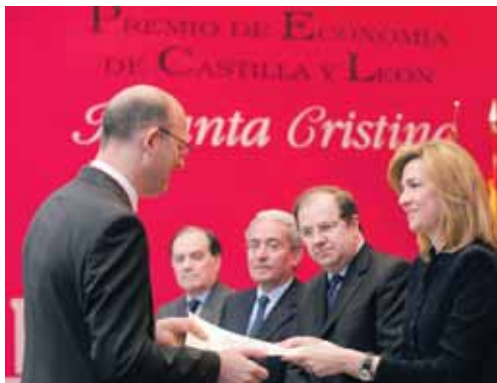
La Infanta Cristina entrega el Premio de Publicidad a Pablo Vázquez.

La Infanta subrayó “el excelente nivel alcanzado por su trabajo constante, que le ha llevado a convertirse en uno de los centros de investigación económica más prestigiosos de España” y recordó que desde su creación en