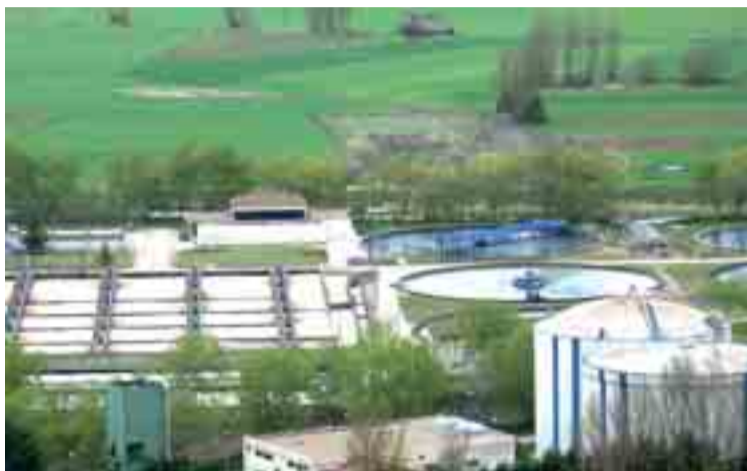
La depuradora se encuentra a la espera de una necesaria ampliación.