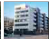
JARDINES DE LA ESTACIÓN Pisos, apartamentos y áticos con terraza de 1-2-3 y 4 dormitorios. A estrenar. Garaje y trastero. Exteriores. Urbanización privada, piscina-pádel.