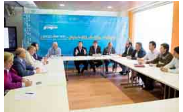
Imagen de la reunión mantenida el pasado lunes 27.

Rico finalizó recordando que "el PP de Burgos está vivo, hay unidad dentro de él y podemos augurar un futuro en la provincia".