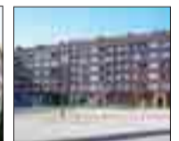
G2. NORTE Piso de 100 m 2 . 3 dormitorios, 2 baños. Garaje y trastero.