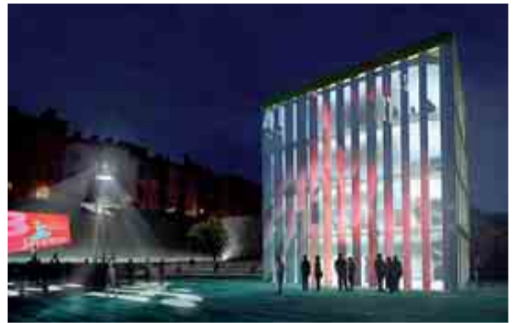
"Es un edificio que transmite energía", dice el autor del proyecto ganador.