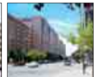
G3 Piso de 100 m 2 aprox. 3 dormitorios, 2 baños. Garaje y trastero. Completamente exterior.