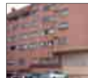
CALLE ÁVILA Piso de 3 dormitorios y 2 baños. Garaje y trastero. Entrar a vivir.