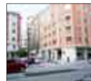
ZONA LA SALLE Apartamento de 2 dormitorios. Para entrar a vivir. Ascensor. Semiexterior.