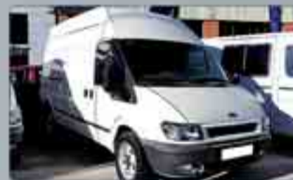
Ford Transit Furgón Varias unidades. Años 2004-2006. Desde 14.000 € IVA incluido