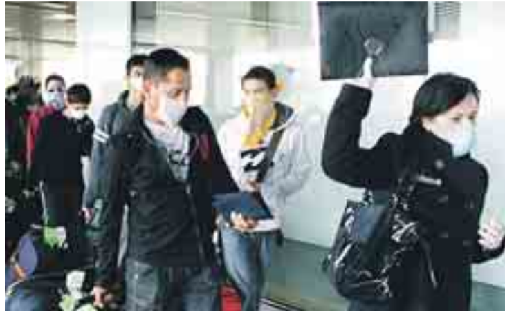
Ciudadanos mexicanos con mascarillas en Barajas.

por comunidades autónomas, en Cataluña existen catorce posibles casos. Es la región más afectada. Le sigue Madrid y Valencia donde ya están observando a doce personas. En Andalucía son once los casos en estudio y dos tanto en Castilla-León, como en Murcia y Galicia. Por su parte las regiones de Asturias, Extremadura, Navarra y La Rioja mantienen a una persona cada una pendiente de diagnóstico. Por su parte, la OMS ha elevado al cuatro el Nivel de Alerta en un baremo sobre seis, aunque la organización no recomienda restricciones para viajar al país mexicano. La gripe pandémica, que es