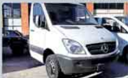
Mercedes Sprinter 515 CDI Chasis Medio Año 2006. Dirección asistida. Cierre centralizado. Climatizador. Bluetooth. 21.500 € IVA incluido