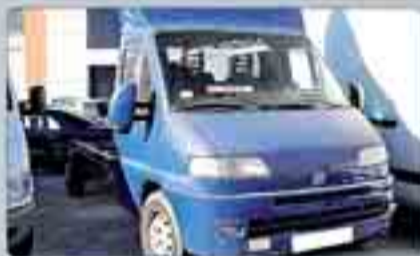
Fiat Ducato Chasis largo. Año 2000. Dirección asistida. Cierre centralizado. Elevalunas. 6.000 € IVA incluido