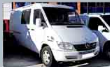
Mercedes Sprinter 313 CDI Mixta Año 2002. Cierre centralizado. Elevalunas. Aire acondicionado. Paragolpes y molduras del mismo tono. 13.000 € IVA incluido