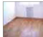
COPRASA Apartamento de 2 dormitorios y 2 baños. Garaje y trastero. Sol mañana y tarde.