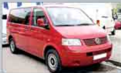
Volkswagen Transporter 2.5 TDI Mixta 140 cv. Año 2005. Dirección asistida. Cierre centralizado. Aire acondicionado. Elevalunas. Cambio automático. Cristales tintados. 20.000 €