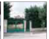
FINCA TOMILLARES Finca urbana de 1.000 m 2 aproximados. Completamente vallada. Estupenda esquina a 2 calles.