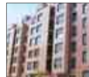
Bº SAN PEDRO Áticos de 73 m 2 útiles. 2 terrazas. Garaje y trastero. Buena orientación. A estrenar. llave en mano.