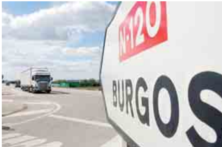
La N-120 a su paso por la localidad de San Medel.

Jiménez argumenta que el Gobierno regional ha retrasado la tramitación de la autovía con la petición de un informe arqueológico y con la sugerencia de una alternativa diferente a las presentadas por Fomento. El secretario general provincial del PSOE también añadió que el alcalde de Villafranca Montes de