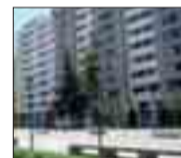
FINAL C/ VITORIA Piso a estrenar de 3 dormitorios, 2 baños. Garaje y trastero. Buena altura. Luminoso y soleado.