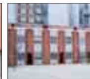
ZONA ALCAMPO Dúplex de 2 dormitorios. Ducha. Servicios individuales.