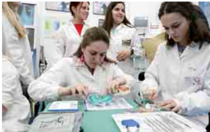
La Formación Profesional exige mejores medios técnicos y didácticos.

La Asociación de FP de Burgos también presentó la nueva página web de la institución, que ha sido realizada por los alumnos del colegio San José Artesano. El portal ofrece conocimiento de los centros que integran la asociación, acceso directo a los distintos cursos y formación que ofrece cada colegio y una completa oferta integrada para alumnos.