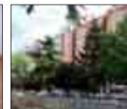
REYES CATÓLICOS Piso de 3 dormitorios y terraza. 4º de altura. Buenas vistas. Portal recién reformado.