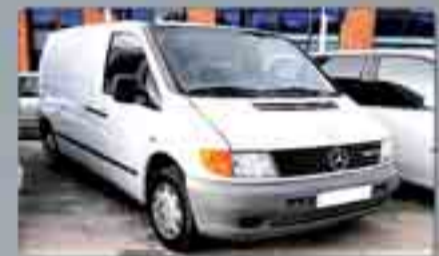
Mercedes Vito Furgón Varias unidades. Año 2000/2001. Desde 8.500 €