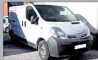
Nissan Primastar 1.9 Furgón DCI Año 2006. Dirección asistida. Cierre centralizado. Elevalunas. 11.000 € IVA incluido