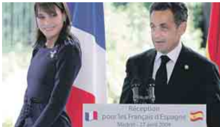
Nicolas Sarkozy y su mujer Carla Bruni durante su visita a España.

Mientras, en Alemania se han identificado ya tres casos, aunque el Gobierno ya anunció que prevé que esta cifra aumente ya que 9.000 de sus ciudadanos disfrutaron o han disfrutado recientemente de viajes en México, donde la situación parece estabilizarse. Así, aunque los datos varían con el paso de la horas, se han computado 159 muertes y 2.500 pacientes están siendo tratados para determinar si portan el virus.