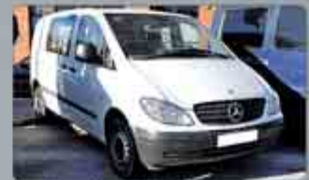
Mercedes Vito III CDI Mixta Año 2005. Airbags. ABS. ESP. Climatizador. Radio/CD. Cierre centralizado. Espejos eléctricos. 16.000 € IVA incluido