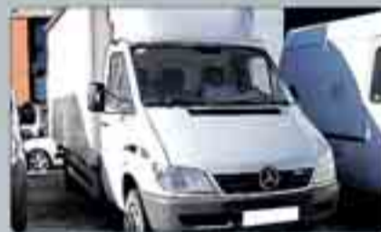
Mercedes Sprinter 416 CDI Chasis corto con caja abierta. Año 2004. Dirección asistida. Radio/CD. Doble rueda. 18.000 € IVA incluido