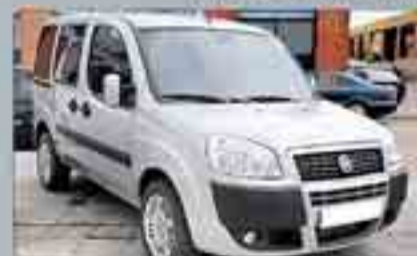
Fiat Doblo Mixta Año 2008. 1 TD. Cierre centralizado. Elevalunas. Aire acondicionado. Radio/CD. Doble puerta corredora. Cristales tintados. 2 años de garantía. 10.500 €