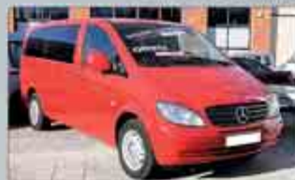
Mercedes Vito Combi Larga III CDI Año 2007. 2 Airbags. ABS. ESP. Climatizador. Cristales tintados. 2 AÑOS DE GARANTÍA. 21.500 €