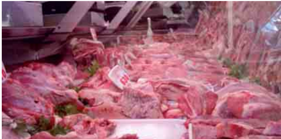
Expositor de productos cárnicos con despieces procedentes de carne porcina.

GRUPE PORCINA | 49 alumnos de 3º de Enfermería llegan de Cancún