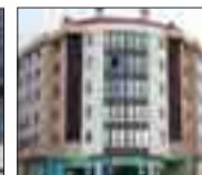
ZONA VILLAMAR SUR Apartamento de 70 m 2 aproximados. 2 dormitorios, 2 baños. Garaje y trastero. Excelente altura y orientación.