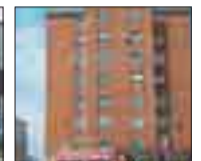
AV. CONSTITUCIÓN-ELADIO PERLADO Piso para reformar de 90 m 2 aprox. 3 dormitorios. Exterior. Trastero.