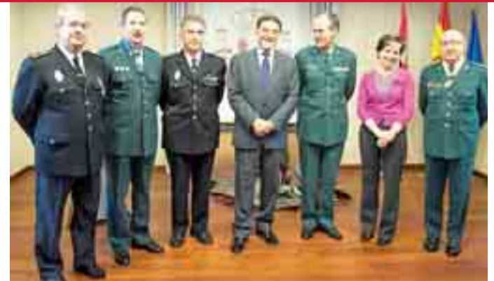
La entrega de medallas se celebró en la Subdelegación del Gobierno.