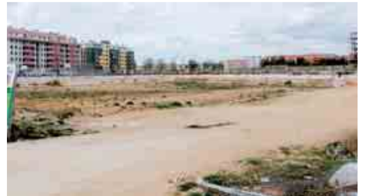
Lugar donde está prevista la construcción del centro cívico.