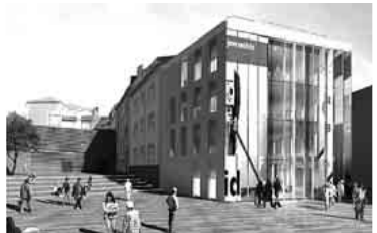
La fachada principal, que mira a la Catedral, es móvil, reversible.

El Jurado acordó también conceder tres menciones especiales a los proyectos 'Vox Iuvenis', 'Afloa' y 'Ven y Verás' y un accésit dotado con 3.000 € a la propuesta 'Zozobra'. Precisamente, 'Afloa' fue el proyecto más votado por el público que visitó la exposición organizada en la FEC con todas las propuestas presentadas al concurso. Recibió 71 de los 675 votos emitidos.