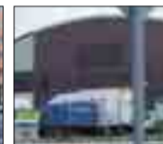
NAVES TAGLOSA (alquiler) Nave de 2000 m 2 . Totalmente diáfana. Altura aprox. 10 m. Oficinas, baños y vestuario. Parking a la entrada