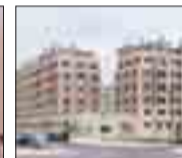
DOS DE MAYO Viviendas de 3-4 dormitorios. 2 baños. Garaje y trastero. A estrenar.