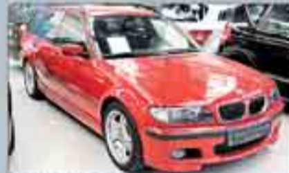
BMW 320 D Touring Año 2004. Paquete deportivo M. Climatizador bizona. Barras en el techo. Cierre centralizado. ABS. ESP. Elevación. Tapicería Alcántara.