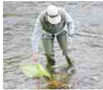
Mediante una red se hace la recogida de invertebrados.