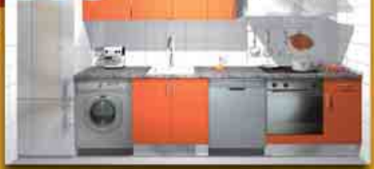
Fronte de cocina de 3,60 m. con muebles altos de 90 cm. Electrodomésticos y accesorios no incluidos

*Oferta de electrodomésticos válida durante el mes de mayo de 2009