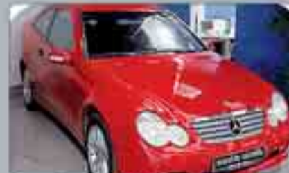
Mercedes C 180K Sport Coupe Año 2004. 8 Airbags. ABS. ESP. Climatizador. Dual. Radio/CD. Mandos en volante.