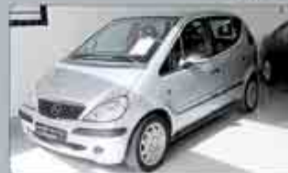
Mercedes Clase A 170 TDI Año 2002. Varias Unidades.