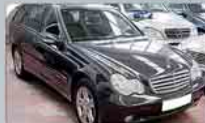
Mercedes C220 CDI Wagon Año 2001. 8 Airbags. Climatizador Bizona. ABS. ESP. Radio/CD. Xenón. Llantas.