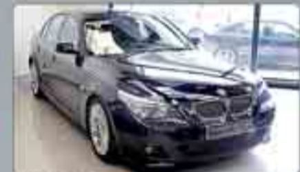
BMW 545 Iny. Año 2005. Automático. 8 Airbags. ABS. ESP. Cierre. Navegador. Paquete Deportivo M. Pintura metálica.