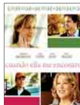
CUANDO ELLA ME ENCONTRÓ. Dir. Helen Hunt . Int. Helen Hunt, Bette Midler, Colin Firth . Comedia dramática.