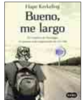
BUENO, ME LARGO Hape Kerkeling.