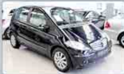
Mercedes Clase A Gasolina y Diesel Varias Unidades. Años 2005-2008.