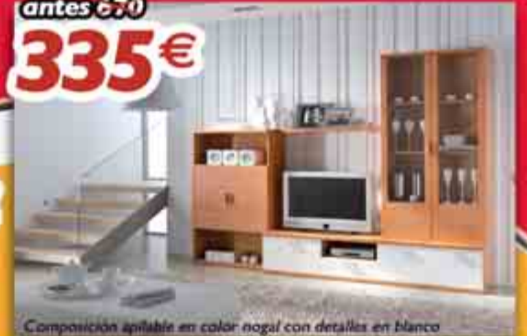
Composición apilable en color nogal con detalles en blanco