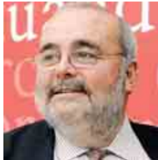
Javier Gómez Navarro en el almuerzo-coloquio.

En la cita, celebrada el lunes 11 en el Hotel NH La Merced, Gómez Navarro presentó su conferencia 'Propuestas para salir de la crisis'. Entre las medidas propuestas a corto plazo destacó la puesta en marcha de una instalación que absorba los créditos de riesgo y una reducción en las cuotas de la Seguridad Social, "para fomentar la contratación y acabar con la des-