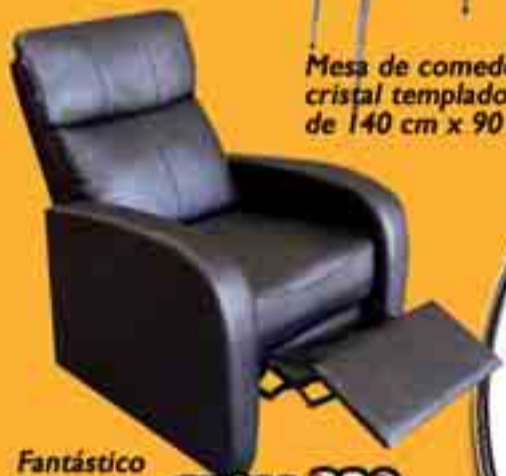
Fantástico sillón relax en Ecopiel ¡Y a qué precio!