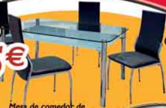
Mesa de comedor de cristal templado de 12 mm de 140 cm x 90 cm