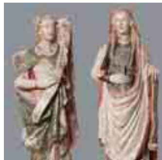
Anunciación de Caleruega.

La exposición puede visitarse en la concatedral de San Pe-