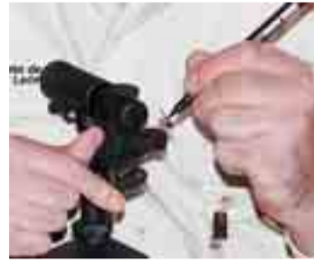
En el Aula del Río se explica cómo realizar una mosca para pescar.

to-medio plazo, un Centro de Interpretación del Agua. Este centro contará con sala de exposiciones, sala de audiovisuales, laboratorio, oficina de atención al cliente, biblioteca, sala de Internet y calefacción, importante para impartir las