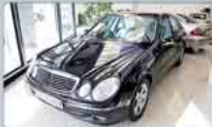
Mercedes E 280 4 Matic Avangarde Año 2005. 8 Airbags. Climatizador Bizona. Bixenón. Parktronic. ABS. ESP. Suspensión Neumática.