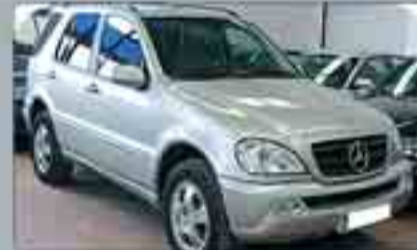
Mercedes ML 270 CDI Varias unidades.