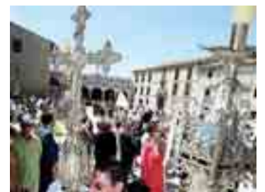
Imagen de archivo de la celebración del Curpilllos.

La fiesta del Curpilllos, la celebración más tradicional de la ciudad de Burgos, opta a convertirse en Tesoro del Patrimonio Cultural Inmaterial de España promovido por Bureau Internacional de Capitales Culturales. También son candidatos el Filandón de León, la leyenda del Lagarto de la Malena de Jaén y el Txistu del País Vasco. Pág. 3