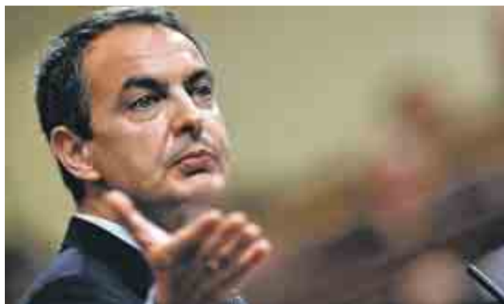
Zapatero, durante su intervención en el debate sobre el Estado de la Nación.

El Presidente, que reconoció haberse "equivocado en algunas previsiones", centró su discurso en las medidas aprobadas por el Gobierno sobre todo el Plan E