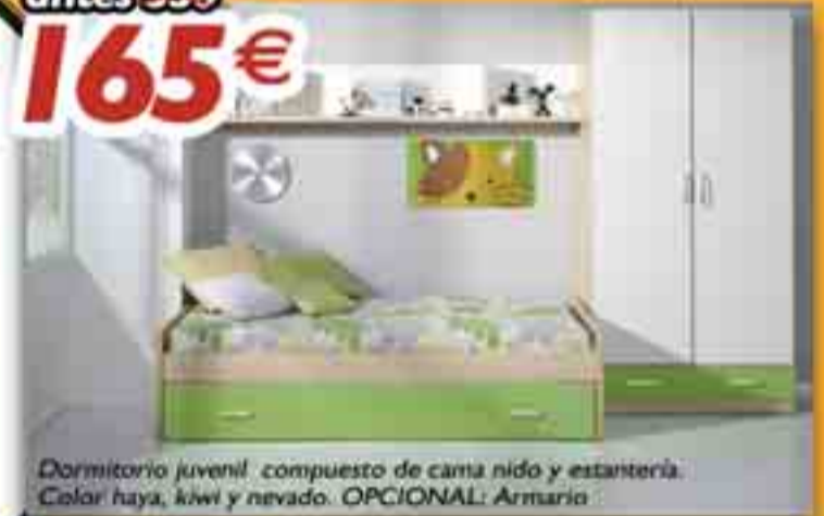
Dormitorio juvenil compuesto de cama nido y estantería. Color: haya, kiwi y nevado. OPCIONAL: Armario