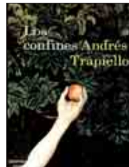
LOS CONFINES Andrés Trapiello. Novela.

Luz y Vida Arco del Pilar, 8 (Lain Calvo)