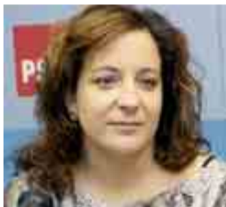
La eurodiputada socialista Iratxe García.

Uno de los pilares en los que se centrará el programa del Partido Socialista es en el gasto social, destacó Iratxe García, quien se detuvo especialmente en la importancia de atender las necesidades de los trabajadores españoles. García añadió que el PSOE atenderá las necesidades y los requerimientos de las per-