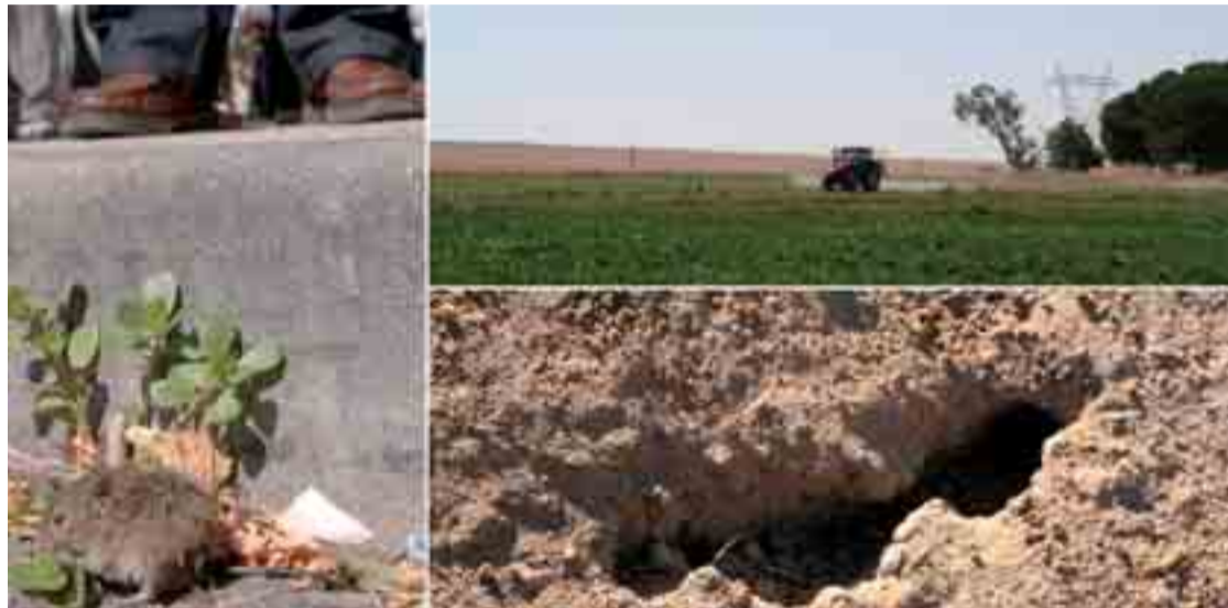
Efectos de la plaga de topillos y su tratamiento posterior en los campos de Castilla y León.

También está prevista la aprobación de otros seis nuevos procedimientos para las plagas del jopo, la flavescencia dorada de la vid, el moteado de los frutales, la rhizotonia, los hongos de la madera de la vid y el gusano cabezudo en frutales.