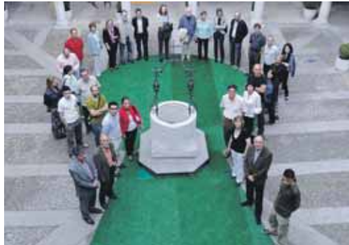
Momento de la inauguración de la exposición.

Con el hilo conductor de la "bocallave" como referencia y pretexto de la muestra, 'A pedir de boca' es la última exposición de la trilogía en la que participan más de 260 autores. Se pueden ver obras de autores consagrados, junto con otros, menos reconocidos, así como autores noveles y aficionados.