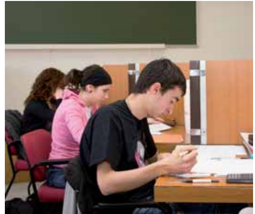
Un estudiante se prepara para una oposición.

En lo referente a los cursos técnicos del ámbito de la FP clásica como soldadura, mantenimiento, reparación de ordenado-