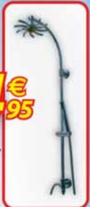
Kit de ducha "Aspa" •Latón, inversor 2 posiciones: cabezal de ducha orientable y ducha de mano.