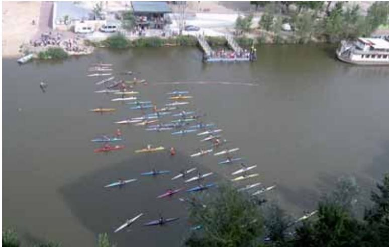
Imagen panorámica de una prueba de piragüismo disputada en el río Pisuerga.

Fin de semana plagado de actividades para todas las edades