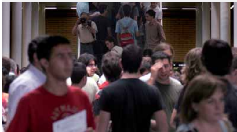
Las prácticas de empresa se han convertido en una gran oportunidad para encontrar una salida laboral.