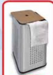
Cesto ropa •50 L. Acero y madera.