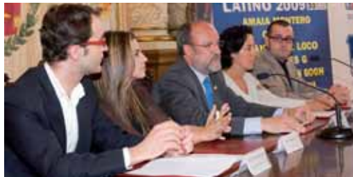
La cantante Lena junto al alcalde y representantes del Festival y Brugal.

El cantante almeriense interpretará un único tema ('Aquí estoy yo') con Luis Fonsi, que junto a Amaia Montero, Laura Pausini, Lena, La Oreja de Van Gogh, Camila y Hombres G estarán sobre el escenario del estadio José Zorrilla a partir de las 19.00 horas. Cuando faltan 15 días para la celebración del Festival son más de 18.000 las entradas vendidas, de las cuales un 60% se han vendido fuera de Valladolid y en todas las comunidades autónomi-