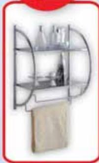
Estantería con portatealías •45 x 54,5 x 26 cm. Metal cromado.