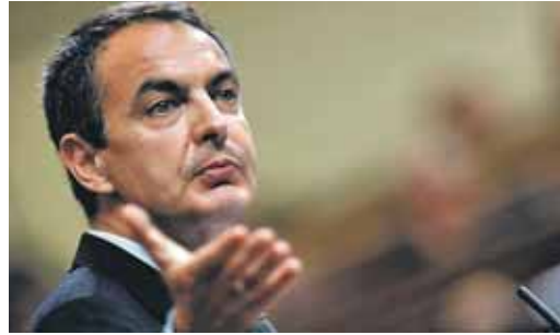
Zapatero, en una de sus intervenciones del martes.

El Presidente, que reconoció haberse "equivocado en algunas previsiones", centró su discurso en las medidas aprobadas por el Gobierno sobre todo el Plan E