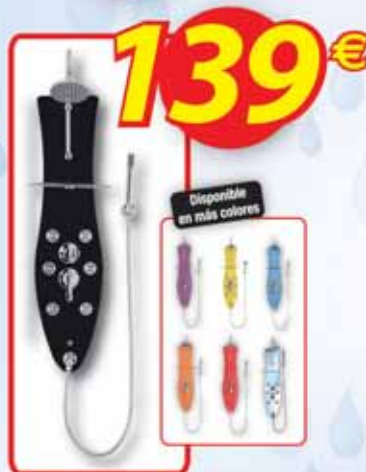
Columna ducha hidromasaje "Black" •110 x 28 cm. •Cuerpo de cristal securizado. •Inversor 3 posiciones: cabezal de ducha orientable, ducha de mano y 6 salidas laterales. •Grifería monomando y repisa de cristal.