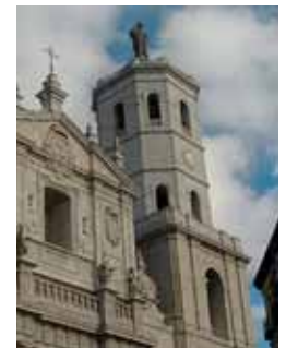
Vista de la Torre de la Catedral.

El acceso a estas vistas sería pagando. Además, su apertura coincidiría con la restauración del exterior de la Colegiata de Santa María, en la plaza de Portu-galeta.