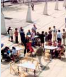
Celebración del año pasado.

■ La Parroquia de Nuestra Señora del Henar celebra un año más los días 16 y 17 de mayo el Pincho Solidario (el 16 por la tarde y el 17 durante todo el día). El precio de una tapa y una bebida será de un euro. Además se celebrará un mercadillo, rifas y bailes de salón. El dinero recaudado se destinará íntegramente para construir un colegio en Timor Oriental.