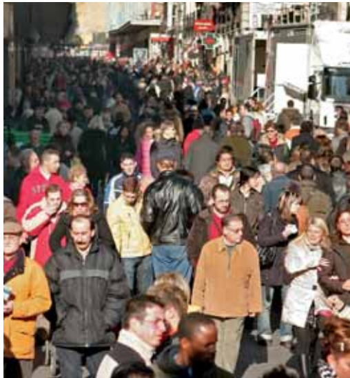
Casi 10.000 vallisoletanos viven fuera de su tierra de nacimiento.

do por los vallisoletanos es América, donde residen 4.409 personas, gracias sobre todo a Argentina (1.379), Venezuela (584), Brasil (400), EEUU (494), México