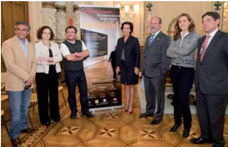
Momento de la presentación del Día Internacional de los Museos.

Jornadas de puerta abiertas y visitas guiadas servirán para celebrar el Día Internacional de los Museos, el 18 de mayo