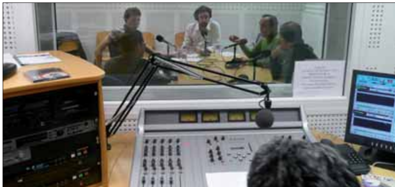
El programa de prácticas de la UEMC permite un rápido acceso al mercado laboral.

El informe se desarrolla dentro de las actividades del Observatorio de Empleo del COIE y del Vicerrectorado de Espacio Europeo y Empleo. "Mediante estos estudios se pretende recopilar la información relevante sobre el acceso al mercado de trabajo de todos los egresados de la UEMC, con el objetivo de conocer el perfil del egresado de cada una de las titulaciones oficiales de la UEMC, así como de la universidad en general, además de obtener una visión que los propios titulados tienen de algunos aspectos claves de su inserción laboral y de la formación recibida en la UEMC, asimismo se pretende obtener un