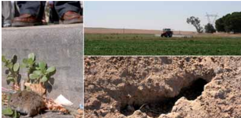
Efectos de la plaga de topillos y su tratamiento posterior en los campos de Castilla y León.

Entre los objetivos de este Plan se encuentra prestar un servicio directo a los agricultores de la región que les permita una rápida respuesta ante las plagas que se puedan presentar en sus cultivos. Las principales plagas agrícolas de Castilla y León son la polilla del racimo, la nefasta del cereal, la bacteriosis del guisante, los nematodos de la patata, el topillo campesino y el fuego bacteriano. También está prevista la aprobación de otros seis nuevos procedimientos para las plagas del jopo, la flavescencia dorada de la vid, el moteado de los frutales, la rhotoctonia, los hongos de la madera de la vid y el gusano cabezudo en frutales.