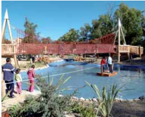
Valle de los Seis Sentidos.

Un total de 3.779 turistas se han acercado en el fin de semana del 9 y 10 de mayo a alguno de los siete centros turísticos que la Diputación Provincial de Valladolid mantiene abiertos en la provincia. Las preferencias de los visitantes se han decantado por el Valle de los Seis Sentidos (especialmente vallisoletanos y castellanos y leoneses), en Renedo, con 844 entradas registradas en estos dos días. Le siguen el Museo Provincial del Vino de Peñafiel (preferido por madrileños, catalanes y cántabros), con 770 visitas; la Villa del Libro de Uruña, que ha recibido la visita de 681 personas y, en cuarto lugar, el Canal de Castilla, que ha acogido 634 personas en ese fin de semana. La Finca Matallana, con 480 visitas, el Museo de las Villas Romanas,