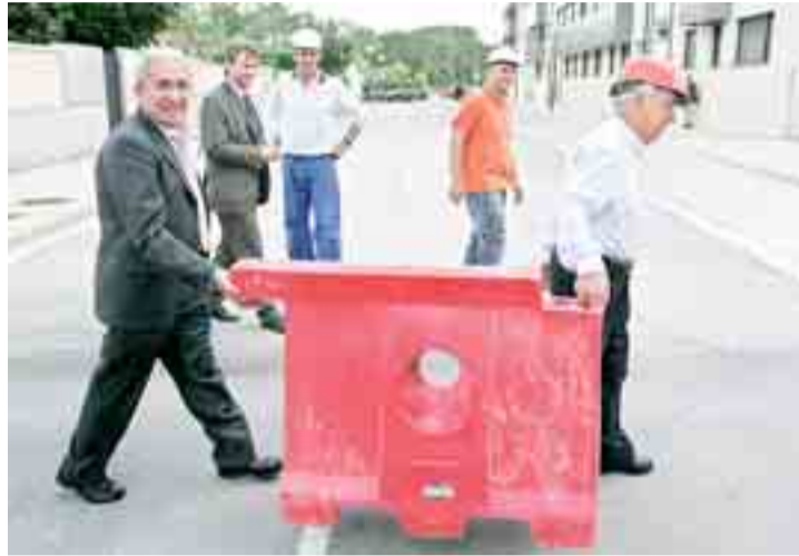
Puesta en servicio del nuevo vial de prolongación de San Pedro Cardaña.

Las obras de prolongación de la calle San Pedro Cardaña han supuesto la construcción de 85 nuevos metros en San Pedro Cardaña y 55 metros en la carretera de Cortes. La actuación ha consistido en la demolición de los edificios fuera de ordenación, así como la realización de los movimientos de tierra necesarios para realizar la sección del firme de la nueva calle, y la conexión con la carretera de Cortes.