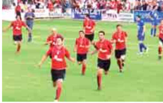
Los rojillos tienen pie y medio en tercera ronda.