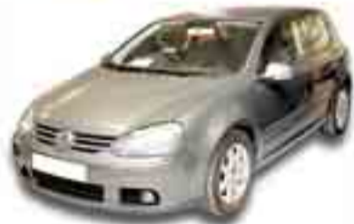
VOLKSWAGEN GOLF 2.0 TDI SPORTLINE 140 cv. Año 2004. ABS. ESP. CL. EE. Cambio 6 vel.