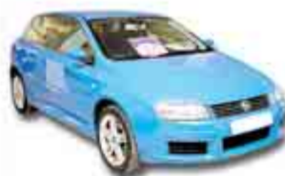
FIAT STILO 2.4 ABARTH SELESPEED 170 cv. Año 2003. ABS. CL. DA. Control de velocidad. DA.