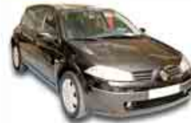
RENAULT MEGANE 1.5 DCI 85 cv. Año 2006. ABS. AA. CC. DA. EE.