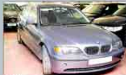
BMW Serie 3 Varias unidades.