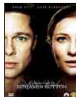
EL CURIOSO CASO DE BENJAMIN BUTTON. Dir. David Fincher. Int. Brad Pitt, Cate Blanchett. Drama romántico.