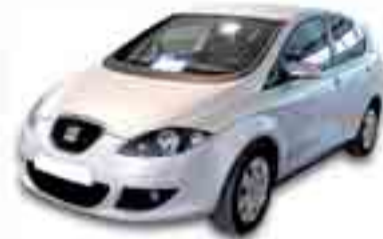
SEAT TOLEDO 2.0 TDI 140 cv. Año 2006. ABS. TCS. ESP. CL.