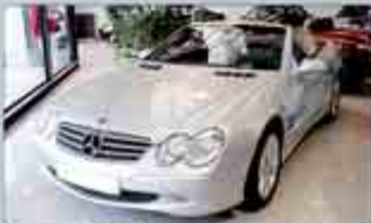
Mercedes S1 380 Cambio automático. Navegador. Cuero. Alarma. Bixenon. Teléfono.