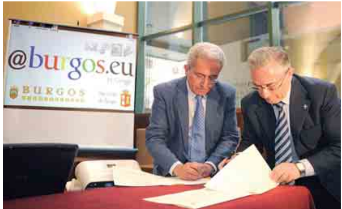
Presentación del nuevo dominio en el Monasterio de San Agustín.

mail gratuito permite la posibilidad de utilizar otra serie de herramientas informáticas de Google, como Chat o intercambio de documentos en la web.