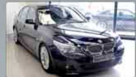
BMW 545 Iny. Año 2005. Automático. 8 Airbags. ABS. ESP. Cuero. Navegador. Paquete Deportivo M. Pintura metálica.