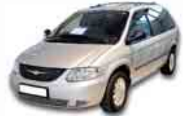
CHRYSLER VOYAGER 2.5 CRD 143 cv. Año 2004. ABS. ESP. CL.