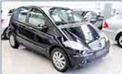
Mercedes Clase A Gasolina y Diesel Varias Unidades Años 2005-2008.