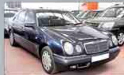
Mercedes Clase E Varias Unidades. 1 año de garantía