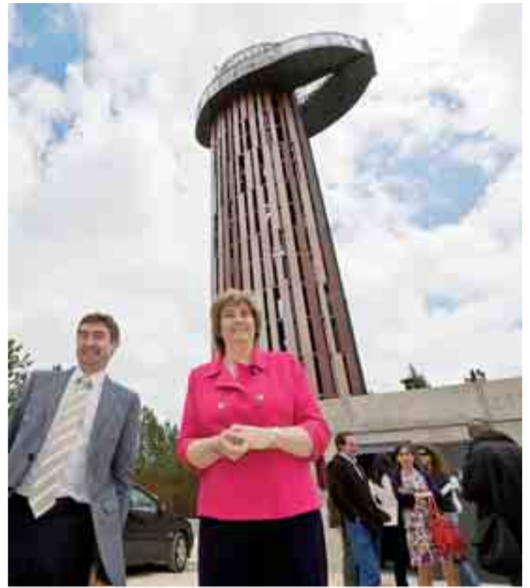
La altura de observación de la torre alcanza los 20,45 metros.

La Consejería de Medio Ambiente ha celebrado los días 9 y 10 de junio en los municipios de Quintanilla del Rebollar y Medina de Pomar las VI Jornadas sobre la defensa contra incendios forestales en Castilla y León dirigidas a los medios de comunicación.