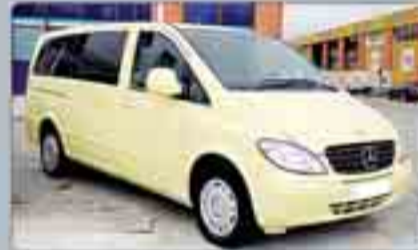
Mercedes-Benz Vito Combi L 111 CDI 116 cv. Año 2007. Lunas tintadas. Climatizador. Doble Airbag. DA. EE y plazas. Paragolpes y molduras color carrocería. Radio/CD. Bluetooth.