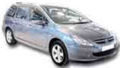
PEUGEOT 307 2.0 HDI 136 cv. Año 2005. ABS. CL. EE.

Grupo Julián Auto tiene coches perfectos para ti, perfectos para todos