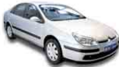
CITROËN C5 1.6 HDI 110 cv. Año 2005. ABS. ESP. CL. Espejos eléctricos.