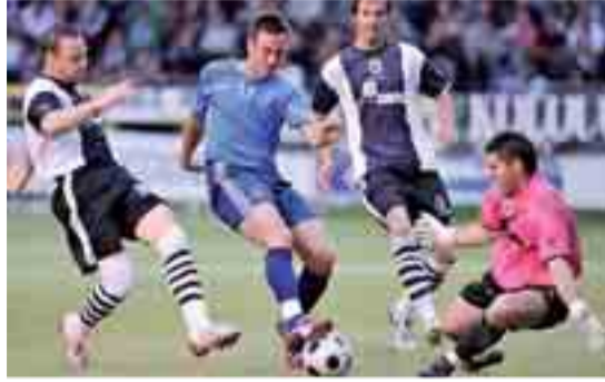
Los jugadores del Burgos deben mejorar en Mahón.