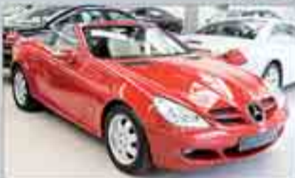
Mercedes SLK 200 K Año 2006. Cuero. Cambio automático. Alarma. Climatizador. ESP. ABS. BASS. Cierre centralizado. 2 años de garantía.