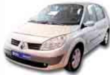
RENAULT MEGANE SCENIC 1.5 CDI 100 cv. Año 2004. ABS. CC. CL. DA. EE. LL/AL.