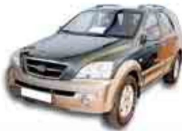
KIA SORENTO 2.5 CRDI 145 cv. Año 2005. Espejos eléctricocalefactados. ABS. AA.