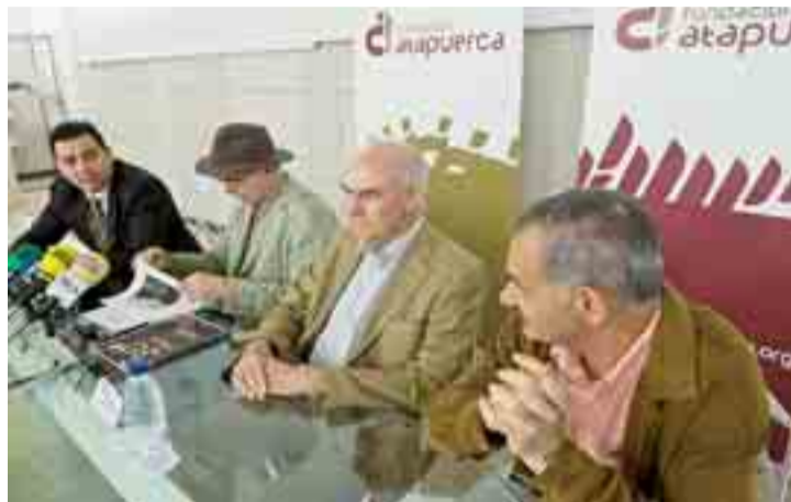
Presentación de ‘30 años de emociones y evolución’ en Ibeas.

‘30 años de emociones y evolución’ es una exposición fotográfica que cuenta, a modo de viaje, el recorrido en imágenes de las excavaciones de Atapuerca desde 1979 hasta 2009. La muestra podrá visitarse en la sala de usos múltiples de la Fundación Atapuerca, en Ibeas de Juarros (carretera de Logroño) desde el 25 de junio