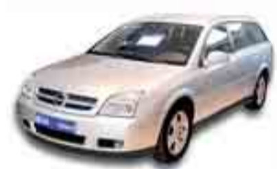
OPEL VECTRA 1.9 CDTI SW 120 cv. Año 2004. ABS. ESP. Cambio 6 velocidades. CL. DA. EE.