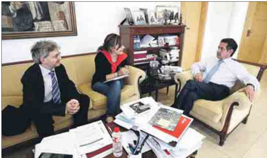
El presidente Miguel Ángel Revilla, en un momento de la entrevista concedida a 'Gente'.

De aquí se va a salir. Esto es una coyuntura mundial y donde prime-