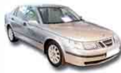
SAAB 95 2.2 T1D LINEAR 125 cv. Año 2003. ABS. CL. EE. LL/AL.