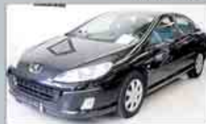
Peugeot 407 HDI Año 2005. 9 airbags. ABS. ESP. Climatizador. Radio/CD. Dirección asistida. Elevalunas.