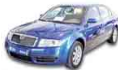
SKODA SUPERB 2.0 TDI 140 cv. Año 2005. ABS. ESP. Cambio 6 velocidades. CL.