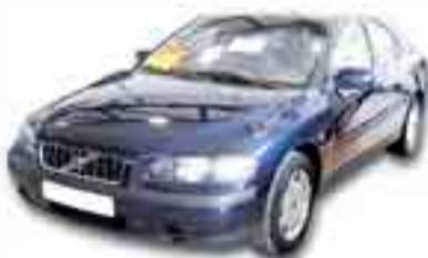
VOLVO S60 2.400 CC 170 cv. Año 2001. ABS. AA. CC. DA. EE.