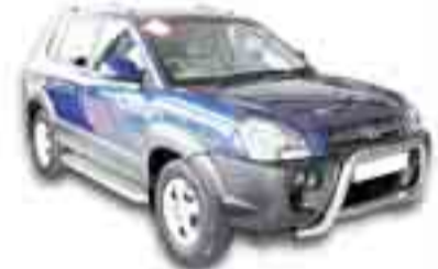
HYUNDAI TUCSON 2.0 CRDI 4X2 Año 2005. EE. CC. AA. DA.