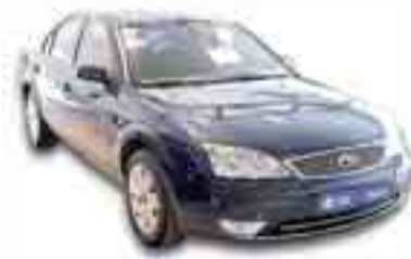
FORD MONDEO 1.8 FUTURA 125 cv. ABS. CL. EE.