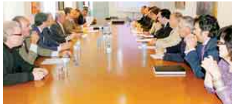
Reunión de los miembros del Patronato de la Fundación Burgos 2016.

La Fundación Burgos 2016 dispone de un presupuesto ya concreto hasta 2011 de un millón de euros.