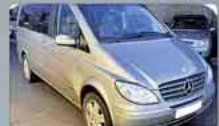
Mercedes Viano Mixta Adaptable Año 2008. DO. CC. EE. Cama. ABS. SP. Sensor lluvia y luz. Radio CD. 2 años de garantía.