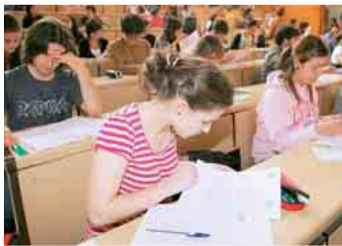
En total se examinaron en la provincia 1.203 burgaleses.

Éste es el último año en el que se seguirá este método. A partir