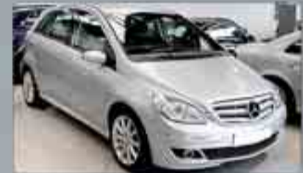
Mercedes-Benz Clase B 100 CDI Automático. Año 2008. Paquete deportivo. Alarma. Llantas de aleación. Climatizador. Trón de coche deportivo. Radio/CD. Prestación de teléfono.