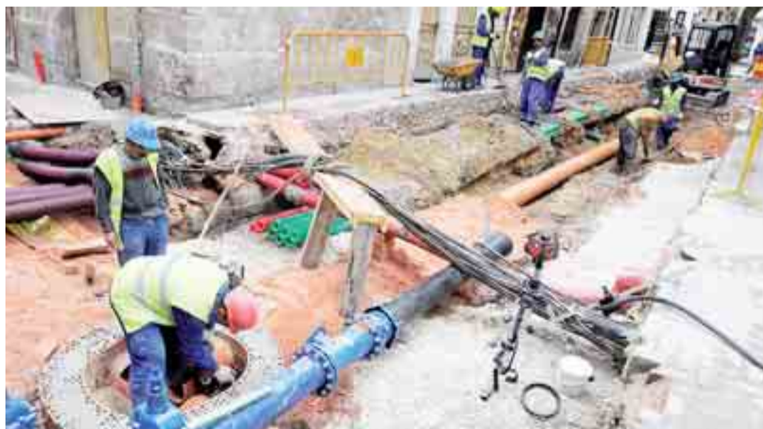
Comienzo de las obras de peatonalización en la calle Arco del Pilar, entre San Lorenzo y Laín Calvo.

El próximo lunes, 15 de junio, comenzarán las obras de construcción de una nueva rotonda en la carretera de Valladolid, en la zona de Bakimet, próxima a la Univer-