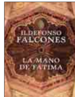
LA MANO DE FÁTIMA. Ildefonso Falcones. Novela.

Luz y Vida Arco del Pilar, 8 (Lain Calvo)