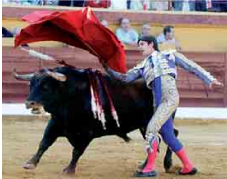
Sebastián Castella comparte cartel con 'El Cid' y Perera el 1 de julio.

En cuanto a los carteles los hay para todos los gustos: no faltarán los Ponce, Juli, doblete merecido de Perera, Cayetano, Manzanares, El Cid, Castella y Padilla, que son fijos en todas las ferias; los locales Ramos- en el cartel de banderilleros con Fundi y Ferrera- y Morenito de Aranda; los mediáticos con El Fandi; y los debutantes Cortés y Bolívar. Las principales figuras se concentran en los carteles del 29 de junio y 1 y 2 de julio, que junto con el del día 30 de