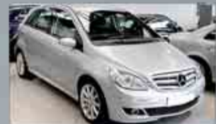
Mercedes-Benz Clase B 100 CDI Automático. Año 2008. Paquete deportivo. Alarma. Llantas de aleación. Climatizador. Trón de coche deportivo. Radio/CD. Prestación de teléfono.