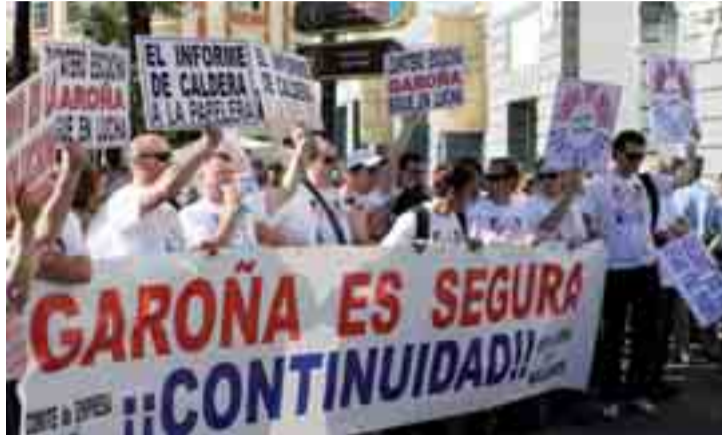
Trabajadores de Garoña se manifiestan en Madrid frente al Congreso.

El debate sobre el estado de la región se inició como todo el mundo esperaba: discurso del presidente con multitud de proyectos de ley y planes especiales y estratégicos, seguido de la intervención de la portavoz socialista con ofrecimiento de algún pacto y críticas a la gestión del gobierno regional. Todo transcurrió como marcaba el guión, incluso el hilo conductor: la crisis económica. Pues bien, en esta ocasión el debate ha deparado acontecimientos excepcionales. En primer lugar, Juan Vicente Herrera admitió que las políticas de población no han sido buenas y anunció un cambio en ellas. El presidente acometió todos los temas que preocupan a la sociedad: educación, sanidad, colaboración con el Gobierno central, las competencias del Duero, los servicios públicos, la TDT, el empleo joven, la vivienda, etc. El debate se animó en los tur-