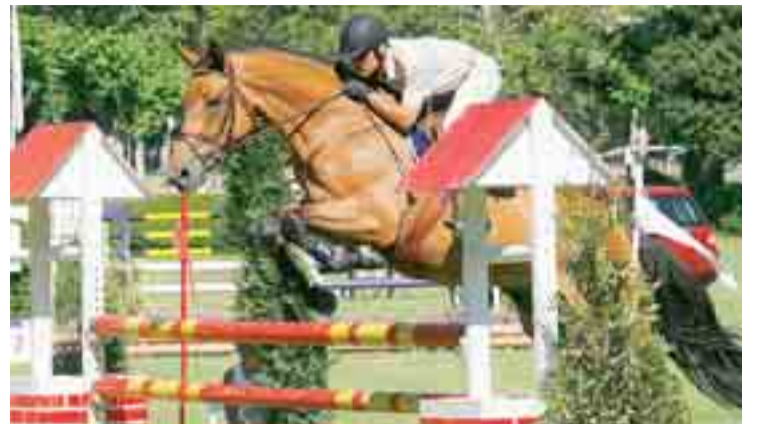
La Ciudad Deportiva Militar acogerá el Concurso Hípico Nacional.

El Teatro Clunia, por su parte, será la sede del IV Festival cultural de capoeira, donde se invita a los asistentes a llevar un kilo de alimentos no perecederos destinados al Banco de Alimentos de Burgos.