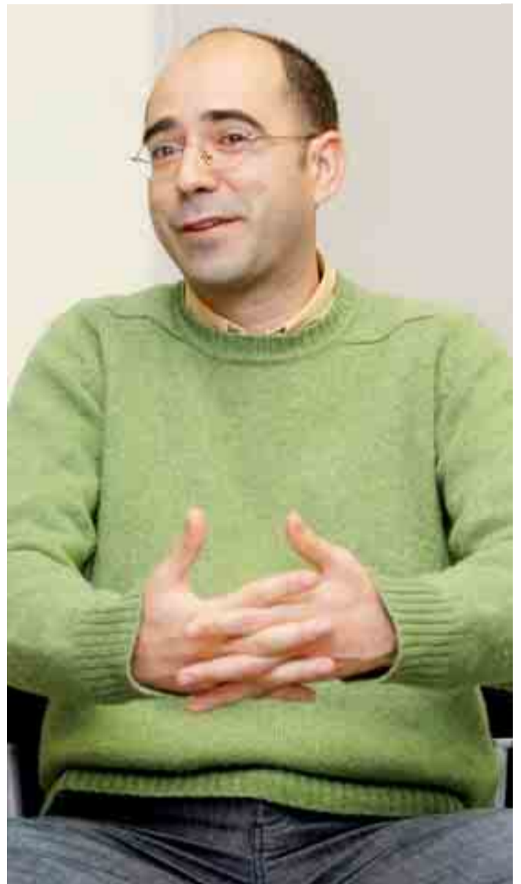
El escritor Óscar Esquivias, pregonero de las fiestas de Burgos 2009.

“Si estamos ya todos... ¿qué es lo único que falta para que empiece la fiesta, para que nos mezclemos y cantemos? Amigas sampaulinas, amigos sampeditos, esto no hay quien lo pare; ¿Qué empiece la diversión! ¡Buenas fiestas a todos!”