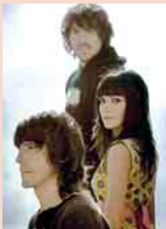
27 JUNIO. 00.15 H. El Sueño de Morfeo