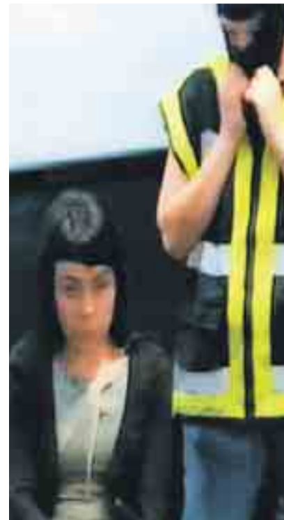
Detenciones en Guipúzcoa.