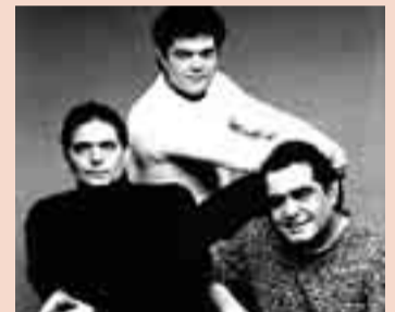
4 JULIO. 00.15 H. Los Chichos

El aparcamiento del Centro Comercial Camino de la Plata acoge como cada año los conciertos de los Sampedros, uno de los actos que más burgaleses reúne y que más gusta entre el público.