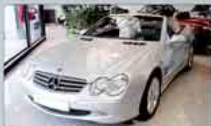
Mercedes S1 380 Cambio automático. Navegador. Cuero. Alarma. Bixenon. Teléfono.