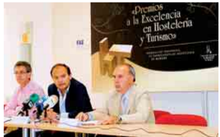
Presentación de los Premios de Excelencia en Hostelería y Turismo.

único premio de 3.000 euros y un trofeo y los trabajos pueden presentarse hasta el 30 de septiembre de 2009. En Burgos capital y provincia hay más de 3.000 hosteleros que pueden optar a este premio, que valorará criterios como la originalidad de la idea, su repercusión a nivel económico-social o la creación de empleo, entre otros.