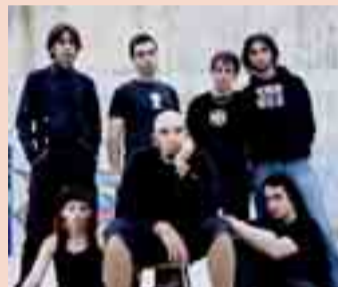
1 JULIO. 22.00 H. Noche Rock Joven