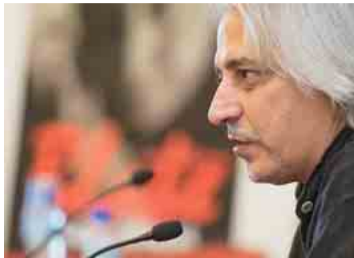
Anthony Blake durante la presentación de su espectáculo.

El famoso mentalista presenta en el Teatro Principal su espectáculo 'Más cerca' los días 29 y 30 de junio. Blake asegura que el show es "un homenaje a sus 26 años de carrera y a los lugares donde empezó."