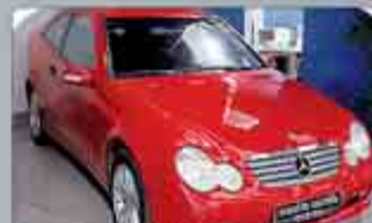
Mercedes C 180K Sport Coupe Año 2004. 8 Airbags. ABS. ESP. Climatizador. Dual Radio/CD. Mandos en volante.