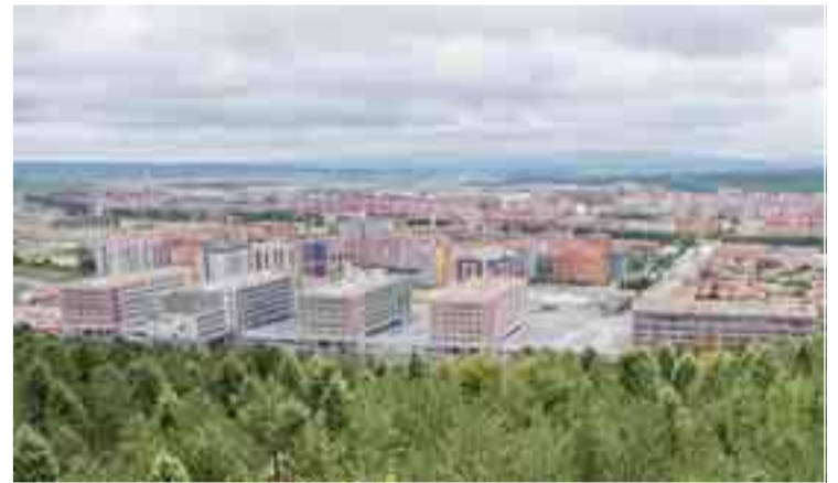
Aspecto de los trabajos de construcción del nuevo Hospital.

El complejo asistencial será también hospital universitario y se convertirá en centro de referencia en el ámbito de la Sanidad de Castilla y León.