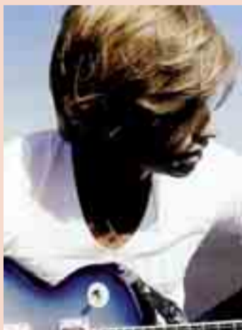
26 JUNIO. 00.15 H. Carlos Baute

Cantantes de siempre, de hoy, de ayer y también de mañana actúan estos días en el aparcamiento del Centro Comercial Camino de la Plata. La programación musical incluye estilos para todos los gustos