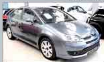
Citroën C4 HDI Año 2005. Acabado YTR. Llantas de aleación. Climatizador. ABS. ESP. Sensor de lluvia y luz.