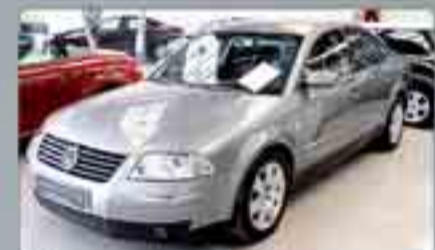
Volkswagen Passat TDI Año 2002. 130 cv. 6 airbags. ABS. ESP. Climatizador. Cargador de CD's. Elevonas.