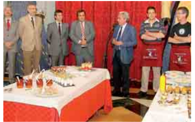
Presentación de las tapas en el Teatro Principal.

son: Plaza España, plaza Libertad, plaza Roma, Plaza Mayor, calle Paloma, Santocildes, plaza Santo Domingo y plaza Alonso Martínez. Este año desaparece la localización de la plaza Virgen del Manzano porque "es un espacio muy ventoso", dijo el vicepresidente de los hosteleros.