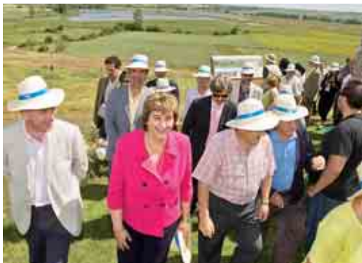
Los humedales crean un nuevo espacio ambiental y turístico en la zona.