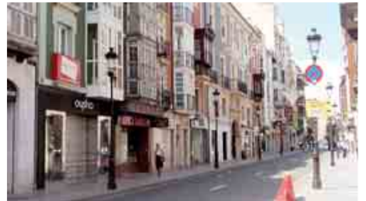
Santander, céntrica calle comercial en el Centro Histórico.