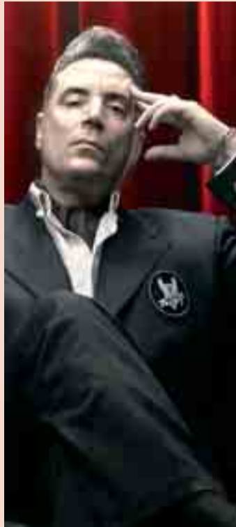
28 JUNIO. 00.15 H. Loquillo