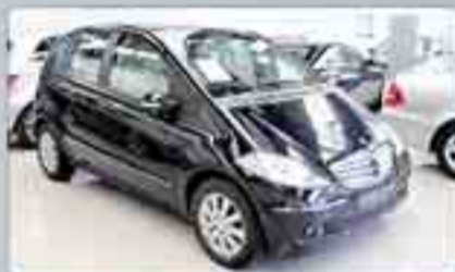
Mercedes Clase A Gasolina y Diesel Varias Unidades Años 2005-2008.

Les esperamos en la Feria VO de Aranda de Duero el 27 y 28 de junio