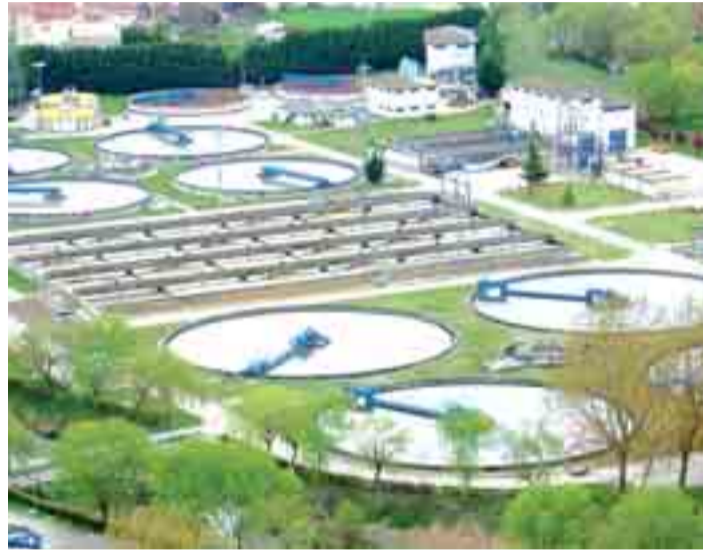
Imagen de la estación depuradora de Burgos.

do las necesidades de Castilla y León y establece una redistribución en cuanto a la fórmula financiera. En este sentido se mejora el borrador anterior y establece que el Gobierno de España financie un tercio de la inversión total", explicó Antonio Gato.