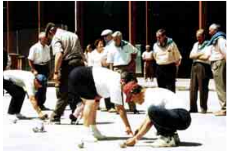
El juego de la petanca es uno de los tradicionales en Castilla y León.

La presentación del encuentro internacional contó también con la presentación del libro 'Juegos populares y tradiciones burgaleses', de los autores Carlos de la Villa y Ángela Gavilán, en el que desglosan las actividades deportivas y de juego más significativas de la provincia de