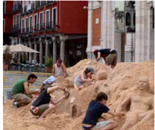
Escultura de exhibición realizada por De Ruyschner y Wierenga.

Los artistas tendrán que estar muy atentos al cielo ya que mucha parte del éxito depende de si llueve o no. De ahí que sea de gran importancia fijar la obra para que los elementos externos como pueden ser el aire o la lluvia no la destruyan antes de tiempo. Y es que todas las obras tienen que llegar en perfecto estado al domingo 14, momento en el que el jurado dictará su fallo a mediodía.