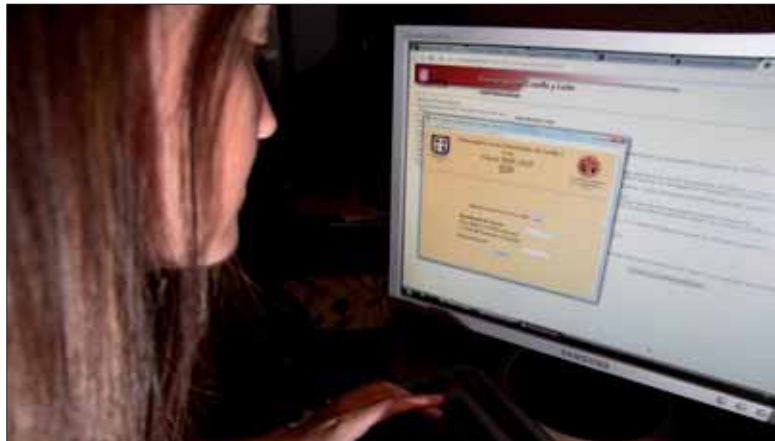
Una futura universitaria realiza la preinscripción para la UVa a través de la página web.