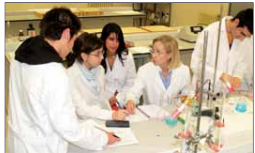
Los Grados suponen el uso de nuevas metodologías docentes.

DOBLES GRADOS. Los nuevos Grados adaptados al EEES de la UEMC abren la posibilidad a la Universidad Europea Miguel de Cervantes de ampliar su oferta académica con Dobles Grados, que permitirían a los alumnos conseguir dos titulaciones en menos de seis años, gracias al diseño de los nuevos planes de estudio. Estas titulaciones son Doble Grado en Administración y Dirección de Empresas y Turismo; Doble Grado en Administración y Dirección de Empresas y Publicidad y Relaciones Públicas; Doble Grado en Publicidad y Relaciones Públicas y Turismo; Doble Grado en Publicidad y Relaciones Públicas y Periodismo; Doble Grado en Publicidad y Relaciones Públicas y Comunicación Audiovisual; y Doble Grado en Periodismo y Comunicación Audiovisual.