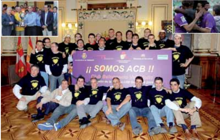
Los tres momentos más importantes de los equipos vallisoletanos durante esta temporada.

POLIDEPORTIVO REAL VALLADOLID, CB VALLADOLID Y PEVAFERSA