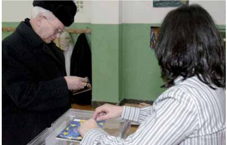
Los ciudadanos europeos estamos llamados a las urnas.

VOTO ELECTRÓNICO. En estas elecciones también se pondrá en uso el voto electrónico. Salamanca ha sido elegida, junto a Lleida y Pontevedra, para experimentar este procedimiento en el que la gestión de las tareas de la mesa electoral se realizará a través de herramientas informáticas. El CAE elimina posibles errores de transcripción, es más eficaz, porque facilita la localización de los electores en el censo, el recuento y el envío de datos y es más ecológico y barato, porque permitirá ahorrar en la cantidad de material impreso. Prueba de la trascendencia de la