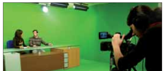
Las prácticas en empresa en la UEMC facilitan la inserción laboral.

"Estas son las herramientas más valiosas para dotar a los futuros profesionales de una experiencia previa,