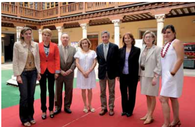
Foto de familia del jurado del IV Premio Cistobal de Villalón a la innovación educativa.

El primer premio está dotado con 6.000 euros y será para la Universidad de Santa Cruz, se han acordado cuatro finalistas