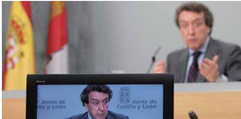
José Antonio de Santiago-Juárez durante una rueda de prensa posterior al Consejo de Gobierno de la Junta.

La ayuda se reparte de la siguiente manera: 82,84 millones de euros irán destinados al área de servicios sociales básicos; al área de actuaciones destinadas a personas dependientes, la Junta dedicará 3.089 millones de euros y, por último, la ayuda destinada a la inclusión social alcanza los 3,8 millones de euros. Finalmente, el área de acción social, recibirá 1,24 millones y la financiación del área de personas con discapacidad alcanzará los 2,03 millones de euros.