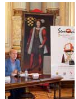
Momento de la presentación.

Los telefilmes se proyectarán en las salas del cine Roxy en tres pases (18.00, 20.00 y 22.00 horas) y el precio será de dos euros por sesión.