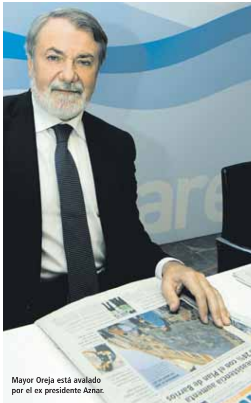
Mayor Oreja está avalado por el ex presidente Aznar.

“Nosotros apostamos por las familias, por la Educación, por políticas que no se instalen en la crisis económica como ha hecho Rodríguez Zapatero”