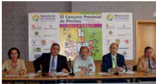
Momento de la presentación del XI Concurso Provincial de Pinchos.

Cada establecimiento presenta a concurso un mínimo de dos pinchos, que podrán ser degustado a un precio máximo de 1,5 euros la unidad. Habrá 95 pinchos para la categoría "caliente"; 71 para "frío"; 33 en el apartado "autéctono"; 25 en la modalidad "postre"; 4 para el premio "Mahou" y 6 para "Coca Cola". Vallsur también se ha sumado este año a esta iniciativa y regalará vales canjeables por tapas cuando se superen los 50 euros de compra en el Centro Comercial. El día 15, en el teatro Calderón, se