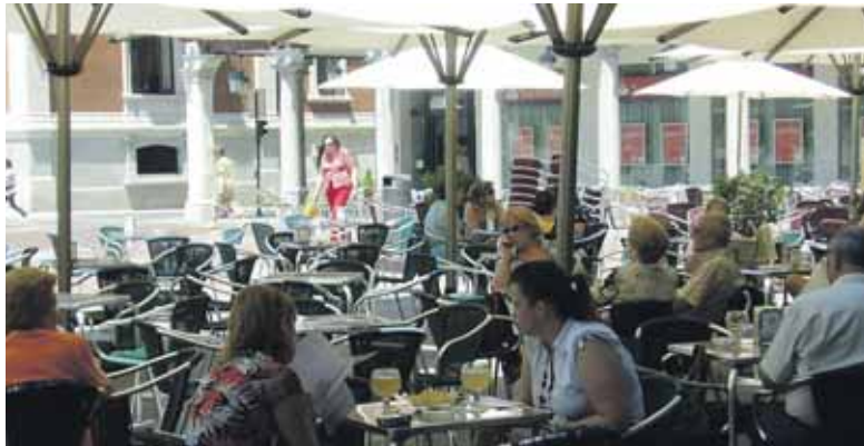
La Plaza Mayor se llena todos los veranos de terrazas.

Aunque muchos cambios se expliquen por modificaciones en las fechas de apertura y relevos en la titularidad de los locales, la evolución de licencias certifica el menor interés de los hosteleros vallisoletanos por exponer su patrimonio a los caprichos de las inclemencias del tiempo con las terrazas. Hace dos años, el Ayuntamiento dio luz verde a cerca de 600 terrazas. En