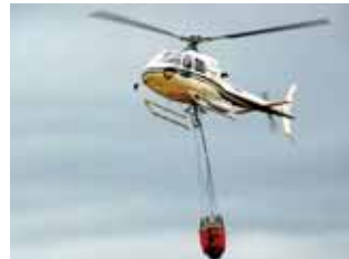
El aparato se acerca a la zona de riesgo.