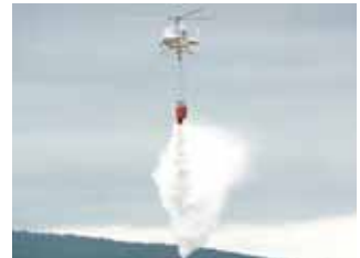
El helicóptero deja caer el agua sobre la zona en la que hay fuego.