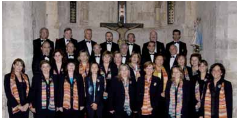
Los miembros de la Coral Támara posan en el ábside de la Iglesia de San Juan en Arroyo.