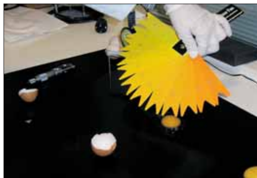
Los alumnos podrán evaluar tanto la calidad como la seguridad.