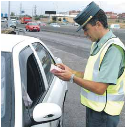
Control de la Guardia Civil de Tráfico.

La reforma va ahora de camino al Senado, antes de su entrada en vigor, previsiblemente en el próximo mes de marzo o abril. La intención del Gobierno es ponerlo más difícil a los malos conductores y así, por ejemplo, cualquier conductor con dos multas pendientes por infracciones graves o muy graves no podrá realizar gestiones relacionadas con el vehículo del que es titular, o se endurecen las sanciones por exceso de velocidad (cien euros desde el primer kilómetro de exceso). Por el contrario, la ley será más suave en infracciones leves como parar en un carril bus, que ya no restará puntos. Sin embar-