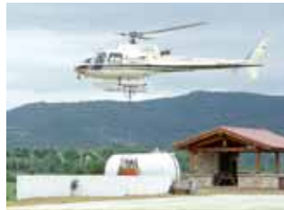
El helibalde recoge los 1.000 litros de su capacidad.