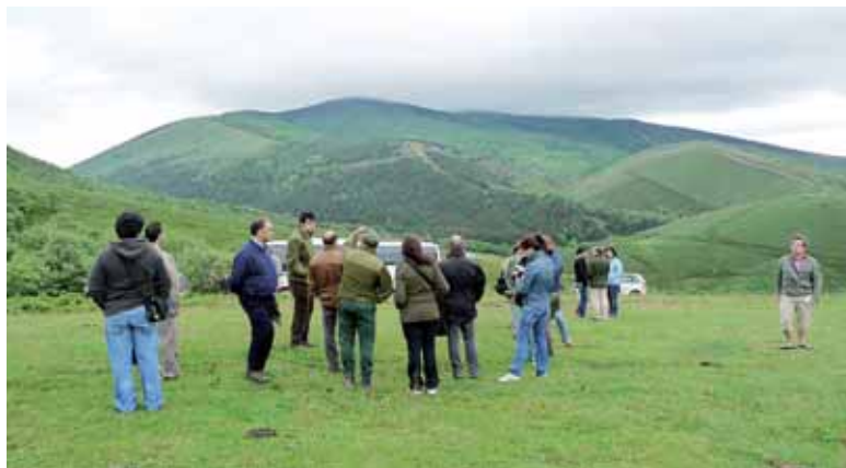
Este plan se desarrolla en Las Merindades (Burgos), Valle del Tiétar (Ávila) y el oeste de León y Zamora.

Las primeras labores para solucionar el problema se concretaron en subvenciones directas del Gobierno regional a los ganaderos. Cada uno de ellos suscribe un contrato de aprovechamiento, mediante el cual obtiene una parcela concreta en un monte de titularidad pública. El compromiso de los ganaderos radica en la obligación de invertir las ayudas regionales en el cuidado de la zo-