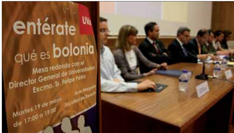
Durante este curso se han realizado múltiples actos para informar sobre el Plan de Bolonia.

De las 42 titulaciones mencionadas, ocho cuentan ya con el informe favorable para su posible implantación (Educación Social, Educación Infantil, Educación Primaria, Geografía y Ordenación del Territorio, Historia y Ciencias de la Música, Matemáticas, Estadística e Informática de Servicios y Aplicaciones, esta última en el campus de Segovia). Dos grados están pendientes del informe definitivo (Sistemas de Comunicación y Telemática); otros dos se encuentran a la espera del informe provisional (Fisioterapia y el Grado en Informática del campus de Valladolid),