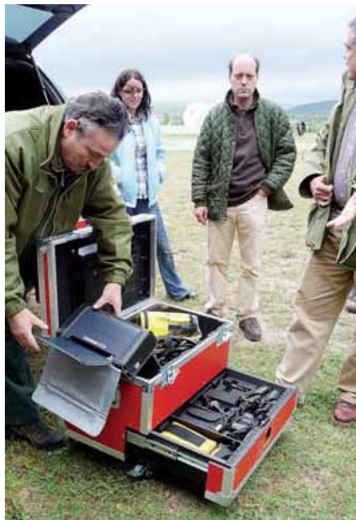
El 'Baúl Operativo' permite tener todos los recursos juntos.

Durante los días 9 y 10 de junio, la Consejería de Medio Ambiente organizó en la provincia de Burgos las VI Jornadas sobre la Defensa contra Incendios Forestales en Castilla y León dirigidas a los medios de comunicación, dentro de su estrategia de comunicación sobre incendios forestales.