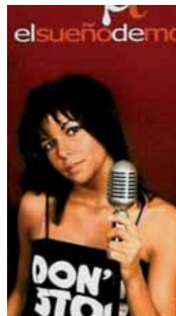
El Sueño de Morfeo.

Por último, para el sábado 12, un día antes de finalizar las fiestas, actuará El Sueño de Morfeo. La banda liderada por Raquel del Rosario (la mujer del piloto de Fórmula 1 Fernando Alonso), que lanzó su último trabajo el pasado 26 de mayo, interpretará temas como 'Si no estás', 'Quién te crees' o 'Gente'.