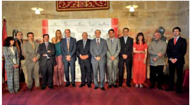
Foto de familia del presidente de la Diputación junto al premiado, las distinciones especiales y presentadores.