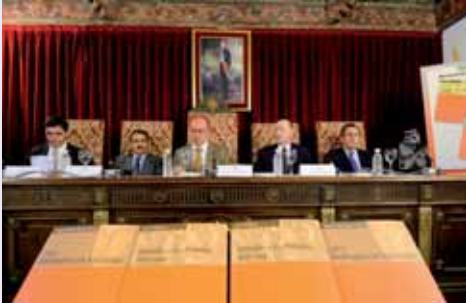
Momento de la presentación de las dos nuevas publicaciones.

'JORNADAS A LOS PIRINEOS (1659-1660)' Y '1812. WELLINGTON EN VALLADOLID'