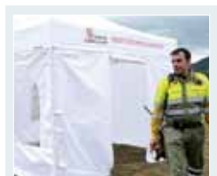
Puesto de Mando Avanzado.

"Lo fundamental es evitar que la gente corra riesgo"