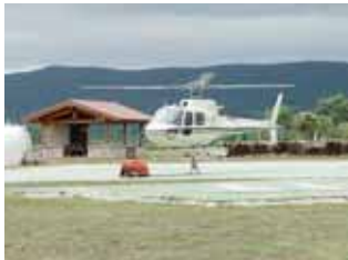
El helicóptero se dispone a despegar de la base de Medina de Pomar (Burgos).

CONSEJERÍA DE MEDIO AMBIENTE EL PLAN 42 HA CONSEGUIDO DISMINUIR LOS INCENDIOS UN 80% EN LOS ÚLTIMOS 10 AÑOS