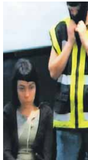
Detenciones en Guipúzcoa.