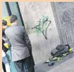
Los pobres, cada vez más.

La concurrencia de dos encuestas de esta semana lleva a una conclusión: hay menos ricos y más pobres. El descenso del número de ricos (20,9 por cien-