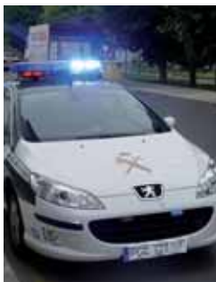
Coche patrulla de la Guardia Civil.

Las detenciones se han producido en Laguna de Duero y Valladolid.