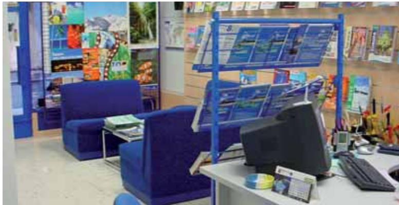
Las agencias de viaje lanzan numerosas ofertas para atraer a los clientes.

"Otros años la gente esperaba hasta el final para encontrar una buena oferta. Pero este año los hoteleros están lanzando grandes descuentos en venta anticipada, que se acumulan a los descuentos que ofrecen las agencias de viajes"