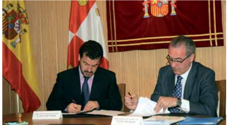
El alcalde de Aldeamayor de San Martín y el representante de Metrovacesa firman el acuerdo.

La Fundación de la Lengua gestiona actualmente diez Centros de Integración Local que en algunos de los casos cuentan con una población extranjera superior al 20% del censo.