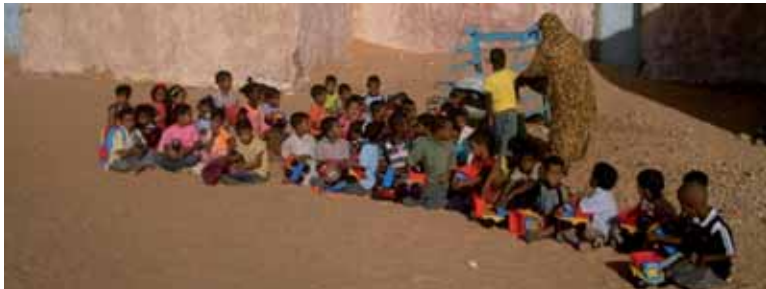
Niños saharauis en el campamento en Tinduf (Argelia).

La crisis no afecta a la solidaridad y se aumenta el número de acogidas. El sábado 26 llegará el primer avión desde Argelia.