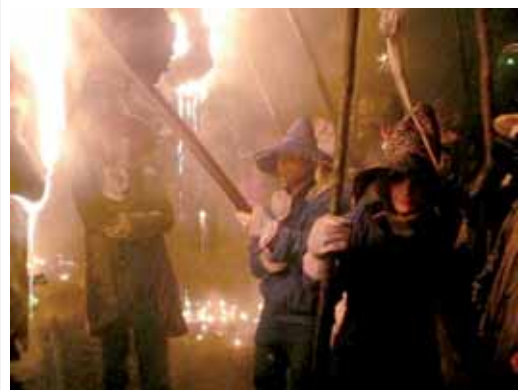
Fiesta del "Vitor" en Mayorga de Campos.

La elección de los 10 tesoros del Patrimonio Cultural Inmaterial de España la desarrolla el Bureau Internacional de Capitales Culturales con la voluntad de promover, divulgar, sensibilizar y salvaguardar el rico patrimonio cultural inmaterial español. Este patrimonio se define como los usos, representaciones, expresiones, conocimientos y técnicas que son reconocidos como parte integrante del patrimonio cultural.