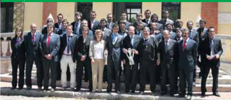
Foto de familia tras la recepción del presidente Herrera a la selección de Castilla y León de fútbol.