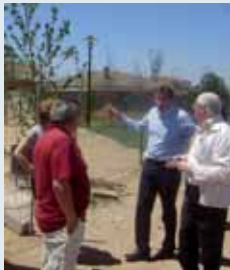
Visita socialista a Las Flores.

■ El Grupo Municipal Socialista denunció que el Ayuntamiento de Valladolid solo ha cumplido dos compromisos de los cuatro a los que se comprometió en 2004 con los vecinos de Las Flores. En concreto, se han cumplido la construcción del parque y del consultorio, "aunque no han supuesto mejora alguna" y no se han realizado abrir al tráfico la calle Margarita y la construcción de un aparcamiento.