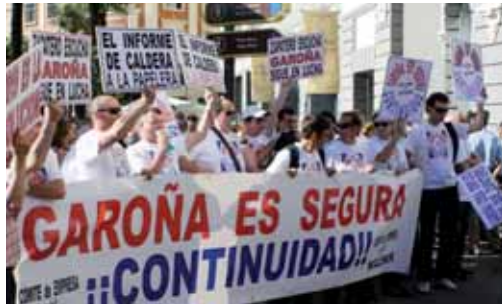
Trabajadores de Garoña se manifiestan en Madrid frente al Congreso.

El debate sobre el estado de la región se inició como todo el mundo esperaba: discurso del presidente con multitud de proyectos de ley y planes especiales y estratégicos, seguido de la intervención de la portavoz socialista con ofrecimiento de algún pacto y críticas a la gestión del gobierno regional. Todo transcurrió como marcaba el guión, incluso el hilo conductor: la crisis económica. Pues bien, en esta ocasión el debate ha deparado acontecimientos excepcionales. En primer lugar, Juan Vicente Herrera admitió que las políticas de población no han sido buenas y anunció un cambio en ellas. El presidente acometió todos los temas que preocupan a la sociedad: educación, sanidad, colaboración con el Gobierno central, las competencias del Duero, los servicios públicos, la TDT, el empleo joven, la vivienda, etc. El debate se animó en los tur-