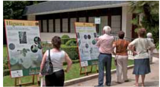
Varias personas contemplan la exposición del Campo Grande.

La muestra, que puede visitarse hasta el mes de septiembre, recorre las diez hectáreas del ‘pulmón de Valladolid’