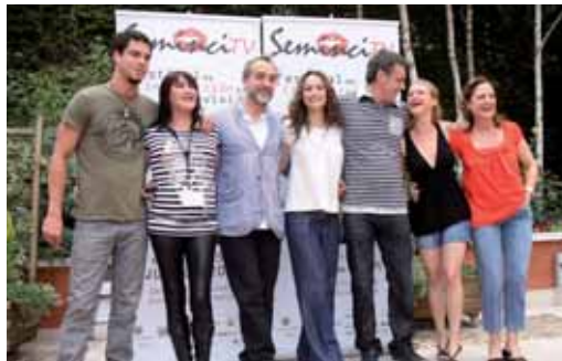
El elenco de actores y actrices que forman la serie Doctor Mateo.