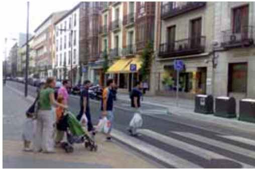
Duque de la Victoria, una de las obras finalizadas durante la legislatura.

Entre los proyectos cumplidos se encuentran las reformas de las calles Duque de la Victoria, Labradores, Núñez de Arce, Tercias o Ferrocarril; la puesta en marcha de un campo de fútbol de hierba artificial; apertura aparcamiento subterráneo de Zona Este; la conclusión del emisario de la margen izquierda del río Pisuerga; apertura del comedor social en Huerta del Rey; acceso a internet en todas las bibliotecas públicas; creación del Parque de San Isidro; organización de grandes eventos musicales o la aprobación del Tercer Plan de Suelo y Vivienda.