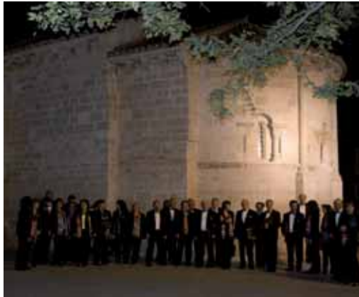
La Coral Támbara posa ante la Iglesia románica de Arroyo.

El próximo día 27 de junio, sábado, el anfiteatro al aire libre de La Vega acogerá la II edición del Encuentro de Corales de Arroyo de la Encomienda, organizado por la Coral Támbara, y patrocinado por la Fundación Municipal de Cultura y Deportes, del Ayuntamiento de Arroyo. Este Encuentro Coral comenzará a las 20:30 horas en el anfiteatro de La Vega y contará con las actuaciones, como corales invitadas, del prestigioso Orfeón Calagurritano (La Rioja) y de la Coral del Milenario de La Bañeza (León), además de la propia Coral Támbara, anfitriona de este II Encuentro. El I Encuentro tuvo lugar en la Plaza de Toros de la Flecha, dentro de la programación de las fiestas de San Antonio. Esta edición se ha incluido en la oferta de actividades estivales, aportando el sabor de velada musical veraniega, aunque se ha previsto, de acuerdo con el