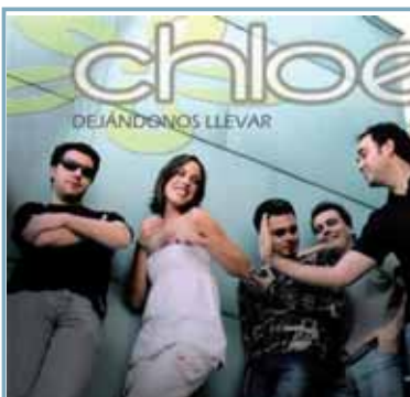
La banda vallisoletana Chloe publicará su primer álbum bajo el nombre 'Y los relojes se pararon' el martes 21 de julio. Ese mismo día ofrecerán en San Benito un concierto de presentación que será gratuito con invitación. Antes firmarán sus discos en El Corte Inglés del centro, de 19.00 a 20.30 horas.