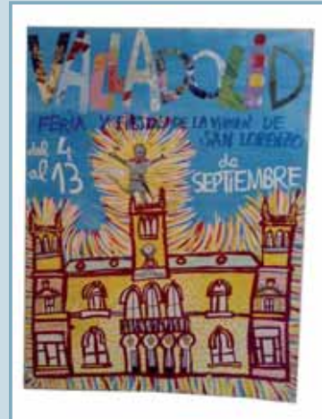
Cartel ganador de la categoría infantil.