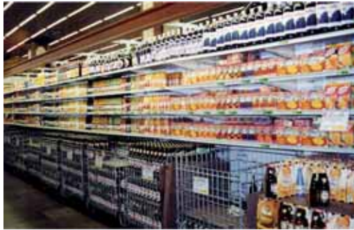
El mercado de la alimentación también está acusando la crisis.

En frutas y verduras, El Corte Inglés repite como el más caro, pero en este caso el del Paseo Zorri-