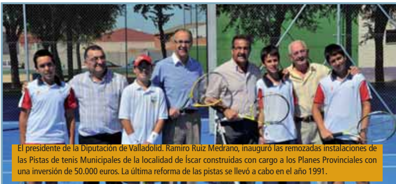
El presidente de la Diputación de Valladolid, Ramiro Ruiz Medrano, inauguró las remodeladas instalaciones de las Pistas de tenis Municipales de la localidad de Iscar construidas con cargo a los Planes Provinciales con una inversión de 50.000 euros. La última reforma de las pistas se llevó a cabo en el año 1991.