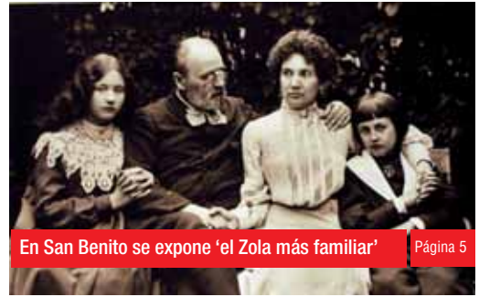
En San Benito se expone 'el Zola más familiar'

TELF. ANUNCIOS CLASIFICADOS 807 51 70 23