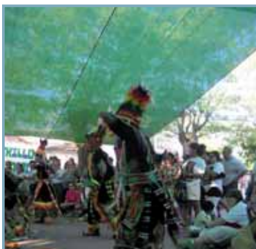
En La Santa Espina se celebró un rastrillo para recaudar fondos para hacer una Escuela en el pueblo de Ashuade, la escuela llevará el nombre de Escuela Santa Espina. Se recaudaron alrededor de 5.000 euros gracias a la colaboración de los visitantes.