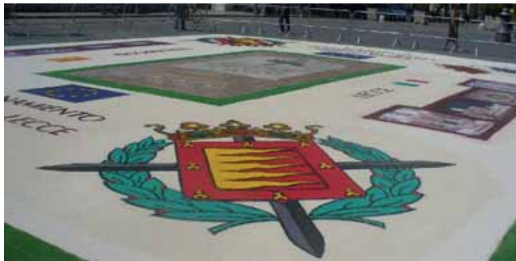
Aspecto que mostró el óvalo de la Piazza San Oronzo, con los escudos de las dos ciudades hermanadas.

La firma del hermanamiento tuvo lugar en la sala conciliar del Palazzo Carafa, sede de la Comuna di Lecce, con la presencia de varios concejales y otras autoridades de ambos municipios. Este acercamiento se hace mucho más importante en los campos empresariales y universitarios con acuerdos entre las Cámaras de Comercio y las Universidades de ambas ciudades. También se establecerán acuerdos para trabajar conjuntamente en el sector del vino y del aceite, así como en el campo de la aeronáutica. Otros proyectos, de carácter cultural, incluyen el intercambio de exposiciones de escritores y artistas locales, la colaboración entre mu-