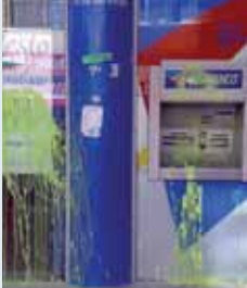
Una de las entidades pintadas.

■ El pasado lunes 13 la fachada y los cajeros de cuatro entidades bancarias (Bancaja, Caja Laboral, Banesto y Popular) de la Avenida de Segovia, en el barrio de Las Delicias, aparecieron cubiertos de pintura verde. Al parecer se trata de una acción del grupo de izquierdas Yesca, ya que también aparecieron pegatinas con la leyenda 'Construye tu propio futuro, actúa contra quien lo roba. Yesca'.