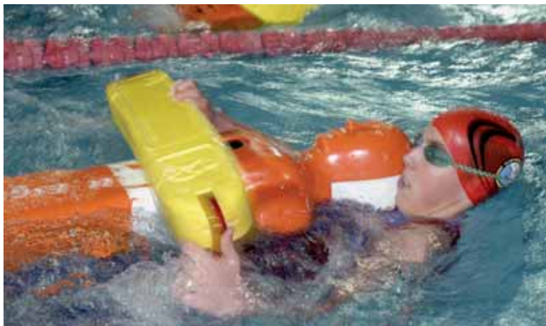
Socorrista es una de las profesiones más demandadas durante las vacaciones de verano.

Por eso, aunque los veranos siempre han sido fuente de empleo, la crisis impedirá que así lo sea por segundo año consecutivo. Desde las ETT's se prevé que este verano la contratación temporal vuelva a caer con respecto al mismo periodo del año pasado un 50%, lo cual no predice a corto plazo ninguna mejora del empleo. La directora de ETT comenta que "las empresas han reajustado sus plantillas y las han adaptado a la situación económica