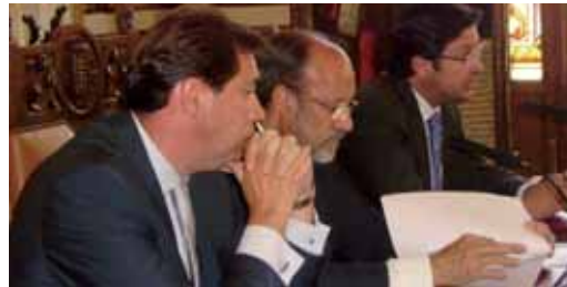
Histórico pacto entre PP, PSOE y el CB Valladolid.

El culebrón del CB Valladolid por jugar la liga ACB continúa una semana más. El conjunto vallisoletano se encuentra a la espera de que la auditoría de la ACB dé el visto bueno a sus cuentas para poder permitir su inscripción en la mejor liga europea de baloncesto. La semana se ha presentado calentita para la directiva morada que ha tenido que sufrir hasta el último segundo para buscar una solución rápida y fiable para superar el desajuste patrimonial detectado en las cuentas por la ACB. Esta pasaba porque el Ayuntamiento conceda la cesión y la explotación del polideportivo Pisuerga por los próximos 50 años al CB Valladolid. La opera-