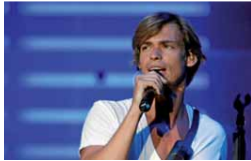
Carlos Baute durante una actuación.

Para los enamorados, Pimpinela actuará el jueves 10 a partir de las 23.00 horas con temas de recuerdo de sus 25 años sobre los escenarios. El plato fuerte de las Fiestas se producirá el viernes 11 con la actuación de Carlos Baute. El 'rey' del verano y de las rebajas con su tema 'Colgando en tus manos' presentará su trabajo 'De mi puño y letra' con el que ya es