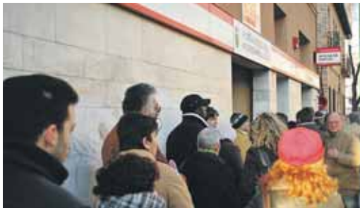
Hay 55.000 parados menos en España.