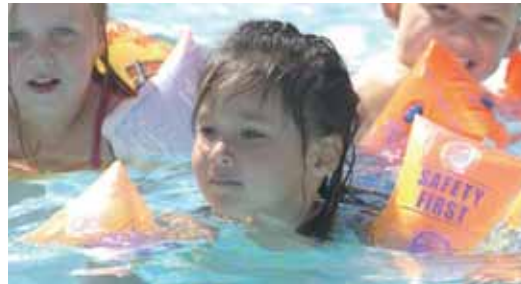
Los niños tienen que estar preparados para los peligros de las piscinas.

Guía con consejos sobre las actividades acuáticas