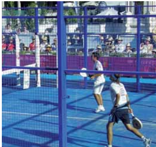
Jugada de un partido de cuartos de final jugado en la Plaza Mayor.

En cuanto a los favoritos, la categoría masculina parte sin favoritos claros. Aunque en las