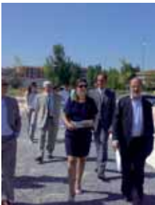
El alcalde durante la visita.