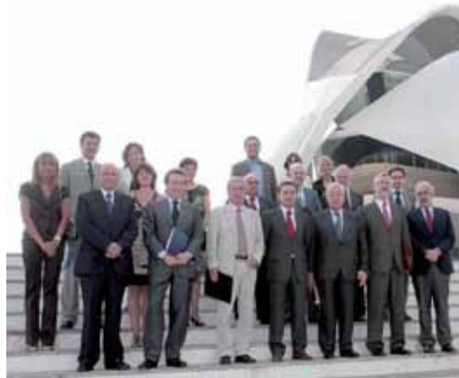
Los integrantes en el IV Encuentro en la Ciudad de la Ciencia (Valencia).

En este mismo sentido, el consejero de la Presidencia ha insistido en que "mientras nadie diga lo contrario, el Gobierno de la Nación tiene que conseguir no sólo una financiación suficiente y solidaria que permita el ejercicio de las competencias de manera adecuada y con calidad sino también promover adecuadamente los criterios que cada norma autonómica recoge en