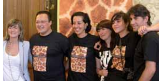
Momento de la presentación de las jornadas.

Los participantes tienen hasta las 00.00 horas del domingo 5 de julio para enviar las imágenes, y el jueves 9 de julio se hará entre-