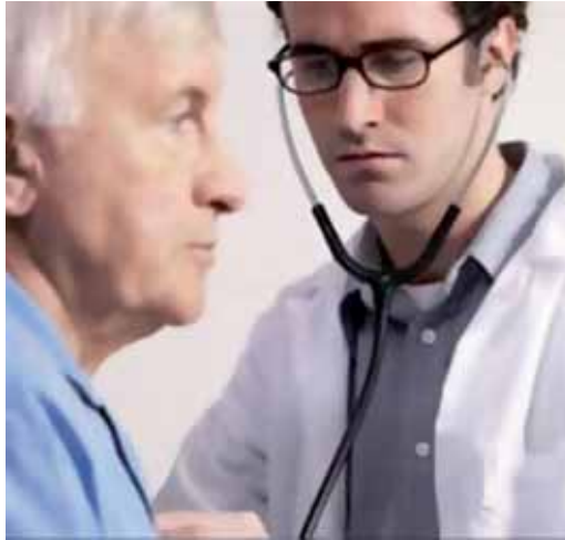
Un médico durante el ejercicio de su trabajo.

La Unidad Docente de Medicina Preventiva y Salud Pública contará con una oferta de 5 plazas, que se distribuirán entre los hospitales de Burgos, Salamanca y Valladolid. La Unidad Docente de