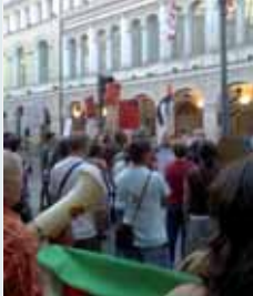
Momento de la protesta

■ El pasado miércoles 9 de septiembre, la Plataforma Solidaria con Palestina en Valladolid, convocó una manifestación con el lema '¡Contra la impunidad!, boicot Israel'. El acto tuvo lugar frente al Teatro Calderón, con motivo de la primera de las actuaciones del grupo Mayumán, al que culpan, entre otros artistas (Noa, Ivri Lider Amos Oz...) de difundir una imagen de 'normalidad' en Israel.