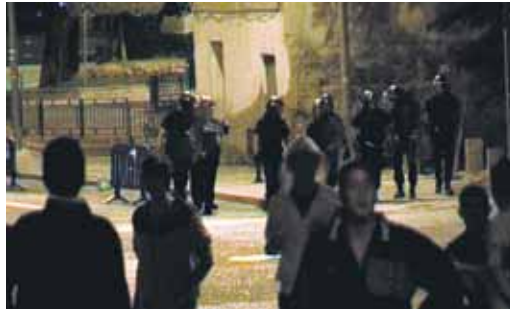
Imágenes del incidente de las Fiestas de Pozuelo de Alarcón.