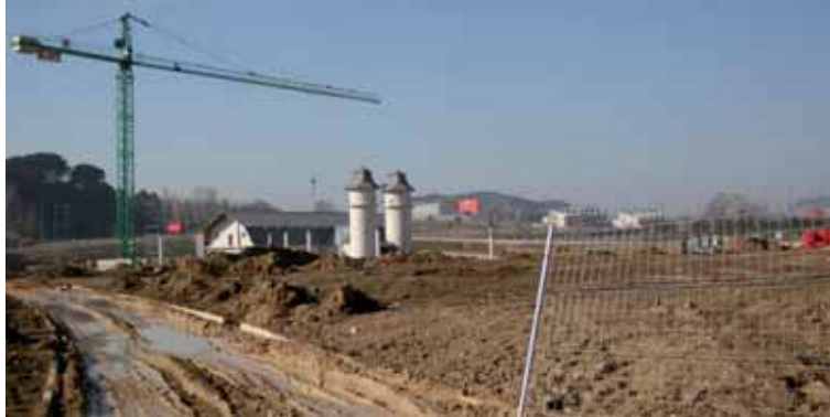
Terrenos de Villa de Prado donde se ubicará la futura Ciudad de la Justicia.