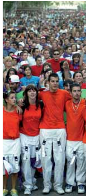
El año pasado se batió ya un récord.