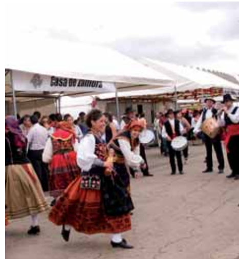
Gente disfruta de la gastronomía y el folclore de cada región.