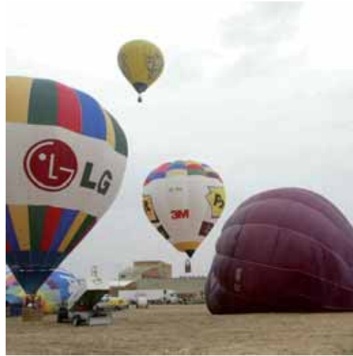
Los globos surcan el cielo vallisoletano durante pasadas ediciones.

FERIA Y FIESTAS. Por su parte, durante este fin de semana continuarán disputándose múltiples actividades deportivas dentro del programa de Feria y Fiestas de la Virgen de San Lorenzo. Entre ellas destaca la 45 edición de la Regata Nacional que llenará el sábado 12 de embarcacio-