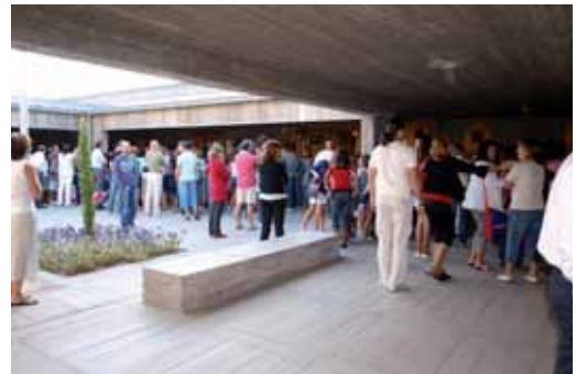
Padres y niños acceden al recinto escolar en el primer día de curso.

do actuaciones de información y formación a los profesores y alumnos, a los padres y a los agentes sociales, al tiempo que hará un seguimiento diario de la ausencia de alumnos con un equipo central en la Consejería y equipos provinciales y ha creado un Plan Operativo de Infraestructuras,