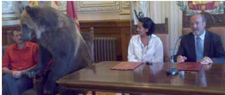
El oso Yogui estuvo presente en la presentación del evento con el alcalde y la concejala de Cultura.

artes del circo clásico: las acrobacias, la doma de animales y la comicidad. En sus más de 32 años de andadura ha recibido los Premios Nacionales de Circo en 1996 y 2001, la Medalla de Oro al Mérito en las Bellas Artes y la Medalla de Oro y Diploma de Honor de la UNI-