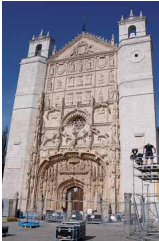
La compañía prepara la fachada para el espectáculo multimedia.

Además, el espectáculo incluye la intervención de actores y música en directo que narrará la historia del edificio, que durante épocas pasadas sufrió numerosas plagas. Ahora, y después de una intervención muy costosa, la iglesia de San Pablo puede presumir de una envidiable fachada. Se realizarán dos pases el sábado 12, a las 22.00 horas; y el domingo, 13, a las 22.30.