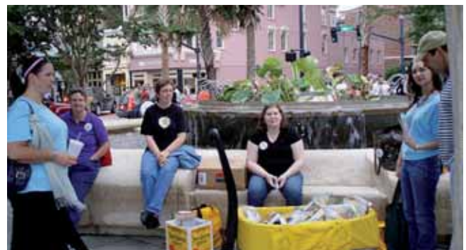
El bookcrossing tiene muchos adeptos en el mundo.

El acto se realizará el sábado 12 en la plaza de la Universidad, a partir de las 18.00 horas, donde se instalará una mesa en la que cualquiera podrá llevar un libro, leerlo y abandonarlo para que lo disfrute otra persona, o guardarlo en su biblioteca. Además, como novedad este año, los participantes también pueden llevar sus libros viejos. Sin duda, una buena idea para salir de la crisis.