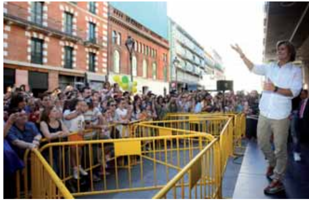
Carlos Baute durante la firma de discos el pasado jueves en El Corte Inglés.

so) ofrecerá lo mejor de su discografía incluyendo los temas de 'Cosas que nos hacen sentir bien' y hará un repaso a sus temas más famosos.