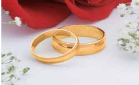
Las parejas se lo piensan más a la hora de divorciarse.

En 2008 fueron 1.018 las disoluciones matrimoniales, frente a las 1.269 del año anterior. De esas 1.018 disoluciones matrimoniales, 1 fue una nulidad, 81 separaciones y 936 divorcios según los datos publicados por el Instituto Nacional de Estadística.