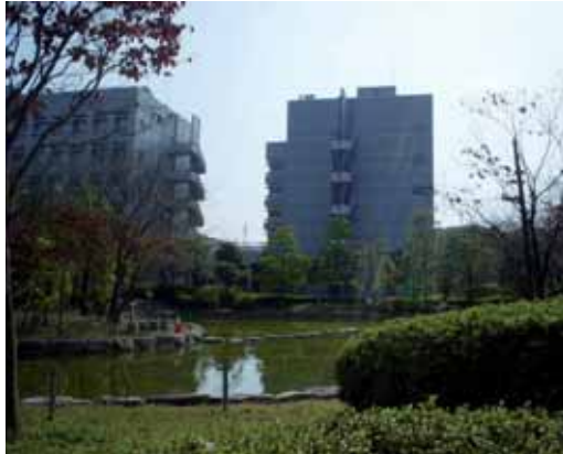
Los vallisoletanos tendrán un otoño 'calido'.

Entramos en una época del año que es cuando la longitud del día se acorta más rápidamente, esto quiere decir, que el Sol sale cada mañana un minuto más tarde que el día anterior y por la tarde se pone casi dos minutos antes, por lo que el acortamiento del día se ha-