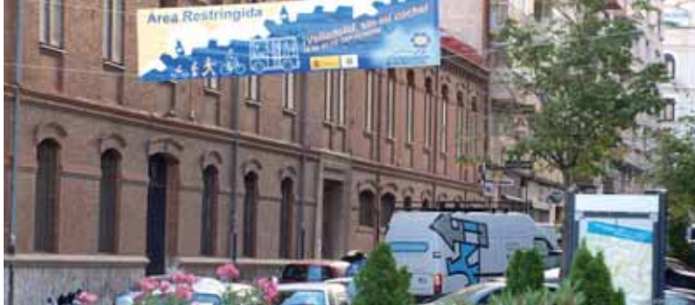
Los vehículos siguieron transitando por la zona restringida durante el Día sin coche.

El volumen de tráfico en el centro fue muy parecido a una jornada normal. El alcalde piensa que los ciudadanos "han desistido"