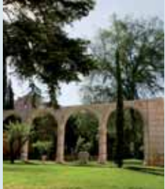
El Museo Colegio de San Gregorio.

■ El cineasta José Luis López-Linares ha rodado en Valladolid un largometraje sobre la reforma, ampliación y reapertura del Museo Nacional Colegio de San Gregorio, que el pasado jueves abrió de nuevo tras casi nueve años de obras. El filme, que será estrenado en las próximas fechas, mostrará tanto la historia del Colegio San Gregorio como su evolución durante el tiempo de rehabilitación.