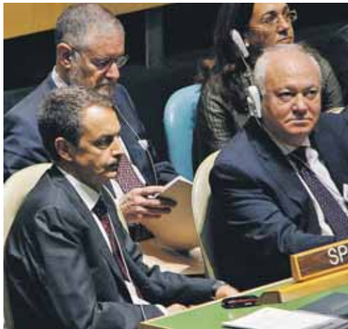
Rodríguez Zapatero en la ONU.

Una "regulación exigente y estricta" sobre las retribuciones de los altos directivos. Era uno de los reclamos que el presidente del Gobierno, José Luis Rodríguez Zapatero, llevaba a la tercera cumbre del G-20 en la que participa, donde se dirigía tras intervenir en la Asamblea general de la ONU y tras un encuentro con líderes sindicales en EE UU. España, en línea con la posición común fijada por la UE, pedía ante los representantes de las principales economías desarrolladas y emergentes que no se favorezcan "comportamientos que de una u otra manera han llevado a alguna entidad financiera a la situación de crisis que hemos vivido", tal y como señaló Zapatero el pasado 17 de septiembre en Bruselas.