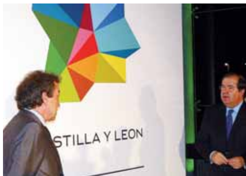
El presidente Herrera y De Santiago-Juárez muestran la marca territorio.

El presidente expresó que "la nueva marca de Castilla y León no quiere ser otra cosa que un instrumento útil para nuestros propios proyectos". Durante su intervención, ante los más de 600 asistentes a la presentación, Herrera explicó que "esta marca, que servirá para reforzar e interrelacionar el valor de las