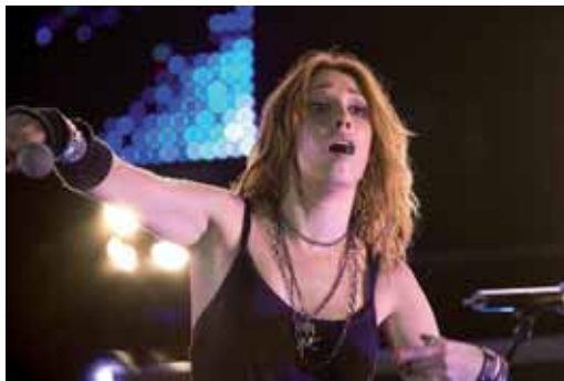
Malú actuará el 26 de septiembre en el Teatro Calderón.

"La continuidad de esta actividad dependerá de la acogida que tenga esta segunda fase", afirmó el alcalde de Valladolid, Javier León de la Riva. Las entradas, cuyos precios oscilarán entre los nueve y los 25 euros, se pueden conseguir en Caja Duero, en el 901 201 000, en su página web y en la taquilla de la calle Santiago 28, además de en las correspondientes de los lugares de los conciertos el mismo día.