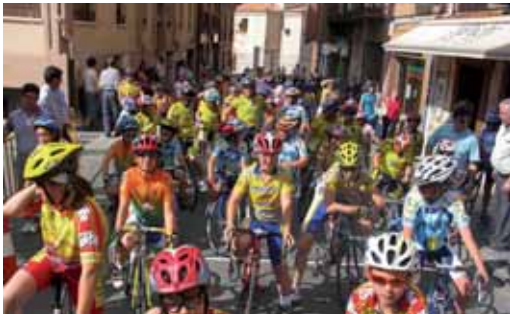
Las jóvenes promesas del ciclismo vallisoletano, antes de una carrera.

El domingo 27 de septiembre se celebra la VI edición del Trofeo Ciudad de Valladolid