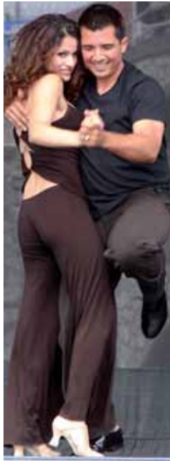
actividades asociadas como fiestas, reuniones, excursiones, congresos,

Existen cientos, miles de hombres y mujeres que tienen como complemento indispensable de su vida cotidiana el baile y han encontrado en esta afición un medio de relajarse, disfrutar, aprender, expresarse, conocer gente y realizar