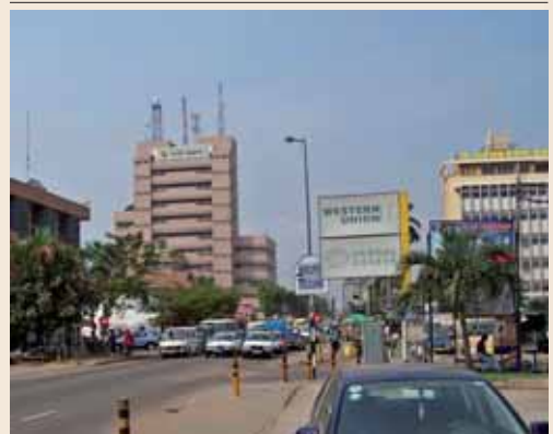
IMAGEN DE LA CIUDAD DE ACCRA, CAPITAL DE GHANA. TIENE MÁS DE 2 MILLONES DE HABITANTES

En la aduana. Ellos tienen mucho recelo al ‘blanco superior’. Si les tratas bien tienen una educación exquisita, como