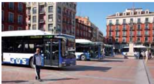
Momento de la presentación de los autobuses de la línea 1.

El coste de este rejuvenecimiento de la flota ha tenido un