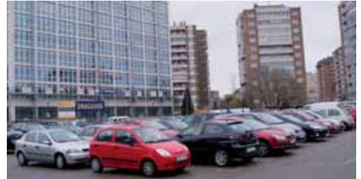
Pagar por aparcar costará más el año que viene.

En un año que se presume complicado, el Ayuntamiento ha decidido "austeridad en el gasto público como fórmula para superar la crisis y ayudar a las familias". De esta manera, ningún impuesto aumentará su recaudación. Sólo la tarifa por aparcamiento, es decir, la ORA, que subirá entre un 8 y un 16,7%. De tal modo que aparcar una hora en zona azul pasará a costar 65 céntimos (antes 60), mientras que en los aparcamien-