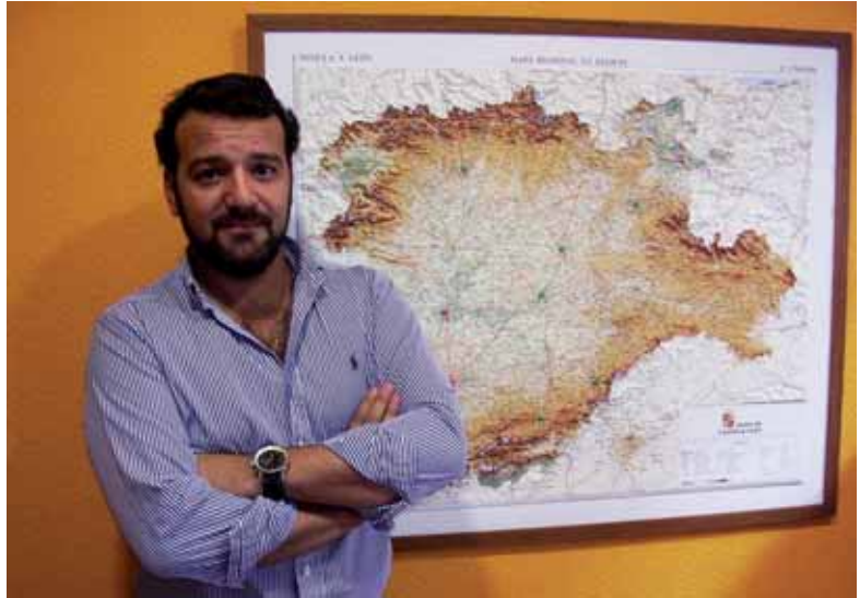
Peral invita a otras empresas de Castilla y León a invertir en Ghana.

Reconoce que su objetivo es volver a Valladolid. Sin embargo piensa que su tierra natal no es una “ciudad de oportunidades”. “Una vez alguien me dijo, si eres tan aventurero, monta algo aquí y no te vayas. La verdad es que me hizo reflexionar”, afirma muy pensativo.