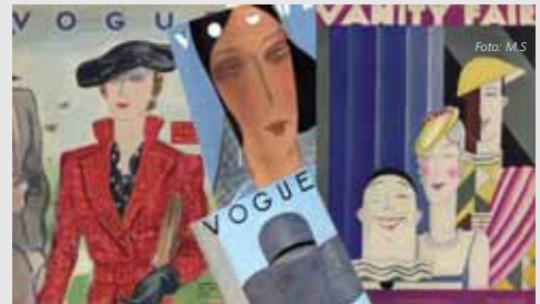
Portadas de Vogue y Vanity Fair realizadas por García Benito.

Casi 100 reproducciones de portadas que Benito creó para las dos revistas se muestran junto con ilustraciones originales, pinturas, y fotografías y revistas vintage del Archivo Condé Nast.