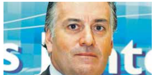
El senador y ex tesorero del PP Luis Bárcenas.

que estuvo sin embargo durante la tarde en las estancias del Senado para continuar con su actividad parlamentaria. Con el resultado, el suplicatorio superó con celeridad todos los trámites a los que ha tenido que someterse en la Cámara Alta.