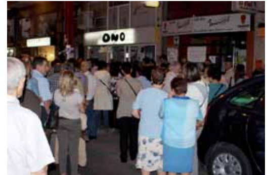
Momento de la concentración realizada a las puertas del bar Ideal.

Piden que se incremente la vigilancia policial en las calles