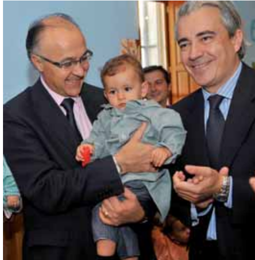
El presidente de la Diputación y el delegado territorial, Mariano Gredilla.

Se trata de uno de los cinco nuevos centros infantiles que se han incorporado este año al Programa 'Crecemos', junto a los abiertos en Geria, Pozal de Gallinas, San Pedro de Latarce y Ataquines. Se suma, así, a los 29 municipios que se han ido incorporando al Programa desde su puesta en marcha en 2004 en virtud del convenio establecido