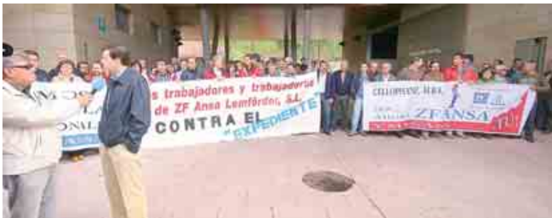
Trabajadores y ex trabajadores se concentraron a las puertas del hotel Abba donde se celebró la primera reunión entre la dirección de la multinacional y el comité de empresa.

El presidente del comité de empresa subrayó que los trabajadores "no queremos hablar ni de dinero ni de indemnizaciones; lo que queremos, tal y como manda la ley de procedimientos para estos casos es negociar de buena fe para buscar una viabilidad a la planta, una solución de competitividad, es lo que pedimos a la dirección".