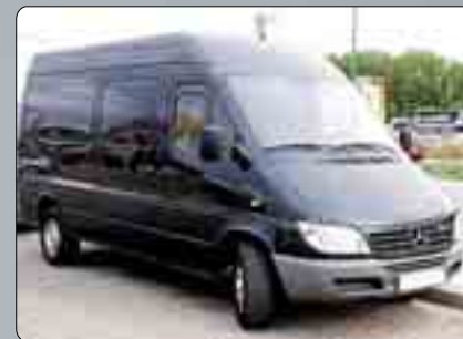
Mercedes Sprinten 313 CDI Furgón Año 2006. Sobreelevador. Dirección asistida. Elevalunas. ABS. ESP. Radio CD. 14.000 €