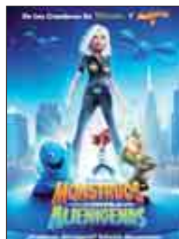
MONSTRUOS CONTRA ALIENÍGENAS. ED. ESPECIAL Dir. Rob Letterman Int. Animación Fantástica.