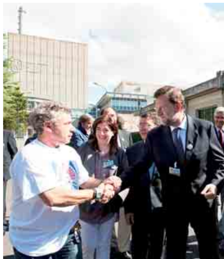
Mariano Rajoy, durante la visita a la central nuclear de Garoña, el día 6.