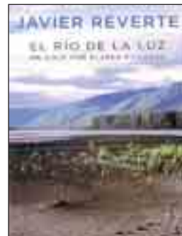
EL RÍO DE LA LUZ. Un viaje por Alaska y Canadá. Javier Reverte.