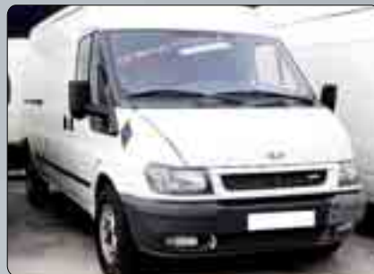
Ford Transit Furgón Años 2004/2006. Dirección asistida. Elevalunas. Control de tracción. Cierre centralizado. Varias unidades. Desde 7.000 €