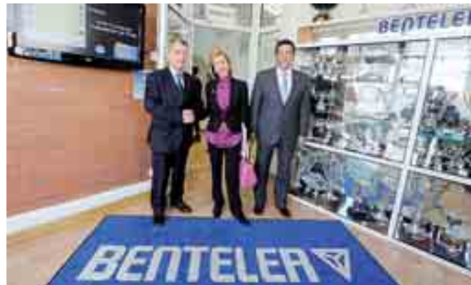
La diputada Rosa Díez en las instalaciones de Benteler.

La patronal exige al Ayuntamiento y a la Junta acciones concretas y activas para dinamizar proyectos económicos pendientes