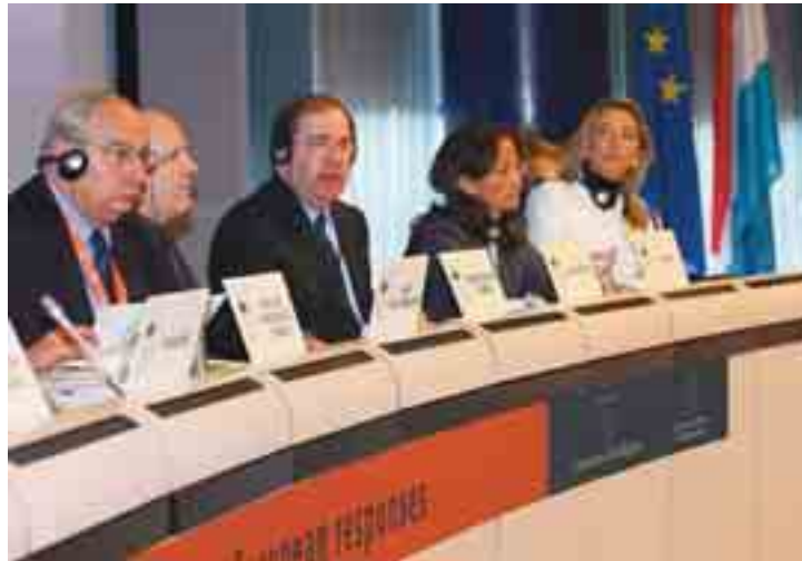
Juan Vicente Herrera durante su comparecencia en el Comité.

Entre las mejoras que introducen las enmiendas merece la pena destacar que se amplía la