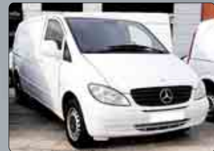
Mercedes Vito Furgón 109 CDI III CDI Varias unidades Desde 9.000 €