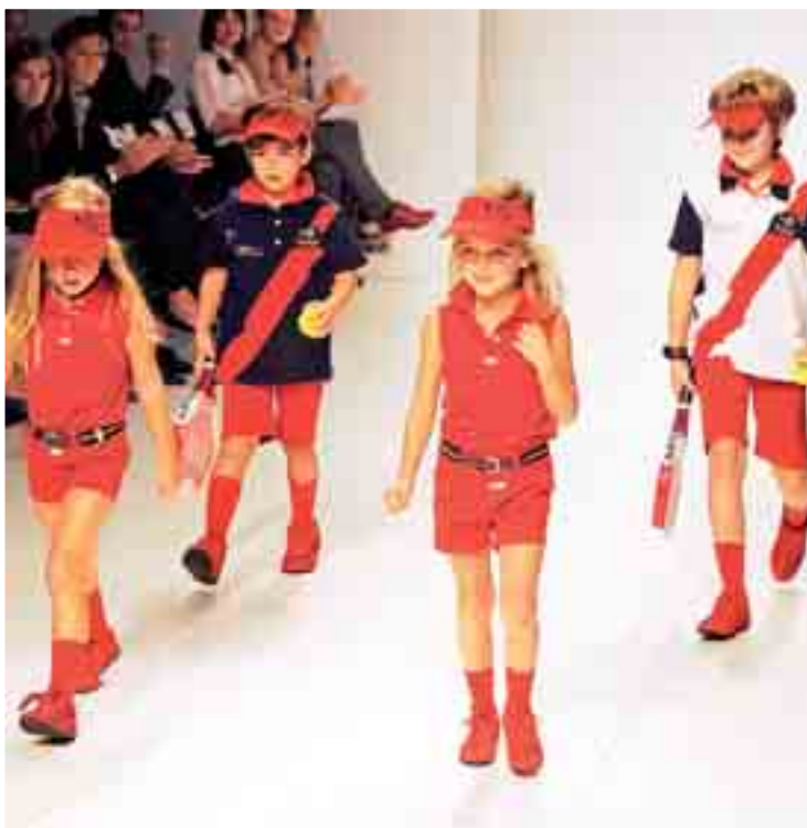
Los más pequeños desfilan con diseños de Trasluz (Burgos).

La moda de Castilla y León también está presente en nuevos territorios emergentes como Hungría, Polonia y Rumanía.