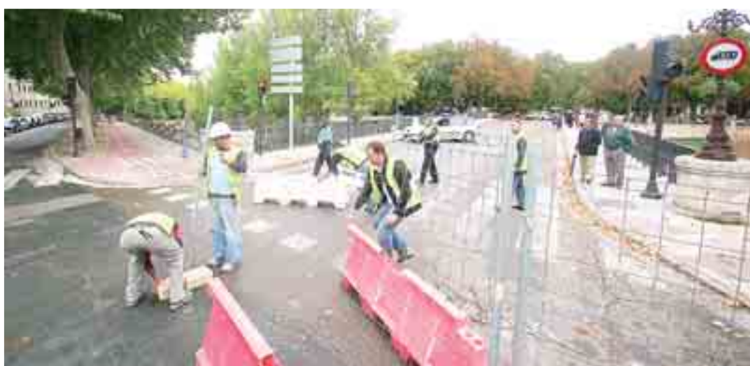
El puente Castilla se cortó al tráfico el pasado miércoles día 7 de octubre y permanecerá cerrado unos 4 meses.

La línea 18 de Fuentecillas es la única que mientras dure el corte del puente Castilla sufre modificación de horario en los días laborables, pasando a ser el siguiente: Salidas del centro: 7:00-8:00-8:30-9:00-9:30-10:00-10:30-11:00-11:30-12:00-12:30-13:00-13:30-14:00-14:30-15:00-15:30-16:00-16:30-17:00-17:30-18:00-18:30-19:00-19:30-20:00-20:30-21:00