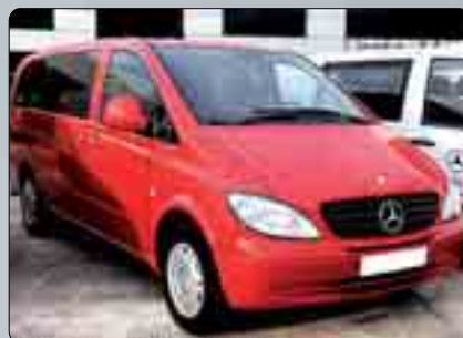
Mercedes Vito Combi III CDI Años 2004/2007. Varias unidades. 7 ó 9 plazas. 2 airbags. ABS. ESP. Climatizador. Desde 15.000 €