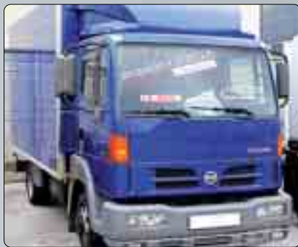
Nissan Atleon 35-13 Chasis caja cerrada. Dirección asistida. Elevalunas. Aire acondicionado. Asiento neumático. 15.000 €