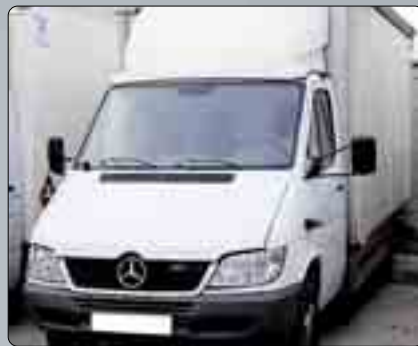
Mercedes Sprinten 416 Año 2008. Chasis con caja. Cierre centralizado. Elevalunas. Dirección asistida. 15.000 €