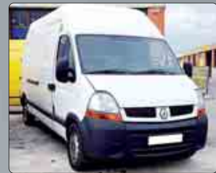
Renault Master 3.0 DCI Furgón Año 2006. Dirección asistida. Elevalunas. Cierre centralizado. ABS. Varias unidades. Desde 10.000 €