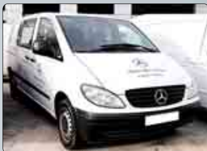
Mercedes Vito Mixta Año 2005. 6 plazas. Dirección asistida. Elevalunas. Cierre centralizado. Climatizador. ABS. ESP. 15.000 €