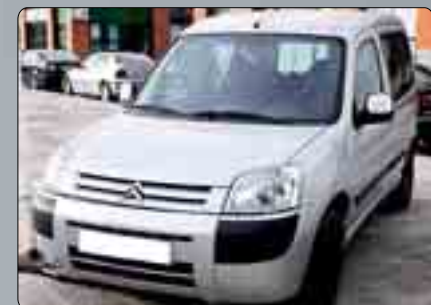
Citroën Berlingo-Mixta 2.0 HDI Año 2004. Dirección asistida. Elevalunas. Puerta corredera. Enganche. Pintura metalizada. 7.000 €