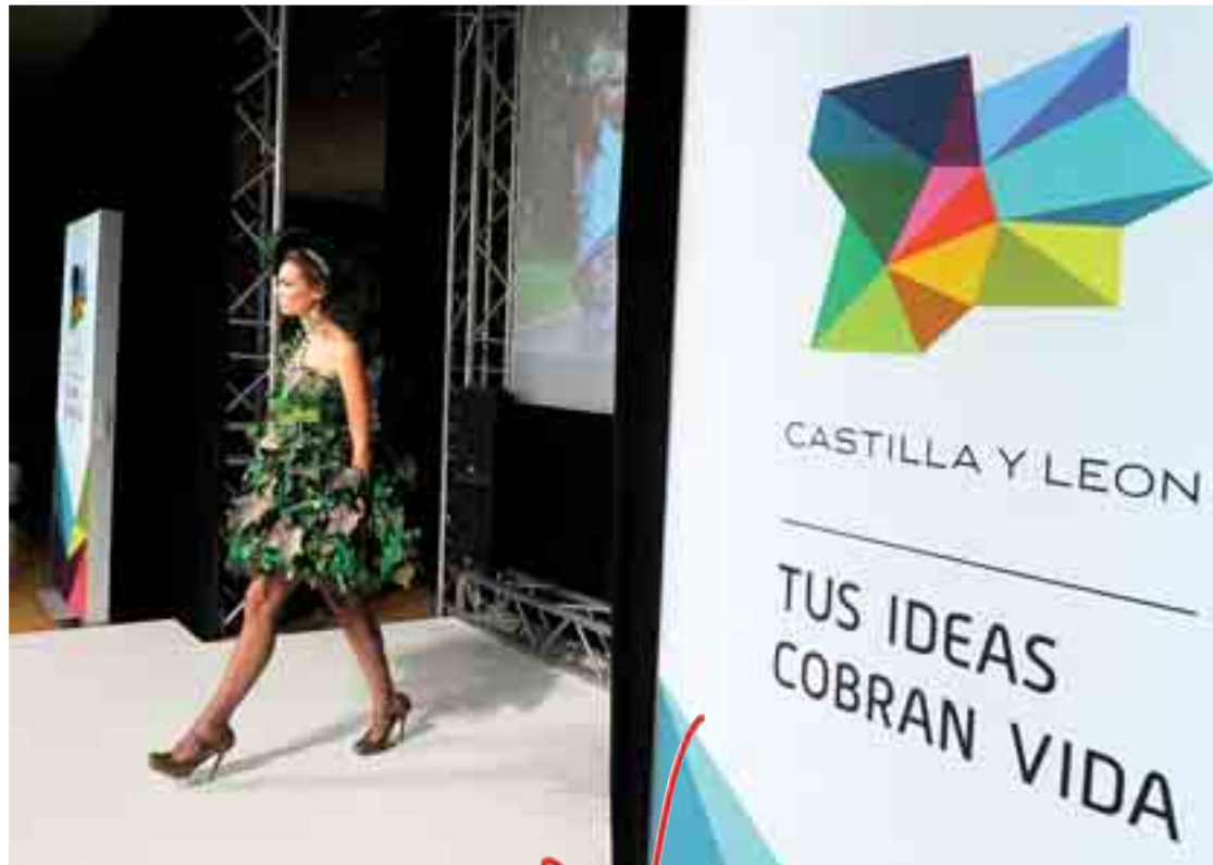
El primer desfile de la Pasarela de la Moda de Castilla y León estuvo inspirado en la nueva marca de la Comunidad.

mas regionales han estado presentes en el área expositiva, junto con más de 100 importadores procedentes de 25 países.