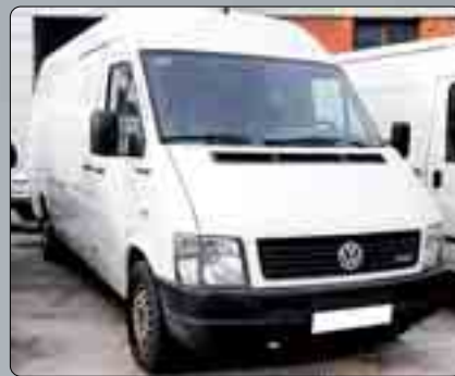
Volkswagen LT Furgón TDI Año 2002. Dirección asistida. Aire acondicionado. Radio CD. 10.500 €