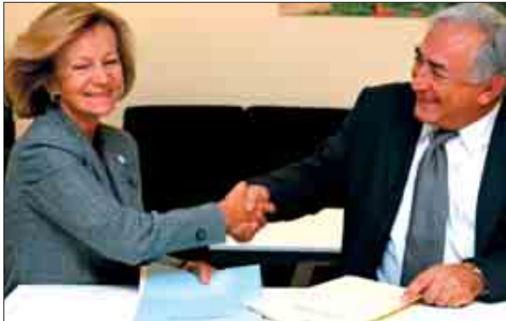
Elena Salgado, ministra de Economía, junto al gerente del Fondo Monetario Internacional (FMI) Dominique Strauss

Fernández Ordóñez reitera sus tesis de que España debe acometer "con prontitud reformas de las instituciones laborales" para acercar su tasa de paro a "la del resto de países europeos más desarrollados". El Gobernador apunta que los contratos