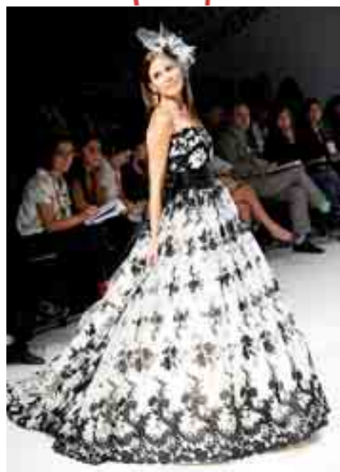
Diseño nupcial de Loly Cubo. 'Colección Nacar'.