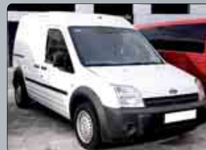
Ford Transit Conect TDCI Año 2005. 110 cv. Dirección asistida. Elevalunas. Cierre centralizado 7.000 €