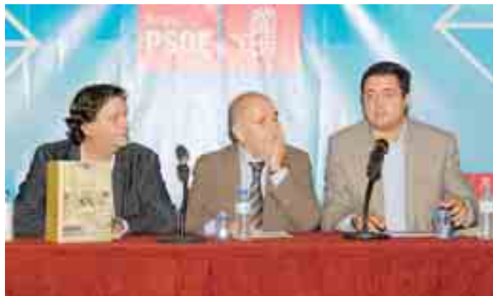
Presentación del libro 'El arranque de Castilla y León'.