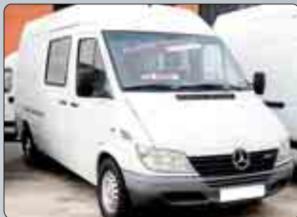
Mercedes Sprinten 216 CDI Año 2000. Preparada como autocaravana. Calefacción autónoma. Bloqueo. ASR. Climatizador. Cierre centralizado.. 12.000 €