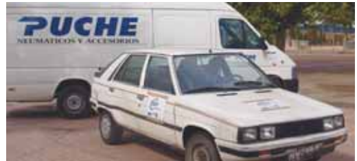
Durante el curso se aprendieron diferentes maniobras de evasión.

Los temas abordados han sido ocho: posición de conducción, técnica básica de conducción, trazado de curvas, conducción sobre firmes deslizantes, manio-