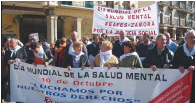
Momento de la celebración del Día Mundial de la Salud Mental celebrado en Aranda de Duero el año pasado.

5.200 vallisoletanos tienen un certificado de discapacidad mental. “Existen lagunas en la atención de esta patología”, afirma Feafes