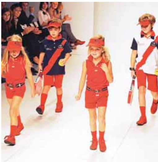
Los más pequeños desfilan con diseños de Trasluz (Burgos).

La moda de Castilla y León también está presente en nuevos territorios emergentes como Hungría, Polonia y Rumanía.