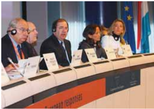
Juan Vicente Herrera durante su comparecencia en el Comité.

Entre las mejoras que introducen las enmiendas merece la pena destacar que se amplía la