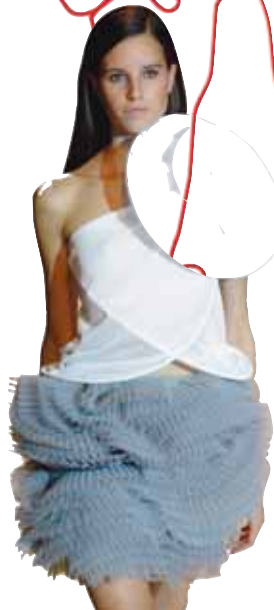
Desfile de Amaya Arzuaga.