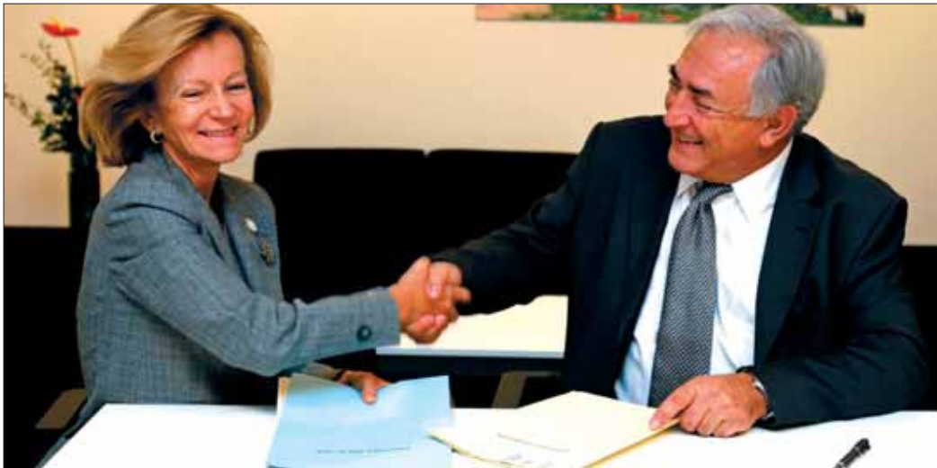
Elena Salgado, ministra de Economía, junto al gerente del Fondo Monetario Internacional (FMI) Dominique Strauss

FONDO MONETARIO Y BRUSELAS APRUEBAN LA RECETA DEL BANCO ESPAÑA