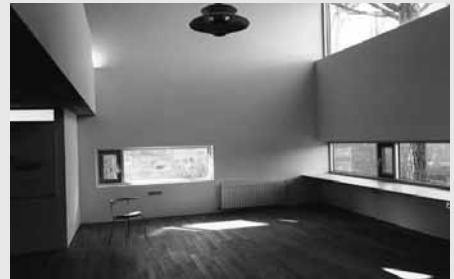
Uno de los trabajos de Primitivo González.

la obra de uno de los arquitectos de mayor relevancia de la ciudad a través de las instantáneas en blanco y negro del fotógrafo Ricardo González, que ha seguido los pasos de González desde sus comienzos. Las fotografías permiten al espectador interpretar la construcción, la luz, los distintos planos de un edificio, el espacio o el equilibrio entre la masa construida. Primitivo González apuntó durante la presentación de la muestra que el título de la exposición responde a que "la