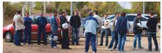
Alumnos y profesores se preparan para iniciar las clases prácticas.

Los dieciocho participantes han podido practicar varias veces todas y cada una de las técnicas y maniobras enseñadas en el curso. Durante la mañana del día ocho, el Real de la Feria parecía "un plato de rodaje de alguna película de acción", comentaban