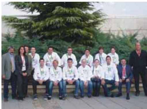
Los cocineros participantes posan en el colegio Alcazarén.

Al final, el jurado, presidido por el prestigioso chef Martín Berasategui, otorgó el Primer Premio al cocinero burgalés José Ignacio Rojo, del Restaurante La Galería de Quintanadueñas. El segundo