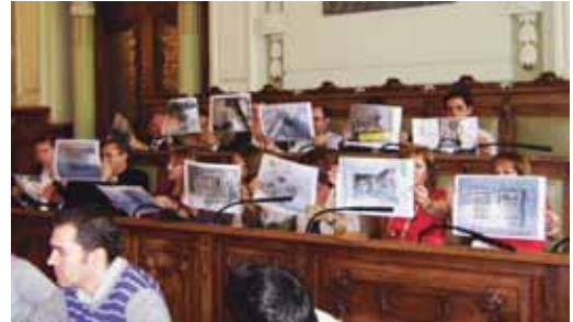
La oposición mostró fotografías de atascos en las alcantarillas.

El resto de los impuestos no se moverán. Por ejemplo, la retirada de un vehículo por parte de una grúa sigue siendo de 91,78 euros, si es una moto descende a 41,31. La tasa de las terrazas (1 mesa y 4 sillas) costará, dependiendo de la categoría, desde los 75 euros hasta