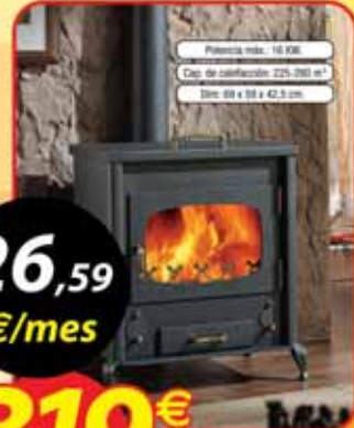
Potencia máx.: 18 kW Capacidad calefacción: 225-280 m² Dim: 88 x 88 x 42,5 cm.

*Ofertas válidas 9 y 10 de octubre de 2009 **Consultar precios en tienda.