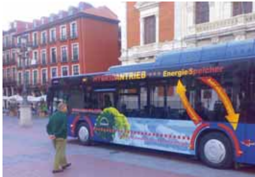
El autobús Lion's City Híbrido que circula por la ciudad.

El vehículo puede funcionar como eléctrico puro -sin emisiones contaminantes- y, a voluntad