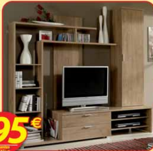
Sotén "Stylus" wengal clare • 198 x 220 x 50 cm.