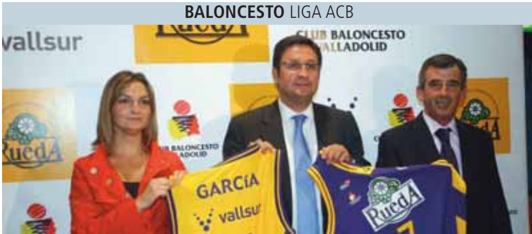
Firma del acuerdo entre el CB Valladolid y la Denominación de Origen Rueda.

Para más información: www.genteenvalladolid.com - www.gentedigital.es