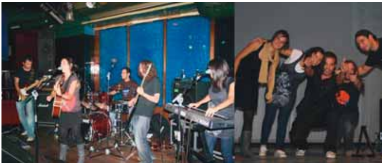
Los componentes del grupo El Grito de Harpo durante la actuación en la final de Mescal en Salamanca.