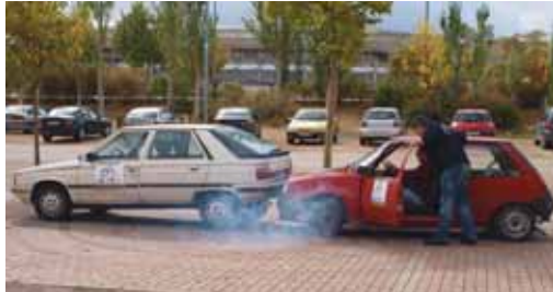
Practicando la salida de estacionamiento en línea sin maniobra.

el curso ha sido eminentemente práctico. Para ello, CSIF ha contado con el patrocinio y colaboración de diferentes empresas relacionadas con el sector de la automoción. Los neumáticos utilizados en vehículos y protección de elementos fijos han sido aportados por Neumáticos Puche, los coches con los que realizar las diferentes maniobras provenían