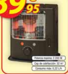
Potencia máxima: 2.200 W Capacidad calefacción: 32 m² Consumo máx.: 0,22 L/h