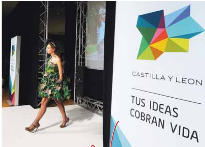
El primer desfile de la Pasarela de la Moda de Castilla y León estuvo inspirado en la nueva marca de la Comunidad.

mas regionales han estado presentes en el área expositiva, junto con más de 100 importadores procedentes de 25 países.