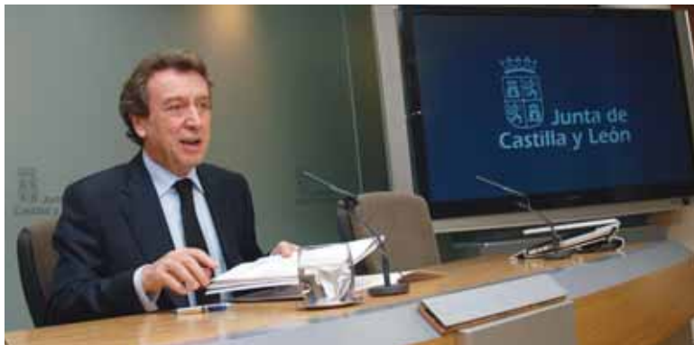
El consejero de Presidencia y portavoz de la Junta de Castilla y León, José Antonio de Santiago-Juárez.

El decreto garantiza, entre otros aspectos, una formación de calidad con el objetivo de reordenar y potenciar las estructuras docentes a través de una mayor implicación y capacitación de los profesionales sanitarios. En este sentido, en el último año se han aumentado en un 7%, al pasar de las 438 plazas del periodo 2008-2009 a las 469 para el 2009-2010, es decir, 31 plazas más.