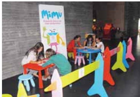
Espacio 'Mimu' en el Museo del Pan de Mayorga de Campos.