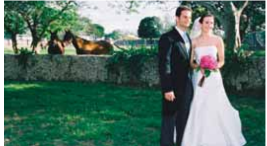
Los gastos de la boda tampoco son ajenos a la crisis.

FUCI se ha basado para este estudio en un "enlace tipo" de 100 comensales y en veinte ciudades españolas. El gasto en trajes, es uno de los mayores costes de la celebración y no es inferior a los 700 en el caso de la novia, sin incluirlos zapatos, maquillaje, peinado, ramo, complementos... La suma de todos estos conceptos hace que el presupuesto peda