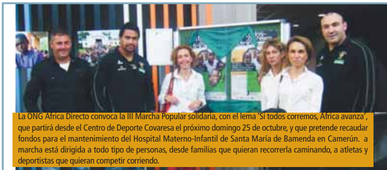
La ONG Africa Directo convoca la III Marcha Popular solidaria, con el lema "Si todos corremos, Africa avanza", que partirá desde el Centro de Deporte Covaresa el próximo domingo 25 de octubre, y que pretende recaudar fondos para el mantenimiento del Hospital Materno-Infantil de Santa María de Bamenda en Camerún. La marcha está dirigida a todo tipo de personas, desde familias que quieran recorrerla caminando, a atletas y deportistas que quieran competir corriendo.