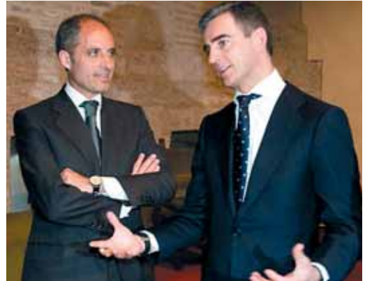
Francisco Camps, presidente de Valencia, junto a Ricardo Costa

Por su parte, Mariano Rajoy ha asegurado que mantiene la misma confianza en Camps que la que ha tenido desde que fue nombrado presidente del PP y adelantó que su voluntad es que siga siendo presidente de la Comunidad Valenciana y candidato cuando se celebren las elecciones de 2011. "A mi el señor Camps no me ha mentado", recaló. Sobre el cese de Ricardo Costa, aseguró que se debe a que el nivel de exigencia que se debe tener con un secretario general es "mayor que el de un militante".