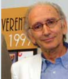
José Luis Alonso de Santos.

■ El dramaturgo vallisoletano José Luis Alonso de Santos será nombrado Embajador del Teatro Calderón el viernes 16 de octubre. El acto tendrá lugar en el Salón de Espejos del Teatro vallisoletano. La dirección quiere rendir "un reconocimiento a su importante y dilatada vida profesional". Alonso es autor de piezas teatrales como 'Bajarse al Moro' o 'La Estanquera de Vallecas'.