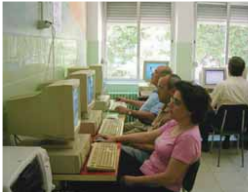
Taller de informática organizado por la asociación Camino.

Dentro de las secuelas pueden encontrarse la parálisis en una mitad del cuerpo, incapacidad para hablar y comprender lo que se