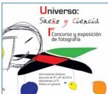
La Universidad Europea Miguel de Cervantes y la Fundación Universidades de Castilla y León organizan el concurso Fotografía Científica "Universo, sueño y ciencia" en el que podrán participar informadores gráficos, estudiantes de Secundaria, Bachillerato y Formación Profesional de Castilla y León, así como público en general. El 30 de octubre finaliza el plazo de entrega.