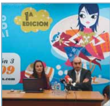
La Feria de Valladolid acoge este fin de semana muestra 'Creativa', un conjunto de talleres y 40 puestos en los que se mostrará las vertientes productivas del ocio creativo. Se trata de actividades y objetos manuales, como talleres textiles, cocina creativa, artesanía, creación floral, confección de prendas con retales o pinturas...