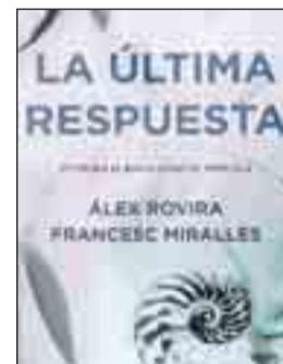
LA ÚLTIMA RESPUESTA Álex Rovira y Francesc Miralles. Novela.