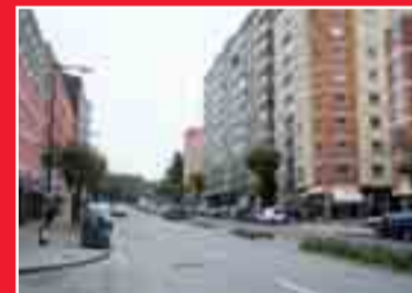
AVDA. DEL CID

Piso para entrar a vivir. Totalmente exterior. CUATRO dormitorios, salón, cocina, baño, aseo. Garaje y trastero.