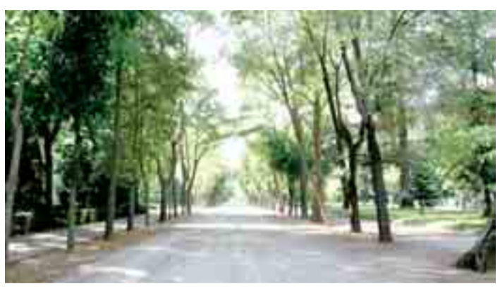
Los arquitectos piden la consideración de BIC como jardín histórico para el Parque de la Isla.