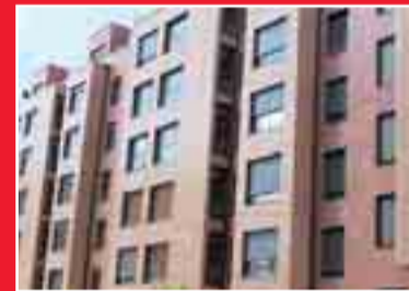
Bº SAN PEDRO

Piso para reformar, tres dormitorios, salón, cocina, baño, aseo, portal reformado, dos ascensores. 177.000 €.