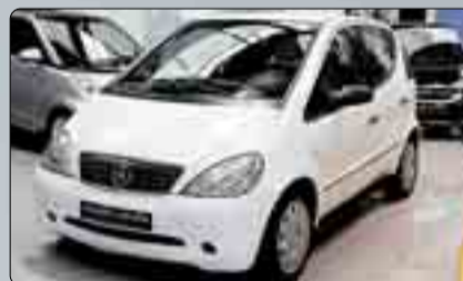
Mercedes Benz Clase A 170 CDI Automático Año 1999. Tempomat. Climatizador. Radio CD. Elevalunas. 4 airbags. ABS. ESP. Espejos abatibles.