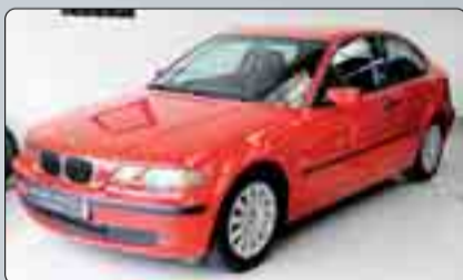
BMW Serie 320 D Compact Año 2001. 6 Airbags. ABS. ESP. Climatizador. Radio CD. Elevalunas. Cierre centralizado. Simil de titanio.