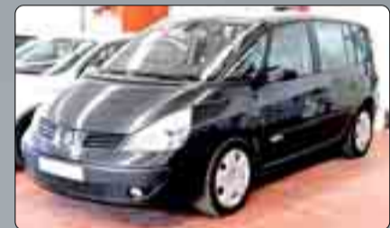
RENAULT SPACE 2.2 DCi 7 PLAZAS Año 2004. 6 Airbags. ABS. ESP. Climatizador. Dirección asistida.