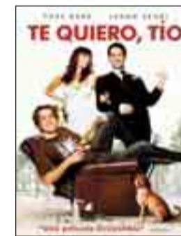
TE QUIERO, TÍO Dir. John Hamburg Int. Paul Rudd, Jason Segel. Comedia.