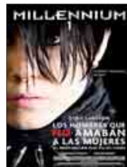
MILLENNIUM 1: Los hombres que no amaban a las mujeres Dir. Niels Arden Oplev Int. Michael Nyqvist, Noomi Rapace. Thriller.