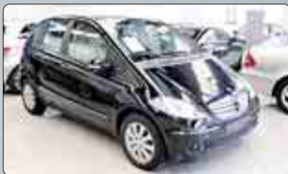
Mercedes Clase A 150 Gasolina Elegance Año 2008. Dirección asistida. Elevalunas. Cierre Centralizado. Climatizador. ABS. ESP. BASS. Alarma. 2 años de garantía.