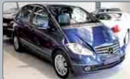
Mercedes Clase A 180 CDI Elegance Año 2008. 4 airbags. ABS. ESP. BASS. Climatizador. Sensor de luz. Teléfono. Espejos abatibles. Tapicería tela cuero. 2 años de garantía.