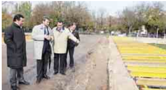
Visita a las obras de ampliación del nuevo puente Castilla.