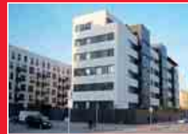
JARDINES DE LA ESTACIÓN

Áticos de 73 m² útiles. 2 terrazas. Garaje y trastero. Buena orientación. A estrenar. llave en mano.