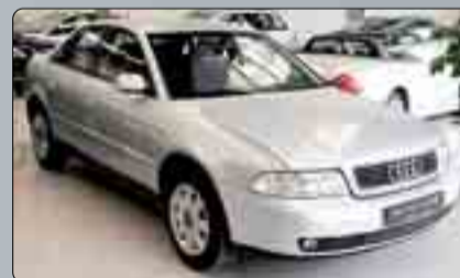
Audi A4 2.5 TDI Año 1999. 150 cv. 6 Airbags. ABS. ESP. Climatizador. Pintura metalizada. Radio CD. Elevalunas. Dirección asistida.