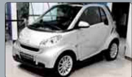
Smart Fortwo 62 Pasión Año 2007. 2 airbags. ABS. ESP. Climatizador. Radio CD. Llantas de aleación. Techo panorámico. Guantero. 2 años de garantía.