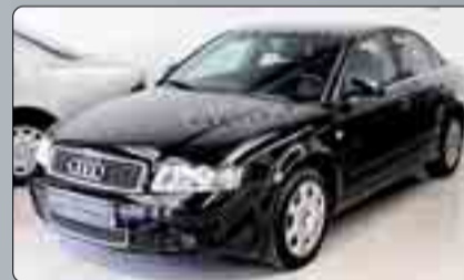
Audi A4 2.5 TDI Sline Año 2003. 6 airbags. ABS. ESP. Climatizador. Suspensión deportiva. Cierre centralizado.