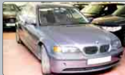
BMW Serie 3 Varias unidades.