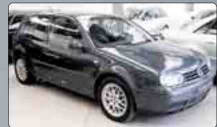
Volkswagen Golf 1.9 TDI GTI Año 2002. 150 cv. 6 Airbags. ABS. ESP. Climatizador. Radio CD. Faros de xenón. Asientos deportivos.