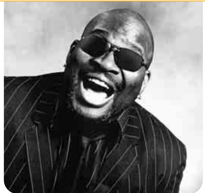
Barrence Whitfield actuará el día 13 a las 22.30 horas.

Fechas: Hasta enero. Lugar: Casa de cultura de Gamonal. Fotoclub Contraluz organiza un taller de iniciación a la fotografía en la casa de Cultura de Gamonal, los días martes y jueves