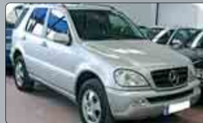
Mercedes ML 270 CDI Varias unidades.