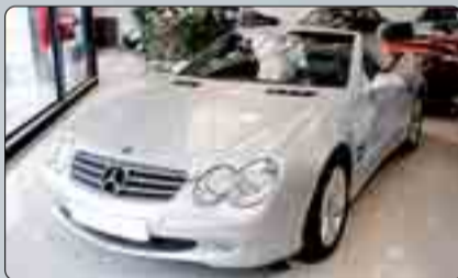
Mercedes S2 380 Cambio automático. Navegador. Cuero. Alarma. Bixenon. Teléfono.