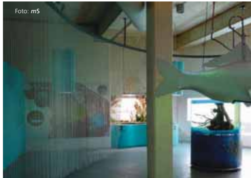
Vista panorámica del estanque y acuario inaugurados.

Más de cincuenta especies de río conforman este 'pequeño océano'. La bermejuela es el pez que predomina en las aguas. Se trata de un pez de unos diez centímetros y un peso aproximado de cuarenta gramos que vive en lagos y que se alimenta de invertebrados acuáticos y pequeñas plantas.