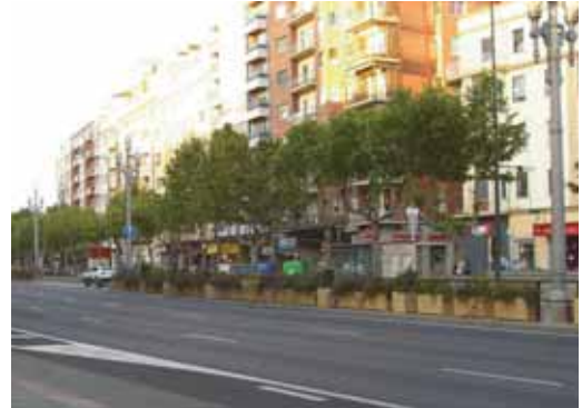
Uno de los portales del Paseo Zorrilla.

Dentro de las 50 vías con mayor número de portales —cada una de ellas con más de 200— figuran 13 provincias. Así, además