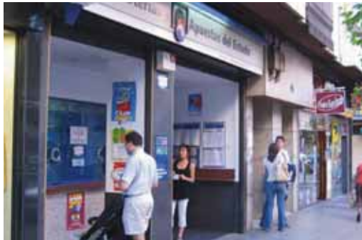
La administración 24 'Encarnista' es una de las más frecuentadas.

por la media de gasto de cada habitante, el liderato se lo lleva de nuevo Soria, donde cada uno de sus 94.646 habitantes va a gastar 203 euros. Segundo, a distancia, queda Lleida, con una media de 182 euros. Y porque la delegación pirenaica de Sort vende