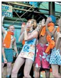
Activistas en ropa interior

España está participando en la Cumbre del Clima de las Naciones Unidas que se celebra en Copenhague (Dinamarca). Una cumbre de quince días de la que, a priori, no se esperan grandes avances ni un tratado internacional que materialice las decisiones tomadas. Los países ricos parten de la idea de que ahora es tiempo de dar dinero a los pobres para reducir las emisiones de CO2. Los 27 buscan un pacto sobre la inversión de la UE a estos efectos.