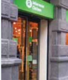
Una tienda de Intermón.

■ El pasado jueves 10 de diciembre, Intermón Oxfam celebró el aniversario de su tienda en Valladolid con la presentación de su oferta navideña. "Este año de crisis", Intermón Oxfam ha puesto en marcha la campaña "Algo más que un regalo". Son una Tarjetas-regalo-donativo: de venta en las tiendas de Intermón hay varios modelos y también se pueden adquirir por Internet.