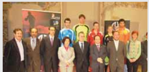
Foto de la presentación de las Ligas Universitarias.