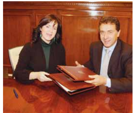
La consejera y el secretario de Estado durante la firma del convenio.

Los nuevos proyectos que se van a realizar contemplan accio-