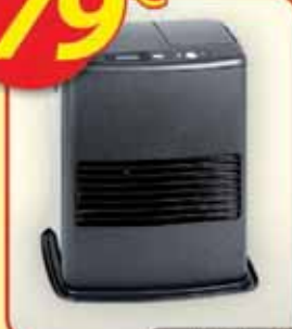
Estufa de parafina electrónica "FH-3000"

Potencia máx.: 3.000 W. Cap. de calefacción: 60 m 2 . Consumo máx.: 0,31 L/h. Depósito: 5 L.