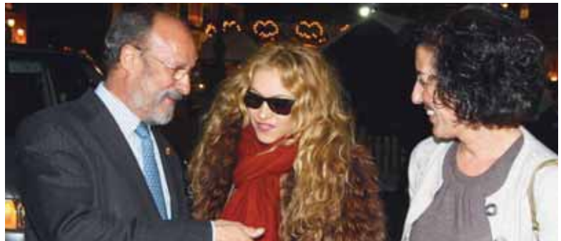
Paulina Rubio junto a León de la Riva y Mercedes Cantalapiedra.

Precisamente, la cantante mejicana visitó Valladolid y fue la encargada de dar el pistoletazo de salida a, según el alcalde "la mayor cita mundial de la música en castellano". Rubio cautivo a todos los representantes del Ayuntamiento, y aunque su visita fue breve, apenas una hora, supo meterse en el bolsillo a todos sus fans. "Cantaré éxitos de antes y también canciones del nuevo disco", comentó para posteriormente animar a todos los amantes de la música a acudir en mayo a Valladolid: "Este festival es un reflejo de mi música y mi mensaje de amor. Hay que pasarlo bien y olvidarnos de nuestros problemas".