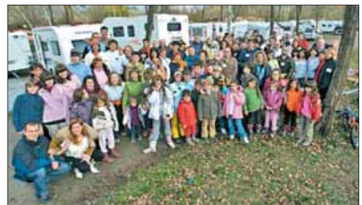
Algunos de los campistas que acudieron para apoyar a Burgos 2016