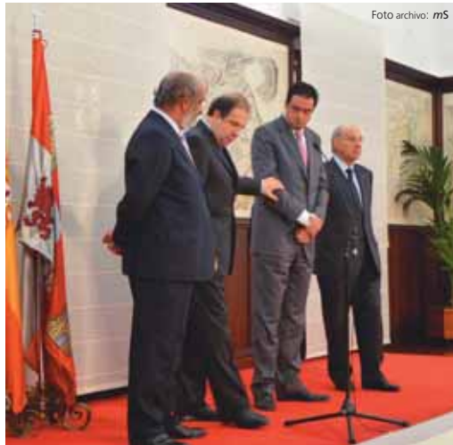
Herrera y López con los presidentes de Caja Duero y Caja España.