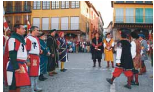
Celebración del Día del Tratado en Tordesillas.

En el resto de la provincia no han sido necesarias actuaciones significativas, al margen de los ordinarios trabajos de conservación que realiza la empresa encargada del mantenimiento de la Red de Carreteras de la Diputación.