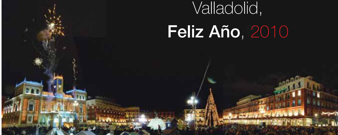
D + Fotografía: mS