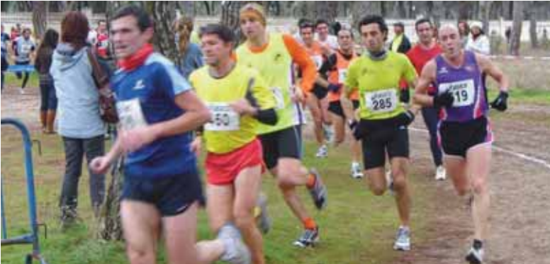
Los atletas recorren el circuito del Pinar de Antequera durante la pasada edición.