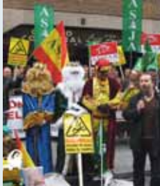
Momento de la manifestación.