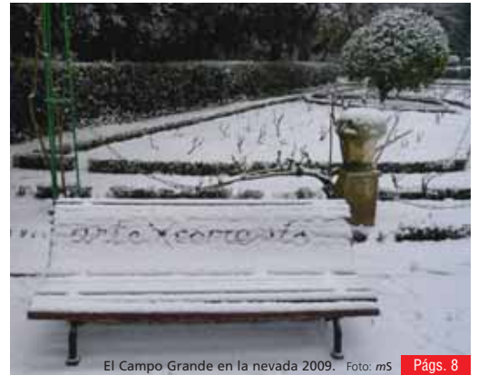
El Campo Grande en la nevada 2009.

La ola de frío polar que azota España, debido a la entrada de aire frío del norte, no dejó a nadie indiferente durante la jornada del jueves en Valladolid. El viento acrecentó la sensación térmica de frío. El temporal de frío se verá intensificado el próximo domingo, día en el que se espera que los termómetros descendan hasta los 6,4 grados bajo cero y puedan volver las nevadas. En Castilla y León se ha activado la alerta.