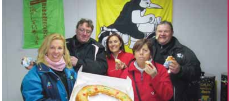
Los pilotos italianos procedentes de Ferrara degustan un roscón de Reyes junto a compañeros españoles.

Hasta el domingo 10 se celebra la mayor concentración motera nacional. El sábado por la mañana, cita en la Acera de Recoletos