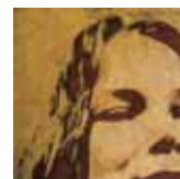
Portada y título de su último disco: Lhasa

(Publicado en su página web http://lhasadesela.com )