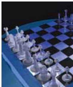
Tablero de ajedrez