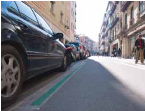
Los residentes también tendrán que pagar algo más este nuevo año.

les mantendrán el mismo precio que en 2009. Por ejemplo, el impuesto de vehículos de tracción mecánica de entre 16 y 19 caballos costará 175 euros, mientras que el que tenga más de 20 caballos pagará 219,80 euros.