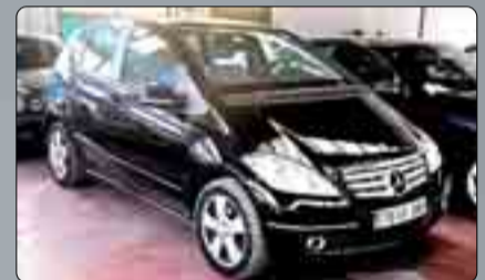
Mercedes Clase A 180 CDI Avangarde Año 2009. 4 Airbags. ABS. ESP. Climatizador. Dirección asistida. Espejos eléctricos y abatibles. Llantas de aleación. 2 años de garantía.