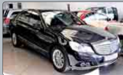
Mercedes Benz Clase E 220 CDI Elegance Blue Efficient Año 2009. Techo solar. Partronik. Navegador. Alarma. Asientos calefactados. ABS. ESP. Climatizador. Cambio automático. 2 años de garantía.