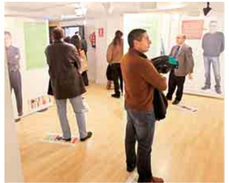
La exposición puede visitarse hasta mayo en el Foro Solidario de Caja de Burgos, C/Manuel de la Cuesta, 3.