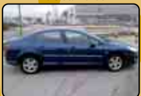
PEUGEOT 407 HDI 1.6 ST Comfort. Año 2006. Abs. ESP. 9 airbags. Clima bizona. 9.800 €. 1 Año de garantía.