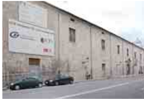
Hospital de la Concepción en la calle Madrid.