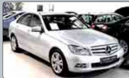
Mercedes C 220 Avant Garde Año 2009. 10 airbags. DA. CC. EE. Navegador. Techo solar. Partronik. Asientos calefactados. Varias unidades. 2 años de garantía.