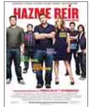
HAZME REÍR Dir. Judd Apatow. Int. Adam Sandler, Seth Rogen. Comedia/drama.