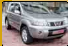
NISSAN X-TRAIL 2.2 DCI 136 cv. 4X4. Año 11/2005