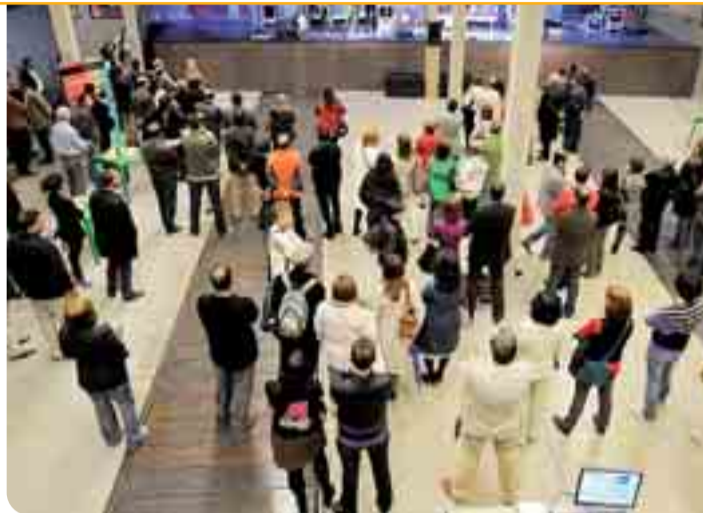
Del 3 al 12 de marzo El Hangar será testigo de este novedoso concurso.

Exposición 'Enfermedades ¿¿raras!?'. Fecha: Hasta el 15 de marzo. Lugar: Foro Solidario Caja de Burgos, C/ Manuel de la Cuesta 3. Con la colaboración de las asociaciones que trabajan de forma activa en la ciudad y en la provincia se pone cara y se da voz a unos enfermos que explican sus carencias y reivindicaciones.