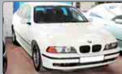
BMW 525 TDF Año 1996. DA. CC. EE. Cambio automático. Clima. Sin garantía.