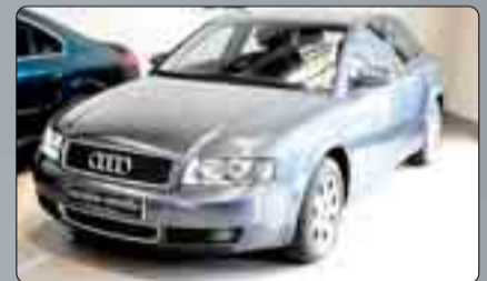
Audi A4 1.9 TDI Año 2003. 6 Airbags. ABS. ESP. Dirección asistida. Climatizador bizona.