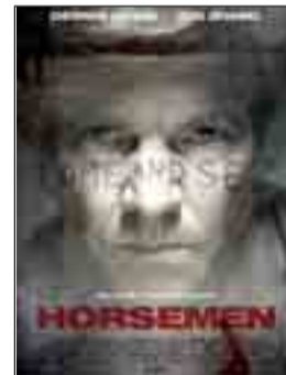
LOS JINETES DEL APOCALIPSIS (HORSEMEN) Dir. Jonas Åkerlund. Int. Dennis Quaid, Zhang Ziyi. Thriller.