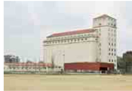
El Silo estaría destinado al cine y al arte.