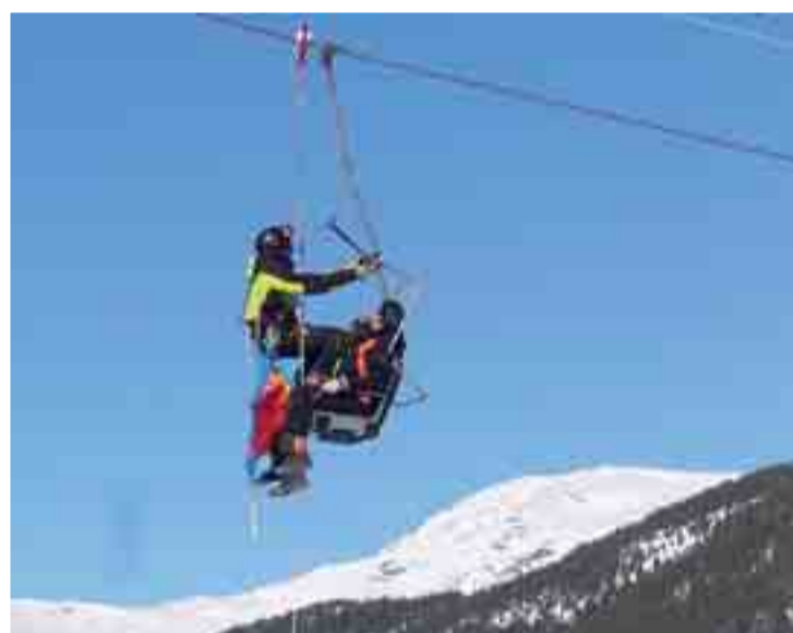
Espectacular exhibición de rescate en un telesilla de la estación.