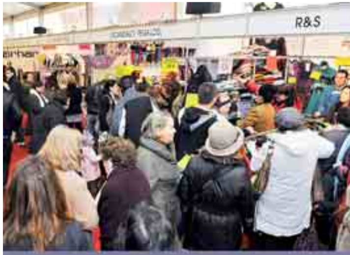
En 2009 se concedieron 6.182 hipotecas sobre viviendas en Burgos.

En diciembre de 2009 se constituyeron 346 hipotecas sobre viviendas, 157 menos que en el mismo mes de 2008