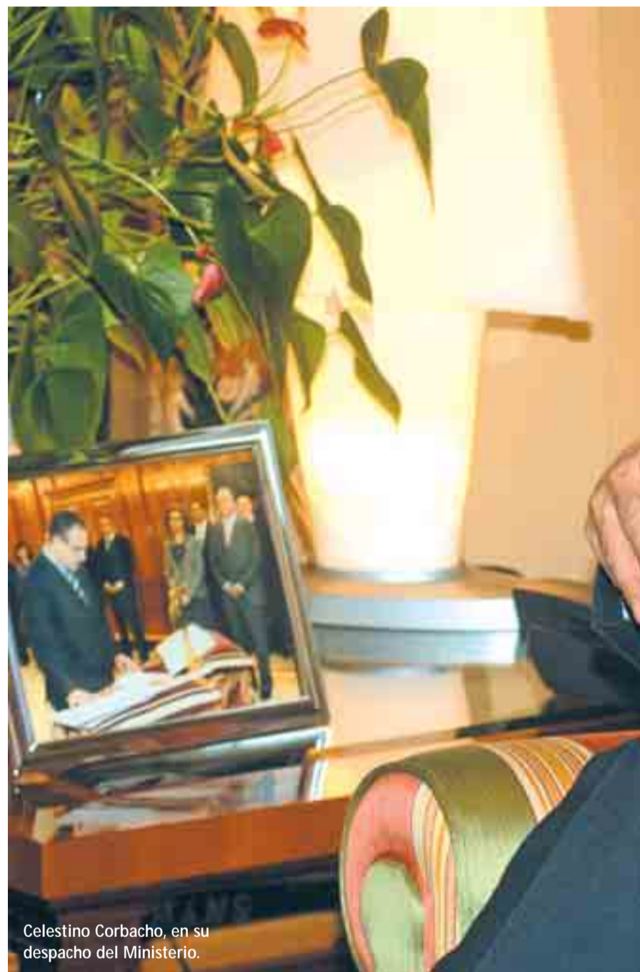
Celestino Corbacho, en su despacho del Ministerio.

En el contexto de crisis económica, las cuentas de la Seguridad Social siguen teniendo superávit, y de hecho ha sido superior al que nosotros mismos preveíamos a principios de 2009. Es un balance que, desde luego, no pueden hacer muchas instituciones ni muchas empresas. Es una buena noticia que da seguridad a todas las personas que cobran pensiones de jubilación, viudedad, orfandad... La previsión es que 2010 se cierre también con más ingresos que gastos, de manera que las cuentas están saneadas.