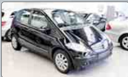
Mercedes Clase A 150 Gasolina Elegance Año 2008. Dirección asistida. Elevalunas. Cierre Centralizado. Climatizador. ABS. ESP. BASS. Alarma. 2 años de garantía.