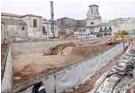
El Monasterio de San Juan en San Lesmes.