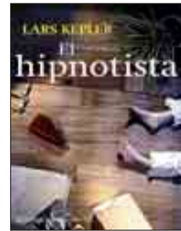
EL HIPNOTISTA Lars Kepler. Novela negra.