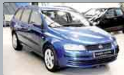
Fial Stylo JTD Wagon Año 2005. 6 Airbags. ABS. Climatizador. Barras en el techo. Llantas de aleación. Cierre centralizado.