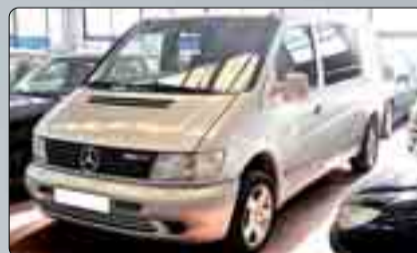
Mercedes Vito 110 CDI Mixta Año 2002. Dirección asistida. Asientos giratorios. ABS. Elevalunas. Asiento cama.