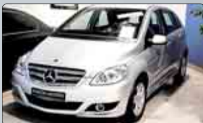
Mercedes Clase B 180 CDI Año 2009. 4 Airbags. DA. CC. EE. Navegador. Llantas de aleación. Sensor luz. Varias unidades. 2 años de garantía.