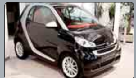
Smart Fortwo 62 Pasión. MHP Año 2009. 2 airbags. ABS. ESP. Climatizador. Dirección asistida. elevalunas. Techo. RadioCD. Llantas de aleación. 2 años de garantía.