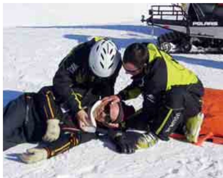
Simulacro de una correcta inmovilización de un herido.

En definitiva, Cerler se preocupa por la seguridad de sus clientes y ha organizado esta primera Semana de la Seguridad con vocación de permanencia.