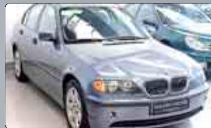
BMW 320 D. Año 2002. DA. CC. EE. Clima. ABS. ESP. Volante multifuncional.