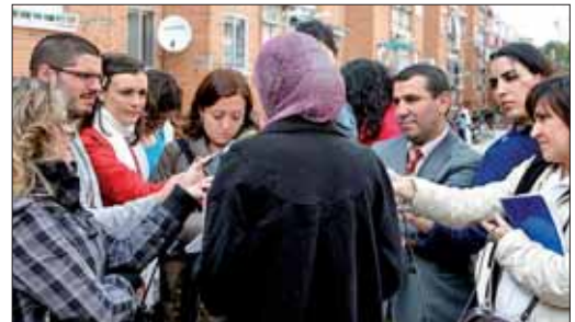
Nawja atiende a los periodistas a la entrada de su instituto

La consejería del ramo de la Comunidad de Madrid ha confirmado que a petición de la Dirección del IES, el traslado a un instituto que sí admita el 'yihab' en el mismo municipio se realizaría de forma inminente. El padre de la menor de 16 años ha asegurado que todo este revuelo y críticas hacia ella