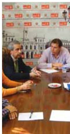
Momento de la reunión.

se traducen en beneficio para la gente", como el gasto de 13 millones de euros en la plaza de Usos Múltiples, dinero con el que Puentes recordó que "podría hacerse mucho por la ciudad. Sobre todo si se tiene en cuenta que hay tres centros cívicos acabados y sin abrir, o destinando 1.200.000 euros, menos del 10 por ciento de lo que se van a gastar en esa plaza, a crear en un año un total de 400.000 plazas de guardería".