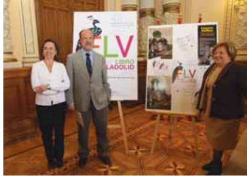
Presentación de la Feria del Libro de Valladolid.

rendirá tributo serán Miguel Hernández y a Francisco Pino, en el centenario de sus respectivos nacimientos, así como al historiador Julio Valdeón y a los poetas Victoriano Crémer y José Miguel Ullán. Presentes en la cita estarán Juan José Millás, Eduardo Punset, David Trueba, José Antonio Marina, Juan Manuel de Prada, Carmen Iglesias, Lorenzo Silva, Luis Goytisolo, los humoristas gráficos Forges e Ibáñez (Mortadelo y Filemón), los presentadores de televisión Susana Griso y Cristian Gálvez y el músico Luis Eduardo Aute. La programación incluye una sesión dedicada al libro electrónico.