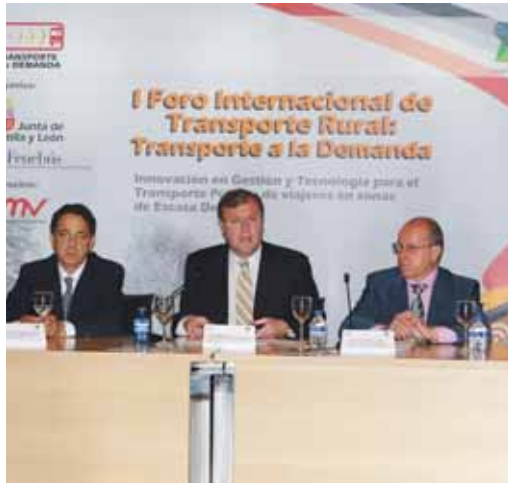
El consejero de Fomento, Antonio Silván, durante la inauguración.

tarde, versó sobre las experiencias internacionales en el transporte rural y contó con la presencia del consejero delegado de ALSA y representantes del sector del transporte de Holanda, Suecia y Suiza así como de la empresa especializada en transporte internacional, ITS.