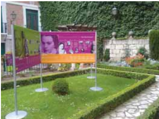
Murales dedicados a Miguel Delibes y Dulce María Loynaz.

Por su parte, la Casa de José Zorrilla organiza hasta el 28 de abril (martes a sábado de 10 a 14 y de 17 a 20 y domingo y festivos de 10 a 14) una exposición de documen-