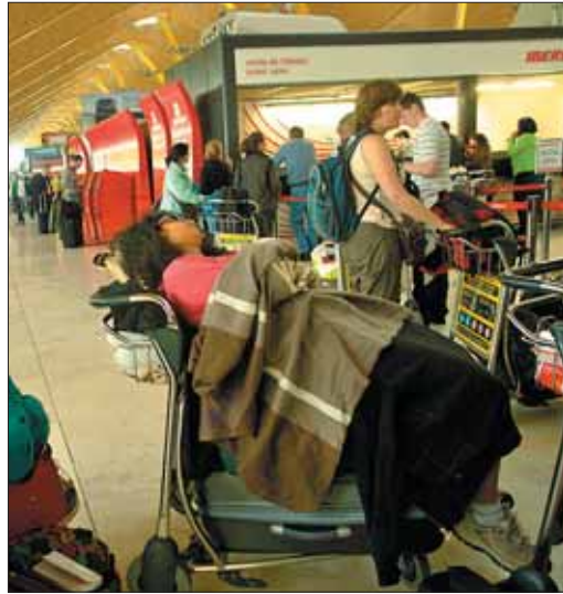
Imagen de la T-4 de Barajas durante el colapso aéreo

dan en reclamar a la Comisión Europea y a los Estados miembros ayuda para repatriar a los miles de pasajeros atrapados y para hacer frente a las millonarias pérdidas que están sufriendo desde que la UE decidiera el cierre de la mayor parte del espacio aéreo del continente. Una decisión cargada de polémica. Las principales asociaciones de compañías aéreas consideran que los países europeos "han transformando una crisis en una catástrofe económica". Y es que el caos comenzó a remitir cuando los minis-