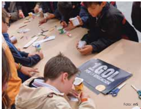
Los escolares participaron en talleres en la Pza. de la Universidad.

Lo que se pretendía era que los alumnos conocieran los valores de la educación, y por ello, todas estas actividades relacionaban de una u otra forma la actividad con el elemento educativo. Un ejemplo de ello fue la actividad específica de 'Un gol por la educación', en la que