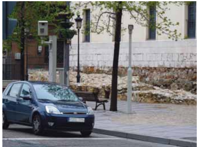
Radar situado en la Plaza del Poniente.

Los datos reflejan que cada año se multa más. Pese a ello, el alcalde reconoció que en determinados barrios como Parque Alameda o Girón las asociaciones vecinales piden la instalación de mecanismos de este tipo, por lo que se podrían añadir nuevos radares en los próximos meses.