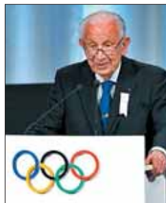
Juan Antonio Samaranch

fallecido a causa de las complicaciones de una insuficiencia coronaria aguda. Miles de ciudadanos mostraron su cariño y respeto en la capilla ardiente de este icono del Deporte y de las relaciones institucionales que transmitió como nadie los valores olímpicos.