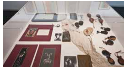
Detalle de alguno de los elementos que componen la exposición.

La Diputación de Valladolid, además, dedicará una de las butacas del Teatro Zorrilla a la figura del bailarín Vicente Escudero. Una placa con la leyenda ‘Vicente Escudero 1888-1980 coreógrafo, bailarín’ recordará a los asistentes al teatro la importancia de este vallisoleta-