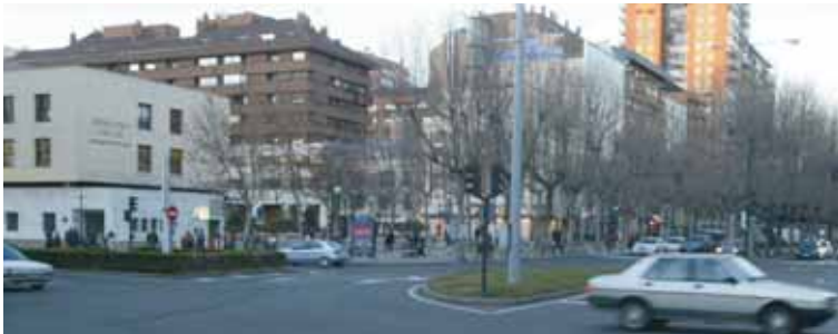
Las obras del Paseo Zorrilla se extenderán durante los próximos cuatro meses.

El Ayuntamiento pretende preparar la vía para asimilar el incremento de tráfico cuando comience el soterramiento