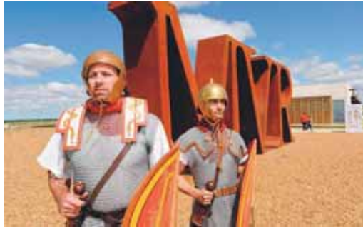
Teatralización en el Museo de las Villas Romanas de Almenara-Puras.

Por otra parte, el Museo de las Villas Romanas contará con visitas teatralizadas a la villa romana de Almenara-Puras, donde se van a escenificar para los visitantes dos pequeñas interpretaciones en las que el señor de la Villa dará la bienvenida al público presente, desde su cuadriga romana, y será el encargado de inaugurar las fiestas y los