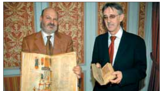
Editores de Siloé con otros de sus facsímiles publicados

en exclusiva su facsímil. Ya han realizado las fotografías de sus páginas, y calculan que en un año saldrán a la venta los 898 ejemplares certificados ante notario, que hasta a los expertos hacen dudar entre original y copia: "El Beato salió de España y ahora podrá volver a España".