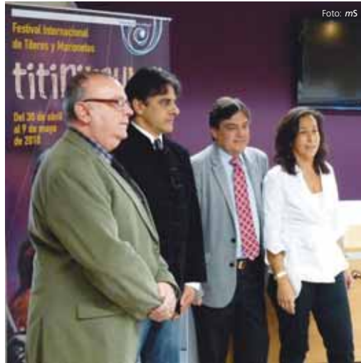
Los organizadores del Festival posan junto al cartel.

Los espectáculos programados en la Sala Ambigú serán los días 30, 1, 2, 7 y 8 de mayo. Y comienzan con el montaje de títeres 'Manoviva', de la compañía italiana Girovago y Rondella.