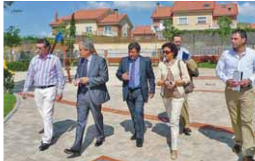
El delegado territorial junto al alcalde y la diputada de Acción Social.

La visita se inició en la calle Picones, donde se han instalado nuevas jardineras, continuando en la parte trasera de la Plaza de Toros, donde se han construido dos pistas de deportes tradicionales, la carretera de Cigüñuela y la entrada a la Urbanización Sotoverde, en las que se ha realizado una de plantación autóctona. La