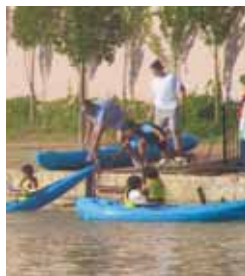
Piraguas en el Canal de Castilla.

Dentro de las ofertas de actividades se encuentra el alquiler de