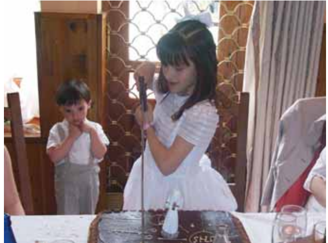
La Primera Comunión es un día muy especial para toda la familia.

Y eso por no hablar del "equipamiento" que necesitan los niños y niñas para ir acorde con el momento y de la que necesitan los padres y hermanos para acompañarlos. Los regalos más elegidos para estas fechas, entre los vallisoletanos, vuelven a ser de tipo electrónico y videojuegos, entre ellos primas cámaras de fotos digitales y las videoconsolas portátiles tipo DS 1