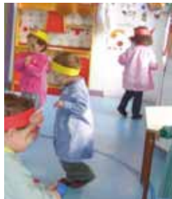
Niños jugando en la guardería.

Su entrada en funcionamiento conllevará la creación de 5 nuevos empleos