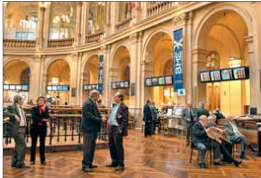
Parquet de la bolsa madrileña

La agencia de calificación crediticia Standard & Poor's ha decidido rebajar el rating para España de AA+ a AA, es decir de notable alto a notable. Una decisión que llegaba un día después de que anunciara la calificación de la deuda griega como 'bonus basura' y situara las emisiones lusas en un suficiente bajo. Ante el revuelo montado por la incertidumbre acerca de que la rebaja en la solvencia española en los mercados bursátiles pudiera derivar en un efecto dominó tras la debacle económica helena, S&P ha salido al paso y ha explicado que existen diferencias fundamentales con España a quien califica como "un emisor con una capacidad muy fuerte para cumplir con sus compromisos