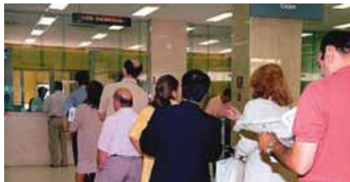
Los bancos ofrecen durante estos días ofertas de planes de pensiones.

que sólo 68.898 vallisoletanos cuentan actualmente con estos productos de ahorro e inversión como complemento a la pensión pública. En total, las aportaciones a estos fondos privados de pensiones alcanzaron los 115,2 millones de euros anuales en la provincia, con una media de apenas 1.672 euros por trabajador. Los Técnicos de Hacienda atribuyen esta circunstancia a la escasa capacidad de ahorro de los vallisoletanos, ya que la mayoría de ellos en edad de