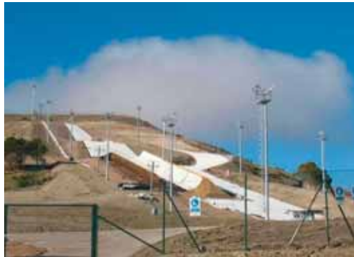
Vista del estado actual de las instalaciones en Villavieja del Cerro.