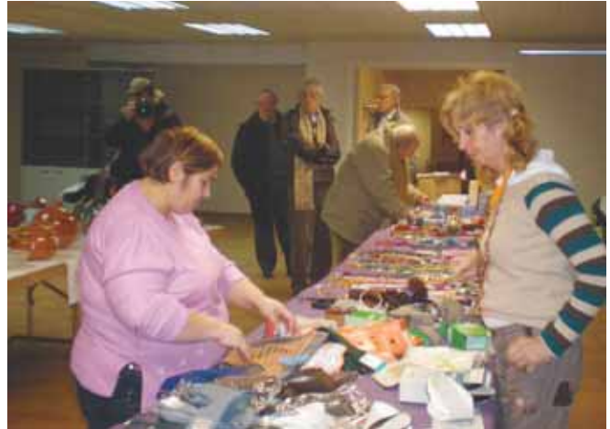
Rastrillo de navidad organizado por Aparval.

En la enfermedad del Parkinson es fundamental la ayuda de los familiares, no sólo en el apoyo posterior al descubrimiento de la enfermedad sino en la detección de los síntomas. Eso lo saben en Aparval y por ello organizan un grupo de apoyo dirigido a familiares que conviven con enfermos de Parkinson. "Además de su más que inestimable papel como 'ayudantes' del afectado, también tienen sus propias necesidades".