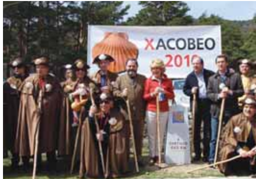
Los tres presidentes junto a los alcaldes asistentes a la firma.

En virtud de esta Declaración se comprometen a seguir trabajando y a facilitar la participación de cuantos entes locales, asociaciones, entidades públicas y privadas lo deseen, en beneficio de la cohesión, promoción y divul-