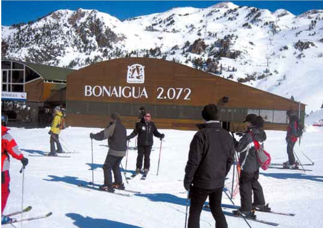
Los esquiadores cuentan cada vez con más posibilidades de acercarse a Baqueira Beret