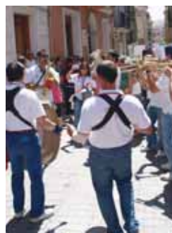
Charangas en la pasada edición.

que comenzará el sábado a las 17.45 horas en la Plaza del Salvador, desde donde saldrá el tradicional desfile, en el que todos los participantes se dirigirán a la Plaza del Coso para interpretar un multitudinario Paquito el Chocollero y un 'Chúndara' que servirá para recordar que faltan poco más de cuatro meses para que Peñafiel viva las Fiestas de Nuestra Señora y San Roque.