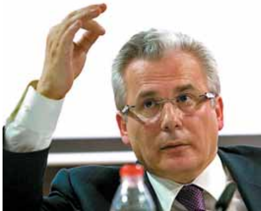
Foto de archivo del juez Baltasar Garzón en una conferencia en Sevilla

Tratar de investigar las desapariciones del franquismo, como ya hiciera con las víctimas de la dictadura de Pinochet, le puede salir muy caro a Baltasar Garzón. El magistrado, protagonista otrora de la crónica nacional por sus actuaciones contra ETA o el narcotráfico, podría ser inhabilitado y apartado de la Justicia por un periodo incluso de 20 años. El juez Varela le ha sentado en el banquillo del Tribunal Supremo y le acusa de prevaricación, argumentando que Garzón era consciente de carecer de las competencias necesarias para investigar los crímenes del franquismo y "sabiendo que éstos habían sido objeto de amnistía