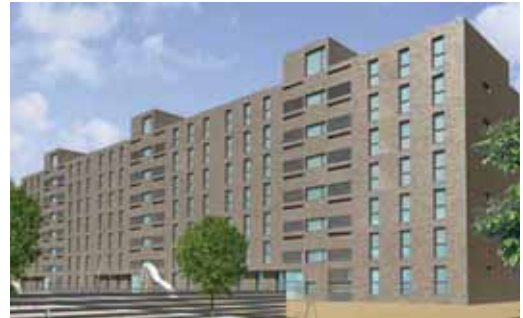
Simulación de los pisos de Covipro en Los Santos Pilarica.

Desde que la Junta de Castilla y León tomara esta decisión las ventas se han acelerado, pero Covipro aún dispone de viviendas desde algo más de 91.000 euros de 2, 3 y 4 dormitorios con 1 ó 2 baños y plaza de garaje. Además de piscina comunitaria y zona ajardinada. Un precio irresistible al margen de las múltiples ayudas oficiales que se ofrecen