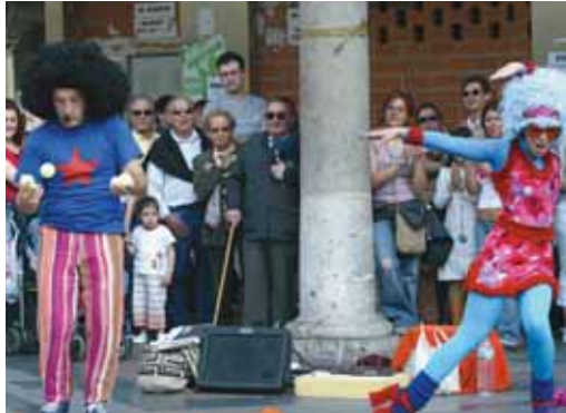
Un momento del espectáculo de una edición pasada.

Las entradas para los espectáculos de aforo reducido y salas cerradas saldrán a la venta el 10 de mayo, así, las primeras tendrán un coste de tres euros. Mientras que las representaciones en espacios como el Teatro Zorrilla y la Sala Ambigü costarán ocho euros, y en el Teatro Calderón, que este año se suma al TAC, se mantendrán los precios habituales de la sala.