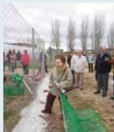
Uno de los huertos ecológicos.

■ El Ayuntamiento inauguró la campaña del Programa de Huertos Ecológicos que permitirá a 431 beneficiarios, en su mayoría personas mayores de 60 años que estén empadronados al menos con un año de antigüedad, labrar tierras fértiles con el asesoramiento del personal de la Escuela de Ingeniería Técnica Agrícola. Este año, como novedad, habrá visitas escolares en el que participarán diez colegios.