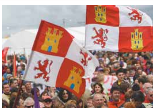
Campa de Villalar con las banderas ondeando al aire.