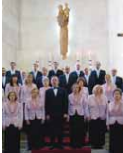
Imagen del año pasado.

■ La asociación de antiguas alumnas Esclavas del Sagrado Corazón de Valladolid organiza el viernes, 9 de abril, un concierto solidario de música clásica en colaboración con Caja España cuyos fines se destinarán al mantenimiento de un parvulario en Filipinas. El concierto tendrá lugar a las 20.30 horas en el salón de actos de Caja España de Fuente Dorada y estará protagonizado por músicos del Conservatorio de Música de Valladolid, quienes interpretarán piezas de Mozart, Beethoven, Chopin o Albéniz.