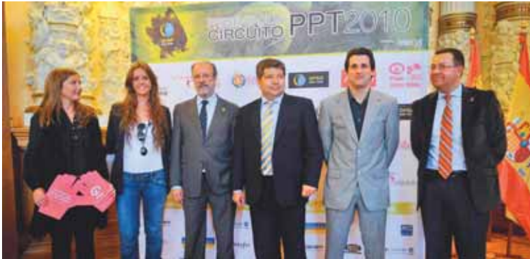
Momento de la presentación del circuito Pádel Pro Tour.