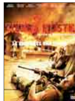
EN TIERRA HOSTIL Dir. Kathryn Bigelow. Int. Jeremy Renner, Anthony Mackie. Bélica.