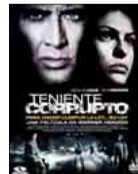
TENIENTE CORRUPTO Dir. Werner Herzog. Int. Nicolas Cage, Eva Mendes. Drama.