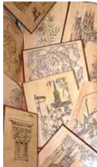
Obras de pirograbado.

un 70 y 85 de puntuación en coeficiente intelectual (CI), cuando en la población general oscila entre 85 y 115; tienen un desfase entre su edad cronológica y su edad mental; presentan dificultades en las relaciones afectivas; no asumen