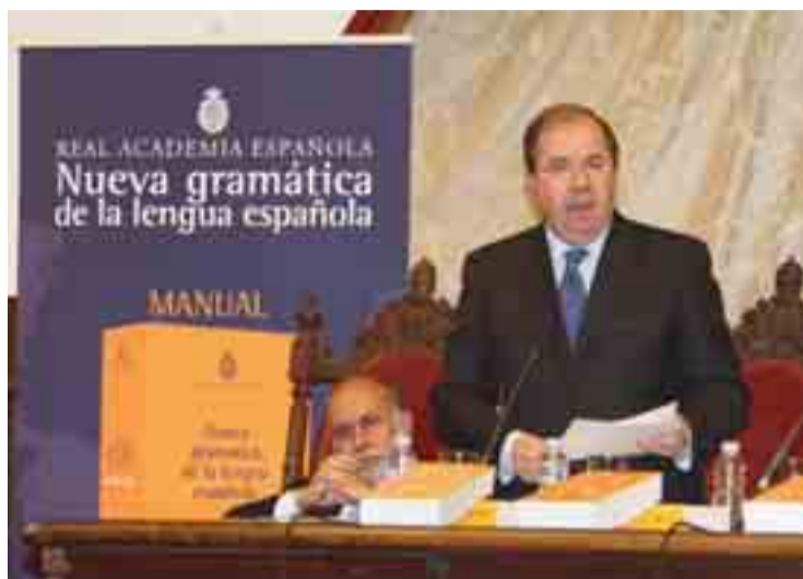
Juan Vicente Herrera dirigiéndose a los asistentes durante la presentación.

también el gran esfuerzo de perfeccionamiento y divulgación que supone la publicación del Manual de la Nueva Gramática de la Lengua Española y ha señalado que "presentarlo en Salamanca tiene un especial significado, por cuanto en Castilla y León, cuna de la lengua castella-