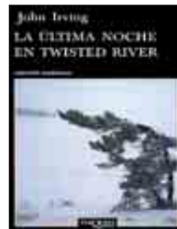
LA ÚLTIMA NOCHE EN TWISTED RIVER John Irving. Novela.