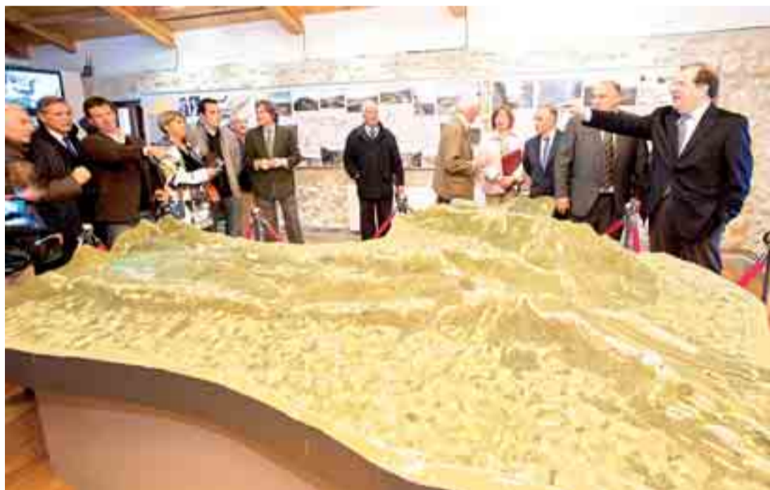
Juan Vicente Herrera, durante la visita que realizó a las localidades de Briviesca y Pancorbo.