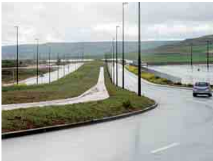
Los nuevos viarios que conectan el polígono de Villalonquéjar y Villatoro entraron en servicio en la tarde del jueves día 13.