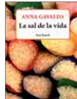
LA SAL DE LA VIDA Anna Gavalda. Novela.