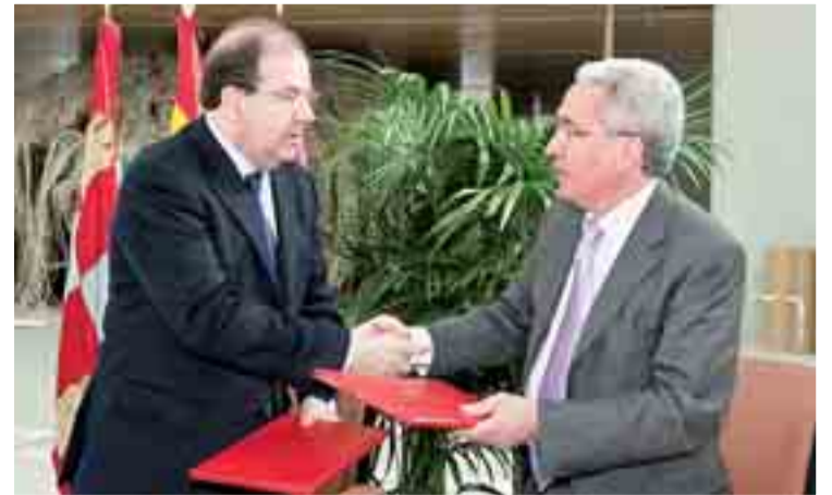
Autoridades en el aparcamiento del Museo de la Evolución Humana.

Las dos entradas al subterráneo se encuentran en las calles San Pablo y Burgense, mientras que las rampas de salida están en esta última vía y Doctor Fleming. Con este acuerdo, aparcar en el centro de la ciudad será más fácil desde el mes de julio.