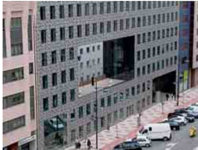
La nueva sede es obra del arquitecto burgalés Andres Celis.

Ubicado en el número 24 de la Avenida de la Paz, ocupa una superficie de 2.300 metros cuadrados distribuidos en seis plantas y dos sótanos. En este entorno también se reparten cinco oficinas de 75 metros cuadrados, dos de 100 metros cuadrados y un local comercial