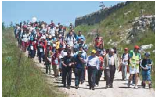
El presidente de la Diputación junto a niños y profesores durante la ruta.

Además de poner en valor el Camino de Santiago, concretamente la Ruta de Madrid que pasa por la provincia de Valladolid, los objetivos generales de este encuentro de escuelas rurales han sido desarrollar la socialización y convivencia entre alumnos de diferentes comarcas, ampliar el campo de experiencias motrices de los alumnos y dar a conocer posibles actividades de ocupación, de ocio y tiempo libre