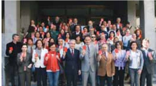
La sociedad vallisoletana se manifestó contra la violencia de género.

El subdelegado del Gobierno, Cecilio Vadillo, explicó la campaña a distintos colectivos, en una jornada informativa y en la que participaron numerosos representantes de asociaciones y entidades. Vadillo apuntó que "para prevenir la violencia de género es fundamental la sensibilización del entorno de las víctimas y la creación de conciencia crítica para no tolerarla. Por eso, uno de los principales objetivos del Ministerio de Igualdad es aumentar la concien-