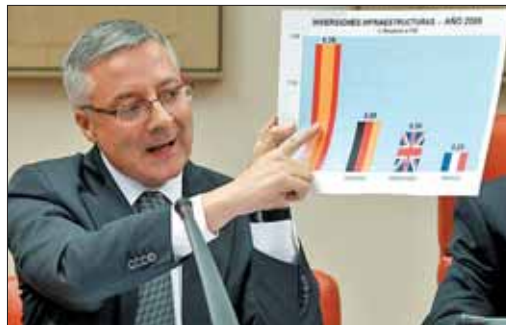
José Blanco explica el plan de austeridad de Fomento

2010 y 2011, lo que supondrá un retraso medio en las obras de carreteras y ferrocarriles de al menos un año. Blanco ha señalado que estos recortes afectarán a todas las comunidades autónomas y a toda la obra pública proyectada. No obstante, ha señalado que buscarán nuevas vías de financiación a través de la cooperación de la inversión privada y el mayor compromiso de los ejecutivos