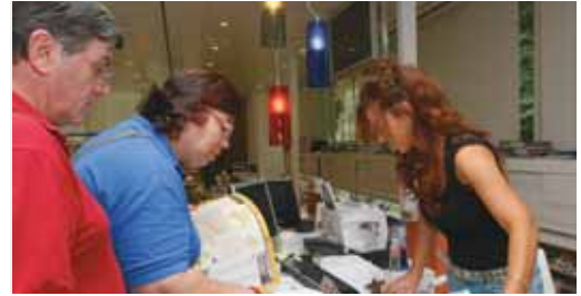
Valladolid es una de las ciudades favoritas por el turista.

Estos bonos serán canjeables, gratuitamente, por la tarjeta Valladolid Card, por una visita turística guiada, por un descuento del 12% en cualquiera de los treinta y seis restaurantes que colaboran en