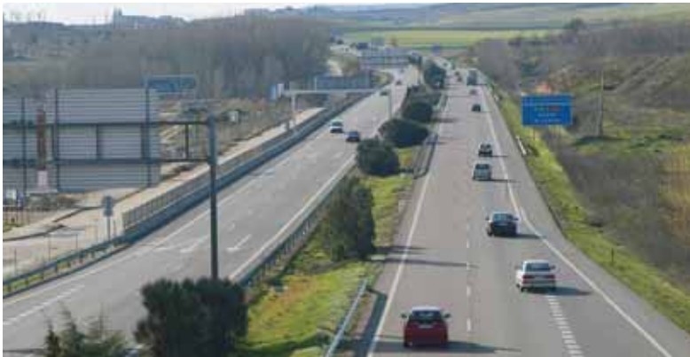
La nueva Ley de Tráfico entrará en vigor el próximo lunes 24 de mayo.

Se eleva del 30% al 50% el descuento a los conductores que paguen su sanción durante los 20 días posteriores a la notificación