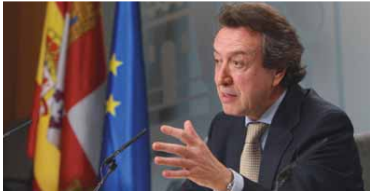
El consejero de la Presidencia y portavoz durante la rueda de prensa posterior al Consejo de Gobierno.

La Consejería de Educación financiará actuaciones de las áreas de ciudadanía, cooperación técnica y educación al desarrollo. En el apartado de ciudadanía, la Administración educativa regional colaborará en diez becas de postgrado con 100.000 euros. También, financiará con 550.000 euros el proyecto educativo Haití, con el que se rehabilitarán y reconstruirán las infraestructuras educativas.