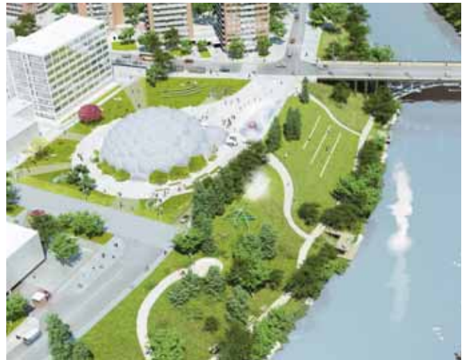
Simulación de cómo quedará la actual zona de Usos Múltiples.

y el cambio de imagen del puente de Isabel la Católica que pasará a tener seis aerogeneradores silenciosos y 140 metros cuadrados de vidrio fotovoltaico instalados en las barandillas generarán 22.600 kilovatios al año. Para consultar los detalles de la actuación se ha creado una página web ( www.plazadelmilenio.es ), mientras que la espectacular maqueta será expuesta desde mediados de junio en la Casa Revilla, durante todo el verano, para que los ciudadanos puedan conocer de primera mano la magnitud del proyecto.