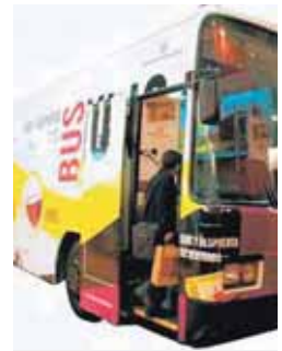
Imagen del Bus Vino.

La Diputación pone en marcha el sábado 22 de mayo el programa del Bus Vino en la Denominación de Origen 'Tierras de León'. Los participantes saldrán a las 11,00 horas de Valladolid (Plaza de San Pablo) para realizar sobre las 12,00 horas una visita en el municipio de Cuenca de Campos a una bodega tradicional y degustación del vino elaborado en el municipio. Posteriormente se llevará a cabo la comida en Mayorga donde el menú será del Museo del Pan. A las 16,30 horas se realizará la visita al Museo del Pan y las Bodegas Meóriga.