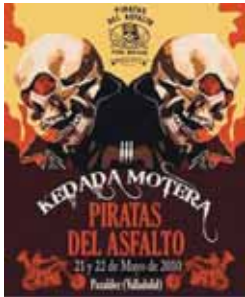
Cartel de la concentración.

Esta iniciativa cuenta con el patrocinio de EuroPapi, empresa textil