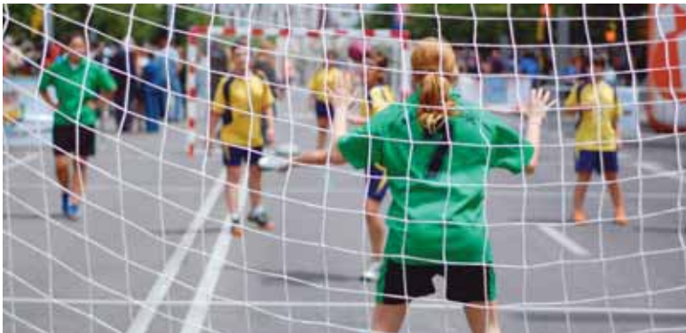
La Acera de Recoletos se convertirá en el 'pabellón' para disputar el día del balonmano en la calle.