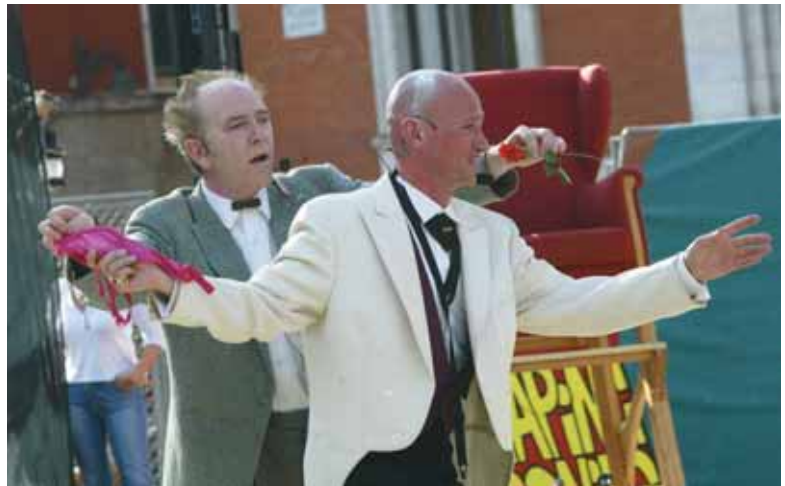
Las calles de Valladolid se llenarán durante estos días de humor, fantasía y espectáculo.

El TAC contará para esta edición con 63 compañías (ocho de ellas de Valladolid) de 17 países, que ofrecerán dos centenares de representaciones en 33 espacios urbanos. Habrá ocho estrenos nacionales y 14 estrenos absolutos. Para esta edición se hará especial hincapié en la máscara como recurso escénico y teatral. El teatro, el circo, la danza, las performances y los espectáculos de interacción con el público de compañías tanto nacionales como internacionales llenan las calles de Valladolid durante el TAC, donde la directora, coreógrafa y bailarina Marta Carrasco, "referente del teatro, la danza y la performance", recibirá este año el Premio Homenaje