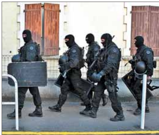
Policías franceses durante la operación realizada en Bayona