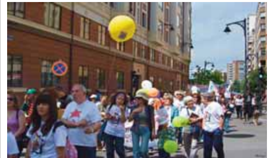
Celebración de la fiesta de la escuela pública durante el año pasado.

El sábado 22 con actividades y lectura de manifiesto