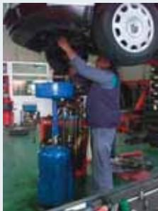
Taller de reparaciones.