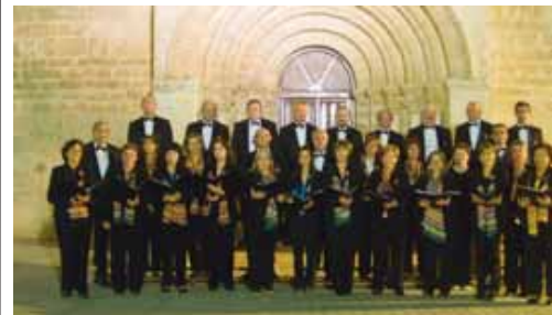
Las corales se volverán a reunir en Arroyo de la Encomienda.

realizado diversas inversiones en el municipio de Pesquera de Duero que ascienden a un total de casi 900.000 euros desde el año 2004 y que han consistido en: obras de urbanización, en obras de creación y mantenimiento del pabellón multifuncional, obras de urbanización de calles y plazas del municipio, obras del Centro de Convivencia y obras de mantenimiento de servicios de la localidad, entre otras muchas.