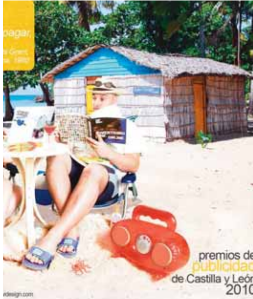
Cartel de esta cuarta edición de los Premios de Publicidad.

Para la categoría reina de Mejor Campaña se eligieron cuatro propuestas, resultando gana-