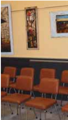
Cuadros de la exposición.

Además, ahora ARVA cuenta con una ocioteca donde los padres pueden dejar a sus hijos. "Muchos nos decían que no podían acudir la terapia porque no tenían donde dejar a sus niños. Ahora ya no tienen excusa", comenta. La ocioteca cuenta con servicio de préstamo de libros, DVD's, juegos, etc.