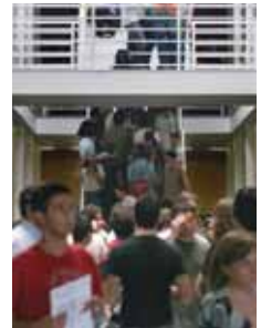
Alumnos antes de la selectividad.