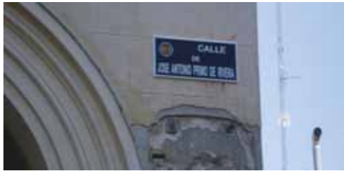
Calle dedicada a José Antonio Primo de Rivera.

Un censo realizado por el Ateneo Republicano, que insta a las administraciones públicas a tomar medidas oportunas para la retirada de escu-