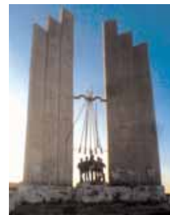
Monumento a Onésimo Redondo. dos, insignias, placas y otros objetos o menciones conmemorativas de exaltación, personal o colectiva, de la sublevación militar, la Guerra Civil y de la represión de la dicta-

Por último, la Plataforma está enviando cartas a las comunidades de vecinos para que planteen la retirada de las placas en la próxima reunión de vecinos.