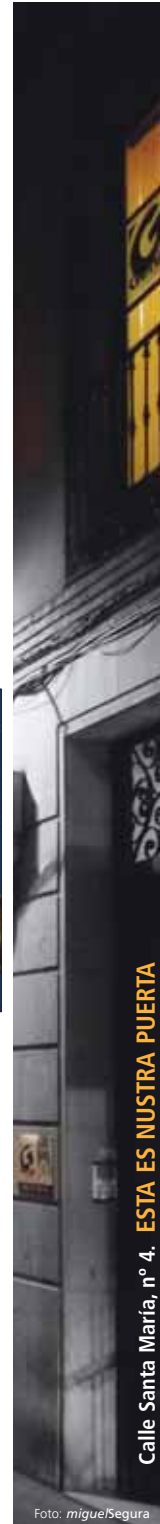
Calle Santa María, n.º 4. ESTA ES NUESTRA PUERTA