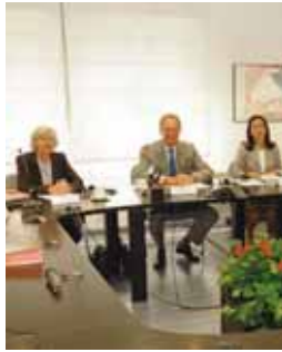
Un momento de la Junta.

■ Renault España obtuvo en 2009 una cifra de negocio de 4.603 millones de euros, un 13,12% más que en el ejercicio anterior; y el resultado neto, después de impuestos, fue de 36 millones de euros de beneficio, frente a los 27,6 de 2008. Además, el cash flow generado por la actividad de Renault alcanzó los 243 millones, lo que equivale al 5,2% de la cifra de negocio que permitió financiar las inversiones de la empresa destinadas en su mayor parte a la renovación de la gama Mégane.