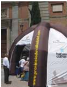
Oferta turística de la provincia.

Instala un carpa hasta el 4 de julio en la Plaza de la Iglesia de Santiago