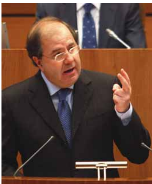
El presidente de la Junta durante una de sus intervenciones.

El presidente afirmó que las decisiones presupuestarias se regirán por siete prioridades básicas, entre las cuales comenzó abogando por las infraestructuras productivas y exigió al Gobierno que aclare qué grado de afectación va a tener la Comunidad, en sus recortes. Al respecto, indicó que "Castilla y León no plantea ninguna demanda insaciable de mejora de sus infraestructuras, reclama las que necesita, que son además las que tan reiteradamente se le han comprometido", agregando que la Junta se compromete a mantener todas las inversiones ya licitadas, incluidas las de carácter plurianual, descartando cualquier paralización de las mismas. Juan Vicente Herrera también