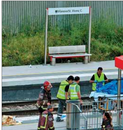
Forenses retiran los cuerpos sin vida de las vías

En ese momento apareció un Alaris que cubrían el trayecto Alicante- Barcelona. El maqui-