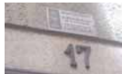
López Gómez, 17.

Policía Nacional en la calle Las Eras en honor de los guardias de Asalto que iniciaron el golpe de estado en Valladolid; los azulejos en la escalera del Palacio de Santa Cruz o el monumento funerario de Severiano Martínez Anido, ministro de Franco, en el Cementerio del Carmen. Sin embargo, el que sigue levantando más ampollas es el monumento le-