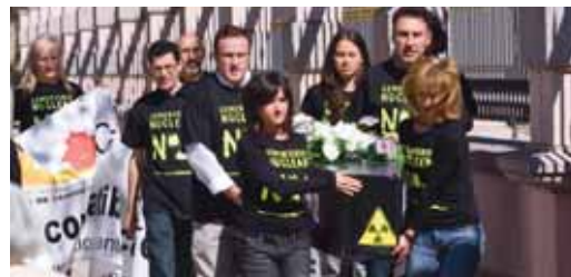
Ecologistas entregan el ataúd con las firmas.

Dentro del ataúd se encuentran más de 17.000 firmas en diversos formatos (tarjetas postales e impresos de recogida de firmas), obtenidas en Castilla y León, mediante las cuales ese número de ciudadanos piden al presidente Juan Vicente Herrera que se oponga de forma rotunda a que Castilla y León albergue el alma-