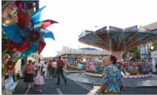
Los barrios se llenan durante estos días de carruseles.

Por su parte, en Huerta del Rey, el viernes 25 habrá una muestra de Danza Castellana (20.30 horas) en la Plaza de la Cebada (Plaza