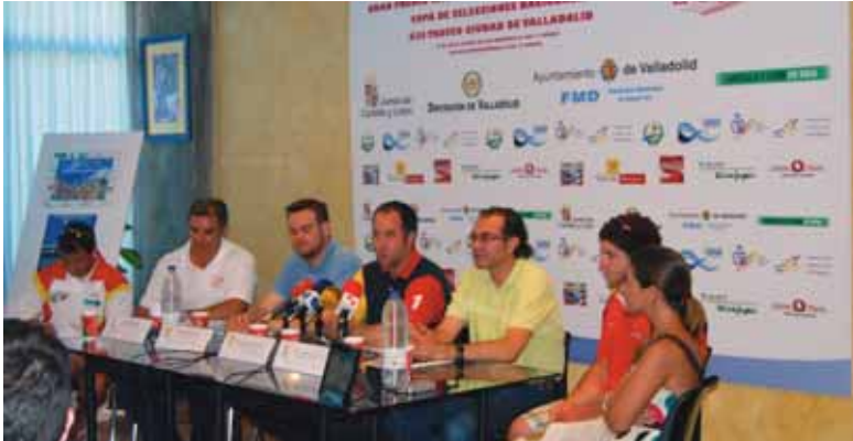
Presentación del trofeo que se celebra el sábado 17 de julio.