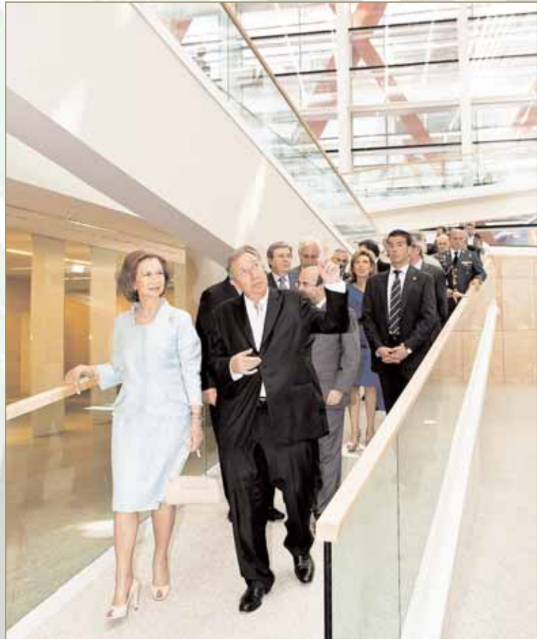
Su Majestad la Reina atiende las explicaciones del arquitecto del MEH, Juan Navarro Baldeweg.