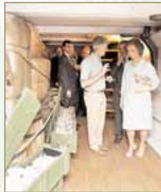
Doña Sofía, con Arsuaga, en el Beagle, reproducido a escala real.