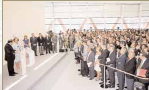
Vista general del numeroso público asistente al acto inaugural.

tió a la entrega del Premio Príncipe de las Ciencias de ese mismo año al equipo investigador de Atapuerca en el Teatro Campoamor de Oviedo.