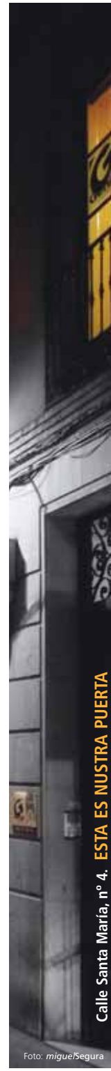
Calle Santa María, nº 4. ESTA ES NUESTRA PUERTA