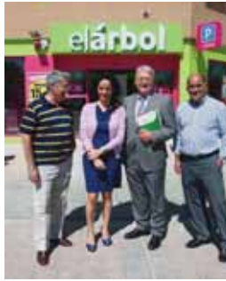
Silvia Clemente en el nuevo Árbol.

■ El Árbol ha inaugurado en la localidad vallisoletana de La Cistérniga, con la asistencia de Silvia Clemente, consejera de Agricultura y Ganadería de la Junta, el primer supermercado de la compañía que incluye el nuevo concepto de establecimiento -más práctico y funcional-, con una nueva imagen -sencilla y moderna-, y con una nueva propuesta comercial más competitiva para prestar el mejor servicio al cliente. Cuenta con un equipo de 24 trabajadores y parking gratuito con 45 plazas.