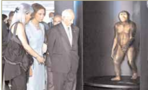
La Reina, en la sala de los homínidos, reproducciones de Elisabeth Daynés.