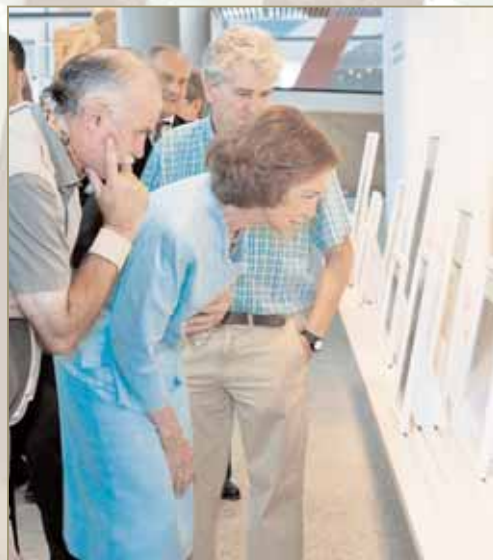
La Reina recorrió con detenimiento el Museo de la Evolución Humana.

Amante de la arqueología clásica y estudiosa de la Historia Antigua, Doña Sofía se detuvo a contemplar cada uno de los