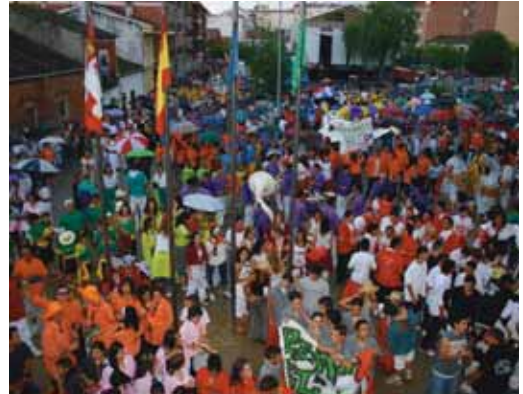
Los barrios se llenan de colorido durante sus fiestas.

Por otro lado, los vecinos del popular barrio de Las Delicias consumen durante estos días los