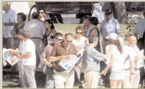
Gente lanzó una edición especial con motivo de la inauguración del Museo de la Evolución Humana.