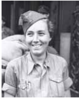
Una de las imágenes de la muestra.

■ La Sala Municipal de Exposiciones de San Benito de Valladolid acogerá entre el 22 de julio y el 29 de agosto la muestra 'Agustí Centelles, colección particular', que reúne un centenar de instantáneas 'vintage' de la Guerra Civil realizadas por el fotoperiodista español. Centelles fue uno de los más destacados fotógrafos de la Guerra Civil, que documentó plásticamente el ambiente de la España prebélica, la guerra desde el bando republicano y dejó testimonios de los exiliados en campos franceses.