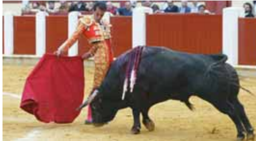
El cartel taurino es uno de los principales actos de la Feria.