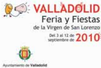
Cartel ganador de la Feria y Fiestas de la Virgen de San Lorenzo.

pal de Cultura hará entrega de los galardones a ambos ganadores en las próximas semanas.