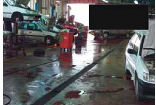
Los talleres vallisoletanos no pueden presumir de sus precios.

En la revisión básica del vehículo, los establecimientos estudiados en Valladolid están por encima de la media (133,4 euros frente a 68 euros), y se sitúan entre los más caros. Asimismo, conviene