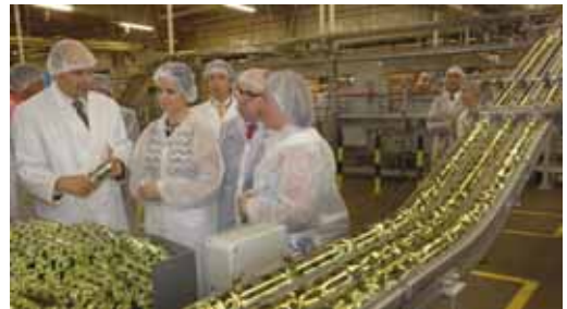
Clemente recorrió las instalaciones y firmó en el Libro de Honor.