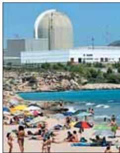
Central nuclear Vandellós II

La central nuclear de Vandellós II, ubicada en la provincia de Tarragona, seguirá funcionando diez años más. Así lo han decidido todos los organismos oficiales que supervisan la gestión de este tipo de instalaciones y así lo ha aprobado el Ministerio de Industria, Turismo y Comercio que ha renovado la licencia de explotación a Iberdrola Generación S.A. y Endesa S.A. responsables de la central. La renovación de la autorización de explotación había sido solicita-