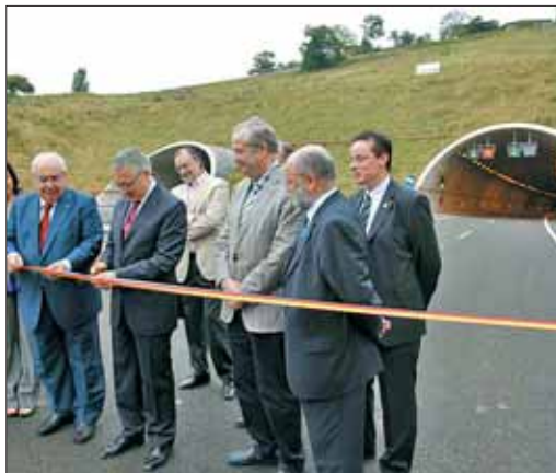
José Blanco inaugurando en julio un tramo de la autovía A-63

Las medidas 'antidéficit' del Gobierno han supuesto el recorte de 6.400 millones de euros en el presupuesto de Fomento en 2010-2011 para inver-