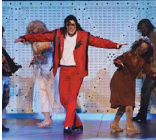
El actor que da vida a Michael Jackson durante la actuación.

El musical, que no se adentra en la vida personal del polémico artista, fallecido en circunstancias aún no esclarecidas del todo y que el 29 de agosto habría cumplido 52 años, cuenta con tres intérpretes para el papel del pro-