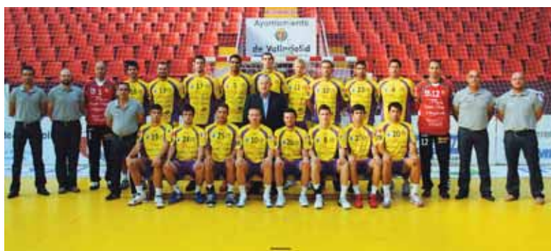
Plantilla del Cuatro Rayas Balonmano Valladolid 2010-11.