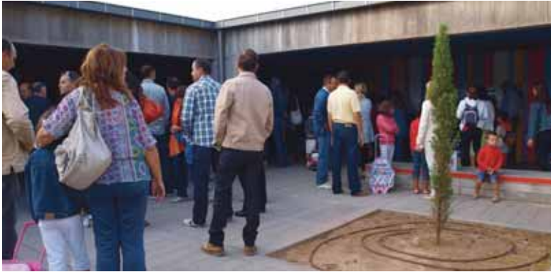
Padres e hijos del colegio Margarita Salas esperan a que el colegio abra sus puertas.

Las aulas de los colegios vallisoletanos se abren para los escolares de Infantil y Primaria. Serán 177 días lectivos para los de Primaria