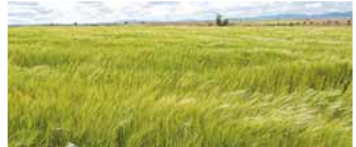
Imagen de la estepa cerealista de Tierra de Campos.

Fuentes informó que en 2009 se cultivaron únicamente 45 hectáreas para la producción de biocarburantes en Castilla y León, algo que obliga a importar la materia prima a las plantas. Fuentes tam-