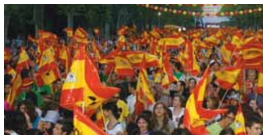
Valladolid logró un nuevo récord.