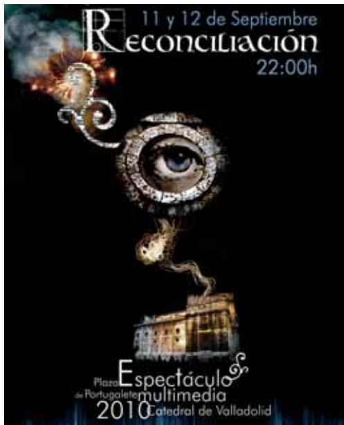
Cartel que anuncia el acto que se celebrará el sábado y domingo.

l regidor ha incidido en que la productora vallisoletana Xtrañas Producciones repite como responsable del espectáculo des-