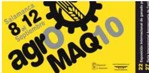
Cartel de la AGROMAQ para la presente edición.

La institución provincial acude a la Feria Alimentaria junto con la Asociación de Productores de Alimentos 'Valladolid es Sabor', de acuerdo con lo establecido en el Convenio de Colaboración firmado con esta Asociación, en el que se establecen las siguientes obligaciones por parte de la Asociación: coordinación y control de las actividades relacionadas con la pro-