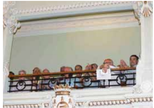
Los protaurinos acudieron a las gradas durante el pleno.

La moción del Partido Popular señala que “entre las señas de identidad de nuestro país, los toros ocupan un lugar destacado” con repercusiones en la cultura, la economía y el turismo. Estas singularidades de Valladolid son, según la moción, que la provincia conserva “la ganadería de reses bravas más antigua de España”, la del Raso de Portillo;