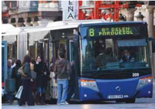
Varios usuarios del transporte urbano acceden al autobús en Valladolid.

en los usuarios del transporte urbano se registró en la Comunidad Valenciana con una caída del 7,6 por ciento, seguida de Mur-