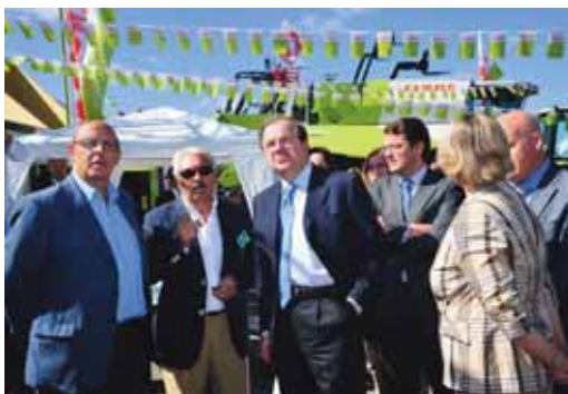
El presidente Herrera durante su visita a la Feria Agropecuaria.

tes "Castilla y León tiene ahora una alternativa de cultivo en un momento complicado para muchos, siempre que se cuente con la apuesta del Gobierno regional".