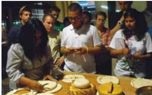
Los alumnos americanos durante su visita al Museo del Pan.

ña, el grupo ha visitado las comunidades autónomas de Madrid, Cataluña, Galicia, Castilla y León y el País Vasco, pero ha sido el Museo del Pan de