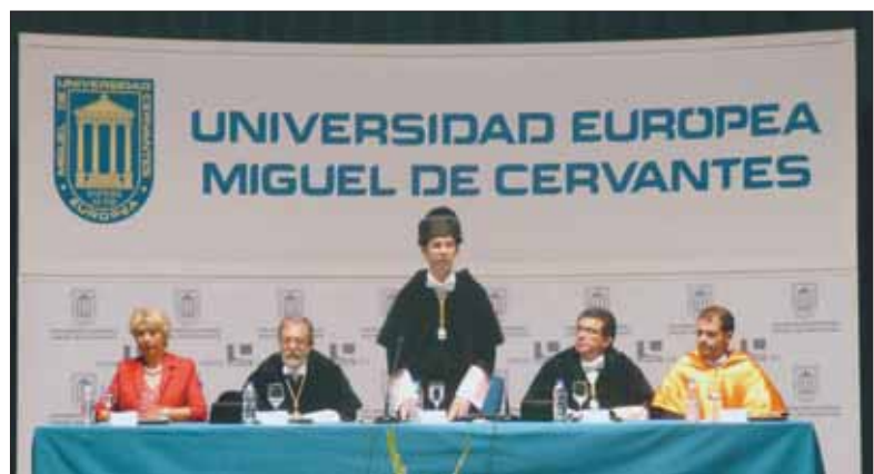
El Rector de la UEMC, en el centro, junto con el de la UVA y la UBU, en el Acto de Apertura.

Posteriormente, el Rector de la Universidad Europea Miguel de