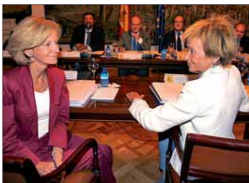
Elena Salgado charla con Teresa Fernández de la Vega

Los Ayuntamientos más prudentes, los que acumulen menos morosidad, podrán endeudarse el próximo año para financiar nuevas inversiones. La ministra de Economía, Elena Salgado, abrió esta semana las puertas a esta modificación al decreto aprobado en mayo que prohibía a los consistorios pedir créditos durante el año 2011. En concreto, podrán acogerse a esta nueva posición los entes municipales que tengan un nivel de endeudamiento inferior al 75% de sus ingresos.