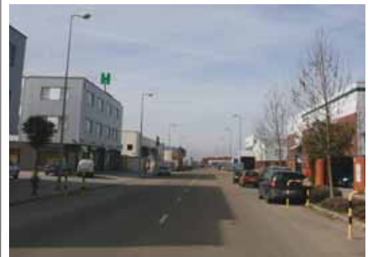
Una de las calles del polígono de La Mora en La Cistérniga.

Los supuestos autores de los robos alquilaban furgonetas y recorrian a diario los polígonos industriales y centros logísticos de transportes. Tras seleccionar la nave o el camión, accedían a éstos utilizando palanquetas u otros útiles para forzar sus cierres. Tras hacerse con el material seleccionado y después de cometer varios hechos, dependiendo del éxito obtenido, regresaban a sus domicilios, donde daban salida a toda la mercancía sustraída.