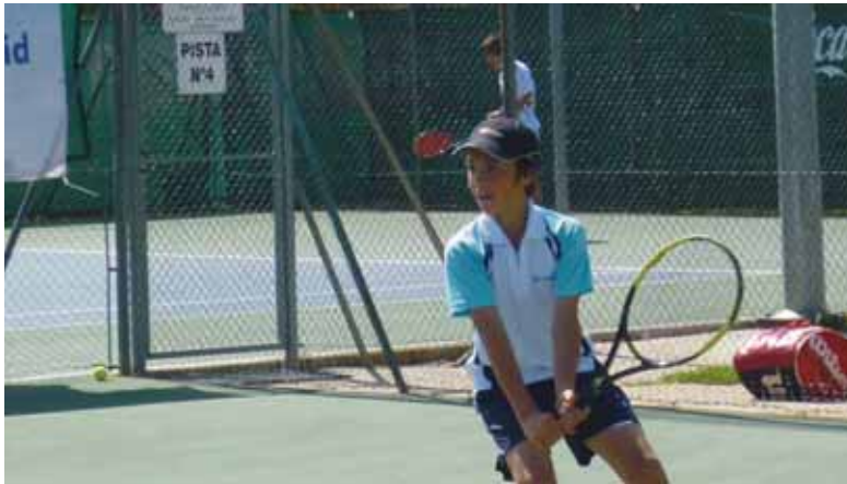
Las pistas de Covaresa acogen la final del Torneo Ciudad de Valladolid de tenis.

Prosiguen durante estos días las actividades deportivas programadas por el Ayuntamiento para la Feria de la Virgen de San Lorenzo