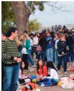
Jóvenes durante un botellón.

■ El lunes 13 de septiembre se acabó la tregua al botellón y se intensificará la vigilancia policial para erradicar el consumo de bebidas alcohólicas en la calle. Así lo anunció el alcalde de la ciudad, Javier León de la Riva. Después de las fiestas, en las que la Policía está haciendo la vista gorda, habrá otro nuevo intento de erradicar una práctica que ha supuesto que en el primer fin de semana festivo. Casi 50 jóvenes han sido hospitalizados durante estos días al hospital por intoxicaciones etílicas.