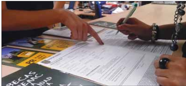
Una alumna de la UEMC solicita una Beca de estudios al formalizar su matrícula.

El adelanto en el inicio de las clases que trae consigo el Plan Bolonia en la práctica totalidad de centros universitarios españoles, y la coincidencia en fechas en Castilla y León con la convocatoria de septiembre de la PAU, conllevará a que numerosos estudiantes pierdan hasta 3 semanas de clase, entre las propias pruebas, la corrección de exámenes, las notas y el proceso de matrícula. Teniendo en cuenta la importancia que el nuevo marco europeo de estudios universitarios da a la asistencia a clase, la UEMC ha preparado