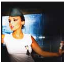
Lugar: Plaza Mayor