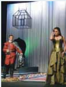
Un momento de la obra.