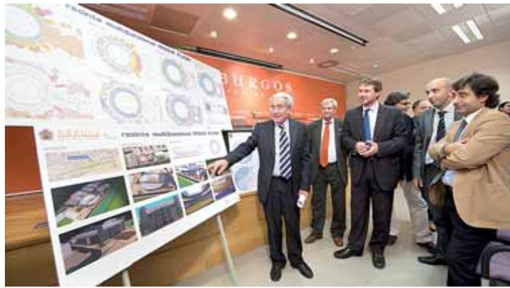
Responsables municipales presentaron el anteproyecto el 7 de octubre.

El encuentro incluye una segunda mesa redonda sobre aspectos deportivos del proyecto Arena Plaza, que estará modera-