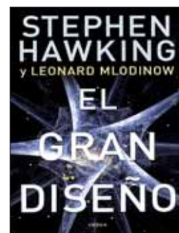
EL GRAN DISEÑO Stephen Hawking y Leonard Mlodinow. Ciencia.