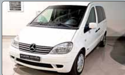
Mercedes Vaneo 1.7 CDI Año 2003. 95 cv. 4 airbags. Abs. Esp. Bass. Climatizador. Cierre centralizado. Mando a distancia. Elevalunas. Espejos eléctricos. RadioCD. Lunas tintadas.