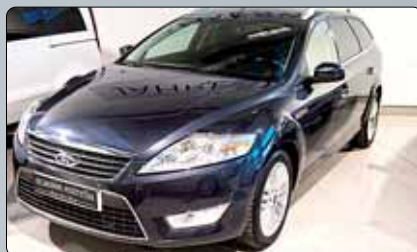
Ford Mondeo Wagon TDCI Año 2007. 10 airbags. ABS. ESP. Climatizador dual. Control de velocidad. Lunas tintadas. Cierre centralizado. Dirección asistida. Elevalunas. Espejos eléctricos y calefactados.