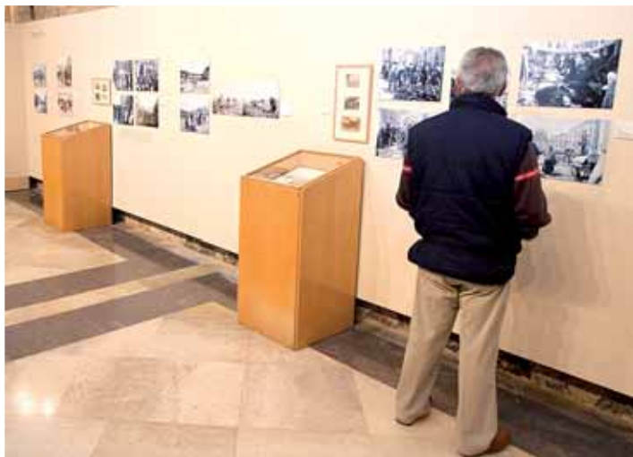
El conjunto fotográfico que se expone en el Monasterio de San Juan muestra un Burgos fácilmente identificable y otro prácticamente desconocido.