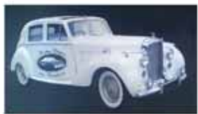
Coches Clásicos con Conductor