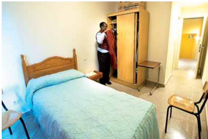
Añora su tierra, pero sobre todo a su familia y a sus hijos fallecidos.

“Ni el alcalde, ni el presidente autonómico saben de mí”