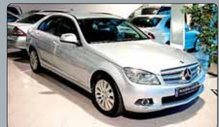
Mercedes Benz Clase C 220 CDI Elegance Año 2007. 170 cv. 10 airbags. ABS. ESP. Bass. Climatizador bizona. Espejos abatibles. RadioCD con MP3. Teléfono. Confort. T empomat.