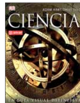
CIENCIA. La guía visual definitiva Adam Hart-Davis (Ed.)