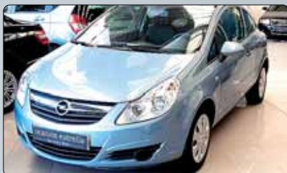
Opel Corsa 1.7 CDTI Esencia Año 2007. 8 airbags. ABS. ESP. Climatizador. Radio CD con MP3. Volante multifunción. Control de velocidad de crucero. Pintura metalizada.