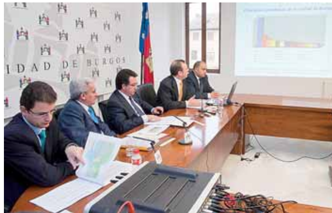
La presentación del estudio tuvo lugar en la UBU.

El estudio ofrece una visión detallada de la percepción que los ciudadanos tienen de la capital burgalesa y de los servicios y posibilidades que pueden encontrar en ella. De él, se desprende una valoración positiva de los servicios socio-sanitarios y culturales, altamente valorados por las 650 personas encuestadas; y un aprobado 'justito' en lo referente a circulación, tráfico