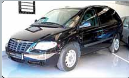
Chrysler Voyager 2.5 CRDI Año 2006. 4 airbags. ABS. Bass. Climatizador. Cierre centralizado. RadioCD. Lunas tintadas. Barras en el techo. Pintura metalizada.