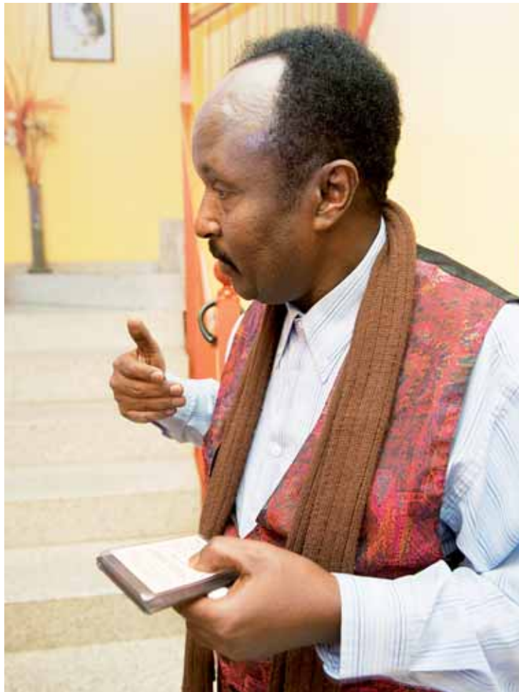
El diplomático somalí lleva un año viviendo en el albergue de Cáritas.

A.A. era la mano derecha del anterior presidente de Somalia y un reconocido pacifista