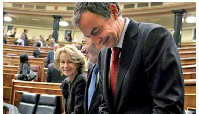
Zapatero, Pérez Rubalcaba y Elena Salgado en el Congreso

significativo", un incremento que a largo plazo el Ecofin cifra en un 6,7%. Dicho informe señala la reducción de la tasa de pobreza en España entre los mayores de 65 años, de los que más del 87% cuenta con vivienda en propiedad y la subida de las pensiones mínimas.