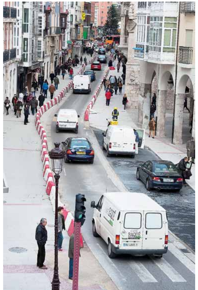
Hechas las aceras, toca actuar en la calzada, que será rebajada 40 centímetros.

Lacalle añadió que simultáneamente se aprovechará el corte al tráfico de la calle Santander para proceder al cambio del colector de aguas que se encuentra en la confluencia de Correos viejo y la Plaza del Cid con la esquina de la Diputación Provincial.