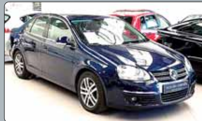
Volkswagen Jetta Año 2008. 10 airbags. ABS. ESP. Climatizador bizona. RadioCD con mp3. Llantas de aleación. Pintura metalizada.