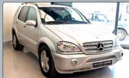
Mercedes ML 55 AMG Año 2003. 8 airbags. ABS. ESP. Climatizador. Navegador. Faros bixenon. Cuero. Navegador. Alarma. Brújula.