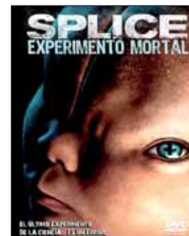
SPLICE Dir. Vincenzo Natali. Int. Adrien Brody, Sarah Polley. Ciencia-Ficción.