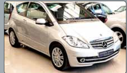
Mercedes Clase A 180 CDI Coupe Elegance Año 2009. 4 airbags. ABS. ESP. Tapicería mixta tela-cuero. Sensor de luz. Espejos abatibles. Llantas. Pre-ins talación de teléfono. RadioCD con MP3. 2 años de garantía.