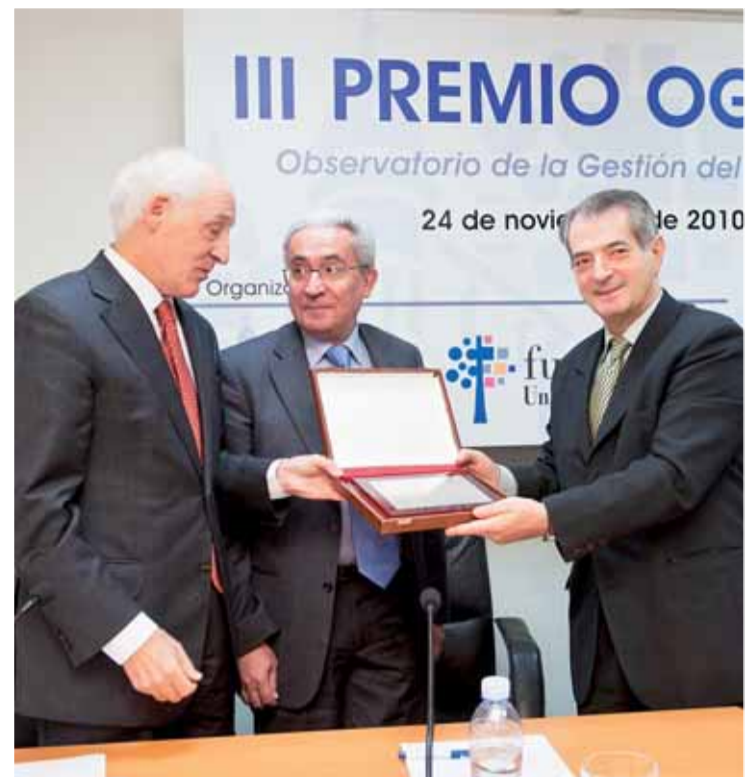
Regaño recibió el galardón de manos del presidente de FAE.

La tesis de Regaño pasa por considerar a la energía nuclear como una economía "segura y barata". La producción de la central desde que inició su explotación comercial ha superado los 121.800.000 millones de kilovatios, según informaron fuentes de la compañía.