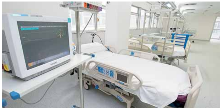
El centro estará dotado con las innovaciones tecnológicas más avanzadas.