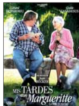
MIS TARDES CON MARGUERITTE Dir. Jean Becker. Int. Gérard Depardieu, Gisèle Casadesus. Drama