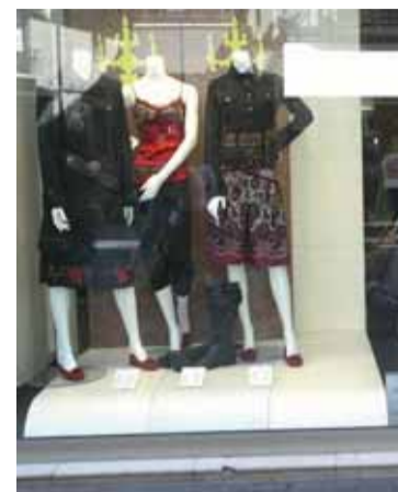
Escaparate de un comercio.

El Consejo Castellano y Leonés de Comercio ha propuesto la apertura autorizada de los establecimientos comerciales para el año 2011 de los siguientes domingos y festivos: 2 de enero, 3 de julio, 12 de octubre, 6 de noviembre, 4 de diciembre, 18 de diciembre y 26 de diciembre. En el Consejo se analizó la celebración del día de la Comunidad, 23 de abril, día no contemplado en principio como autorizable al coincidir con la celebración del sábado santo, ya que se producirían 4 días festivos seguidos.