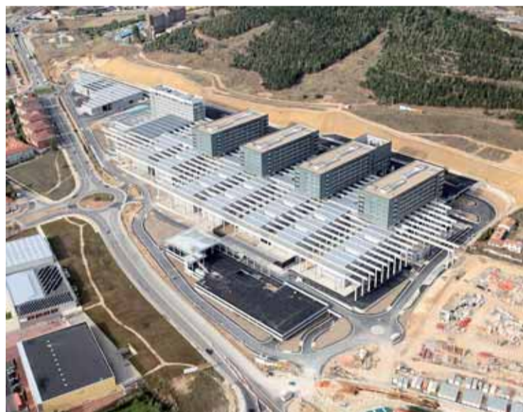
El nuevo complejo asistencial destaca por su gran dimensión.