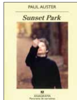
SUNSET PARK Paul Auster. Novela.