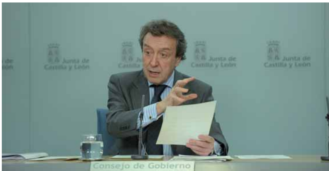
El consejero de la Presidencia y portavoz, José Antonio de Santiago-Juárez, durante la rueda de prensa.

El consejero de la Presidencia y portavoz dió a conocer que "también se destinarán 1.480.000 euros para una dotación de 14 vehículos todoterreno y 30 silos de sal". La finalidad de los 14 vehículos es la atención de la seguridad vial en las carreteras de titularidad de la Junta de Castilla y León, suministrando "al menos uno por provincia". Se trata de vehículos dotados con 5 plazas, tracción total y longitud aproximada 4,5 metros, mientras que los 30 silos de sal tienen la finalidad de hacer frente a las nevadas invernales.