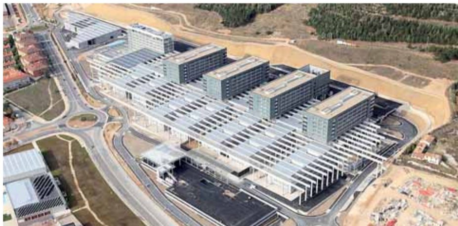
Vista aérea del nuevo complejo hospitalario de Burgos.

NUEVO HOSPITAL UNIVERSITARIO EL EQUIPAMIENTO DEL RECINTO HOSPITALARIO COMENZARÁ EN EL MES DE ENERO