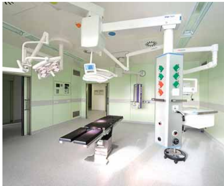
Los quirófanos incorporan un modelo de trabajo único en España.

VANGUARDIA Y COMODIDAD "Tecnología punta", que también se contempla en el área de reanimación, que alberga 39 puestos, diseñados a través de un sistema de módulos de cabecera en los que se incorporan las diferentes tomas eléctricas y de los monitores, de modo que el personal médico pueda moverse por la sala sin problemas de espacio. Modernidad y confort que también se notarán en las camas, calificadas por los responsables de la construcción del complejo como los "Rolls-Royce" de la medicina española, ya que permiten colocar al paciente en distintas posiciones, inclusive en posición vertical.