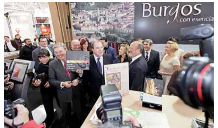
El presidente de la Junta visitó el stand promocional de Burgos.

man Foster; la visita al complejo minero de Puras de Villafranca en Belorado; la apertura de la casa del parque de las lagunas de Neila en la localidad del mismo nombre; el centro de interpretación de Félix Rodríguez de la Fuente en Pozza de la Sal y la señalización y puesta en valor de nuevos senderos como el GR-1006 sendero de los Monteros de Oña a Espinosa de los Monteros o el Camino de Santiago de la Vía de Bayona. Asimismo, se dará a conocer el turismo histórico que ofrece la ciudad romana de Clunia, con su singular teatro.