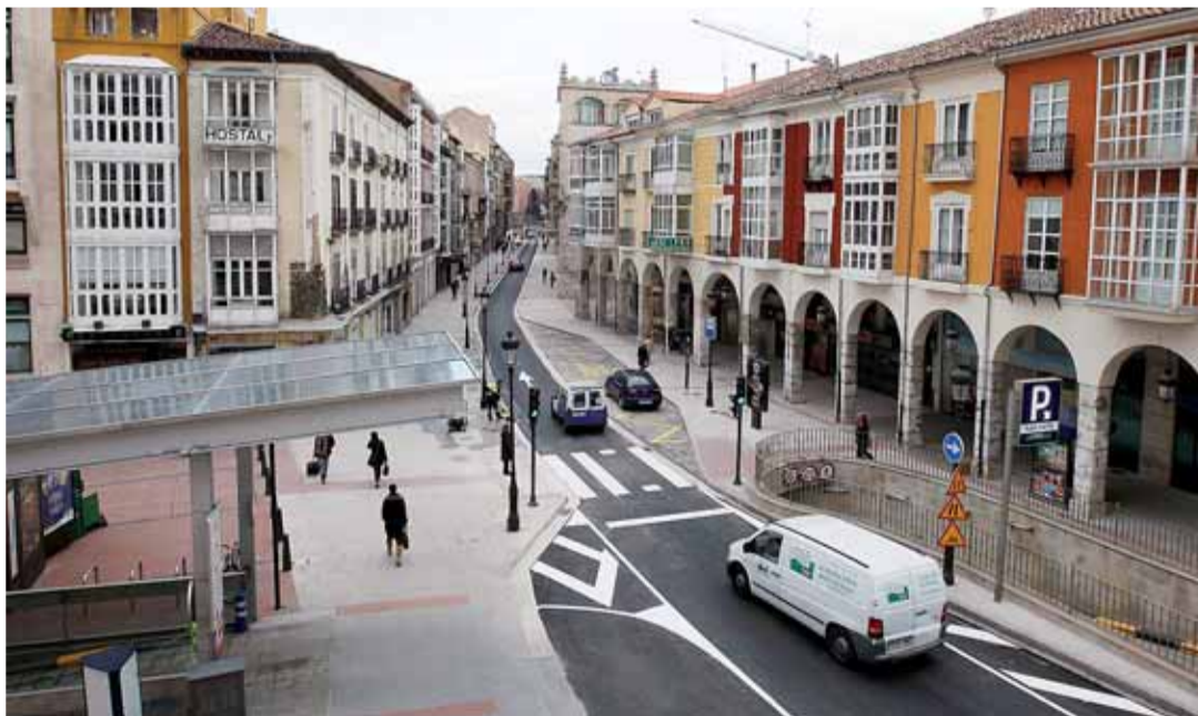
La nueva urbanización de la calle Santander triplica el espacio dedicado a los peatones.

Las obras de la calle Santander han permitido dotar a esta vía comercial del triple de espacio peatonal