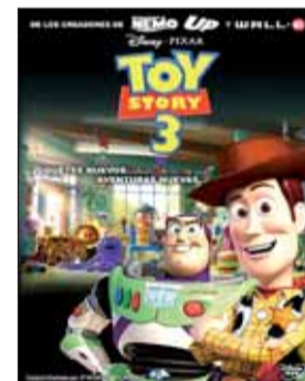
TOY STORY 3 3D Dir. Lee Unkrich. Int. Animación. Fantástico/Aventuras.