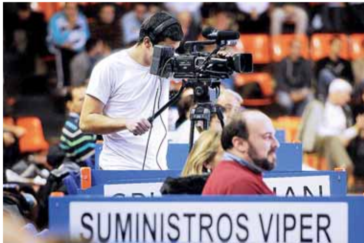
Autocid - León, segundo partido que retransmite gentetelevision.com