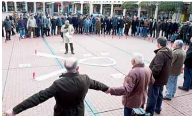
Bajo el lema 'El silencio nos hace cómplices' se celebró una Rueda de Hombres contra la violencia machista en la Plaza Mayor