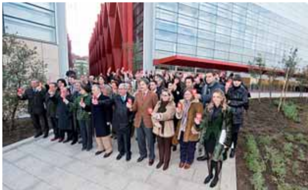
Representantes de la vida pública sacaron la tarjeta roja al maltratador el martes 23 frente al MEH.