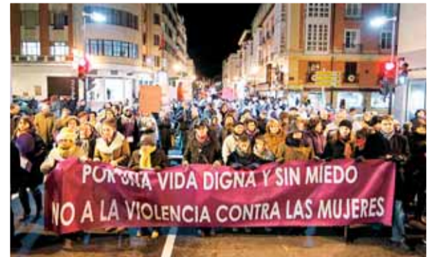
Una manifestación recorrió el día 25 el centro de la ciudad 'Por una vida digna y sin miedo'.