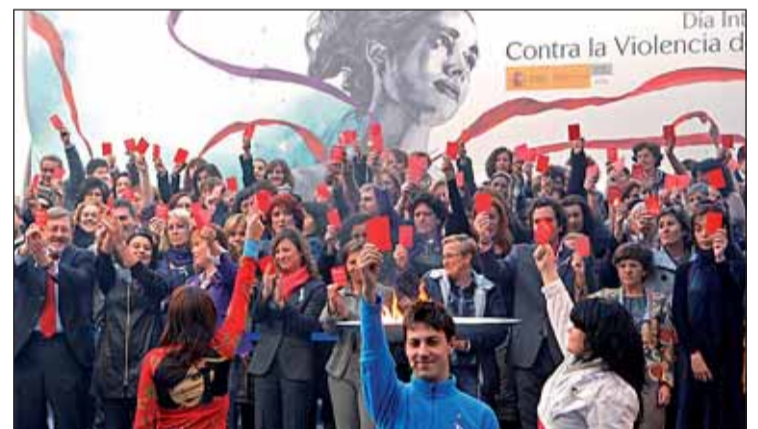
Acto en recuerdo a las 64 víctimas de la Violencia de Género

expresado la intención gubernamental de modificar el Código Civil para retirar la custodia de los hijos a los hombres que se encuentren "incursos" en cualquier delito de violencia de género, como el de amenazas, y no sólo a quienes ya han sido condenados. La propuesta también incluye medios para evitar que los asesinos condenados puedan heredar los bienes de sus víctimas. Y es que la violencia contra las mujeres es un problema enconado que se perpetúa con opiniones como la expresada por el 6% de los