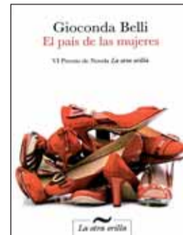
EL PAÍS DE LAS MUJERES Gioconda Belli. VI Premio de Novela La otra orilla.