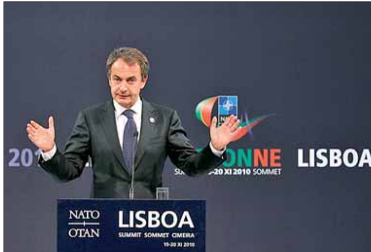
Rodríguez Zapatero en la cumbre de la OTAN de Lisboa

Es una reunión sin precedentes. Nunca antes un presidente del Gobierno había convocado al 'poder empresarial' para buscar alianzas en un espectro tan amplio de sectores, número y volumen de negocio. Los 30 nombres propios que lideran los negocios en España se reunirán en la Moncloa con José Luis Rodríguez Zapatero, este sábado, en una cita que busca movilizar la inversión privada. El Gobierno ha señalado que el encuentro propone trabajar con los máximos representantes de la energía, la distribución, la banca, el turismo o las telecomunicaciones de nuestro país en la apertura de nuevos mercados exteriores, misión en la que el Ejecutivo actuaría como 'puente'. Todo con la mira