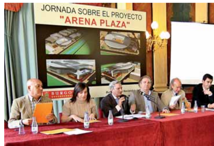
Los implicados en la materia se reunieron el jueves 25 para debatir.

El tiempo apremia y el Consistorio quiso compartir una jornada con representantes de los ámbitos mencionados que, según manifestó el concejal de Fomento, en declaraciones a Gente en