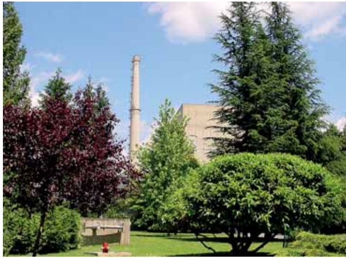
La central de Santa María de Garoña podría cerrarse en 2013.

El Colegio de Economistas ha elaborado un 'Plan de dinamización económica en la zona de influencia de la central de Garoña', en el que se hace balance de las actuaciones que se han llevado a cabo en el último año en la comarca. De él se extrae que se está realizando una inversión "importante" a nivel empresarial y de infraestructuras, capaz de mantener la economía del entorno, aunque no se detalla el nivel