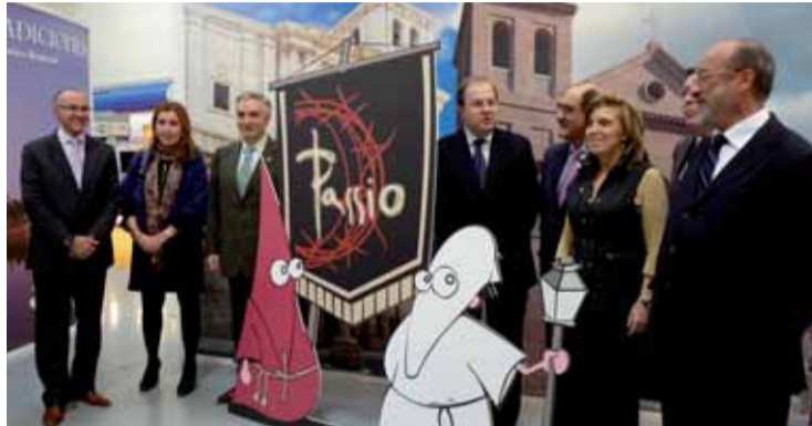
El presidente Herrera durante la inauguración de INTUR.

INTUR consolida los programas ya creados al contar con 120 mesas de trabajo en Intur Negocios y 50 expositores en Intur Rural y Stock de Viajes. En el apartado internacional se ha experimentado un espectacular aumento al contar con 26 stands de operadores, regiones, municipios y ofi-