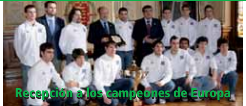
Recepción a los campeones de Europa

El Ayuntamiento recibió a la plantilla del CPLV Dismeva, flamante campeón de la Copa de Europa conquistada en Anglet (Francia).