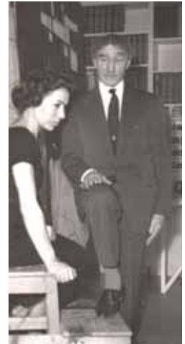
Una de las fotografías expuestas.

apariciones en el cine como las películas Castilla en fuego (1960) y Con el viento solano (1966) dirigida por Mario Camus.