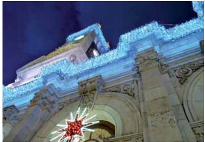
La iluminación navideña del Ayuntamiento destaca en la Plaza Mayor.

El programa municipal de este año será solidario con Unicef y el Banco de Alimentos