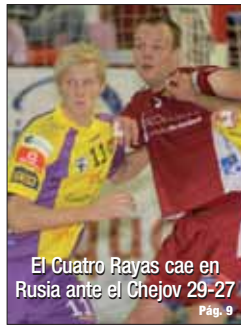
El Cuatro Rayas cae en Rusia ante el Chejov 29-27 Pág. 9

Número 326 - año 7 - Del 3 al 9 de diciembre de 2010 - TELÉFONO ANUNCIOS CLASIFICADOS 807 51 70 23