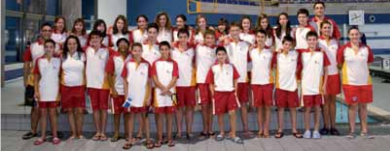
Selección de Castilla y León que participará en el Campeonato Nacional de salvamento.