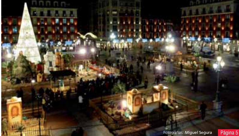
Página 5

Valladolid ya luce su imagen más navideña. 73 calles de la ciudad estrenan iluminación de tipo LED, que permitirá un gran ahorro respecto a otros años. Además, el programa municipal de este año, que tendrá medio millar de actividades, será solidario con Unicef y el Banco de Alimentos. La Plaza Mayor volverá a ser el centro neurálgico con el tradicional Trineo Navideño, Tío Vivo y el Árbol de los Deseos.