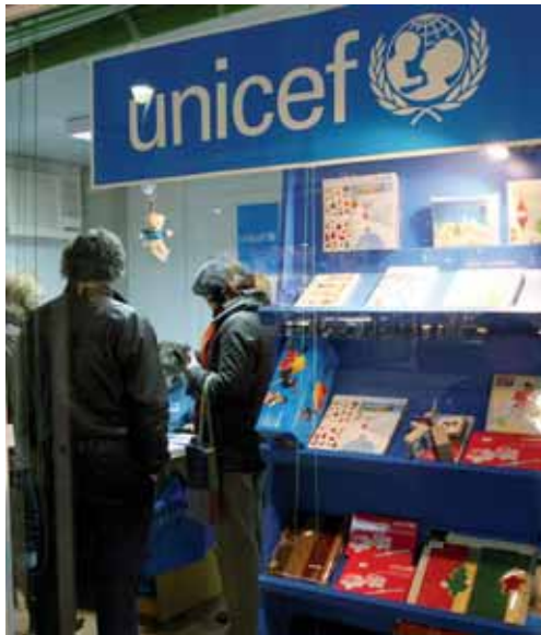
Uno de los típicos puestos de venta de tarjetas navideñas.

En cuanto a la duración de la jornada, López comenta que "aunque hay un poco de todo" lo "normal" es que los contratos temporales de Navidad sean de 40 horas semanales. "Durante el resto del año las contrataciones vinculadas a la promoción suelen hacerse para viernes por la tarde y sábados, cuando más tráfico de clientela hay en los comercios. En cambio en Navidad son trabajos que se llevan a cabo todos los días, de lunes a domingo, con sus respectivos descansos, lógicamente",