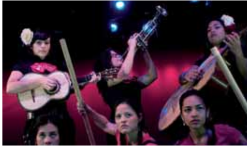
Una de las escenas de la representación.

Para la vallisoletana el objetivo es cargar de un matiz pedagógico y contemporáneo el texto clásico. "Ciudad Juárez es una escandalosa Fuente Ovejuna", afirma la directora, que confiesa su interés por la realidad del papel que juega la mujer en la ciudad mexicana. "Ciudad Juárez, como en su día Fuente Ovejuna, simbolizan no sólo el recono-