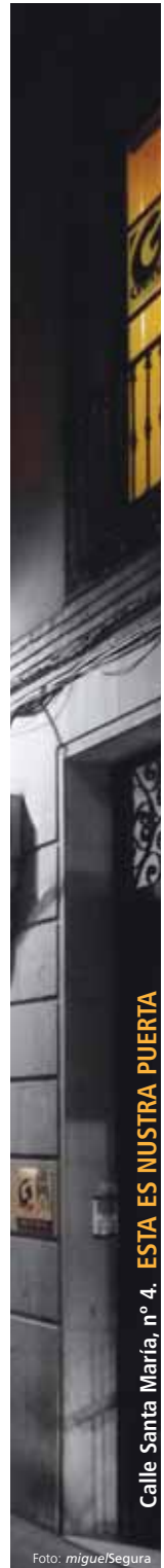
Calle Santa María, nº 4. ESTA ES NUESTRA PUERTA