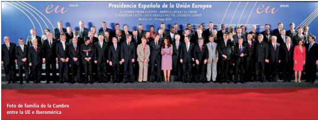
Foto de familia de la Cumbre entre la UE e Iberoamérica