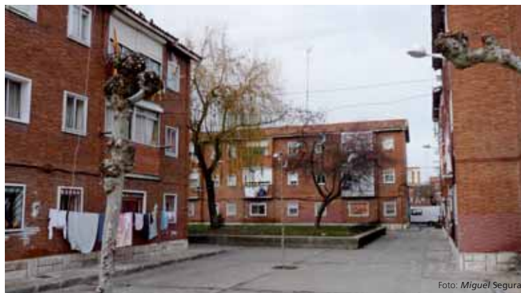
Las viviendas situadas en el cruce de calle Águila y Cuclillo forman parte del ARU del 29 de octubre.

En primer lugar, este ARU (Área de Renovación Urbana) contemplará una reducción de 850 a 712 el número de viviendas a construir el nuevo barrio, frente a las 570 actuales. El plan es construir edificaciones de más alturas con el fin de ampliar las zonas dotacionales. Es decir, mejorar la calidad de vida de los vecinos de ese entorno de Pajarillos, ofreciéndoles unas viviendas que se adaptan a