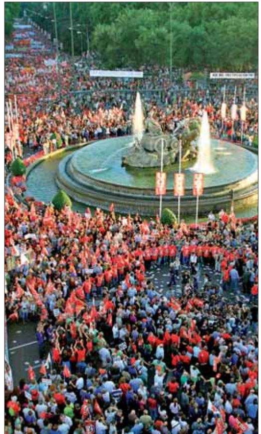
LA VOZ DISIDENTE La aprobación de la reforma laboral, mediante Real Decreto, quebró las conversaciones entre Gobierno y sindicatos, sacando a las calles de las principales ciudades a ciudadanos descontentos por la pérdida de derechos laborales. Muchas voces piden una segunda huelga.

Mientras, en aguas no menos revueltas, Díaz Ferrán intentaba evitar el naufragio de su mandato como presidente de la CEOE. Pero la oleada de denuncias por impago interpuestas por los trabajadores de sus empresas en quiebra, el embargo de sus bienes y su imputación por corrupción en el caso Mar Blau, ahogaron los días de Díaz Ferrán al mando de la patronal y originó una convocatoria anticipada de elecciones, que ha erigido como sucesor a Juan Rosell.