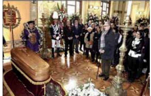
Capilla ardiente de Miguel Delibes instalada en el Ayuntamiento.

Durante diez horas fue continuo el desfilar de miles de ciudadanos por la Capilla Ardiente instalada en el Ayuntamiento de