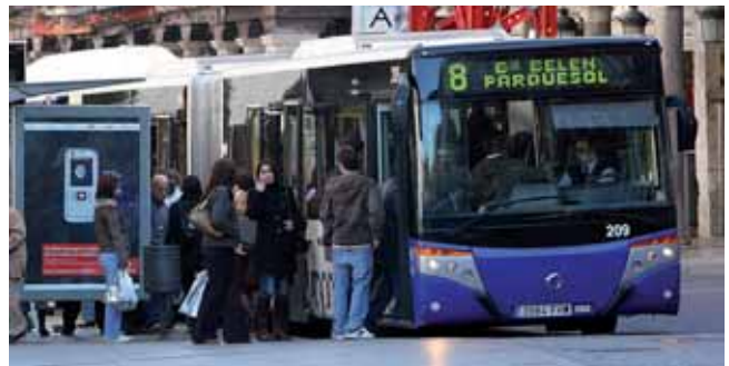
Los vallisoletanos tendrán que hacer más cuentas para llegar a final de mes.

Los parados vallisoletanos de larga duración verán como el Gobierno les suprime la ayuda de los 426 euros