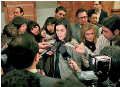
La ministra de Cultura, Ángeles González Sinde

El emplazamiento del nuevo Almacén Temporal Centralizado de Residuos Nucleares está resultando más difícil de lo previsto, ya que la ciudadanía no está dispuesta a aceptar los riesgos que conlleva un almacén de ese calibre y a donde irían a parar los residuos radiactivos de todas las centrales nucleares del país. La candidata con mayores posibilidades sería Ascó, en Tarragona. Otro de los temas controvertidos del año es la nueva Ley del Aborto, que se aprobó el 4 de