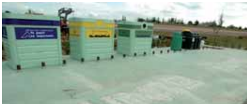
Uno de los múltiples 'Puntos Limpios' distribuidos por la provincia.

La Diputación presta el servicio de recogida selectiva de papel-cartón, vidrio y envases ligeros multimateriales en la provincia de Valladolid, excluida la capital (en Laguna de Duero la Diputación sólo recoge envases), constando este servicio en la recogida de todos los más de 3.291 contenedores específicos desplegados para este tipo de materiales, y el traslado de estos residuos hasta los recuperadores/recicladores de papel-cartón y hasta las plantas de tratamiento (vidrio y envases ligeros multimateriales).