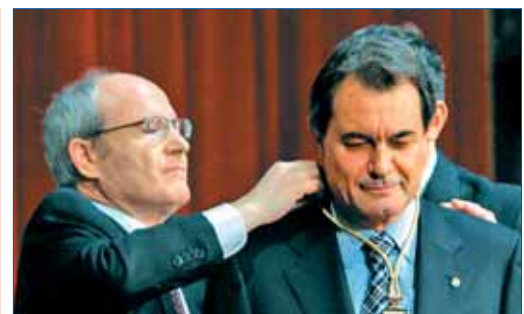
Montilla en el acto de investidura de Artur Mas como president

que hasta ahora formaba el Gobierno tripartito, Esquerra Republicana e ICV. Los sondeos quedaron confirmados en las urnas y CiU logró una amplia victoria con 62 diputados frente a los 18 alcanzados por el PSC. Artur Mas se convirtió así en el nuevo president de la Generalitat tras una campaña marcada por el papel activo jugado por los líderes políticos estatales, como Zapatero y Rajoy que apoyaron con su presencia a sus candidatos, así como por la alta carga erótica de la estrategia publicitaria de la mayoría de las formaciones, aderezada por polémicas como