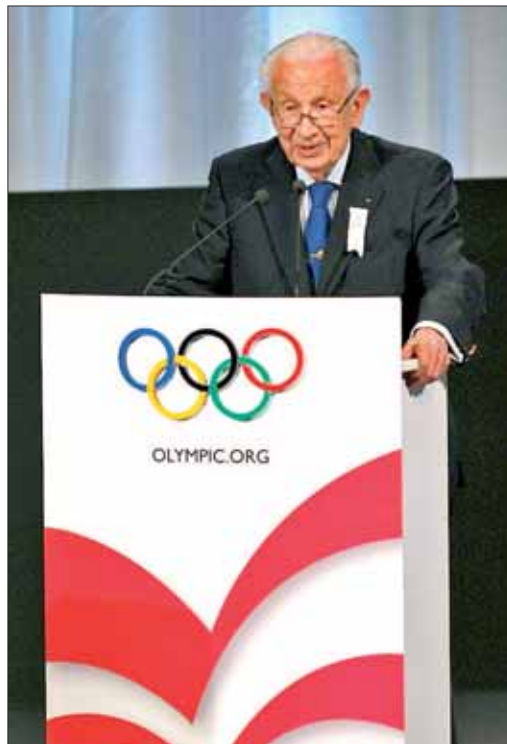
Juan Antonio Samaranch nos dejó el pasado mes de abril

Igualmente, 2010 se ha erigido como el año en el que cayó la imagen de un mito, el profesor Neira, quien sufrió una recaída de salud varios días después de que fuera hallado sin vida el