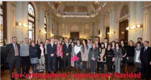
Los 'embajadores' regresan por Navidad

TODA LA INFORMACIÓN EN WWW.REVALLADOLID.ES