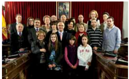
Foto de familia del presidente de la Diputación con los premiados.

Por eso, indicó que antes de que estos futuros creadores se topen con el desánimo y sus aspiraciones se vean frustradas, es "justo" que dispongan de espacios donde exhibir su trabajo y que és-