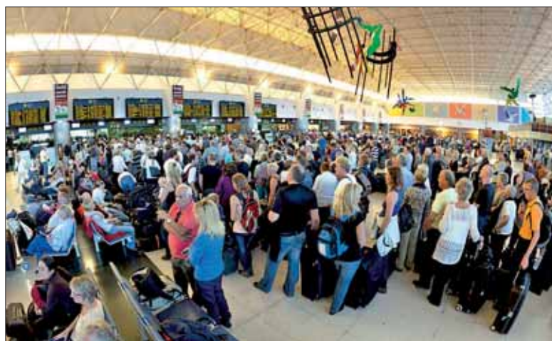
Centenares de afectados por el conflicto de los controladores aéreos

El 2010 también ha sido un año convulso para el tráfico aéreo. Los temporales de nieve y frío de principios de año fueron sólo el comienzo de los retrasos y cancelaciones en los aeropuertos españoles, que tuvieron uno de sus momentos más complicados en abril y mayo. La nube de cenizas volcánicas suspendidas en el atmósfera europea tras la erupción el pasado 20 de marzo del Eyjafjallajökull en Islandia supuso la cancelación de cerca de cien mil vuelos que afectaron a 1,2 millones de viajeros del continente. El sector turístico español cifró en más de 250 millones de euros las pérdidas económicas ocasionadas por el volcán, mientras las aerolíneas aseguraron haber perdido más de 1.200 millones de euros. Pero las in-