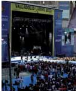
Escenario del Latino 2010.

■ Durante este año Valladolid ha vuelto a ser la capital nacional de la música. Pocas ciudades pueden presumir de haber albergado conciertos de Alejandro Sanz, BB King, Sabina, Estopa, Fito, Paco de Lucía, Alejandro Fernández o El Barrio. Además, el Valladolid Latino congregó en el estadio José Zorrilla a más de 20.000 personas con un cartel con nombres en mayúsculas como Paulina Rubio, Chayanne y David Bisbal. Un éxito más de un concierto que se afianza cada año.