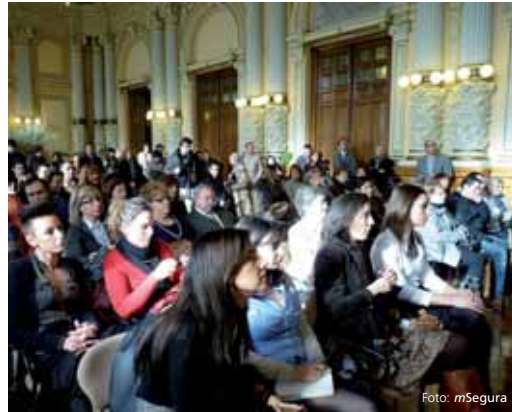
El Ayuntamiento acogió la gala de entrega de premios.

Además hubo otros 30 premios valorados en 400 euros cada uno.