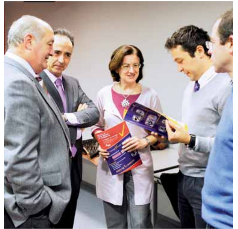
Representantes de las instituciones organizadoras presentaron el día 9 la 2ª jornada Pl@y en la UBU, que se celebrará el día 22 de diciembre.