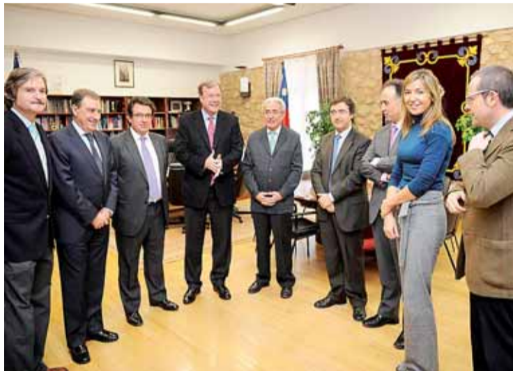
Representantes de la Junta, UBU y Ayuntamiento, en la reunión del día 9.