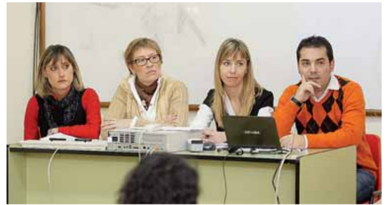
Los cuatro alumnos del máster, durante la presentación del proyecto.

ser los directivos quienes comuniquen sus planes a los empleados para que no surja miedo al despido u otro tipo de situaciones que pueden alterar la vida del trabajador". Asimismo, resulta crucial que el trabajador entienda que el empresario vela por él.