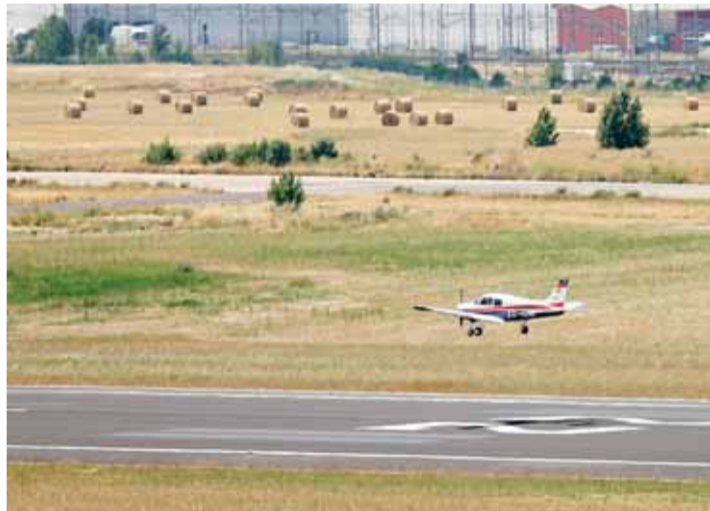
La ampliación de la pista de vuelo tiene un coste de 32 millones.

Rico adelantó que, el lunes 13, "los senadores populares instarán a Fomento para que evalúe la necesidad y comience la tramitación administrativa de cara al 2011. En la misma línea, el parti-