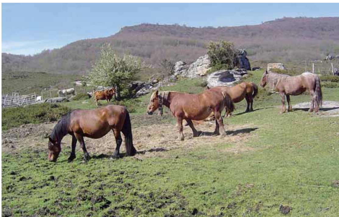
La raza equina Hispano Bretón es autóctona de Castilla y León y está en peligro de extinción.