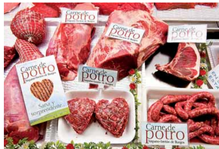
Nueve carnicerías en Burgos venden ya carne de potro Hispano Bretón.

La Hispano Bretón se localiza, principalmente, en la provincia de Burgos, en la zona de Merindades, Sierra de la Demanda y Villadiago y comarca. En las zonas montañosas donde reside, realiza una labor de aprovechamiento de los recursos vegetales existentes, que de otra forma se perderían, contribuyendo así al mantenimiento del ecosistema en los pastos de montaña. Esta raza atenúa el riesgo de incendios al mantener los pastos desbrozados.